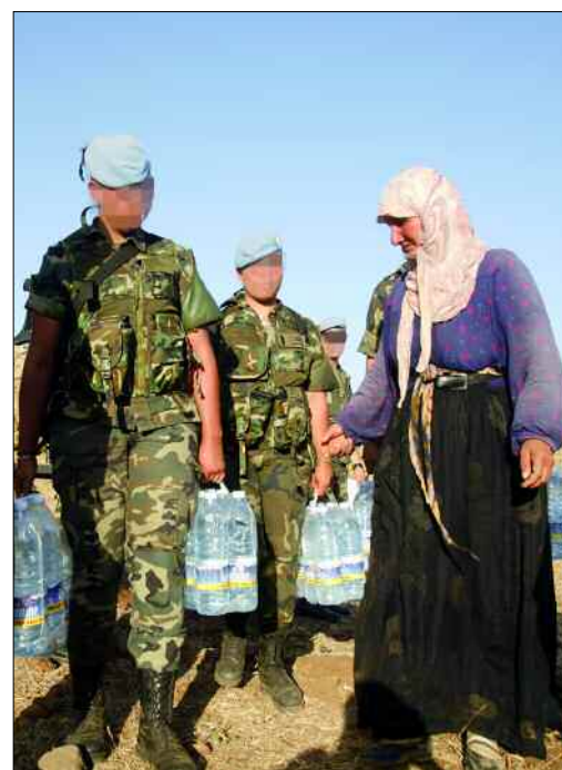
Los campamentos sirios han recibido agua y alimentos en varias ocasiones

El último paso es dar visibilidad al trabajo, mediante un acto de inauguración en el que se anima a participar a autoridades y vecinos, y donde se reciben muestras de agradecimiento de la población.