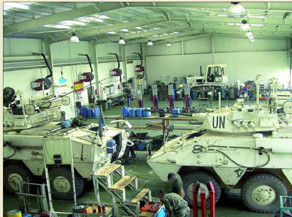
El plan contempla el mantenimiento integral de los sistemas de armas

Por eso, el Estado Mayor del Ejército, con la colaboración de los mandos de primer nivel y dirigido por la División de Lo-