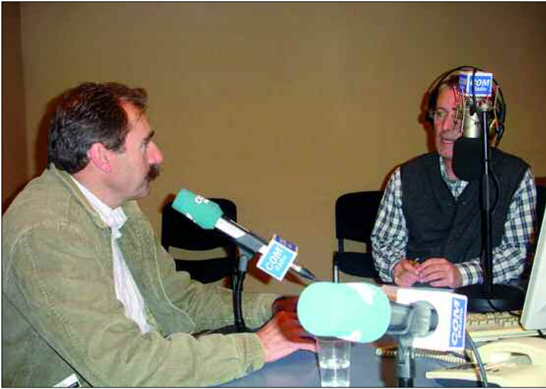
Las emisiones radiofónicas se reanudarán después del verano