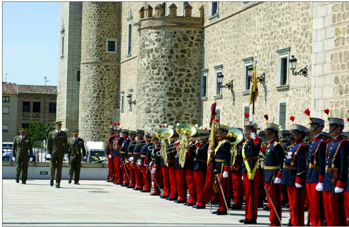
La explanada de la fachada este del Alcázar fue escenario de la rendición de honores militares al Príncipe

El Museo del Ejército ha iniciado una nueva etapa después de años de intenso trabajo y dedicación para lograr el perfecto acondicionamiento de su nueva sede, el Alcázar de Toledo, y el traslado de todas las piezas que componen la colección. Atrás quedan ya las dificultades que apartaron el proyecto hasta en dos ocasiones —la primera vez, en 1929, y, más tarde, en la década de los 60 del siglo XX—, además de las que surgieron tras su aprobación definitiva en 1996, como el hallazgo de importantes restos arqueológicos durante las excavaciones. Para todas ellas se ha encontrado solución, lo que ha contribuido a aumentar la calidad de su oferta cultural, cuyo máximo exponente son las 6.500 piezas que componen la exposición permanente. Visto el resultado, la espera ha merecido la pena, aunque ahora tendrá que ser el público el que juzgue. Pág. 3