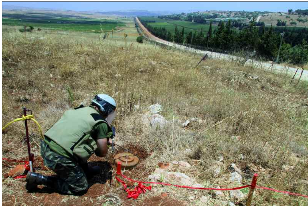
Momento de la remoción de una mina anticarro junto a la technical fence en Aytarum