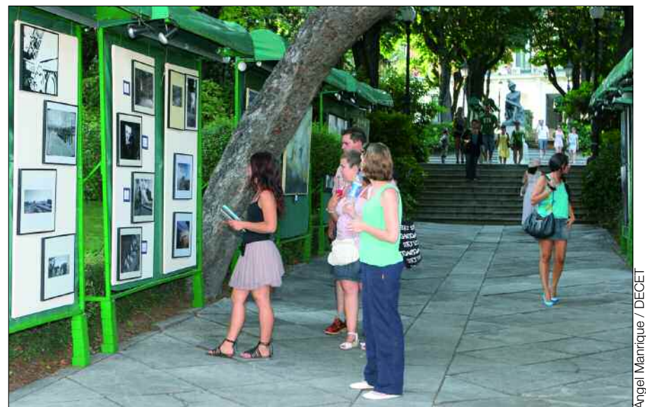
Angel Manrique / DECET

La Unidad de Música del Mando de Fuerzas Pesadas, con sede en el acuartelamiento "Diego Porcelos" de Burgos, ofreció el 10 de julio un concierto en la Plaza Mayor de la localidad burgalesa de Peñaranda de Duero, dentro del ciclo organizado en colaboración con la Diputación Provincial. El concierto contó con una gran asistencia de público y autoridades, tanto civiles como militares, y el programa consistió en marchas, zarzuelas, pasodobles y bandas sonoras.