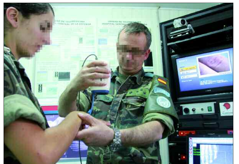
La unidad de telemedicina permite hacer diagnósticos con España

Donde también manejan pipetas es en el laboratorio de combustibles de campaña de la Unidad de Helicópteros. Antes de llenar los depósitos, comprueban que está en perfectas condiciones y que no