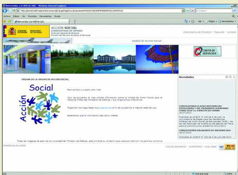
En el portal de acción social se pueden consultar todas las ofertas

En cuanto a los parques temáticos y otros lugares en los que se desarrollan actividades de ocio, se pueden obtener descuentos del 30% en Faunia y Madrid SnowZo-