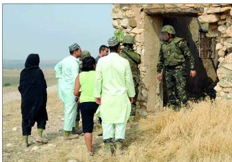
En las situaciones se cuidan detalles como la indumentaria

El ritmo de actividad en esas jornadas fue frenético, ya que prácticamente cada hora se produjo una incidencia distinta. Enfrentamientos verbales, manifestaciones o cazadores violando los límites de la Línea Azul (la frontera establecida por Naciones Unidas entre el Líbano e Israel tras la gue-