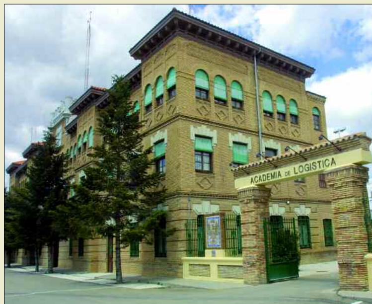
La Academia de Logística disfruta ya de un mantenimiento integral

En cuarto lugar, como se emplean unos criterios únicos para la elaboración de los pliegos de prescripciones técnicas, aumenta la especialización del personal encargado y se pueden establecer comparaciones entre