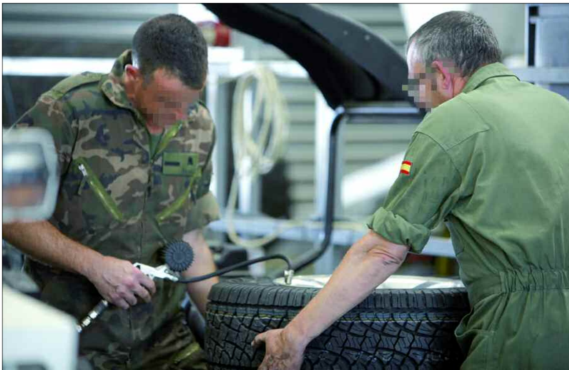
Los especialistas del taller trabajan a destajo para que todos los vehículos estén en perfectas condiciones

La contribución del personal que trabaja en la base es necesaria para la buena marcha de la misión