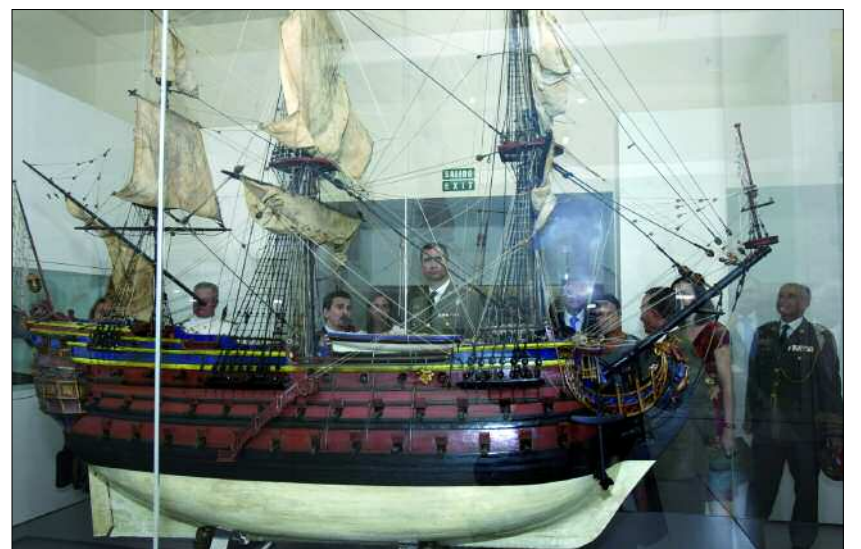
El Heredero visitó algunas de las salas del Museo

Del mantenimiento y conservación de todas las piezas se encarga el personal de los cuatro talleres de restauración que se ubican en el nuevo edificio,