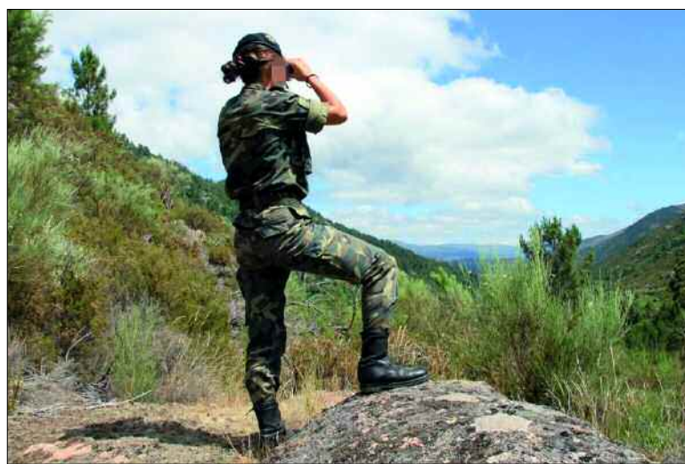
El Ejército de Tierra realizará tareas de vigilancia en Galicia

En la de Fusil Libre 3x40, el sargento Checa también logró ser subcampeón de España, seguido del sargento primero Pascua, con quien resultó empatado a puntos.