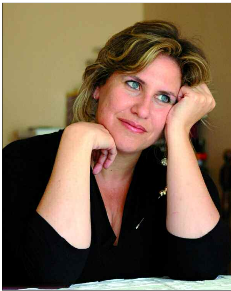
La periodista ejerció como reportera durante quince años

que ver con la religión. Mientras la religión es lo más real — religare es «vincular con el origen»—, la ideología trata de lo teórico. Todos estos conflictos se basan en una construcción cultural.