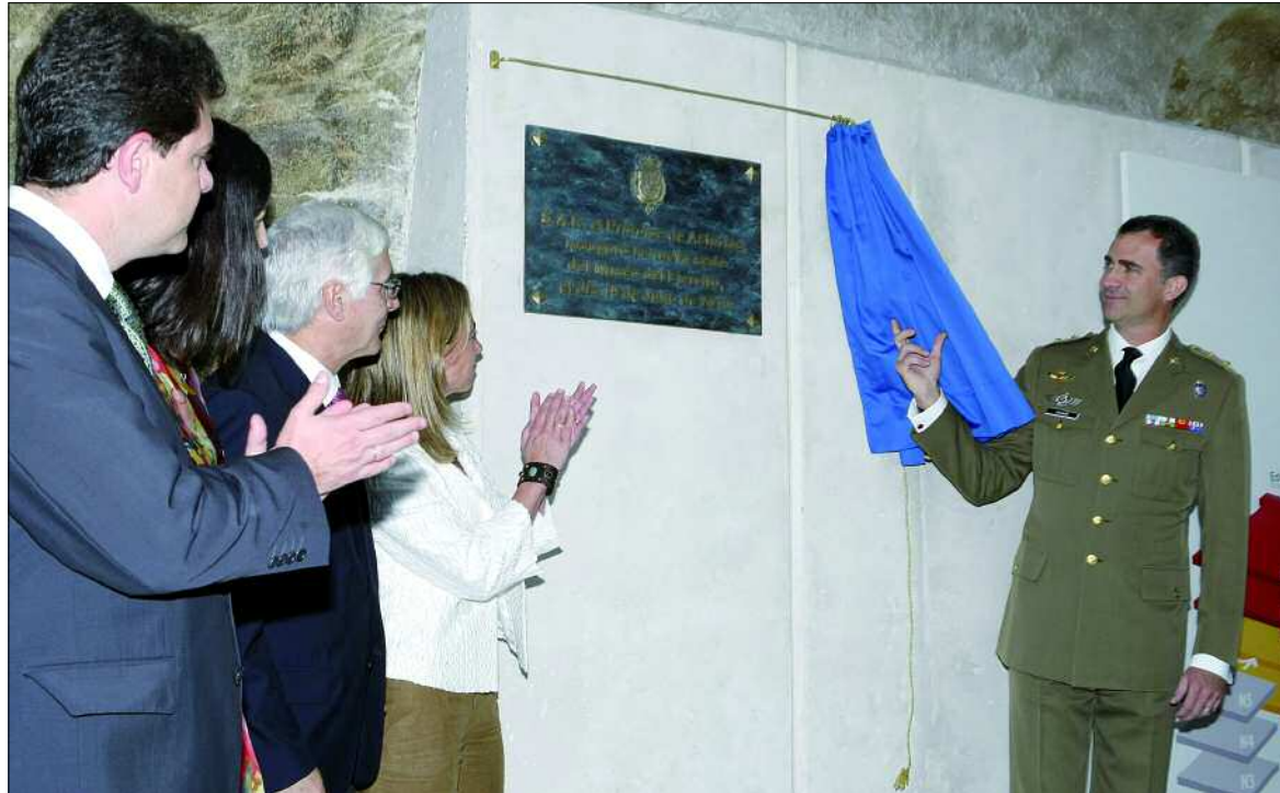
Don Felipe descubre una placa ante las dos ministras, el presidente manchego y el alcalde de Toledo

El auditorio del nuevo edificio acogió el acto inaugural, que comenzó con la intervención del general de ejército Coll, quien calificó este día como «grande y extraordinario» por ser el de la culminación de muchos años de preparación y de trabajo. El director del Museo, general Izquierdo, se mostró satisfecho con el resultado del traslado, que ha permitido mejorar su continente y contenido. Ahora se dispone de más espacio para las piezas, de más y más modernos medios y se cuenta con el apoyo de las nuevas tecnologías. Además, ha nacido una nueva idea en el plano conceptual, más cercano a las nuevas tendencias de discurso histórico y