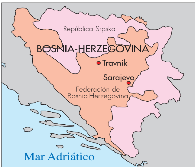
Travnik se encuentra a 90 kms. al noroeste de Sarajevo

La unidad española, por ser la asesora de los miembros del Cuartel General de las Fuerzas Armadas de Bosnia-Herzegovina, coordinará al resto de los MTT que, en un futuro, trabajarán en el país. Siempre actuará en coordinación con el Cuartel General de la EUFOR (Fuerza Europea) en Sarajevo, del que también dependerán los equipos de los otros países. Esta nueva misión no ejecutiva tendrá una duración de, al me-