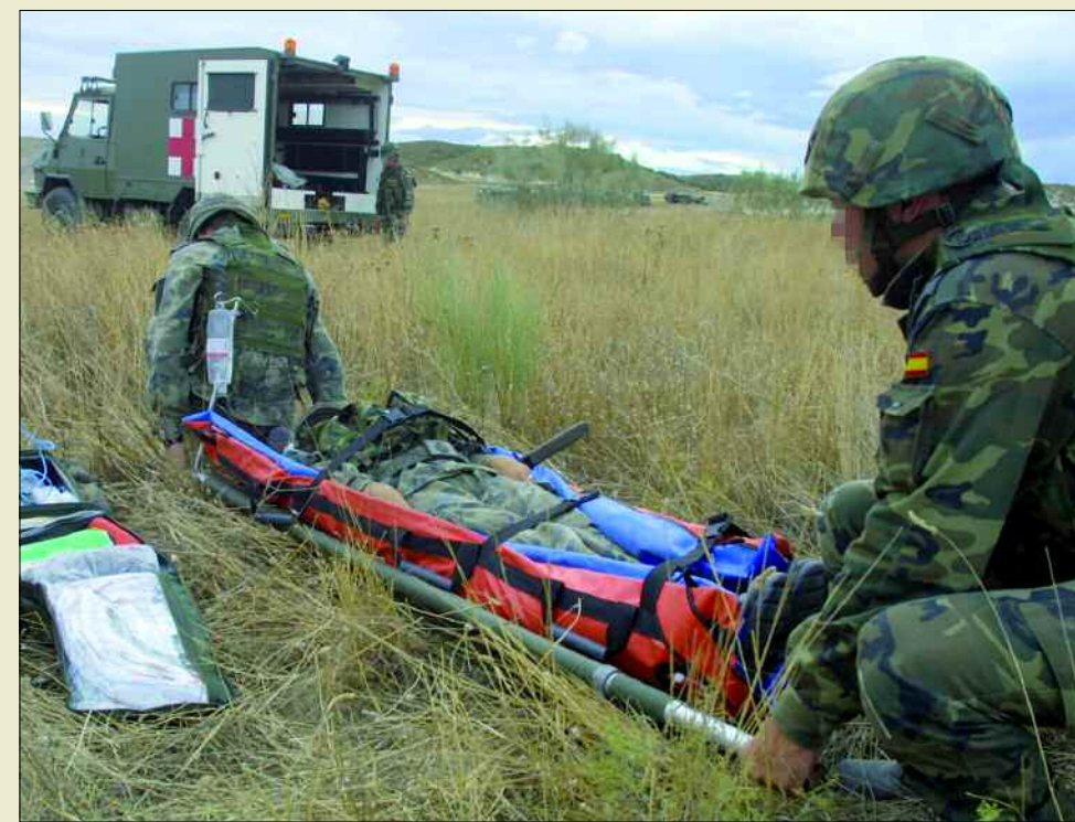
La importancia de la sanidad se redoblará en las unidades de combate

La “trazabilidad” de los recursos es una realidad. Mediante dispositivos electrónicos se puede conocer en todo momento dónde se encuentra el abastecimiento para facilitar su gestión (si ha salido de territorio nacional, si está llegando ya a zona de operaciones, etc.)