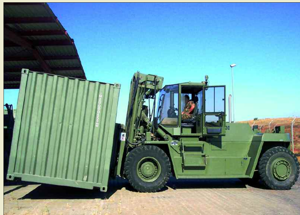
Se implanta el uso de contenedores para la transferencia de cargas

Como consecuencia, hay capacidades logísticas que pueden ser total o parcialmente centralizadas en unidades logísticas, liberándose así de una “carga” a las unidades de combate y de apoyo al combate, pudiéndose éstas centrar en su actividad fundamental: combatir o apoyar la maniobra. En las unidades logísticas se aplicará el concepto “adestrarse como se va a combatir” en el quehacer diario (en el acuartelamiento o cuando se hagan maniobras o cualquier tipo de adiestramiento, la estructura operativa y los procedimientos que se utilizarán serán lo más parecidos posible a los que se utilizarían en operaciones reales).