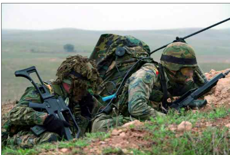
La BRILAT realizó varios ejercicios de preparación para el Battle Group

Durante el segundo semestre del año, varias unidades del Ejército de Tierra permanecerán preparadas para desplegar en cualquier parte del mundo en un corto espacio de tiempo, en el caso de que las estructuras militares de respuesta rápida de la Unión Europea —el Battle Group — o de la OTAN —la NRF— pusiesen en marcha una operación. Pág. 5