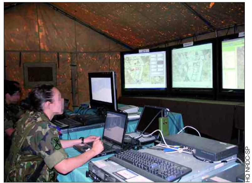
Las unidades españolas tienen certificadas sus capacidades

Bajo su mando tiene disponible un paquete de fuerzas formado por unidades de combate, de apoyo al combate y elementos de apoyo logístico, equivalentes a unos 2.400 militares, preparados para acudir a cualquier zona de conflicto o crisis en que fuese ne-