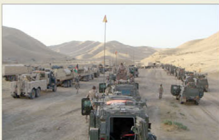
El OMLT participó en dos grandes convoyes que salieron de Herat

Especial importancia tuvieron dos convoyes —de 19 y 14 días de duración, respectivamente—, formados cada uno de ellos por un total de entre 120 y 150 vehículos (la columna llegaba a extenderse a lo largo de 10 km). «Durante el segundo convoy —explica el teniente coronel—, uno de nuestros RG-31 pisó un plato de presión, con la consiguiente activación del IED. El vehículo sufrió daños, pero aguantó lo suficiente como para proteger a la tripulación».