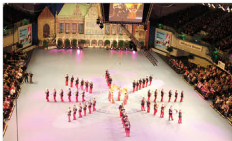
La cancha decorada del estadio de Bremen fue escenario del festival

Se realizaron seis pases —entre el 25 y el 31 de enero—, y el resulta-