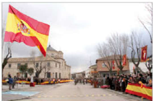
La población vitoreó al Ejército de Tierra

Por otro lado, un grupo de alumnos de Educación Primaria