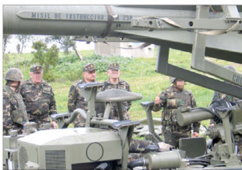
El JEME pudo comprobar el buen estado de los materiales

El periplo del JEME por tierras gaditanas se completó, al día siguiente, con su presencia en el acuartelamiento "Camposoto" (San Fernando). Allí se encuen-