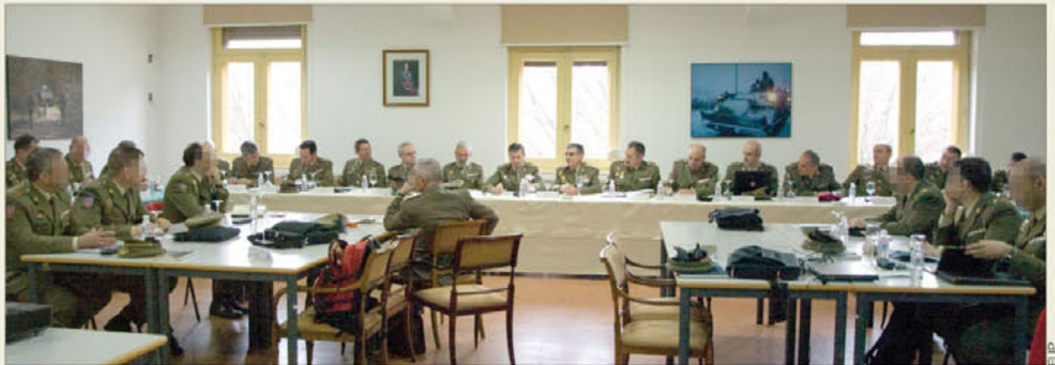
El Cuartel General de las Fuerzas Pesadas, en Burgos, es el escenario elegido para las sesiones de trabajo de este año

Durante estas jornadas, se ha puesto de manifiesto la necesidad urgente de completar las webs de unidades en Internet y la utilidad de una planificación, en las relaciones públicas, que oriente al Ejército hacia sus audiencias-objetivo. Para los representantes del SICOM es importante, de igual modo, reforzar la idea de "comunicación global" y de que "todo comunica"; no sólo las estrategias y productos de comunicación en sí mismos, sino también la imagen corporativa y la de los propios militares, el marketing , las relaciones públicas y el protocolo.