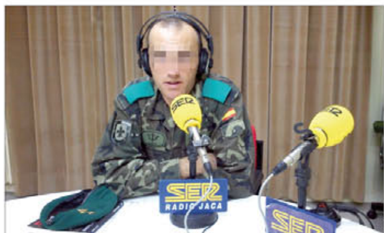
El teniente coronel afirma sentirse cómodo ante el micrófono

del colegio público Sagrados Corazones, de Escalonilla (Toledo), visitaron las instalaciones de la Academia de Infantería y pudieron presenciar un ensayo de la Música.