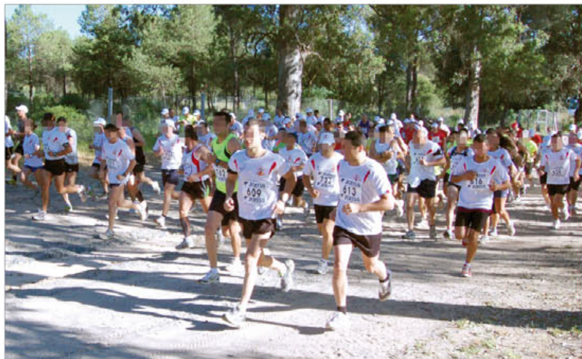
La organización de eventos deportivos es una de las iniciativas que respalda la campaña

Para contribuir a reducir su incidencia entre el personal militar, la Fuerza Terrestre puso en marcha en 2010 la campaña Militar, modelo de ciudadanía . Una iniciativa que viene a sumarse a otras, como el Plan Antidroga del Ejército (PADET), en un esfuerzo conjunto de disminuir la repercusión de estas tendencias, que en 2010 se ha traducido en un descenso de un 27% en las intervenciones policiales o judiciales con relación a