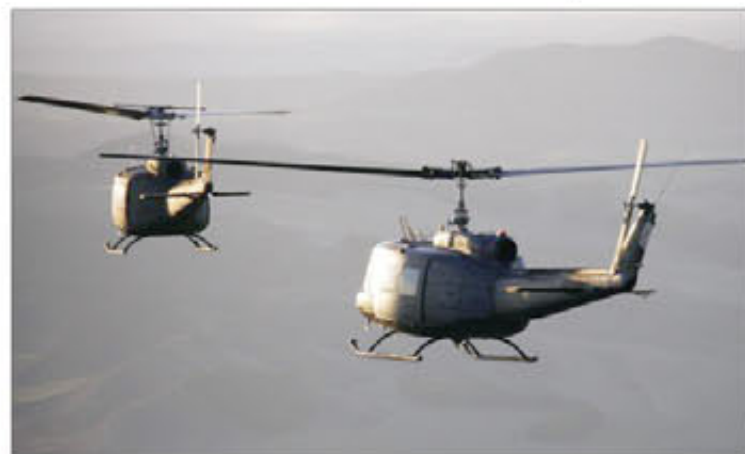
Los helicópteros HU-10 del BHELMA III cumplen 40 años