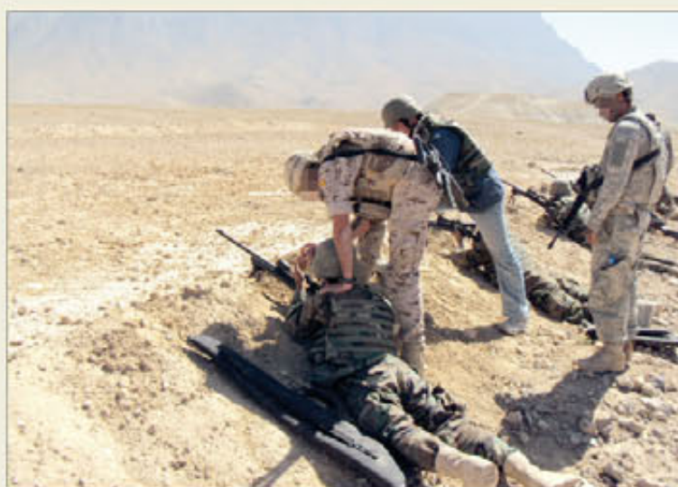
El objetivo de los OMLT es que el ANA llegue a ser autosuficiente