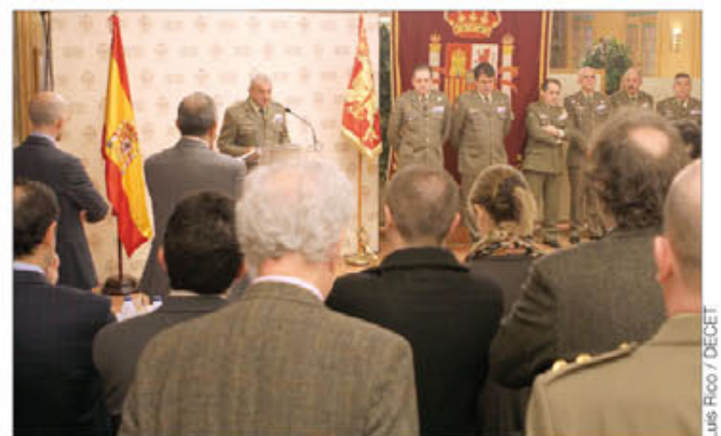
El general de ejército Coll da la bienvenida a los asistentes