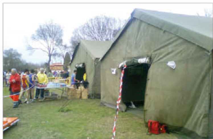
La AALOG nº 61 aportó tiendas modulares para vestuarios