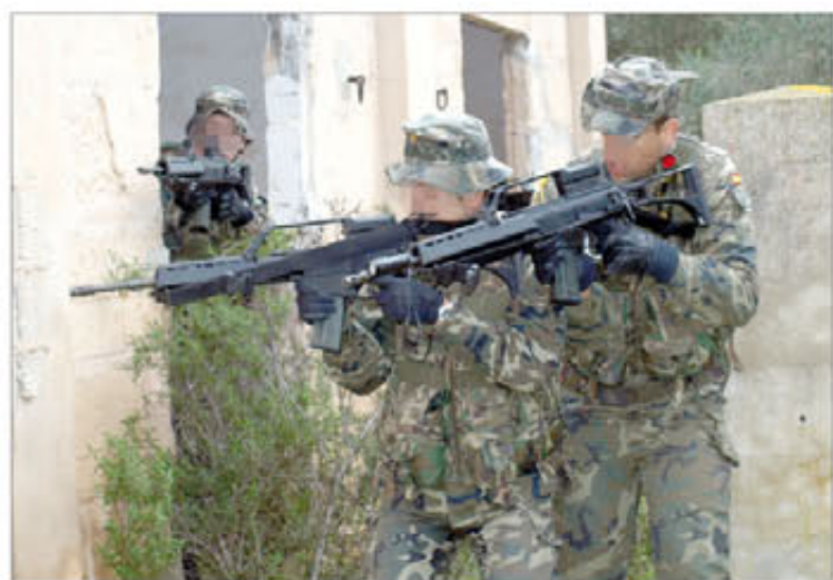
El combate en zonas urbanizadas centró gran parte de la jornada

latado historial de vuelos que han recorrido el cielo en muy variados escenarios. La Rioja y sus alrededores, en vuelos de instrucción; el resto de España, y especialmente los Pirineos, en numerosas actividades; y, por supuesto, lugares remotos allende nuestras fronteras. Logrado el hito, ahora el batallón sigue encarando el futuro. En marzo le espera la XX rotación de la Unidad Española de Helicópteros en Afganistán (ASPUHEL) y culminar con éxito el proceso de transición al nuevo modelo de helicóptero de transporte táctico NH-90. Nuevas horas de vuelo dando lo mejor de sí mismos. (⇨ intranet 28/01/2011)