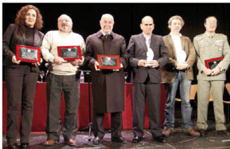
Acto celebrado por la Asociación de la Prensa de Almería

La localidad de Tabernas fue el escenario elegido por la Asociación de la Prensa de Almería para celebrar un acto institucional con motivo del patrón de los periodistas, San Francisco de Sales. En él, además de entregar los Premios Libertad de Expresión