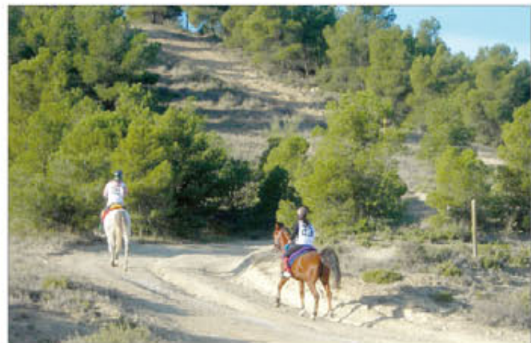
El recorrido transcurrió por el CENAD "San Gregorio" de Zaragoza

En este tipo de competición hípica se pone a prueba la velocidad, habilidad, y resistencia física y psicológica tanto del jinete como del caballo. Ambos deben recorrer grandes distancias en un día, a través de terrenos variados y contrarreloj. En este deporte, en el que España es una potencia mundial, prima la salud del caballo: si los controles veterinarios a los que se le somete, a lo largo de la prueba, dictaminan que no puede seguir, el binomio es eliminado.