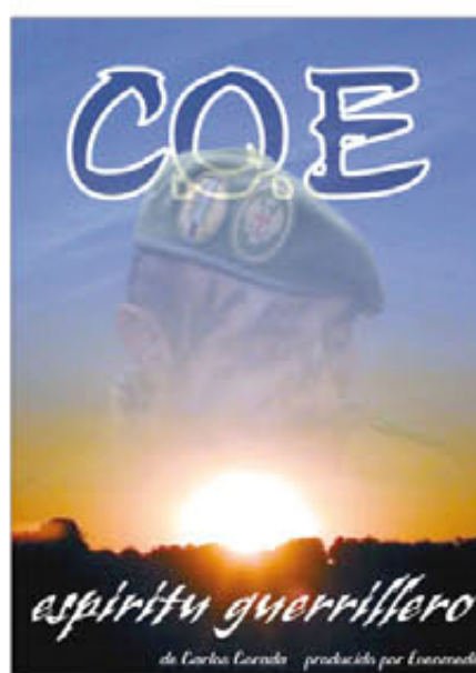
Cartel promocional del cortometraje

Este cortometraje fue rodado el año pasado en la provincia de Palencia (concretamente, en los alrededores de Aguilar de Campoo) y en él han intervenido numerosos veteranos de Operaciones Especiales. Todos los actores son antiguos guerrilleros, que han recreado las actividades de una de estas compañías.