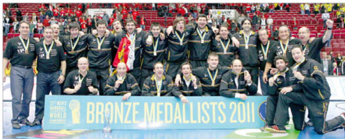
La Selección al completo luce la medalla de bronce, el último título conseguido por el balonmano español

«Londres 2012 es un objetivo que me da mucha fuerza»