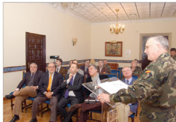
El teniente general Sañudo explica las actividades de FUTER

cias (UME), en Torrejón de Ardoz (Madrid), su jefe, teniente general Roldán, recibió, el día 14 de febrero, a un nutrido grupo de profesionales de la comunicación. El teniente general les adelantó: «En marzo recibiremos dos helicópteros Cougar y, a finales de año, dos más. Así podremos liberar los Superpuma y Cougar cedidos por el Ejército. Además, en 2012, esperamos culminar el programa contra riesgos tecnológicos que tenemos en marcha».