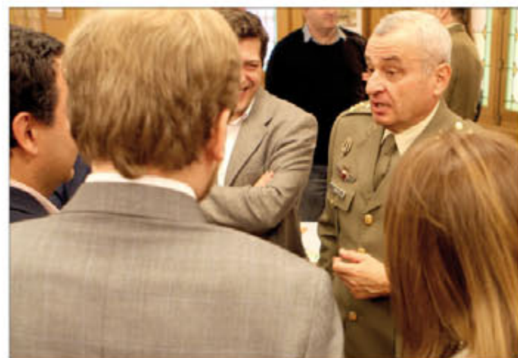
Los profesionales charlan con el general de ejército Coll

gela Merkel, en su visita a España, e hizo lo propio en la inauguración del nuevo Instituto Tecnológico "La Marañosá", el 16 de febrero.