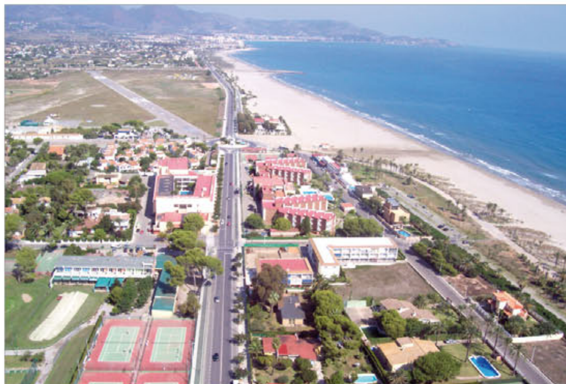
Vista panorámica del entorno de la Residencia "La Plana", ubicada junto al mar en Castellón de la Plana

La Dirección de Asistencia al Personal publicará una única convocatoria para todas las ofertas, a finales de febrero o principios de marzo