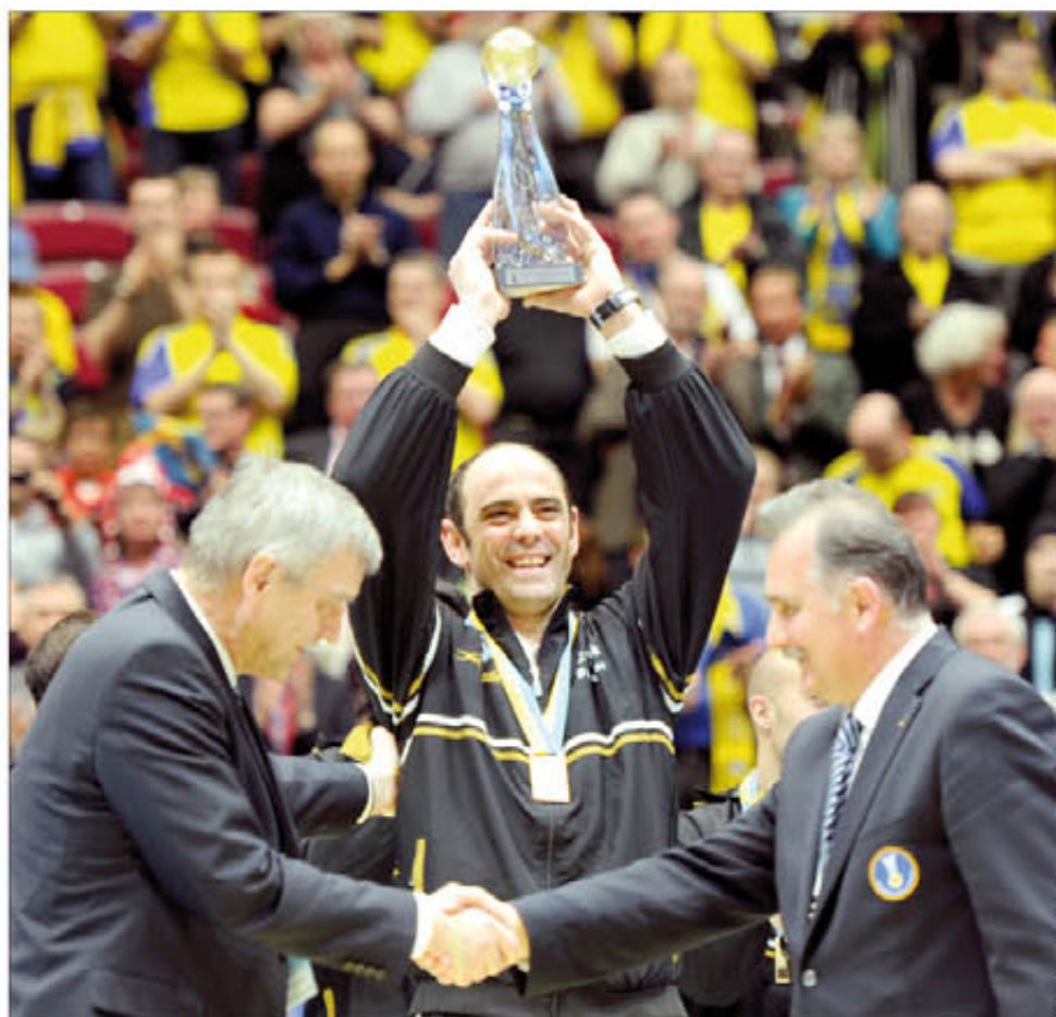
El capitán levanta la copa tras ganar el partido por el tercer puesto en el Mundial

Yo sé que esto se está acabando (cumpliré los 39 años en abril) pero no me he puesto un plazo para retirarme. Y Londres 2012 es un objetivo que me da mucha fuerza, porque las Olimpiadas son algo diferente. Allí están los mejores deportistas del mundo y las estrellas más grandes que te puedas imaginar.