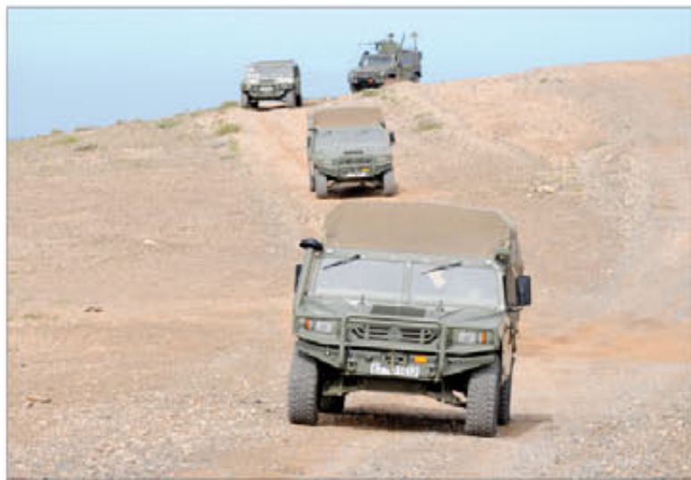
Vehículos de acompañamiento y seguridad de un convoy

En el ejercicio participaron 1.200 militares. En cuanto a los