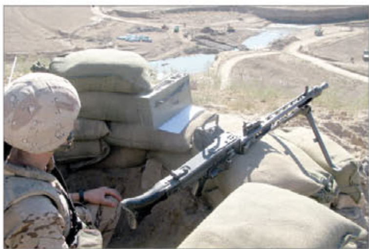
Las tropas españolas han respondido a varios hostigamientos

Dos días después, la Base Operativa Avanzada (FOB) "Bernardo de Gálvez" 2, situada en la localidad de Ludina, sufrió un hostigamiento con fuego de armas ligeras, que no produjo bajas ni daños materiales. A continuación, una patrulla de reconocimiento salió de la base y descubrió a tres sospecho-