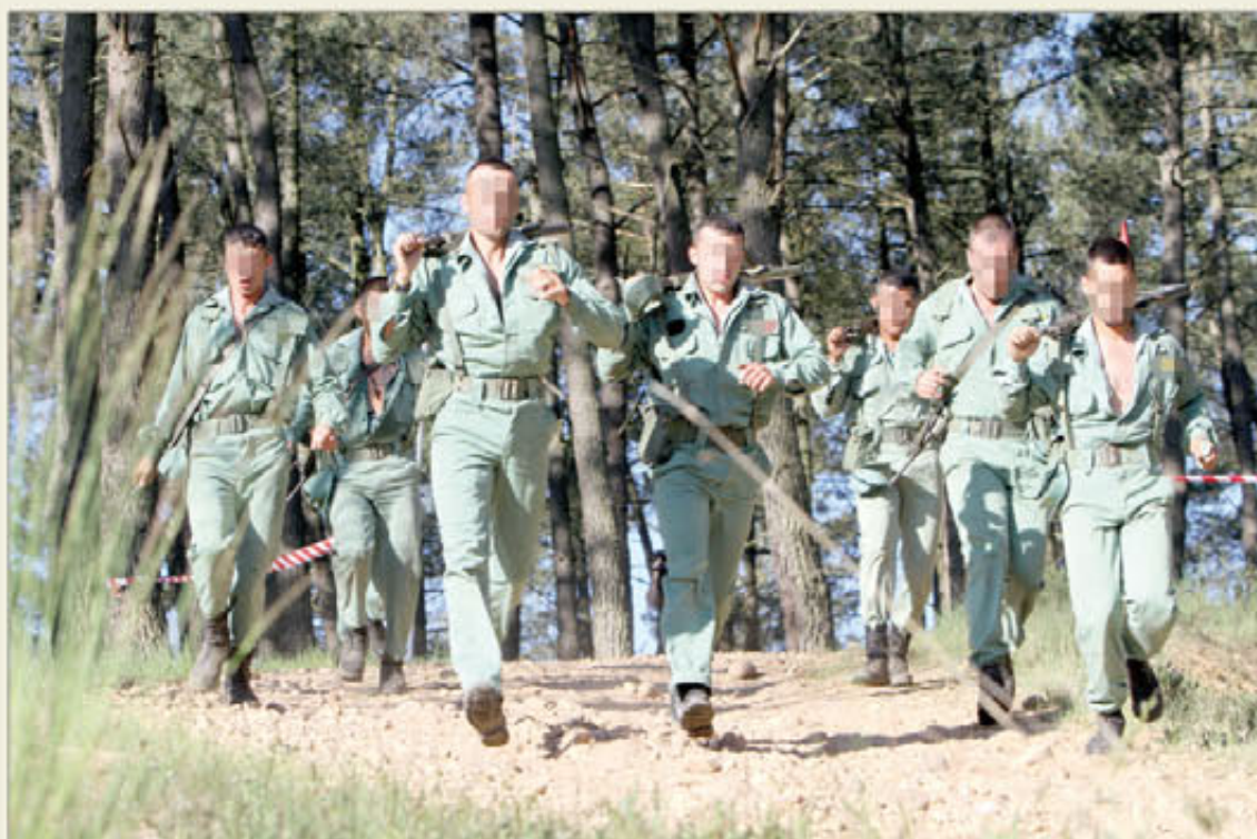
La nueva prueba colectiva comenzará a evaluarse en 2011

Esto se ha solucionado premiando con más puntos a los que consigan mejores marcas, y manteniendo o rebajando las puntuaciones para los que se queden en niveles bajos o intermedios. Así se ha hecho en el circuito de velocidad-agilidad y en la prueba de los 6.000 metros. Por ejemplo, un varón de entre 32 y 36 años que complete el circuito en 13,3 segundos —que en 2010 hubiese sumado 72 puntos— ahora recibirá 80, pero si tarda 15,8 segundos, ya no tendrá 23 puntos, sino 20. En el caso de la carrera, una mujer de entre 37 y 41 años que haga la prueba en 30 minutos, tendrá 82 puntos en lugar de 79.