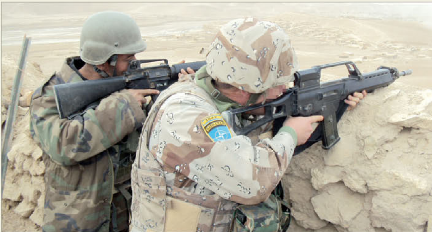
Los OMLT cumplen la misión de mentorizar a las unidades del Ejército Nacional Afgano y servir de enlace con la ISAF

Las páginas de "el Ejército informa" incluyen, en este número, un reportaje sobre la labor que los Equipos Operativos de Mentorización y Enlace (OMLT) realizan en Afga-