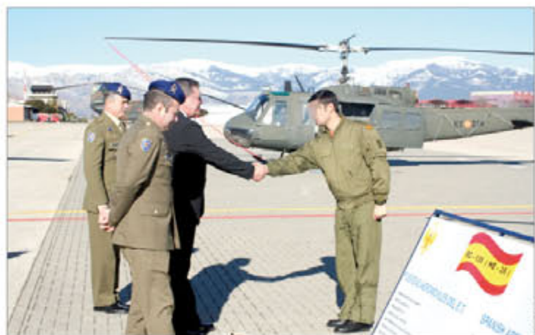
La delegación paraguaya presenció una exposición estática