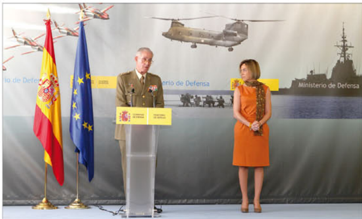
El ex JEMAD fue homenajeado en el Ministerio de Defensa