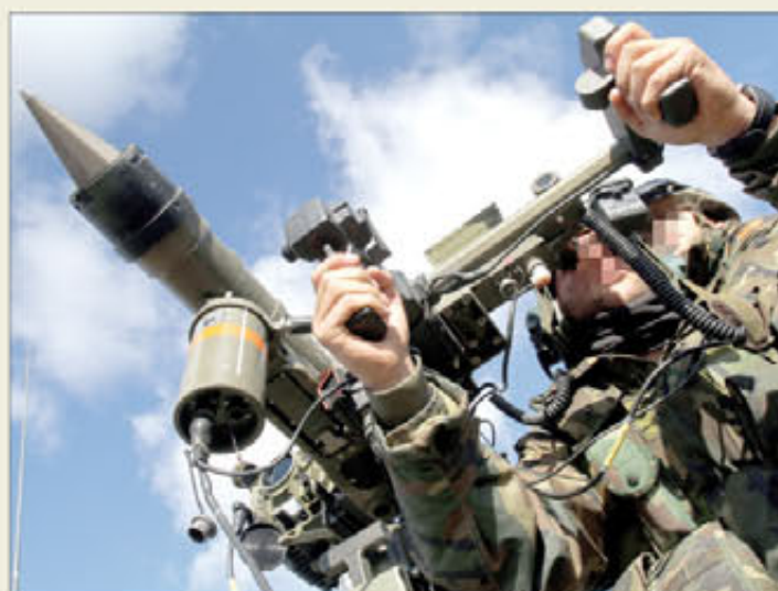
El programa refleja la formación y experiencia de cada militar

Hasta el momento no existía un programa de estas características, tan individualizado y centrado en el combatiente, pero sí uno de gestión de adiestramiento, que ofrecía datos a nivel colectivo. Por lo tanto, cuando un soldado cambiaba de destino tenía que indicar cuáles habían sido sus funciones, o cuando un jefe asumía el mando de una nueva unidad, tenía que recabar estos datos