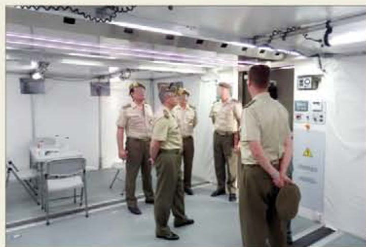
Representantes del Ejército de Tierra comprobaron los materiales