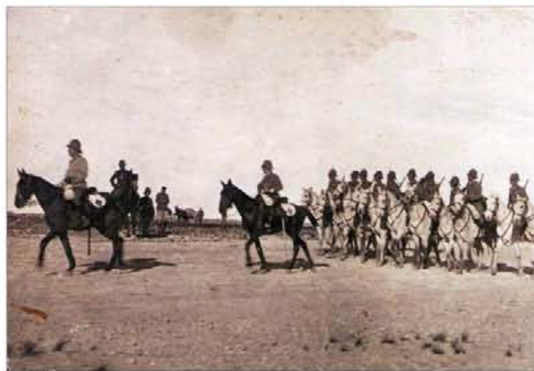
El pasado y el presente del laureado Regimiento en dos imágenes a las que separa casi un siglo

Con anterioridad, esta distinción, en su modalidad individual, le ha-