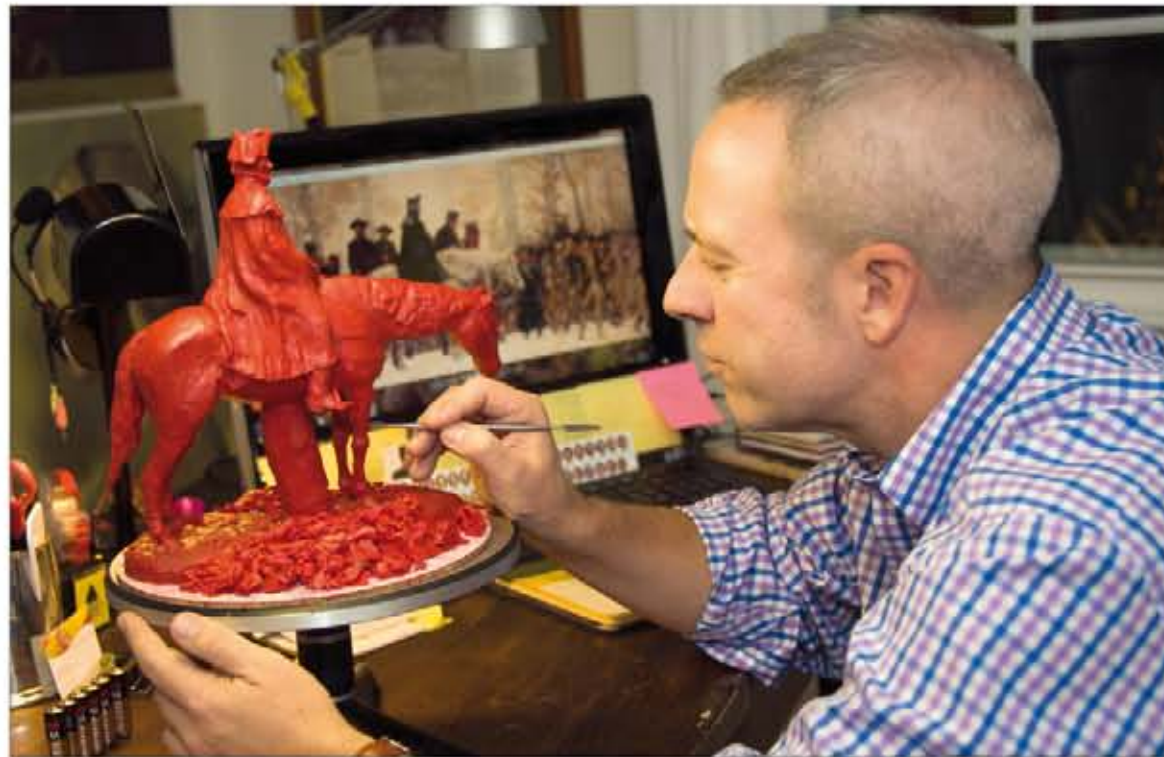
El teniente coronel, en pleno proceso de creación de una figura ecuestre militar