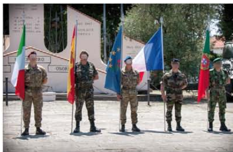
En la clausura estuvieron representados los cuatro países miembros

Por acuerdo de los cuatro países, el 2 de julio dejará de existir oficialmente EUROFOR, cuyo Cuartel General estaba compuesto por 82 militares, de los que 17 eran españoles. La evolución de la Política Común de Seguridad y Defensa de la Unión Europea y la reducción de la estructura militar de la OTAN han llevado a las cuatro naciones participantes a adoptar esta