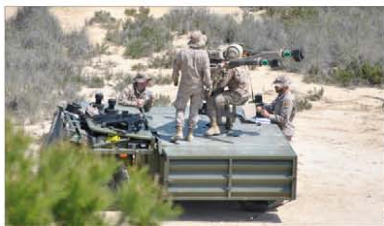
El ejercicio permitió el despliegue de sistemas antiaéreos

En el ejercicio participó también una sección del Grupo de Caballería de la Legión, que materializó la fuerza de oposición y llevó a cabo la simulación de las incidencias que se le plantearon a la fuerza actuante.