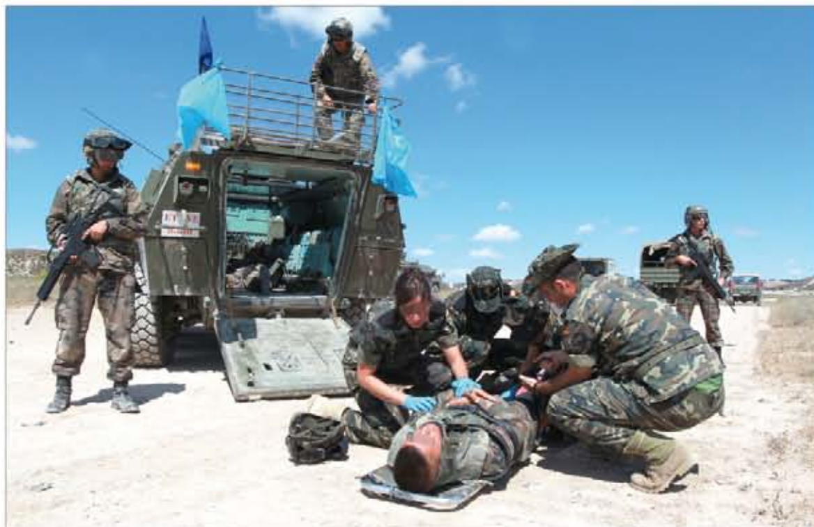
Atención médica a uno de los supuestos heridos en la explosión de un IED

La Brigada "Castillejos" II ya está lista para desplegar en el Líbano