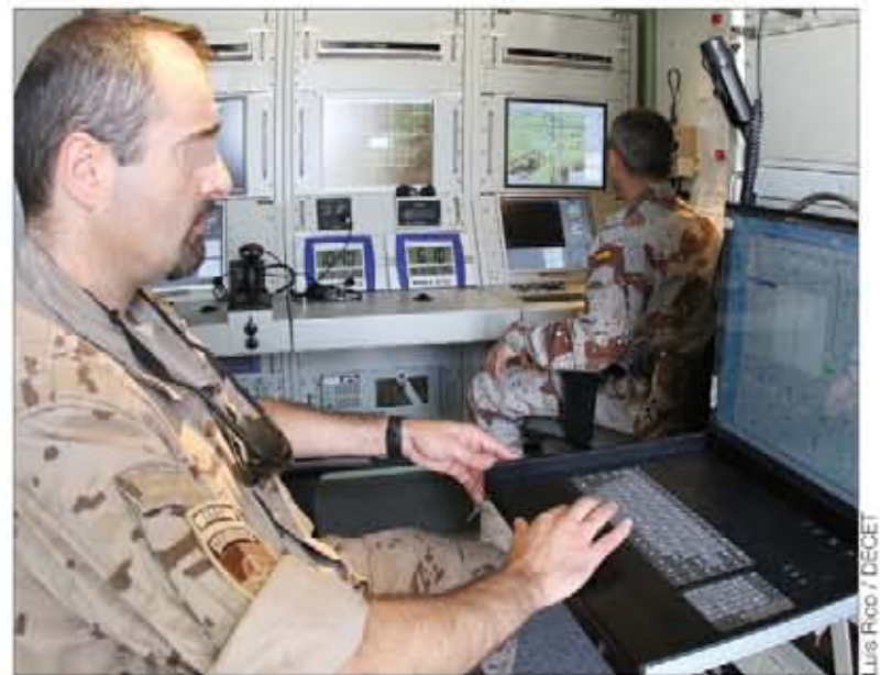
Interior de la Estación de Control de Tierra de UAS

Por ello, el coronel Demetrio afirmó en su alocución: «Han sido cinco meses de intenso trabajo, donde los hombres y mujeres que han formado este contingente han dado lo mejor de sí y han sabido demostrar que la preparación previa al despliegue y la en-