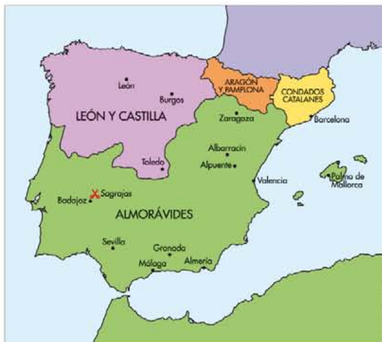
Extensión máxima del dominio almorávide, a principios del siglo XII

El choque entre ambos ejércitos tuvo lugar en Sagrajas o Zalaca, localidad situada a escasos kilómetros de Badajoz. Los cristianos iniciaron la batalla atacando a las fuerzas andalusíes, pero fue la intervención de los almorávides la que decidió el resultado del com-