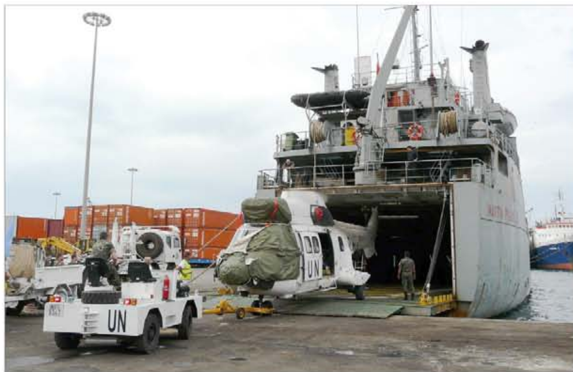
El GAPRO ayuda a garantizar un flujo suficiente de entrada de fuerzas en el teatro de operaciones

Su personal y material, con los correspondientes refuerzos en función de la misión que deba lle-