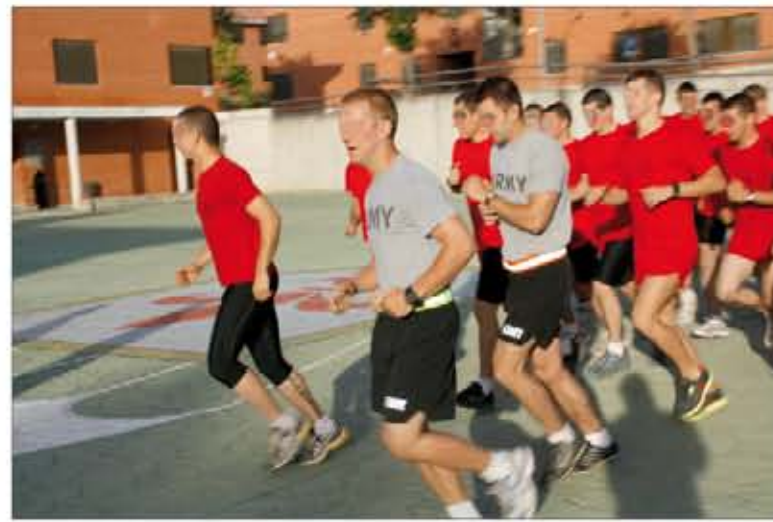
Norteamericanos y españoles hacen educación física en la BRIPAC