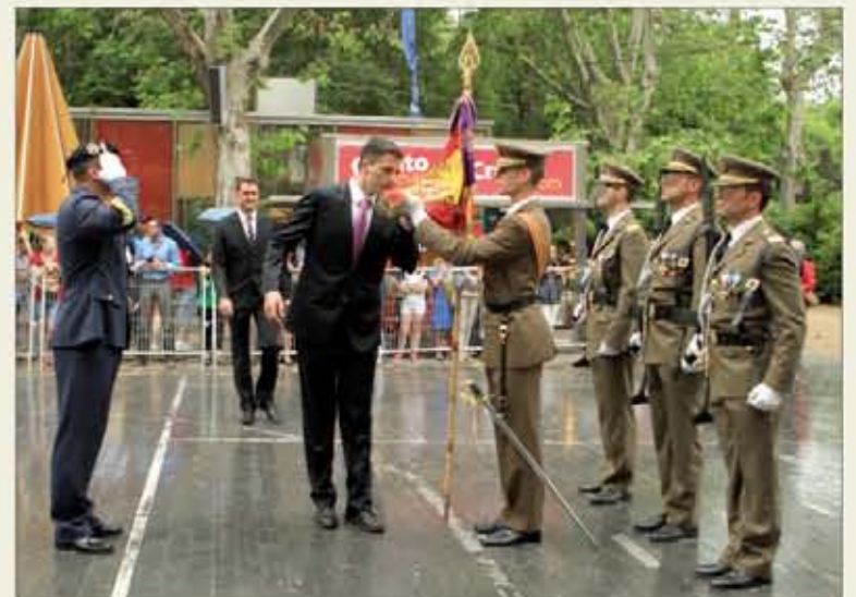
Un jurando besa el Estandarte de la Academia de Caballería

El emblemático Teatro Zorrilla de la capital vallisoletana albergó, el 30 de mayo, la proyección del documental "Un puente para la paz", que ha contado con la colaboración del Departamento de Comunicación del Ejército de Tierra, sobre los 18 años de misión del Ejército español en Bosnia-Herzegovina, y a la que asistió el JEME.