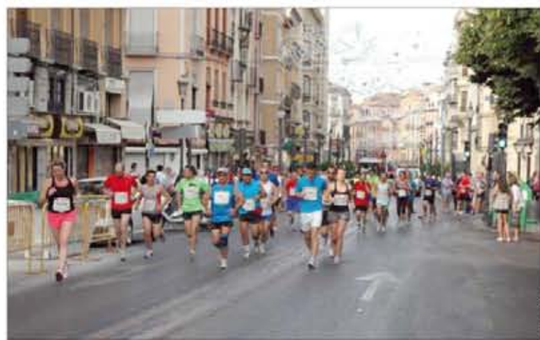
La carrera recorre las zonas más emblemáticas de Granada

da y Laureada Colectiva. Con esta última se distingue a Unidades, Centros y Organismos de las Fuerzas Armadas o del Cuerpo de la Guardia Civil por acciones, hechos o servicios excepcionales realizados en colectividad en el transcurso de conflictos armados o de operaciones militares.