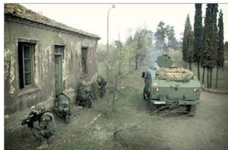
El ejercicio se realizó en una antigua población minera

La neutralización de estos objetivos contribuiría a facilitar la entrada posterior a una fuerza convencional en el país diseñado para la ambientación, en el que operan diversos grupos armados y organizaciones terroristas.