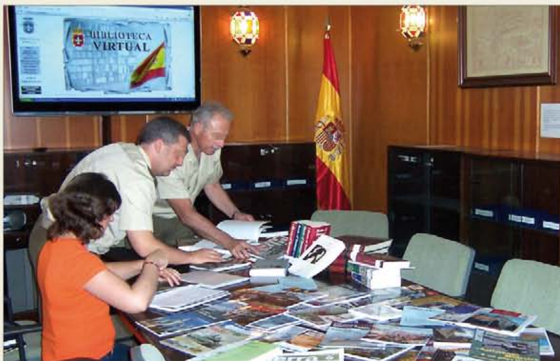
Este Servicio ofrece documentación extraída de más de 150 títulos de revistas militares

Las principales ventajas que ofrece este servicio respecto a otros similares es que proporciona una atención personalizada —a través del correo electrónico (Servicio de Documentación DIDOM, en la lista de contactos de Outlook) o de la dirección servicio_documentacion_didom@et.mde.es (para militares que, por diversas circunstancias, no puedan utilizar Outlook) y que el