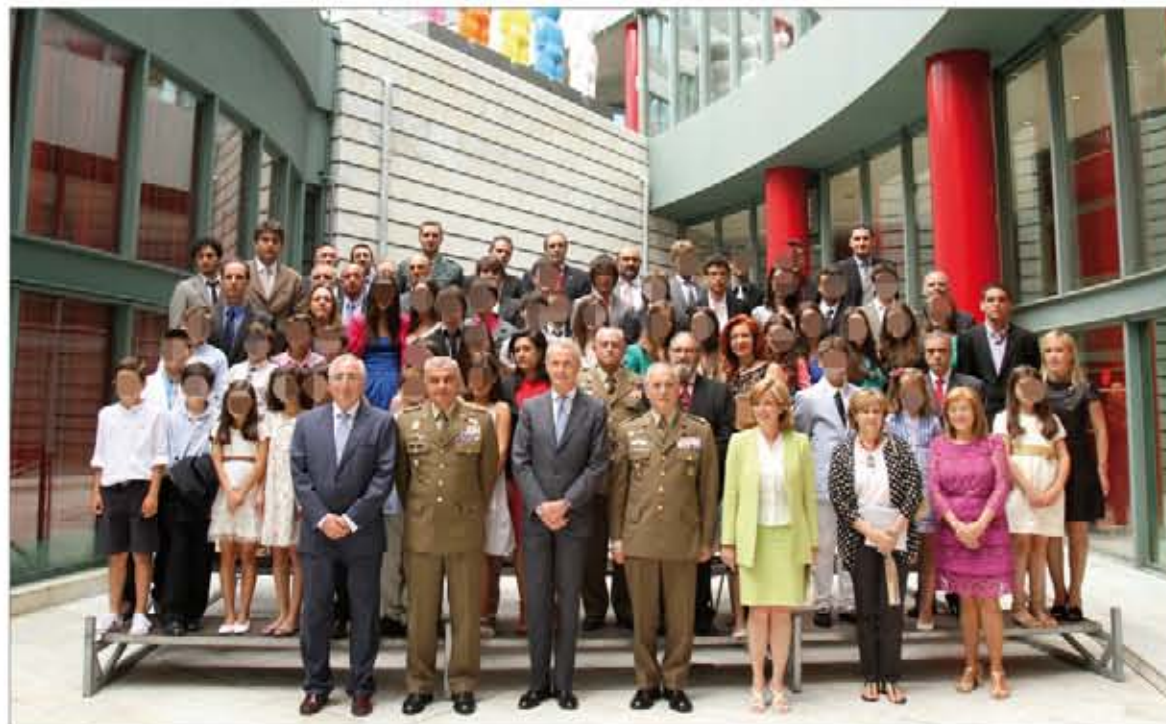
Autoridades, miembros del jurado y premiados se fotografiaron antes de comenzar la gala

La ceremonia de entrega se realizó, por primera vez en medio siglo, fuera de un recinto militar