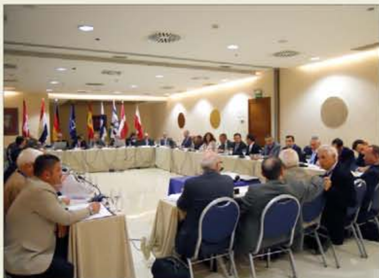
El Club de los Usuarios de Spike se reunió en Granada

de los misiles actualmente en uso en el Ejército español —Mistral, Milán y TOW, con los que también es compatible—. «Nuestra propuesta destaca por su ligereza, portabilidad, tecnología avanzada, fácil uso, bajo coste y elevadas prestaciones, ya que permite tanto el entrenamiento del arma como la simulación táctica», asegura la empresa.