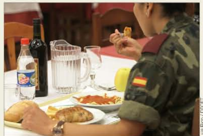
La nueva regulación modifica el precio que se abona por la comida

La modificación supone la estricta aplicación de lo establecido en las Órdenes Ministeriales 125/1993 y 289/1999, que regulan el derecho a la alimentación en las Fuerzas Armadas, por lo que a partir de ahora se abonará, con carácter general, el 50% del módulo básico de la plaza en rancho, con la excepción de los alumnos de centros de formación y acade-