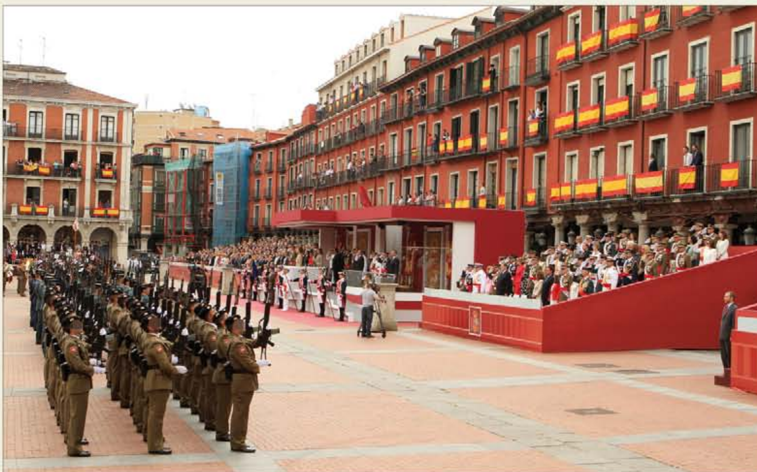
La Plaza Mayor de Valladolid engalanó sus balcones con los colores de la Bandera Nacional para recibir a los Reyes y a los Príncipes

En "el Ejército informa" se recoge la celebración del Día de las Fuerzas Armadas, cuyo acto central tuvo lugar en la Plaza Mayor de Valladolid. El inicio del Homenaje a la Ban-