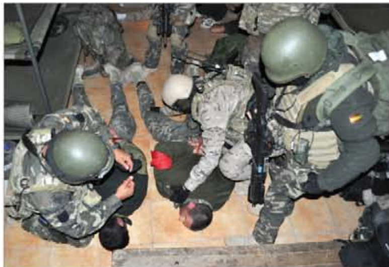
El equipo de asalto detiene a dos presuntos terroristas

Una de ellas consistió en el rescate de una rehén a cuyo cuerpo habían adosado explosivos. Un equipo de reconocimiento estuvo varios días haciendo seguimiento del objetivo para preparar el asalto a la casa. Éste se hizo por la noche,