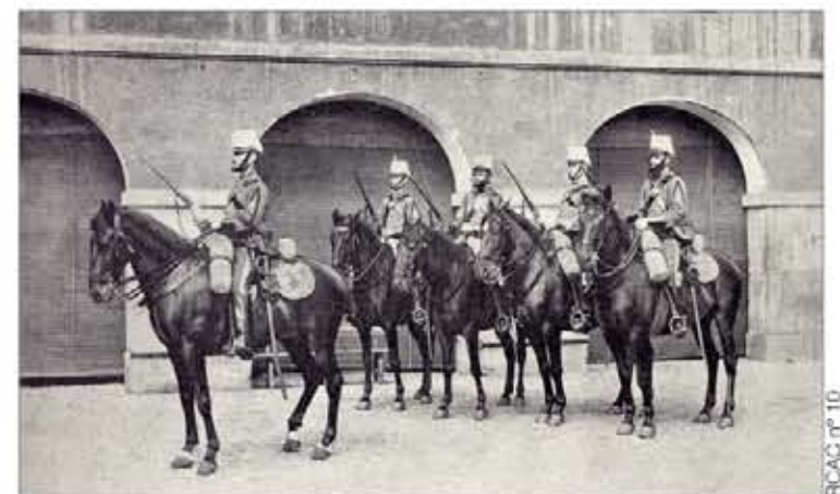
Imagen antigua del "Cazadores de Alcántara", 14 de Caballería

ciones rinden a los militares que fallecen o resultan heridos en acto de servicio. Pág. 3