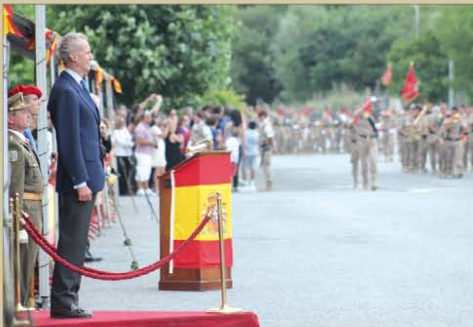
FL nº 45

Este año, la celebración del Día de las Fuerzas Armadas ha sido muy especial e intenso en el País Vasco. En la base “Araca” de Vitoria, diez años después, volvía a vivirse una jornada de puertas