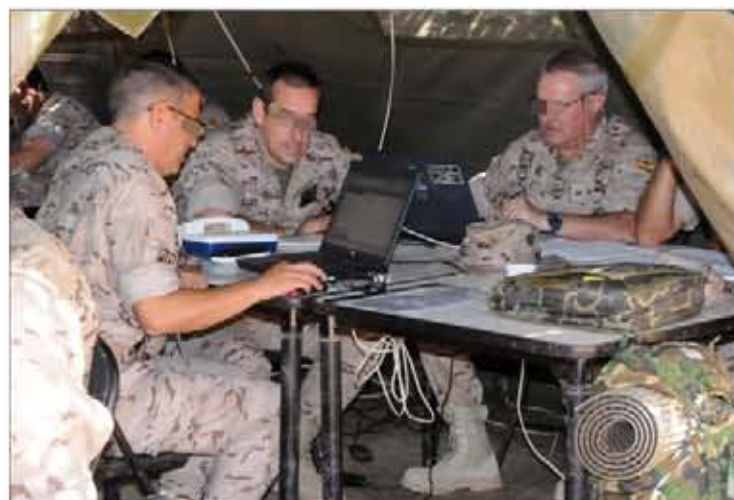
El ejercicio ha servido para evaluar a la Plana Mayor de la AGTAD

Todos ellos fueron interconectados creando una federa-