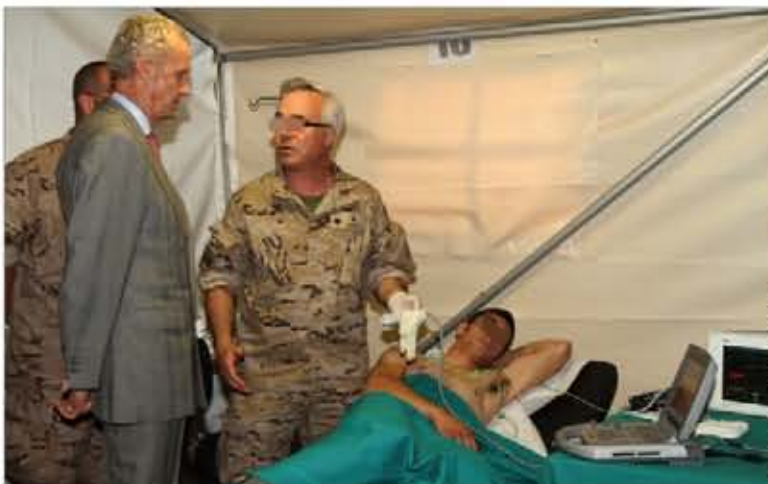
El ministro asiste a una demostración en la sala de telemedicina