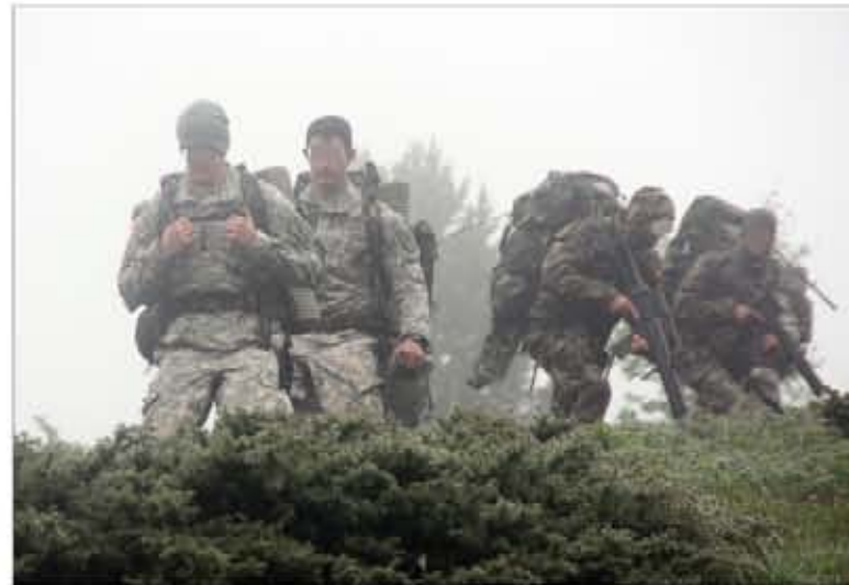
Los cadetes participan en un ejercicio en el Pirineo aragonés

El HOC es «un ejemplo de cómo podemos contribuir a las necesidades internas y de las organizaciones internacionales en misiones en el exterior», añadió. Con su adquisición, España ha conseguido capacidad de liderazgo en sanidad militar.