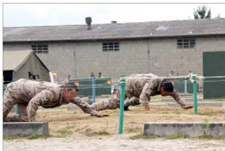
Una de las patrullas pasa la pista de obstáculos