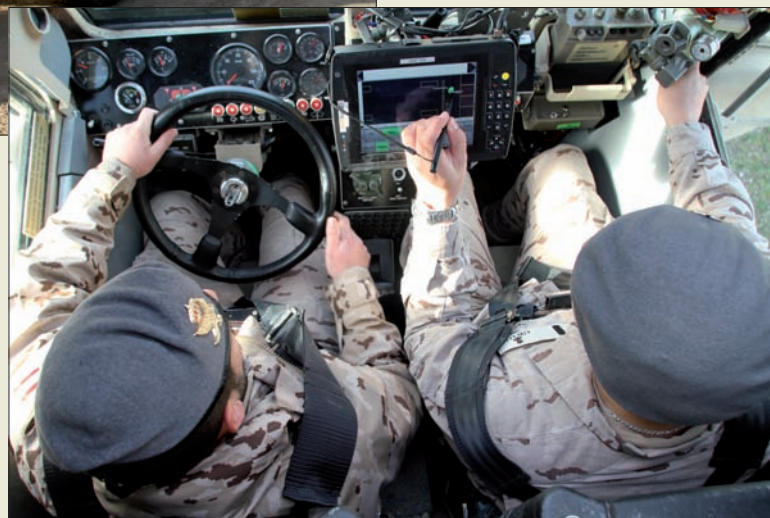
El modelo español cuenta con dos tripulantes: conductor y operador

mulados del que dispone la base, donde se habían ocultado un plato de presión, un proyectil de