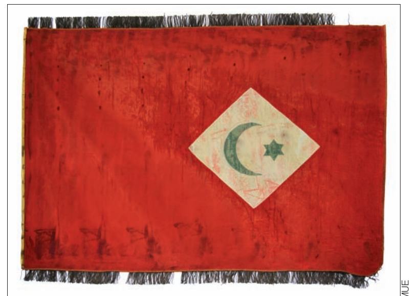
Bandera de Abd el-Krim, líder de los rebeldes rifeños

diferentes velocidades de descenso, como parte de la instrucción de lanzamientos de cargas que realiza regularmente el Mando Aéreo de Combate del Ejército del Aire. La BRIPAC ha colaborado con su Unidad de Lanzamiento de Cargas en la preparación de las mismas, una capacidad que ha recuperado su Grupo Logístico tras las últimas adaptaciones orgánicas por las que se ha reorganizado el Grupo de Apoyo a la Proyección.