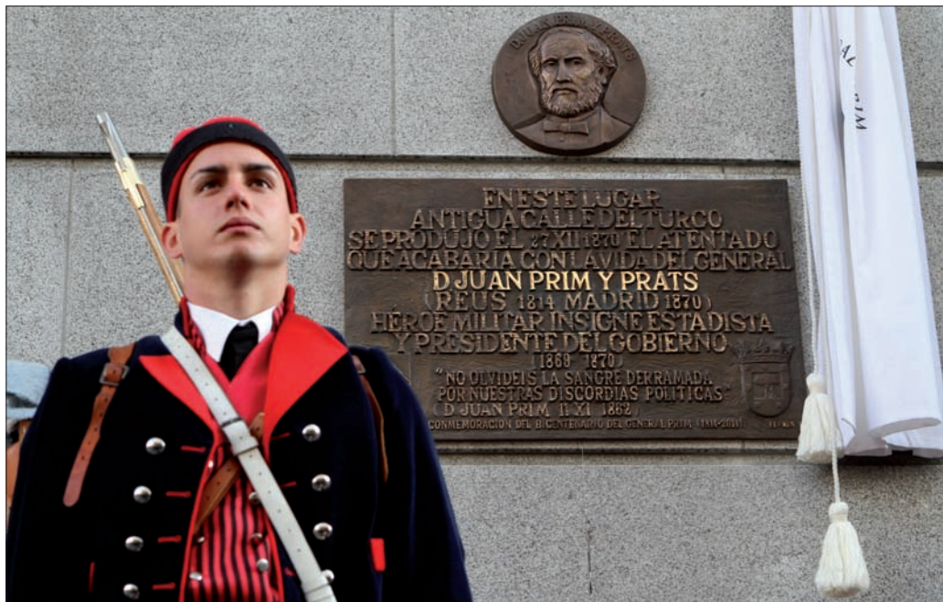
Los soldados vestidos con uniforme de época pertenecían al RCZM "Arapiles" nº 62

En el momento de sufrir el atentado, Juan Prim era presidente del Consejo de Ministros y ministro de la Guerra, y tenía su residencia en el Palacio de Buenavista. Por este motivo, las autoridades se trasladaron hasta la actual sede