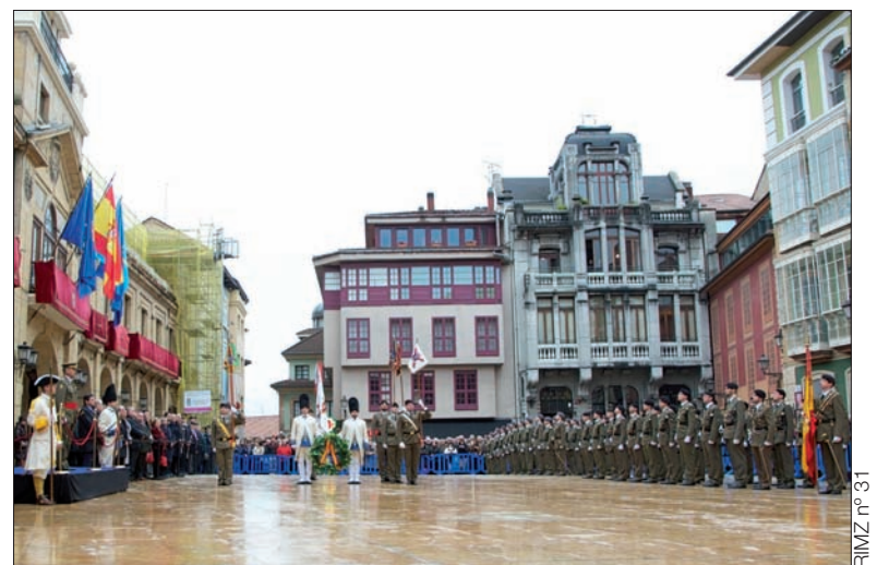
La parada militar tuvo lugar en la plaza de la Constitución