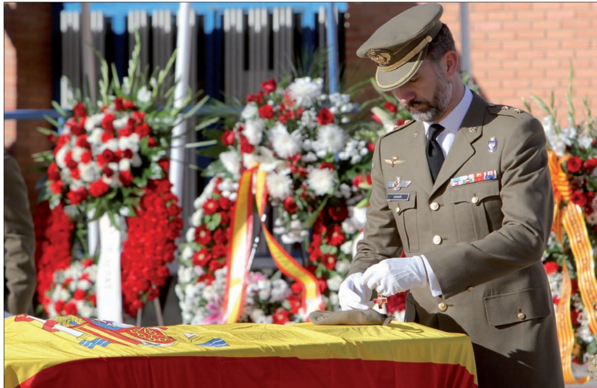
Don Felipe impuso al sargento, a título póstumo, la Cruz del Mérito Militar con distintivo rojo