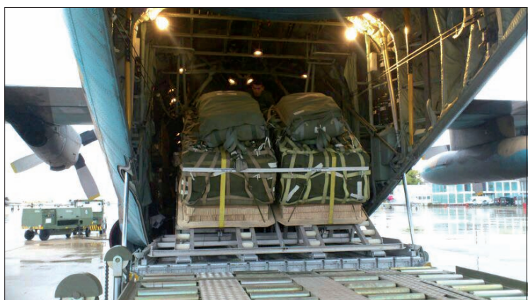
Cargas dispuestas en el interior del avión para su lanzamiento

La muestra fue inaugurada el 18 de diciembre y permanecerá abierta al público hasta el 10 de febrero. Puede visitarse de once de la mañana a cinco de la tarde, excepto los miércoles, día en que el Museo del Ejército permanece cerrado. La entrada es gratuita.