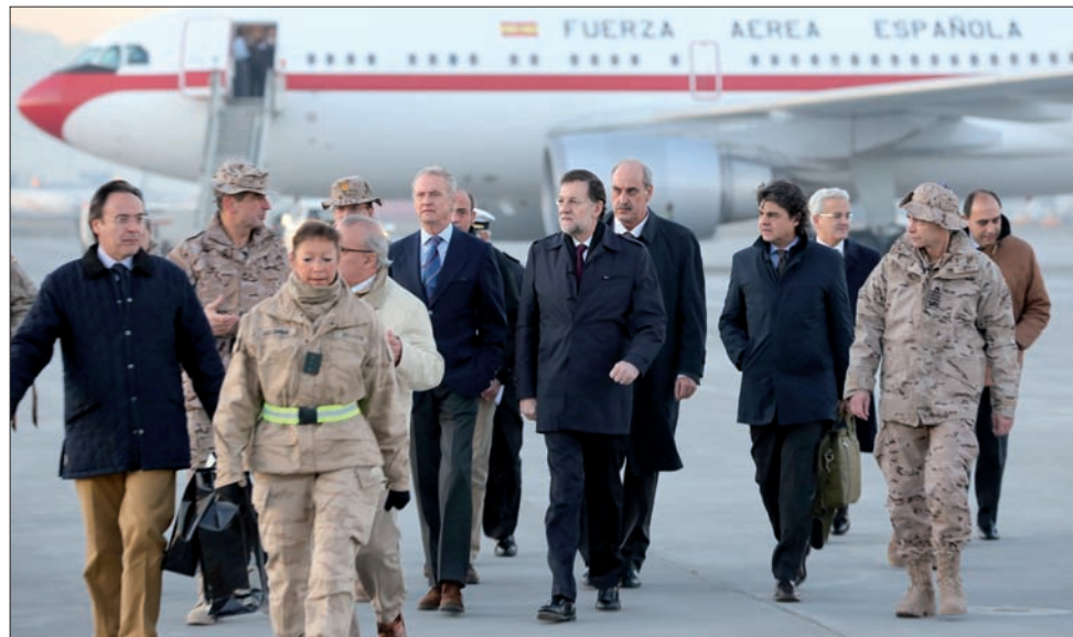
El presidente del Gobierno y el ministro de Defensa, a su llegada a Afganistán