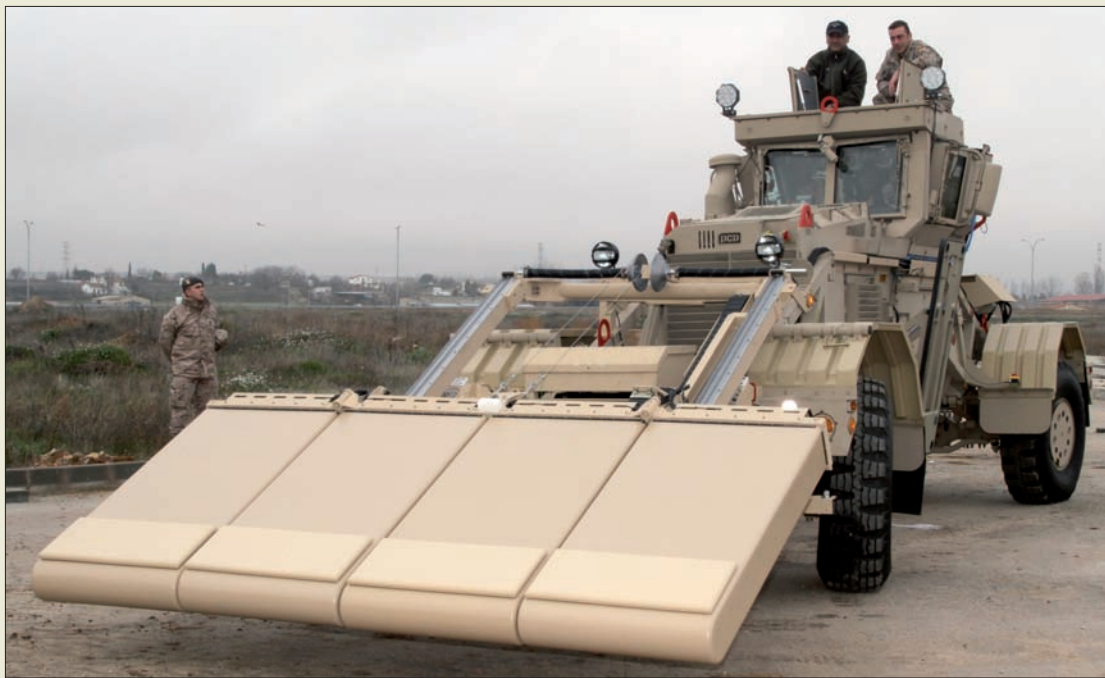
La llegada del Husky a Afganistán incrementará las capacidades de lucha contra IED

Las últimas incorporaciones de materiales en zona de operaciones permitirán aumentar la seguridad frente a los artefactos explosivos improvisados (IED) en Afganistán; en el Líbano mejora la velocidad y capacidad de las transmisiones. Novedades