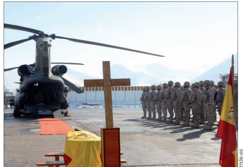
Repatriación de los restos mortales del sargento fallecido