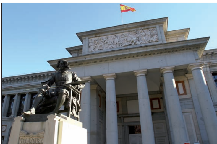
Hacerse amigo del Museo del Prado no ha subido de precio

Sotomayor", donde también se dieron cita veteranos procedentes de las hermandades de antiguos caballeros legionarios de toda España ( intranet ⇨ 15/01/2013).