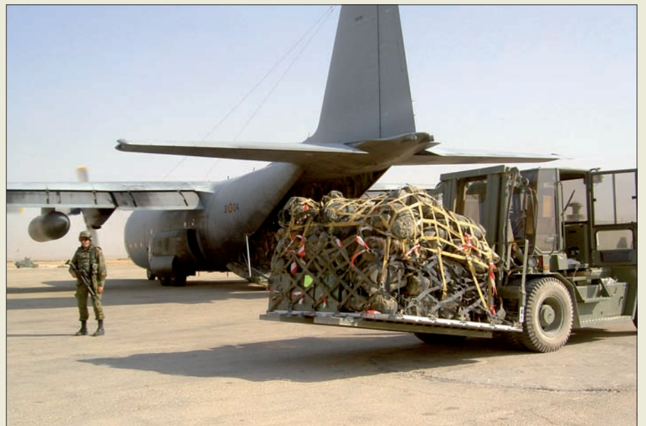
El Grupo de Apoyo a la Proyección está potenciando sus cometidos