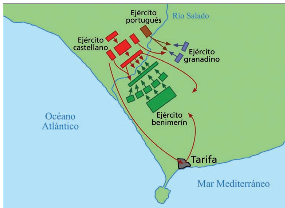
Despliegue de las fuerzas que participaron en la batalla del Salado

La acometida frontal de los benimerines no consiguió romper la formación castellana, mientras que el contraataque cristiano sí logró desbaratar las líneas musulmanas. Mientras los castellanos obligaban al sultán benimerín, Abu al-Hasan ben