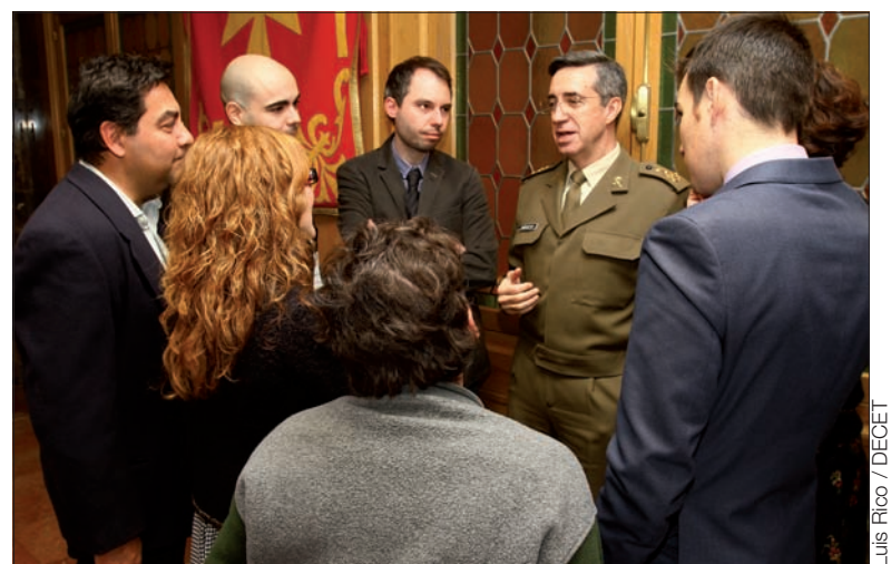
El JEME pudo conversar de forma distendida con los asistentes

En su primera celebración de esta festividad desde que ocupa el cargo, el JEME aprovechó para agradecer a estos profesionales su labor y se mostró consciente del reto que supone para ellos la complicación que entraña informar de una materia como el Ejército, que tiene su propio lenguaje y estructura. También habló sobre el futuro: «tenemos que empezar a dibujar el Ejército para dentro