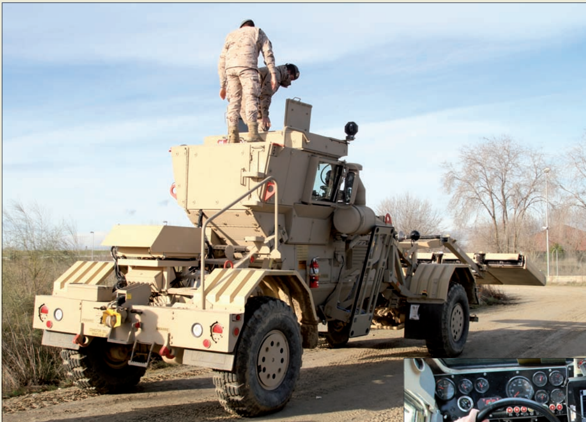
Componentes de la BRILAT durante el curso en “El Goloso”

Estos nuevos sistemas incrementarán la seguridad frente a los explosivos improvisados