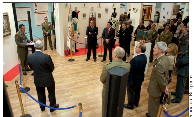
A la inauguración de la muestra asistieron numerosas autoridades