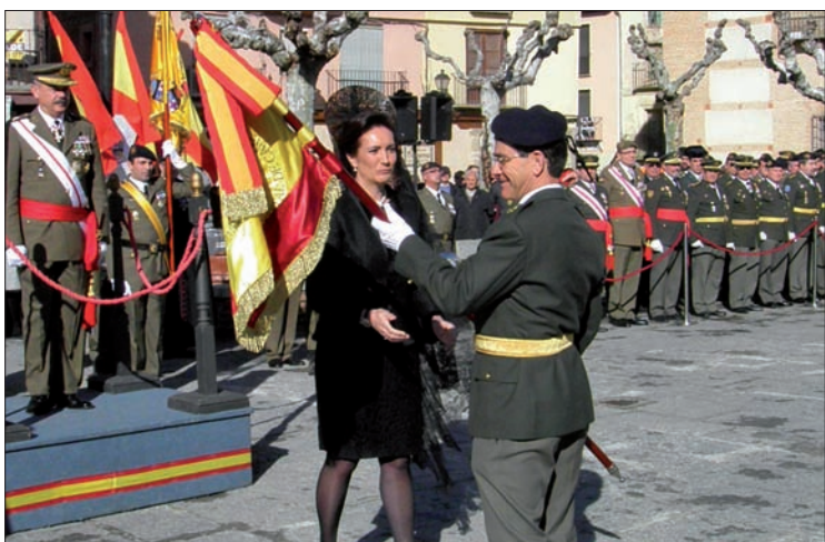
La madrina hace entrega del Estandarte al jefe de la Agrupación