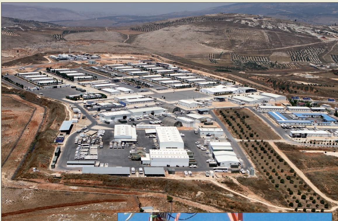
La base “Miguel de Cervantes” (arriba) ha modernizado sus transmisiones. Trabajos de montaje en altura de los nuevos radioenlaces (abajo)

De la supervisión del sistema se encarga el personal de la Unidad de Transmisiones del con-