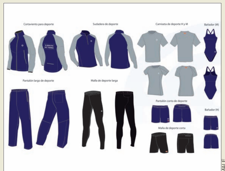
Las prendas combinan los tejidos técnicos con un diseño actual

seño mejorado, se suma el de hombre, una prenda que hasta ahora no estaba en dotación; es corto, no ajustado y azul.