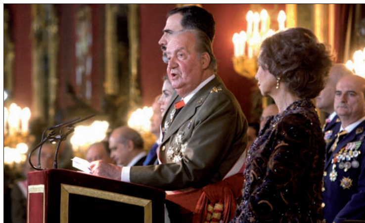
Don Juan Carlos pronunció su discurso en el Salón del Trono

Sus Majestades los Reyes presidieron, el 6 de enero, el acto central organizado con motivo de la Pascua Militar, que tuvo como escenario el Palacio Real de Madrid. Los actos castrenses se repitieron en ciudades como Sevilla, Santa Cruz de Tenerife, Valencia, La Coruña o Barcelona, entre otras. Pág. 5