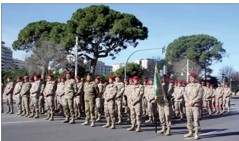
Acto de disolución de la unidad en el paseo de la Alameda

Al día siguiente, se ofició un funeral en el cementerio de San José de Granada y las cenizas del sargento fueron depositadas en el Panteón Militar. Pág. 3