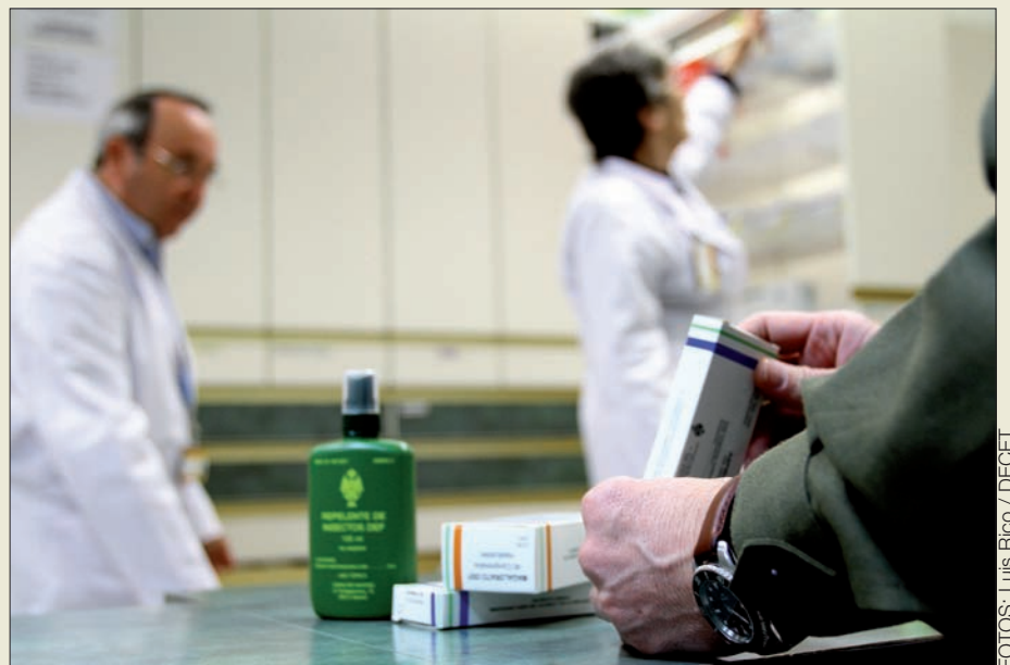
La racionalización de las farmacias militares culminará en 2013