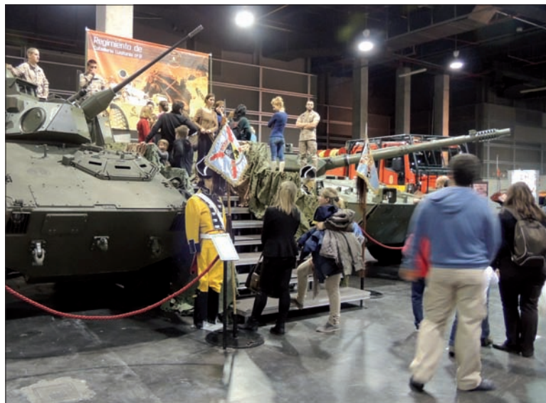
El Regimiento "Lusitania" llevó un VEC y un Centauro a "Expojovent"

La Comandancia Militar de Valencia y Castellón, con la colaboración de las unidades de las Fuerzas Armadas presentes en la plaza dispusieron una exposición de material; además, los más jóvenes podían utilizar los equipos de transmisiones, participar en concursos sobre una pista de aplicación infantil, subir en las trolis de circunstancias, disfrutar de demostraciones caninas... Por