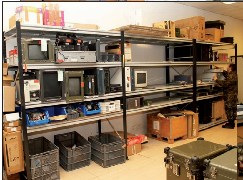
El sargento Ruiz comprueba la conexión del lector portátil del SSRL con el ordenador (arriba). Material obsoleto, revisado y pendiente, en los talleres (centro); sistema de alimentación ininterrumpida en reparación (abajo)