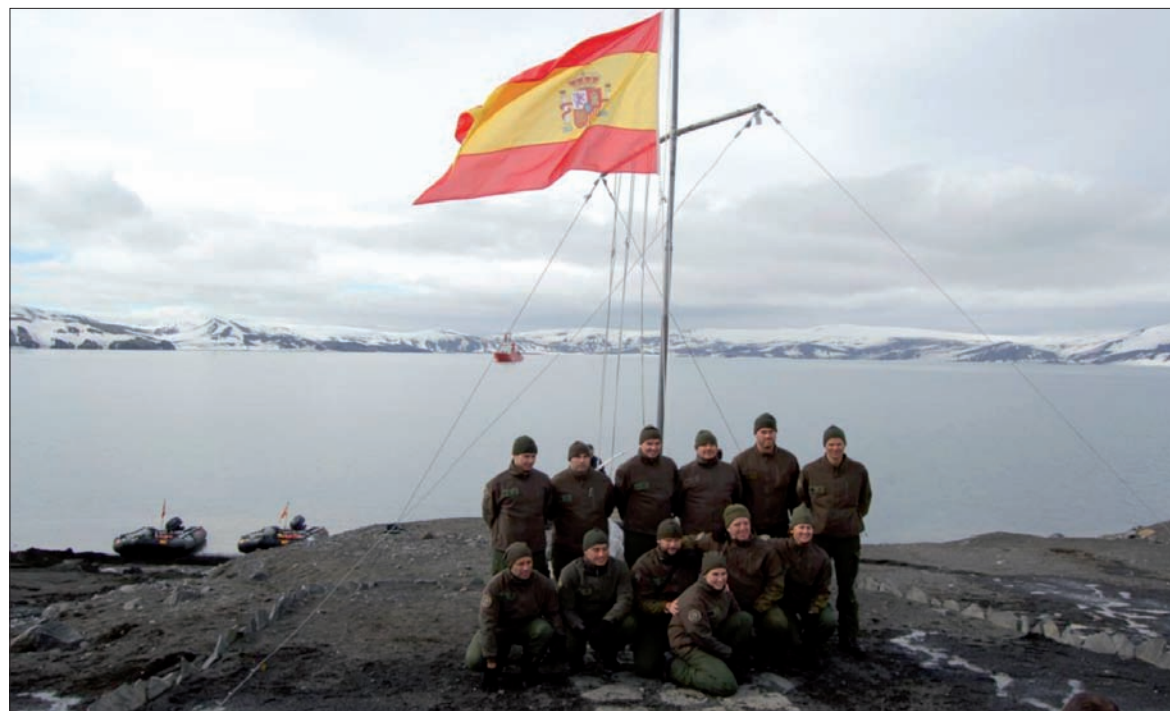
Los 12 componentes de la XXVI Campaña Antártica, en la base "Gabriel de Castilla"

Durante la jornada siguiente, el 24 de diciembre, el equipo continuó con la descarga de contenedores y trabajó en el establecimiento de las telecomunicacio-