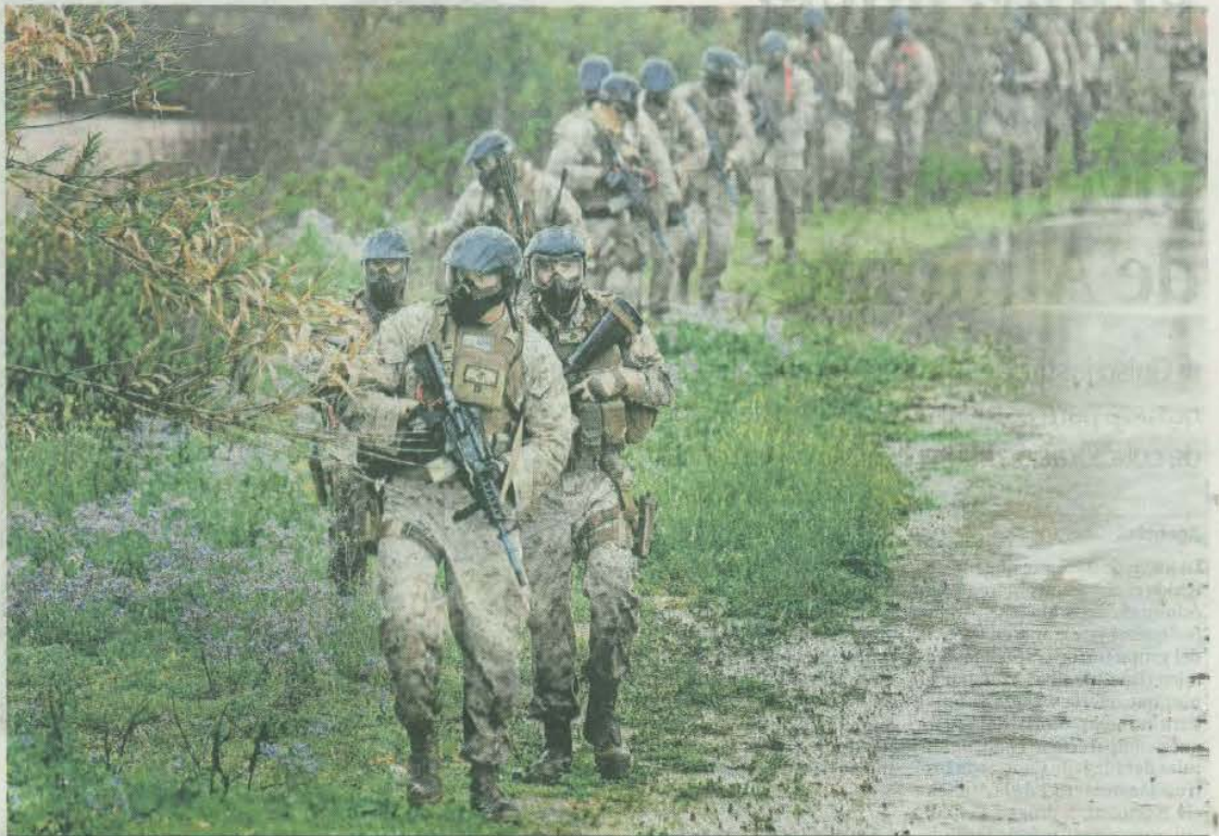
Infantes de Marina de los EEUU progresan en columna hacia un objetivo, orillando un regato del campo de maniobras.

La bahía gaditana ya ha vivido la primera de las dos operaciones marítimas de intercepción (MIO), previstas en las TJ15. Tales acciones las ejecutan infantes de marina estadounidenses, es-