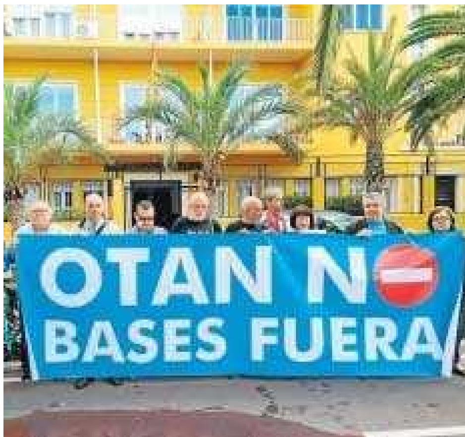
DIARIO DE ALMERÍA