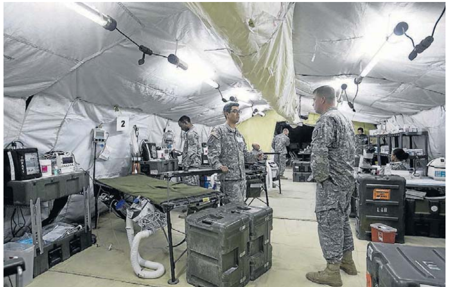
Interior de la uci del hospital de combate Role-2 montado por la Compañía Médica 557 de EE. UU. G. MESTRE

500 paracaidistas, el uso de munición, acciones en ambiente urbano o de guerra bacteriológica y operaciones de fuerzas especiales. Van a concentrar a 12.000 militares en Zaragoza: 8.500 en San Gregorio y 3.500 en la Base. «Es la primera vez que la OTAN pone en marcha una capacidad lo-