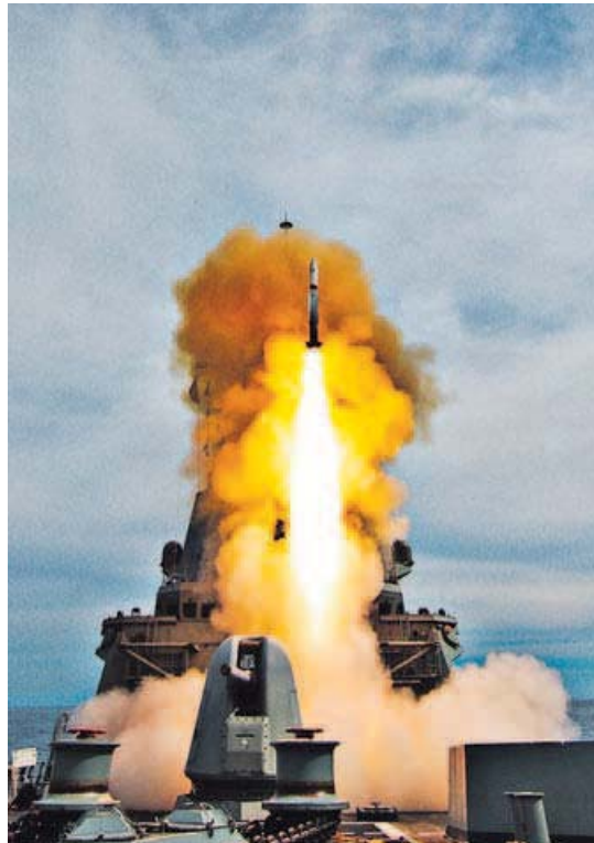
Prueba de lanzamiento de un ESSM desde la F-101.

Al mismo tiempo, y también en vinculación con la OTAN, la fragata Almirante Juan de Borbón (F-102) trabaja en aguas de Escocia en el At Sea Demonstration 15 jun-