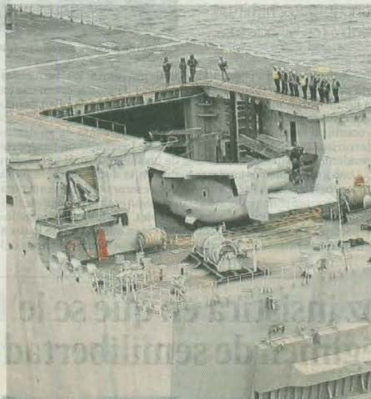
Un Haliato sube a la cubierta de vuelo en el ascensor del Juan Carlos I.

Esta fase la dirigirá el buque anfibio de desembarco Johan De