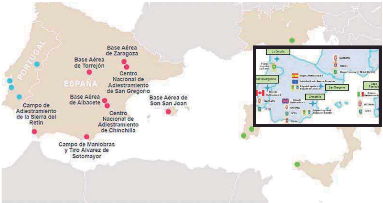
Mapas facilitados por el Ministerio de Defensa español sobre el despliegue de efectivos.