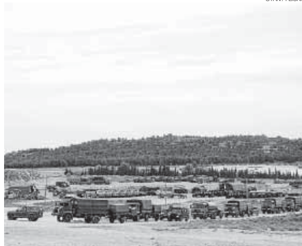
►► Prácticamente el 100% de los efectivos ya están en San Gregorio.

La Brilat, con acuartelamientos repartidos entre Galicia, Asturias y Castilla y León, es la «punta de lanza», según fuentes de Defensa, de la Fuerza de Respuesta Rápida de la OTAN para el año que viene. Precisamente esta fuerza de respuesta rápida