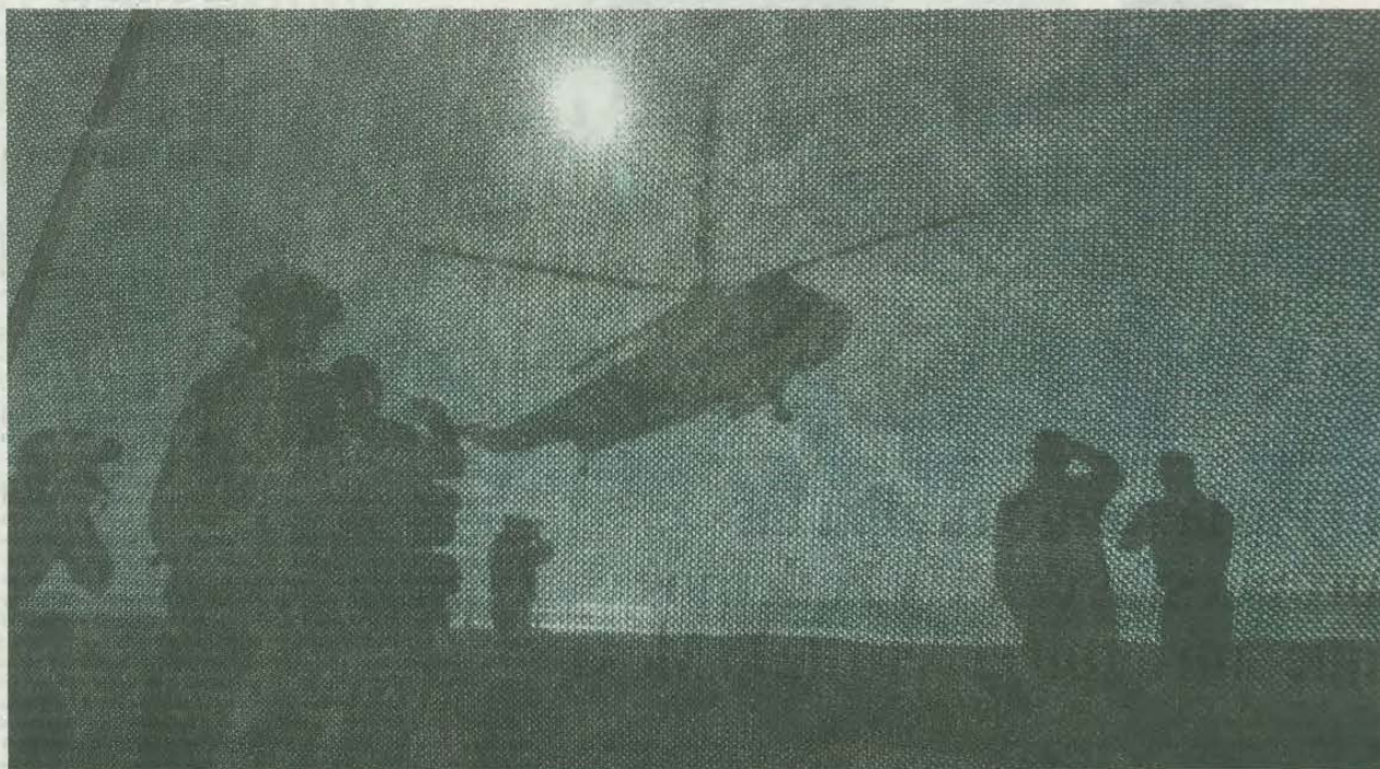
Un helicóptero Sea King aterriza para depositar tropas en una zona asegurada por infantes de marina holandeses. La imagen está captada a través de una red mimética de camuflaje.

DEFENSA | LA OTAN SE ADIESTRA PARA INTERVENIR EN TERRITORIO AMIGO FUERA DEL MARCO DE LA ALIANZA ATLÁNTICA