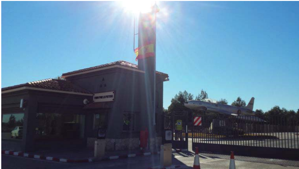
Entrada a la Base Aérea de Albacete

Las maniobras, en las que participan unos 4.000 militares, se llevarán a cabo en la Base Aérea y el Campo de Tiro de Chinchilla