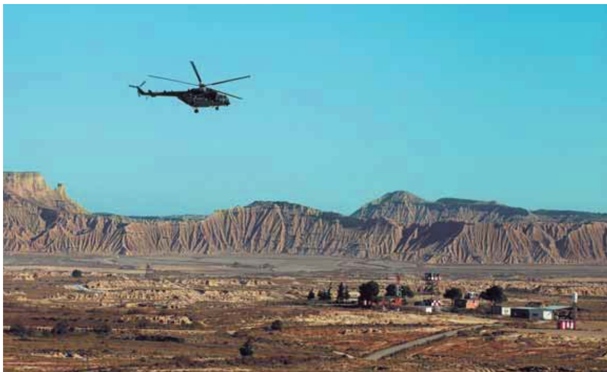
Un helicóptero Mi-171 de la República Checa sobrevolaba ayer el polígono de tiro de Bardenas Reales.