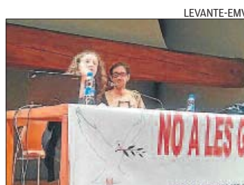
Los ponentes de la charla.