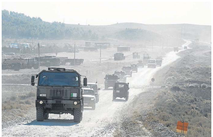
Tráfico de vehículos ligeros y pesados, ayer en el campo de maniobras de San Gregorio.

gística de esta envergadura. Es un hito, y con España como anfitrión. Se trabaja desde el traslado de heridos hasta el suministro de combustible», apunta un portavoz del Ejército de Tierra.