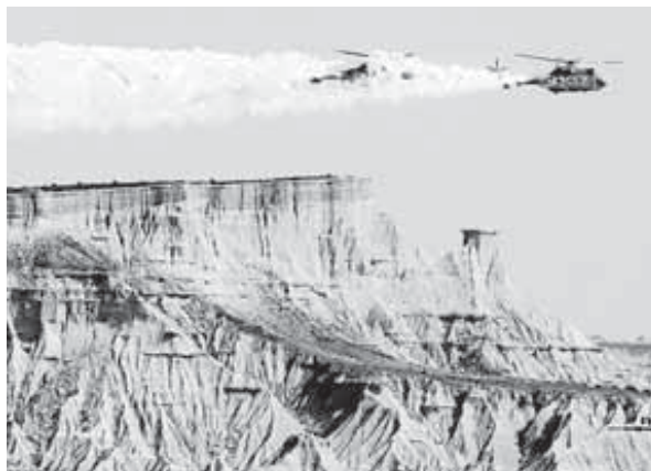
Helicópteros realizan maniobras en el Polígono de Bardenas.

En cuanto a las restricciones de paso a la perimetral, afectan a per-