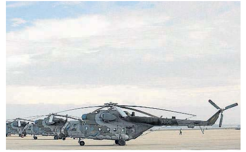
Helicópteros Mi5 de fabricación rusa, de las Fuerzas Aéreas de la República Checa. Hay cuatro desplegados en la Base de Zaragoza.