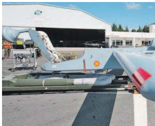
Los UAV del Ejército participaron en misiones en Afganistán

El objetivo de estas maniobras, que están planificadas entre el 3 de octubre y el 6 de noviembre, es el de adiestrar y certificar una