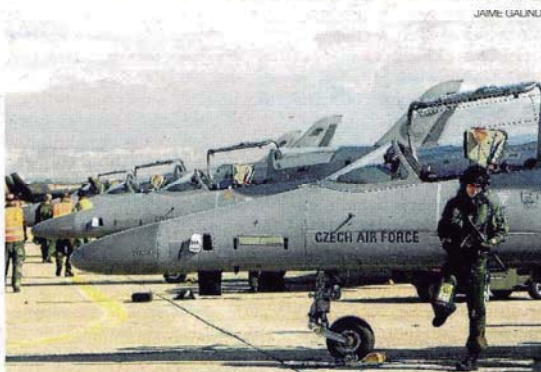
►► Los checos han traído hasta seis cazas Alca, de fabricación propia.

La Base Aérea de Zaragoza alberga estos días una colección de aeronaves de combate internacionales que haría las delicias de cualquier aficionado a la aviación. A diario, parten para prácticas de bombardeo en el campo de Bardenas, lanzamientos de paracaidistas hasta en el campo albaceteño de Chinchilla o de todo tipo en San Gregorio. En los entreactos, la pista de la base parece un pequeño museo aeronáutico.