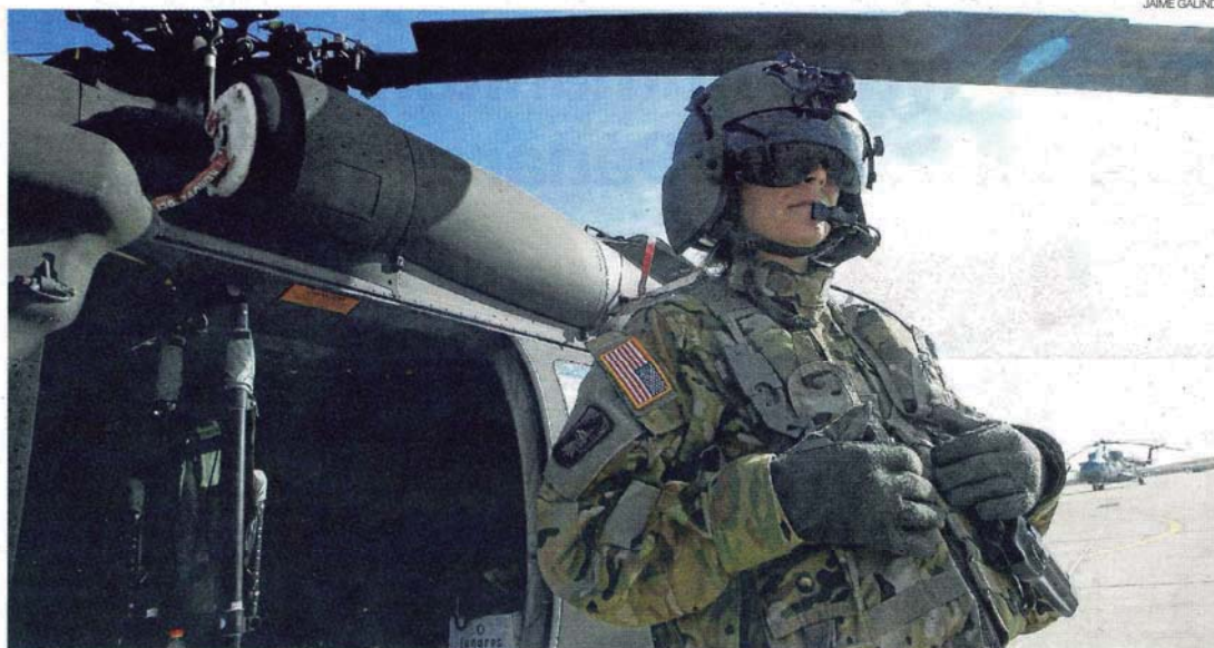
►► Una piloto estadounidense posa frente al helicóptero Black Hawk que utiliza en estas maniobras.

LA FASE REAL DEL EJERCICIO 'TRIDENT JUNCTURE'