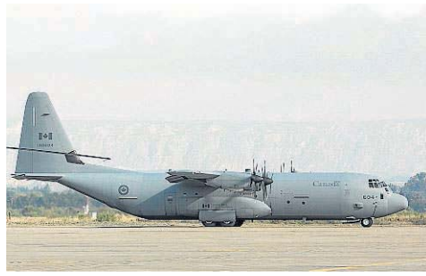
Hércules C-130, aviones de transporte. Hay cuatro de las USAF, uno de Canadá (foto) y otro de Italia. Ayer llevaron paracaidistas.