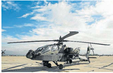
Helicópteros Apache de la 12 Cía. de Combate de las USAF destinados en un cuartel de Alemania. Su misión es ataque. Hay cuatro.

● Seis Hércules trasladaron ayer paracaidistas al campo de Chinchilla (Albacete)