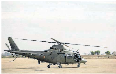
Helicópteros Augusta Westland 109. Pertenecen a las Fuerzas Aéreas de Bélgica, aunque son de fabricación italiana. Hay cuatro.