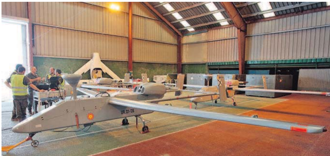
Aviones no tripulados de Defensa en uno de los hangares del aeródromo de Rozas, listos para las pruebas.