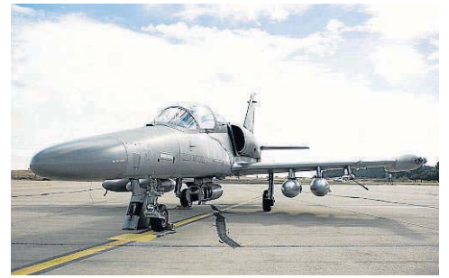
Cazabombarderos Alca 150 de las Fuerzas Aéreas de la República Checa. Hay cinco aparatos estos días en la Base de Zaragoza.