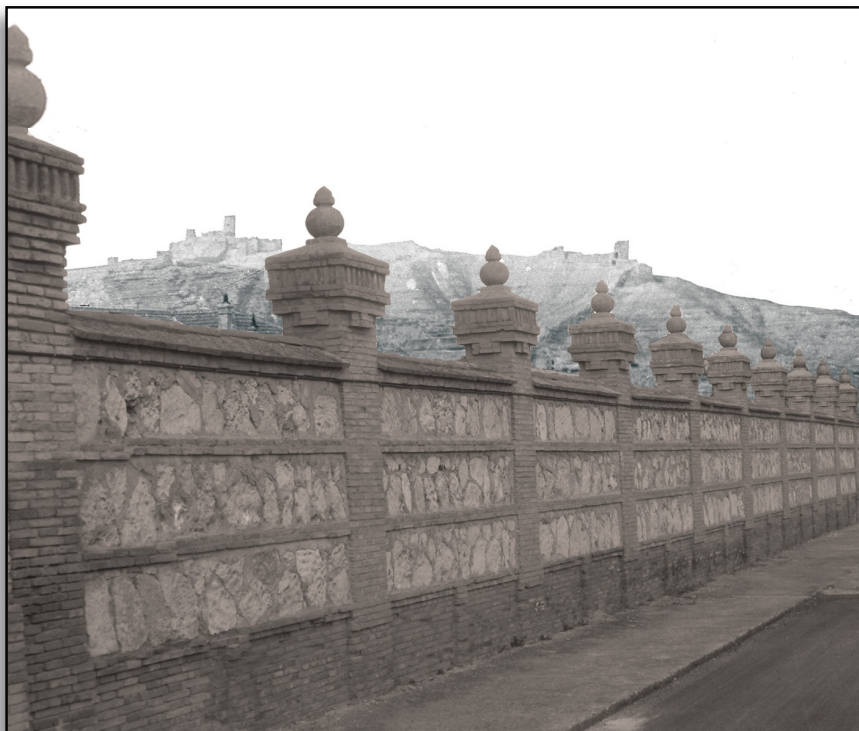
Paño de la tapia del Acuartelamiento conservado en su estado original. Al fondo silueta del Castillo de Ayub

El acuartelamiento que alberga a la Academia se denomina en la actualidad “Barón de Warsage”, en honor al héroe bilbilitano y noble defensor de los Sitios de Zaragoza durante la Guerra de la Independencia. Data de 1926, y en sus orígenes se denominó “Infante D. Jaime”, siendo su primer ocupante el Regimiento de Artillería Ligera nº 12. Después de servir de guarnición, sucesivamente, a los Regimientos de Artillería nº 5, al nº 10, al nº 45, al Antiaéreo nº 73, al Destacamento del Parque Central de Ingenieros y al Instituto Politécnico del Ejército de Tierra nº 2, finalmente, el acuartelamiento es ocupado por la Academia de Logística, creada el 6 de Noviembre del 2001, integrando en ella, a su antecesor en la plaza, el mencionado Instituto Politécnico nº 2 ,junto a su homólogo, el Instituto Politécnico nº 1 y a la Escuela de Logística, estos últimos de guarnición en Madrid.