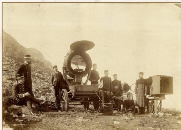
Estación óptica de Denia, 1900

El 20 de diciembre de 2013, la Organización de las Naciones Unidas (ONU), en su 68ª Asamblea General proclamó 2015 como el Año Internacional de la Luz y las Tecnologías basadas en la Luz. El Año Internacional de la Luz pretende difundir en la sociedad la importancia de la luz y de sus tecnologías asociadas en áreas tan importantes como la energía, la sanidad y las comunicaciones, aplicaciones que pueden ser objeto de estudio a través de los documentos de este Archivo.