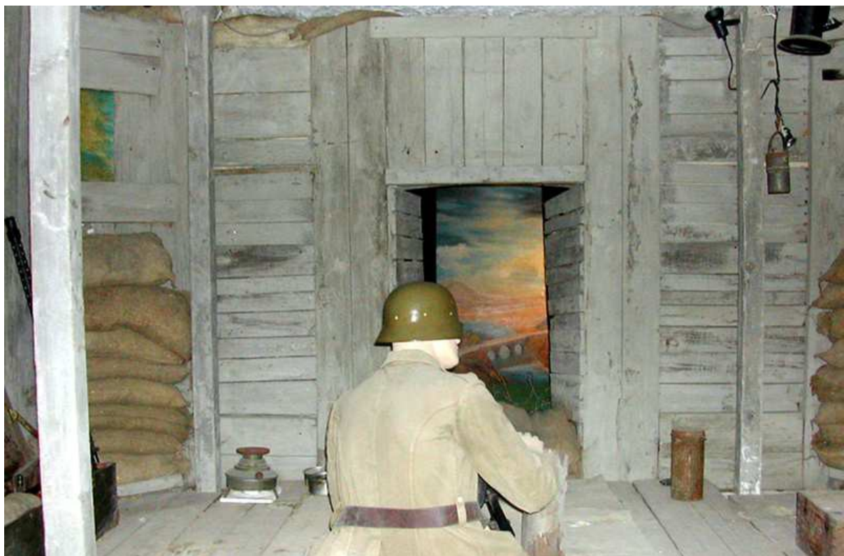
Recreación de una posición defensiva

Pues bien, a través de esta ventana podemos contemplar una detallada reproducción de un puesto de tiro en una trinchera. Se ha dispuesto un juego de luces, que permite al visitante apreciar los distintos elementos que componían las posiciones defensivas durante la primera mitad del siglo XX.