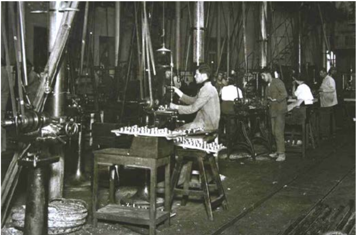
Fotografía de los alumnos de la antigua escuela de artes y oficios

Sobre las paredes se han dispuesto una serie de paneles armeros con fusiles ametralladores, pudiéndose ver desde el más antiguo, un Fiat Revelli italiano de 1.908, hasta el FAO español de 1.955. En uno de los paneles se presentan cuatro fusiles, de ellos dos con alza telescópica.