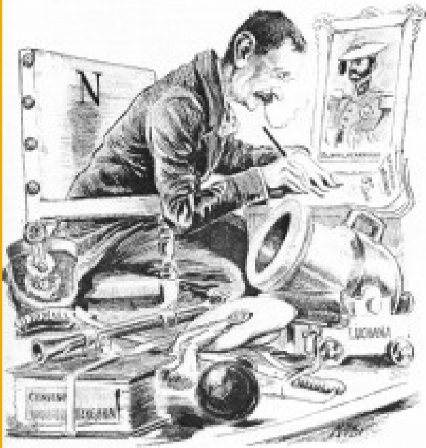
Caricatura de Galdós en Madrid

Este año 2021, el Museo del Ejército se suma a las celebraciones que han marcado el último año en torno a la figura y obra del genial escritor canario D. Benito Pérez Galdós, uno de los principales representantes de la novela del s. XIX y XX. Para ello, en septiembre el Museo abrirá las puertas de una nueva exposición temporal titulada “Galdós en el Museo del Ejército. La guerra de la Independencia a través de los Episodios Nacionales”. A través de ella, descubriremos algunas de las facetas menos conocidas de Galdós, como era su afición al arte y los museos, la inspiración que pudo encontrar en las salas y piezas expuestas en los museos militares de Madrid, su cercanía y admiración a la vida militar y los valores castrenses y, también, su devoción por la ciudad histórica de Toledo y su edificio más emblemático, el Alcázar, sede de nuestro museo.