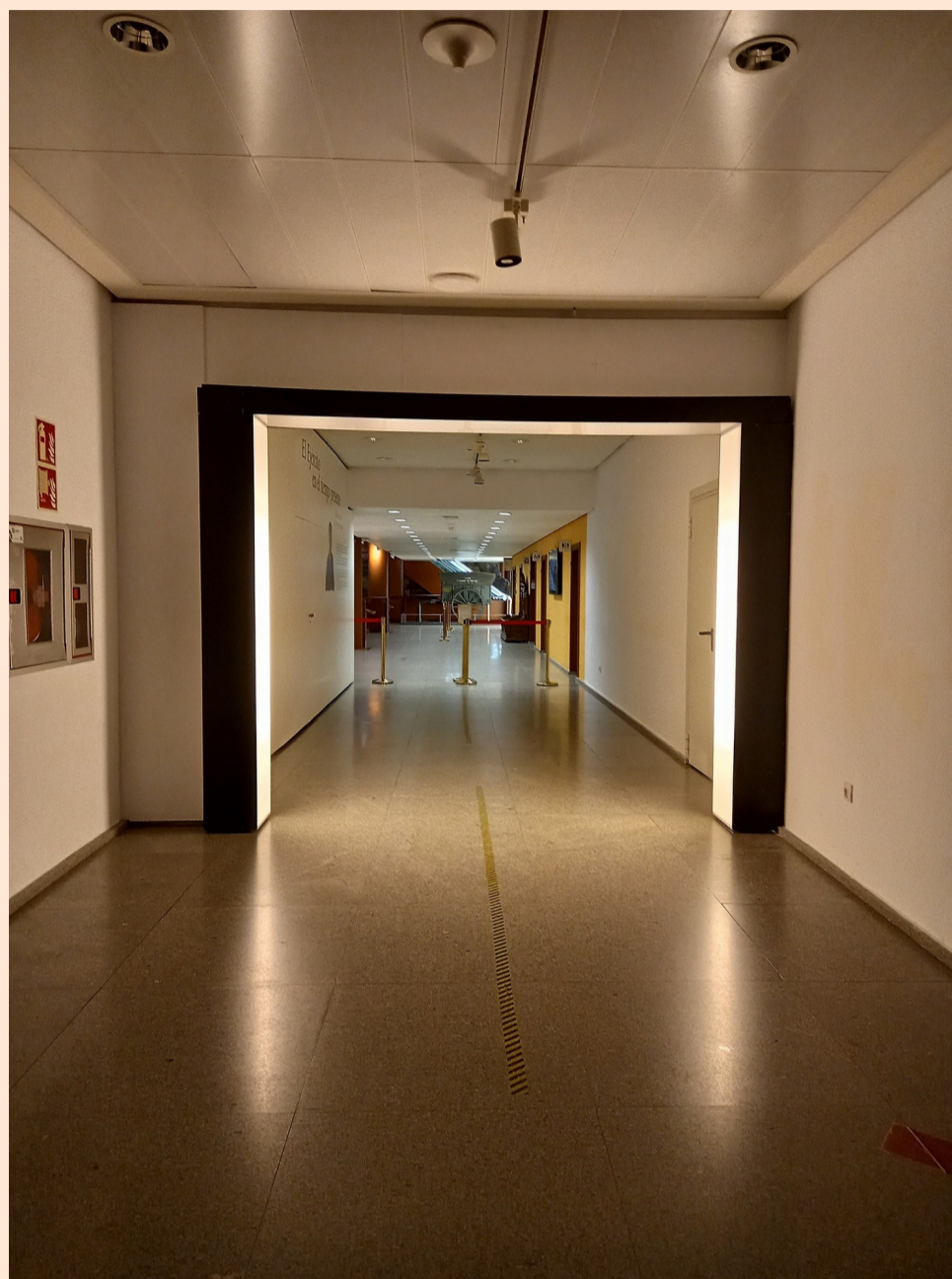
Vestíbulo de entrada a la Exposición Temporal sobre Galdós

La Literatura es una importante fuente de información para los historiadores y si pretendemos conocer el siglo XIX, uno de los escritores imprescindibles es Benito Pérez Galdós. Sus novelas, como Los Episodios Nacionales, son un fiel reflejo del ambiente social y político de este periodo.