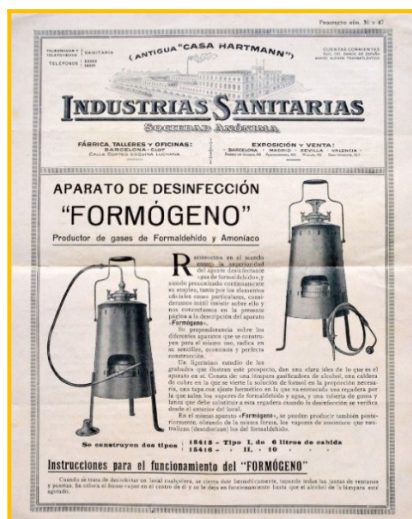
Folleto publicitario de finales de la década de 1920 de Industrias Sanitarias SA de Barcelona.

Hasta principios de la década de 1950 fue muy utilizada la desinfección con formógeno.