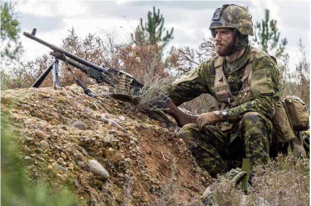
Un militar canadiense observa posibles movimientos enemigos en el marco de una patrulla