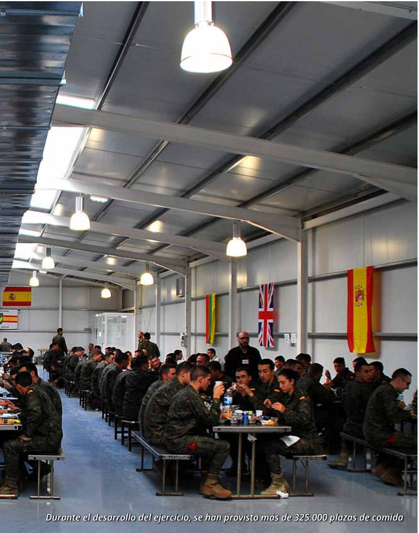
Durante el desarrollo del ejercicio, se han provisto más de 325.000 plazas de comida