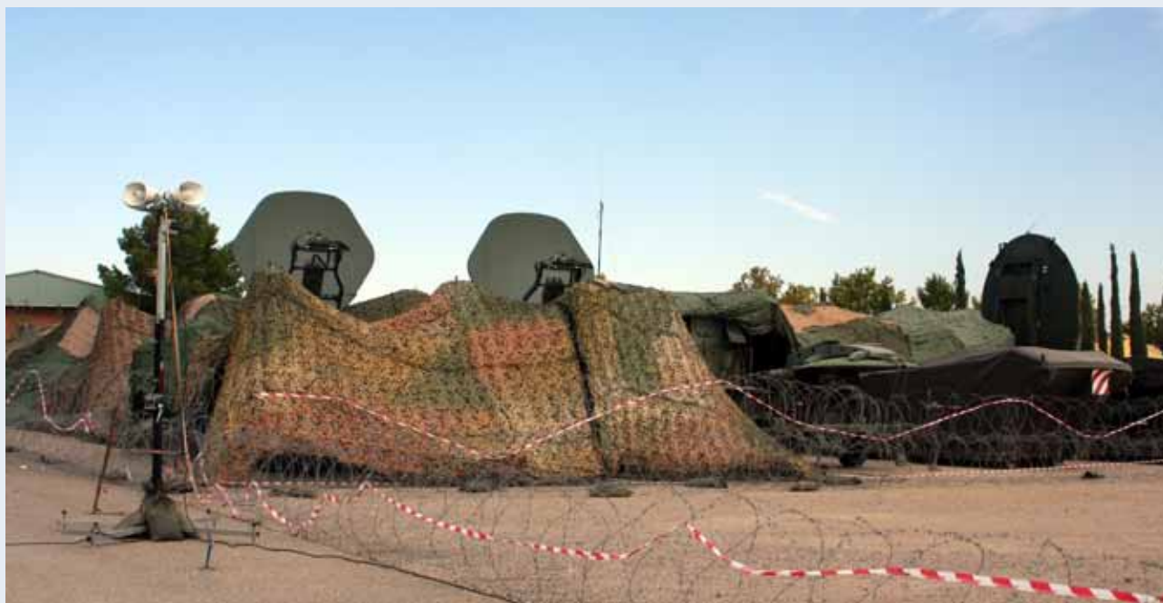
Material de la Brigada de Transmisiones instalado en el CENAD "San Gregorio"

La aportación de la Brigada de Transmisiones al ejercicio se completó con personal del Regimiento de Guerra Electrónica nº 31. ■