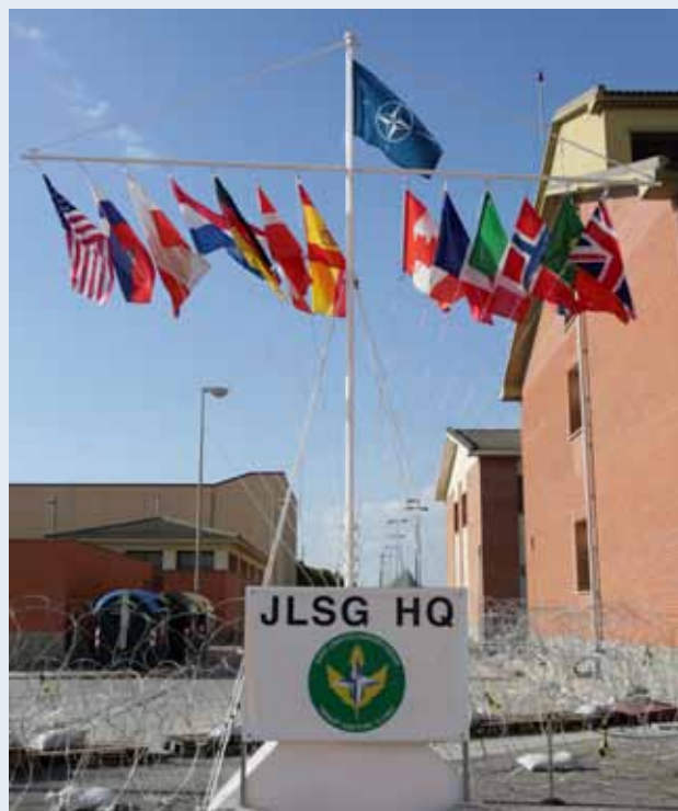
Instalaciones del JLSG HQ, en Zaragoza

Una parte importante del trabajo de la BRILOG en este ejercicio ha sido el de la recepción del personal participante y del material utilizado. Una labor que no se improvisa y que, por el contrario, hizo que entrara en eficacia el 24 de agosto, prácticamente un mes y medio antes del comienzo de la fase de puestos de mando (CPX).