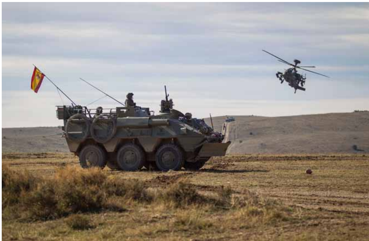
El Ejército de Tierra español ha desempeñado un papel fundamental en el "Trident Juncture"

En "Chinchilla", donde desplegaron unos 2.400 militares, la Brigada estaba liderada por el Reino Unido, y contaba con batallones danés, italiano y británico. Durante la operación realizaron acciones ofensivas, defensivas y de retardo. Asimismo, los equipos operativos del Grupo IV del Mando de Operaciones Especiales (MOE) realizaron reconocimientos especiales y acciones directas, combinando la inserción y extracción mediante helicópteros, con la movilidad por vehículos tácticos. En este caso, actuaron como fuerzas de oposición dos compañías de Regimiento