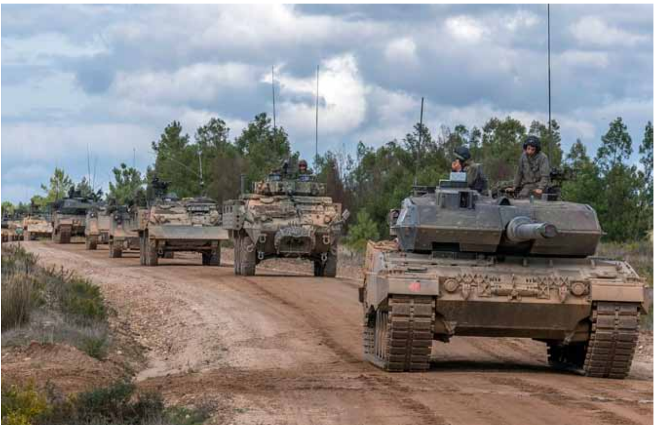
Carros de combate y otros vehículos portugueses recorren uno de los escenarios del ejercicio