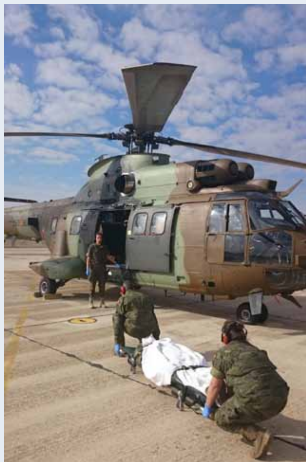
Evacuación aérea asistida en un helicóptero

dades de asesoramiento en Farmacia, Veterinaria, Enfermería y Psicología. Esta unidad ha tenido su base en el acuartelamiento "Cavalcanti" (Madrid) y se ha generado sobre la base del Cuartel General de la BRISAN. La Unidad de Veterinaria ha tenido su base en la Base Discontinua "San Jorge" (Zaragoza), donde se ubica, entre otras unidades, la Agrupación de Sanidad nº 3. Además, personal de la Brigada ha desplegado en el Centro de Coordinación de Apoyo Sanitario. Todo ello ha implicado a unos 150 militares de la BRISAN. ■