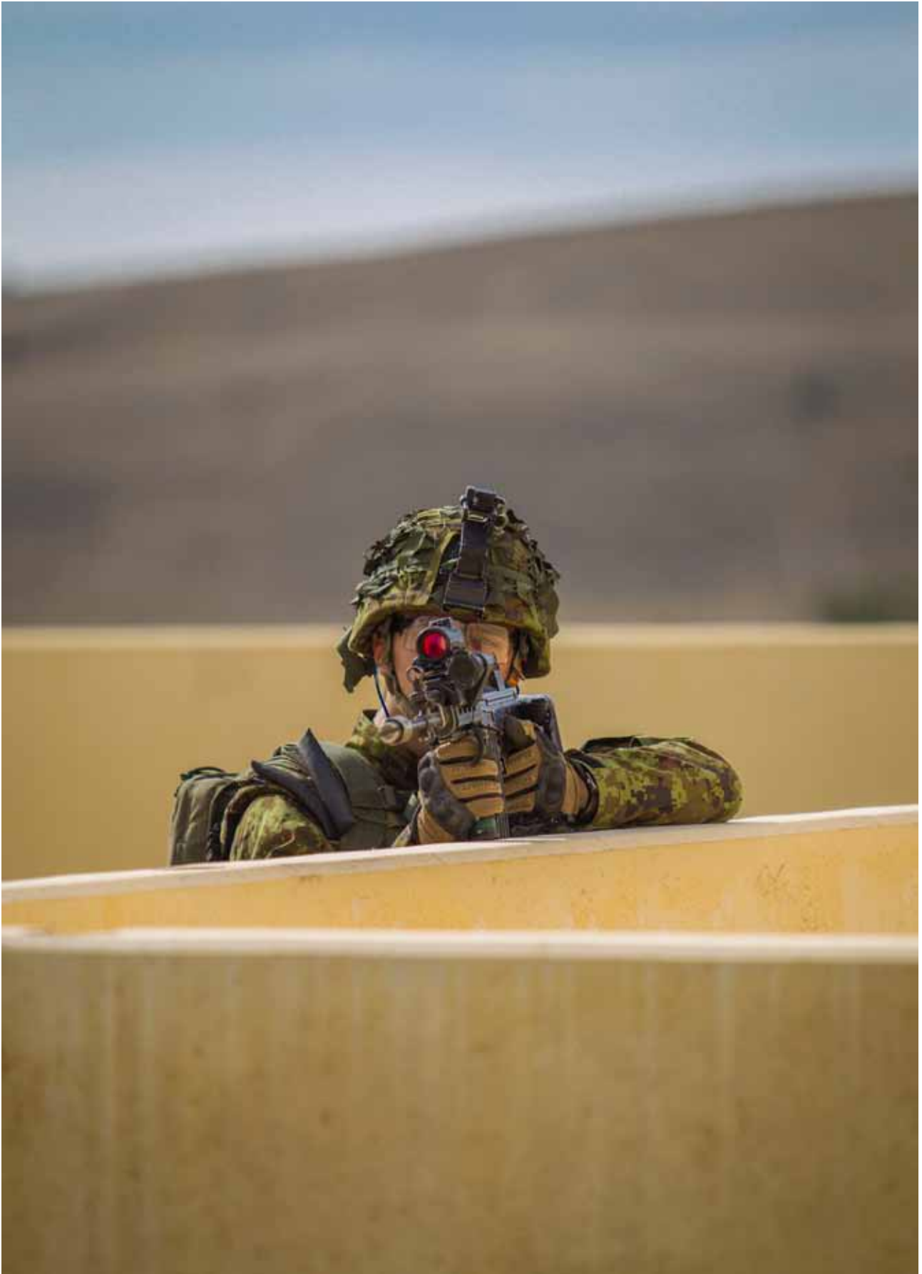
Un componente del Batallón Báltico se instruye en combate en zonas urbanas