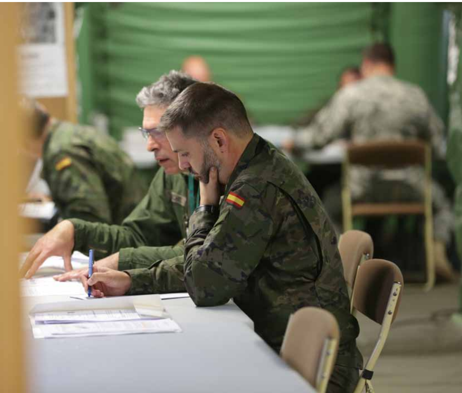
Un militar español y otro francés, trabajando juntos en el ejercicio "Trident Juncture"

mo) y en su flanco este (a raíz de la crisis de Ucrania).