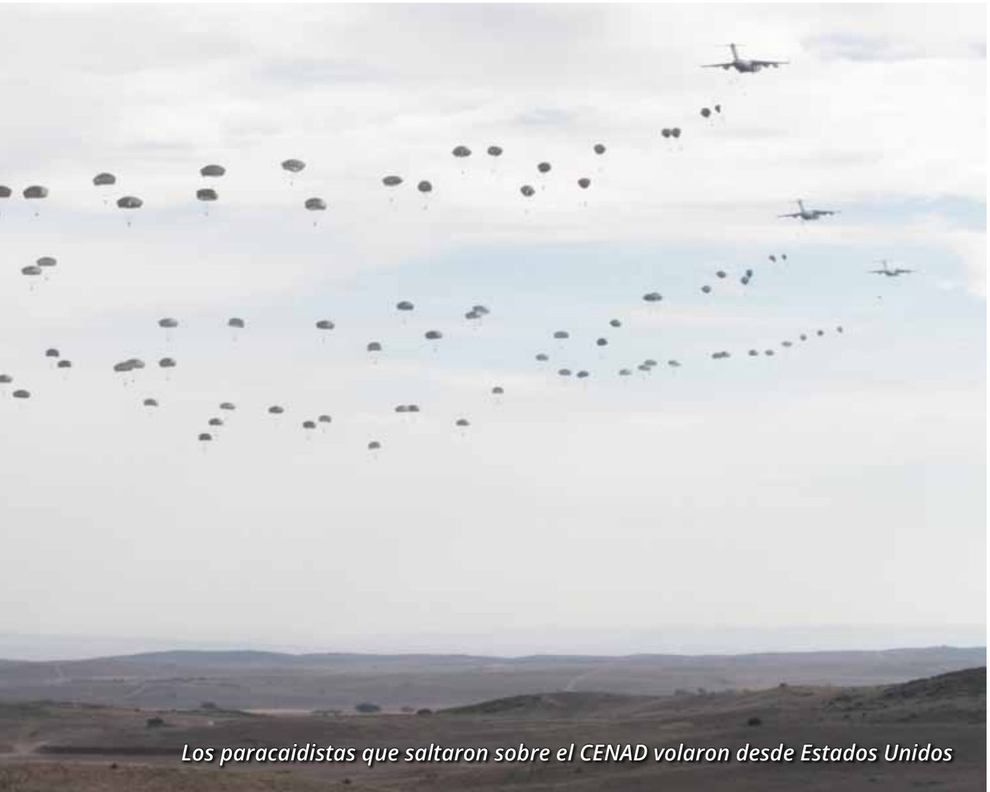
Los paracaidistas que saltaron sobre el CENAD volaron desde Estados Unidos

transportada estadounidense, junto a una sección de la Brigada Paracaidista (BRIPAC). Todos ellos, incluidos los paracaidistas españoles, habían volado directamente desde su base de Fort Bragg, ubicada en Carolina del Norte, durante más de 10 horas, para lanzarse