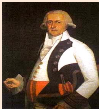
General Gutiérrez (Museo Histórico Militar)