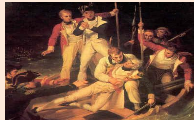
Copia de “Horacio Nelson herido” de Richard Westall (Museo Militar)