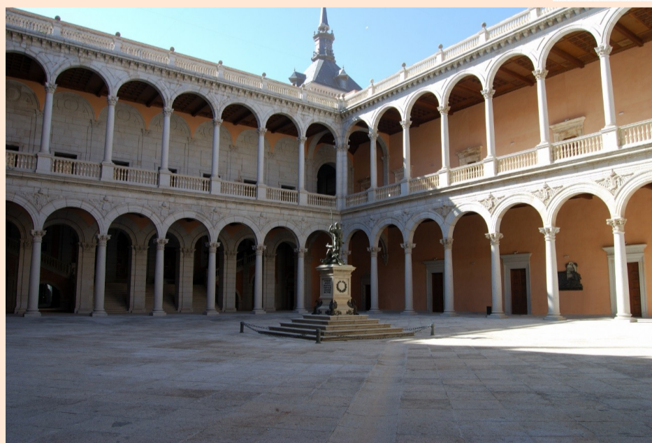
Patio de Carlos V del edificio Alcázar, sede del Museo del Ejército.

La entrada al museo y a las actividades culturales es gratuita.