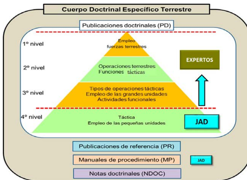
Cuadro resumen de las responsabilidades de la JADCAB en cuanto al Cuerpo doctrinal del ET

La JADCAB aporta personal experto para la elaboración de las publicaciones doctrinales de 1.º, 2.º y 3.º nivel y es responsable de elaborar las de 4.º nivel que se le encomiendan, que son: las específicas del Arma de Caballería y todas aquellas relacionadas con acciones militares tácticas o funciones tácticas en las que la Caballería juega un papel relevante. A ellas hay que