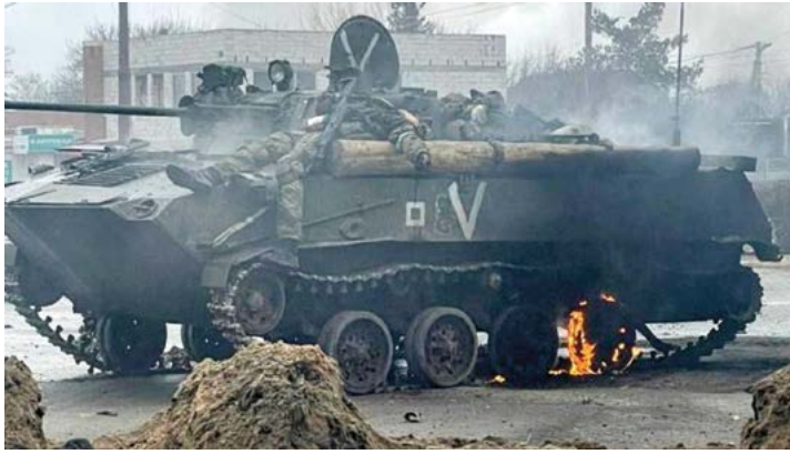
Un BMD-2 ruso de la 31.ª Brigada de Asalto Aéreo de la Guardia destruido durante los combates por el aeropuerto de Hostómel, 24 y 25 de febrero de 2022. El fracaso de la acción aerotransportada desbarató el plan ruso para controlar el país en unas semanas