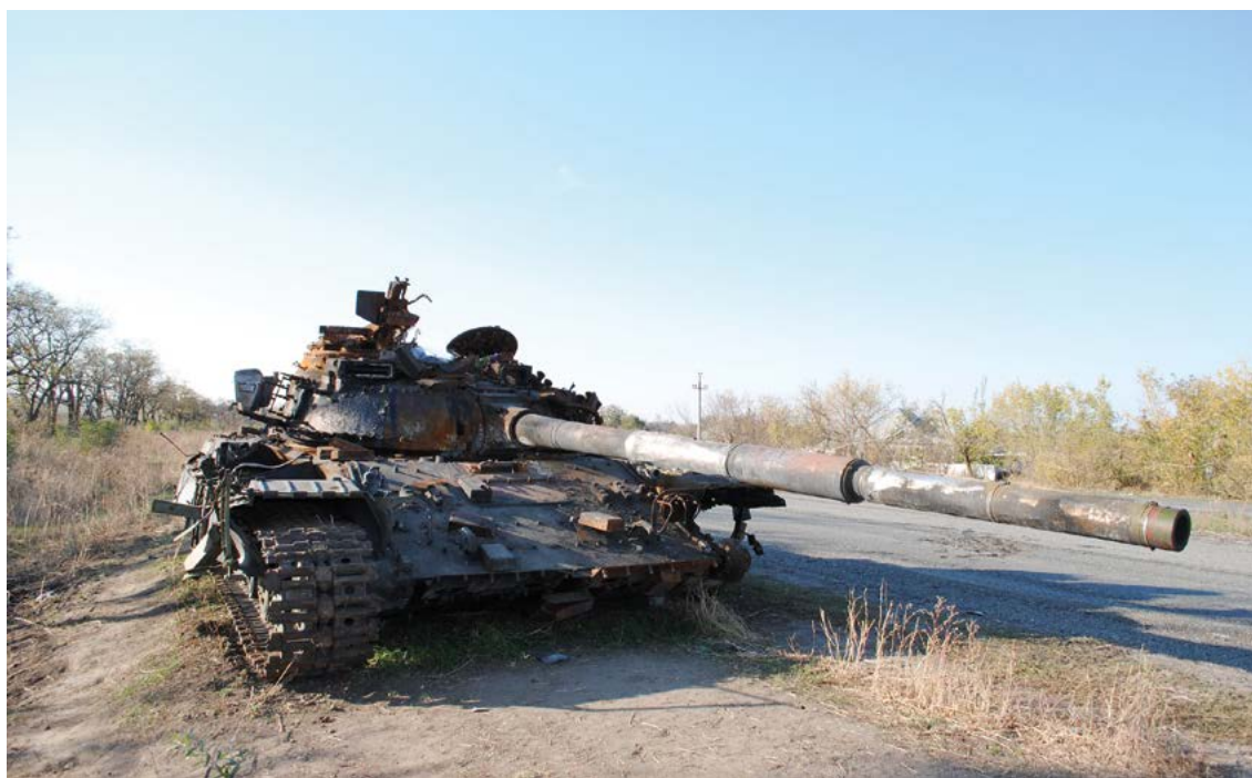
Carro de combate destruido en las cercanías de Donbass.

LOGISTICA. Se mantienen sus carencias estructurales debidas a lo reducido de sus medios de apoyo orgánicos y se acrecientan sus problemas debido a la enorme heterogeneidad de los materiales —ruedas y cadenas, diferentes modelos de carros, diferentes modelos de piezas de artillería, etc.— sin un respaldo logístico adecuado. Al haber optado por recuperar material procedente del almacenamiento de larga duración para reemplazar las numerosas bajas, se da habitualmente el caso de tener en un mismo BTG mezclados materiales de diversos modelos. Esto en principio no es una buena idea, ya que no se debe olvidar que la familia T-64 / T-80 presenta notables diferencias con la T-72 / T-90 lo que complica el mantenimiento en los BTG dotados de materiales de ambas familias.