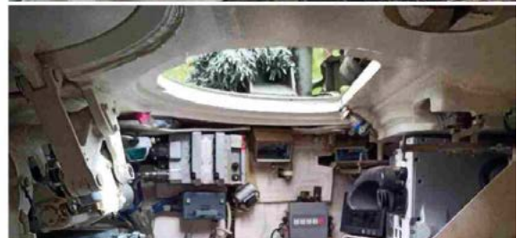
Carro de combate T-90M capturado por fuerzas ucranianas en las inmediaciones de Járkov. Información difundida el 20 de septiembre de 2022 (Wikipedia). Aunque el mes de septiembre queda fuera del periodo de tiempo estudiado en este artículo, el caso de este T-90M ilustra a la perfección la combinación de diseños obsoletos, falta de medios de recuperación y doctrina mal aplicada. El carro no parece haber sido abandonado apresuradamente por una tripulación en pánico. Mas bien parece haber sido preservado y ocultado con todo cuidado, a la espera de poder ser recuperado por las fuerzas propias