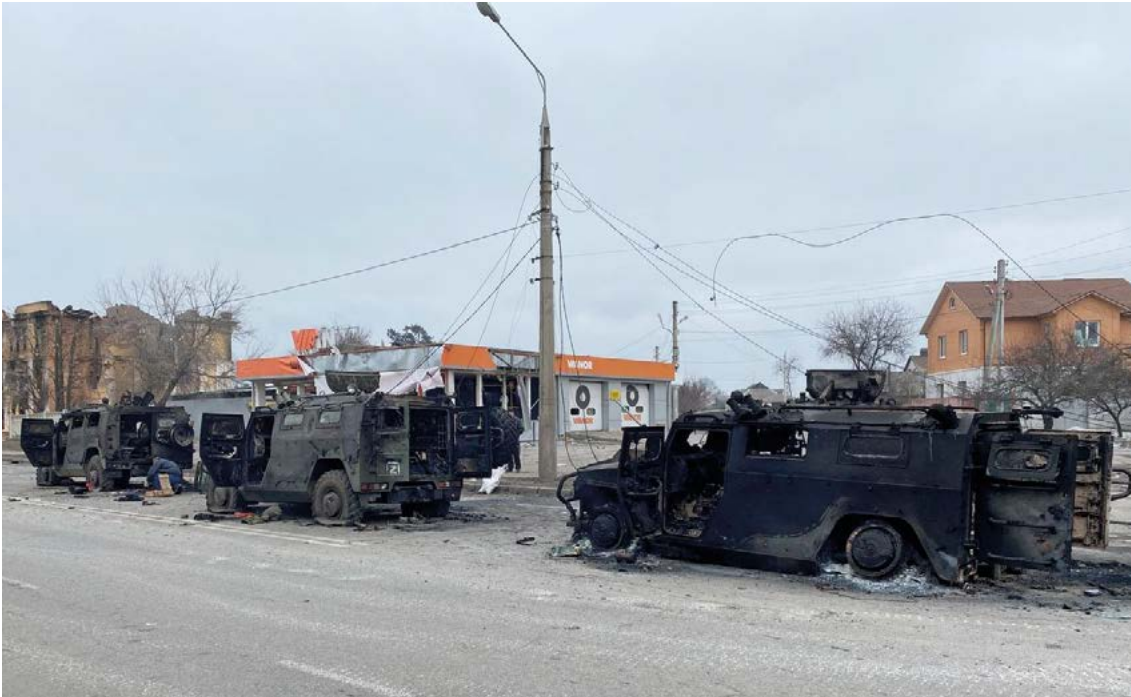
Columna de vehículos GAZ-2975 Tigr destruidos durante los combates en Járkov, 28 de febrero de 2022 (Wikipedia). La entrada de las tropas rusas en Járkov en febrero de 2022 fue un ejemplo de errores de planeamiento y descoordinación. Columnas de vehículos débilmente blindados, sin apoyos de ningún tipo ni preparación artillera previa, se internaron imprudentemente en la ciudad. Fueron fácilmente destruidos por equipos ucranianos armados con armas contracarro. Posiblemente esperaban otro tipo de recibimiento

y capturados, más o menos intactos, por el ejército ucraniano. Se habló de negligencia, cuando no directamente de cobardía o traición. Quizás la explicación puede ser más compleja. Una combinación de diseños obsoletos, falta de medios y doctrina mal aplicada. Los carros exsoviéticos tienen una electrónica relativamente compleja, pero carecen de capacidad de autodiagnóstico. Cuando un carro occidental moderno se detiene sin motivo aparente, el propio carro, mediante la autodiagnóstico, puede determinar qué sistema ha fallado, acotar la avería e informar —automáticamente— sobre el fallo para que los equipos de mantenimiento acudan con el módulo correspondiente y lo reemplacen. En los carros exsoviéticos el carro se para y la tripulación no es capaz de saber qué es lo que ha fallado. No hay autodiagnóstico. Por otra parte, el personal de mantenimiento es relativamente escaso. Los especialistas son muy pocos —quizás los excelentes especialistas que había antiguamente hayan terminado fugados a la empresa civil rusa o extranjera— encuadrados en muy escasas unidades de mantenimiento y recuperación. Y el mando ucraniano lo sabía y por ello clasificó esas unidades como objetivos de alto valor y primó su localización y destrucción. Ello obligó al mando ruso a apartarlas de la primera línea, ubi-