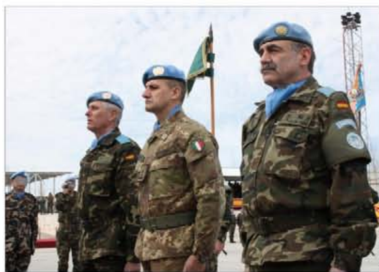
Los generales entrante y saliente, junto al jefe de la FINUL

da de Infantería Mecanizada (BRIMZ) "Extremadura" XI; ahora recogen el testigo los del XVI contingente, en el que destaca la presencia de los legionarios del Tercio "Duque de Alba"—unidad que aporta la mayoría de los integrantes—, a los que se unen militares