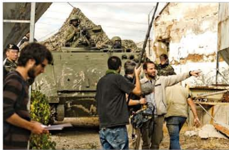
El Ejército aportó varios vehículos para el rodaje del corto