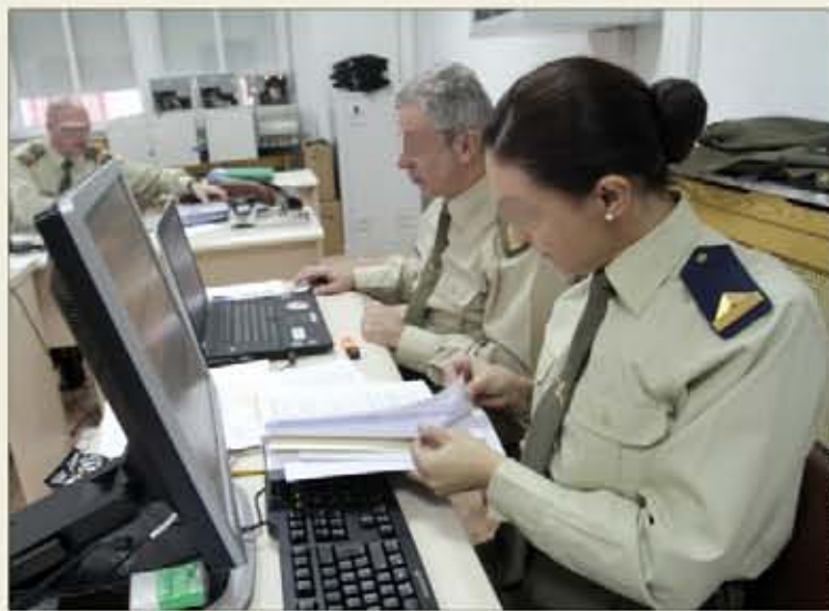
El primer paso es examinar todos los expedientes

El 14 de febrero comenzó el periodo de trabajo de las juntas, y la previsión es que, en torno al 22 de marzo, tengan los primeros resultados provisionales, que po-