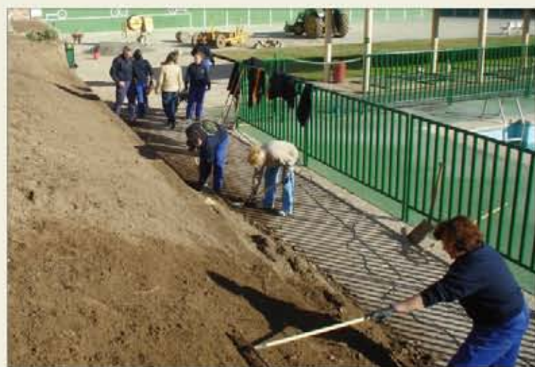
Los alumnos del taller de jardinería de “La Sislea”, trabajando

turas, en los que se podrían introducir aspectos de las nuevas tecnologías (eficiencia energética, energías renovables). «Luego, habría que tener en cuenta las nuevas “apetencias” del mercado laboral actual; quizá habría que inclinarse por oficios relacionados con las artes gráficas, los museos, las bibliotecas y los archivos», aventura el teniente general Asensio. Aunque el futuro de las escuelas-taller aún no esté concretado, lo que sí está clara es la implicación del Ejército: «Estamos muy interesados no sólo en su pervivencia, sino también en que se potencien», afirma el jefe del MAPER.