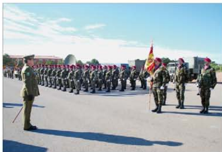
La parada militar del acto central de aniversario fue en Marines

Todas las unidades dependientes de la Brigada de Transmisiones estuvieron representadas, el 20 de enero, en el patio central de la base "General Almirante", en Marines (Valencia), para el acto central de celebración del 10º aniversario. El día anterior se organizó un concierto conmemorativo en el Ateneo valenciano, en el que se estrenó la marcha militar BRITRANS , compuesta por el director de la Música del Cuartel General de Alta Disponibilidad. El acontecimiento también dio pie a una exposición fotográfica.