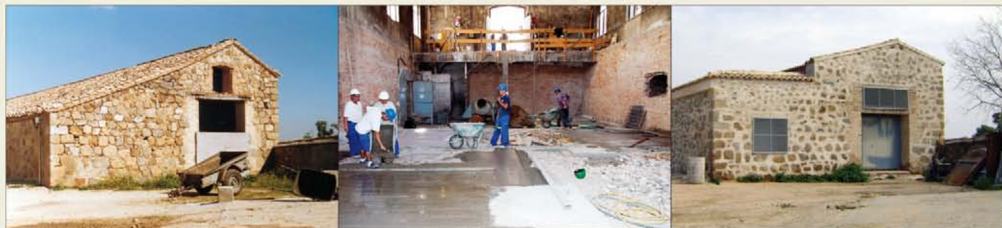
Construcción deteriorada en “La Sislea” (izquierda), trabajos de reconstrucción (centro), y el nuevo edificio realizado por los alumnos de la escuela-taller (derecha).

La vertiente humana, una vez más, supera a la material y hace que, la evidente ventaja que para las infraestructuras del Ejército suponen las escuela-taller, palidezca ante la encomiable «labor social» que estas realizan.