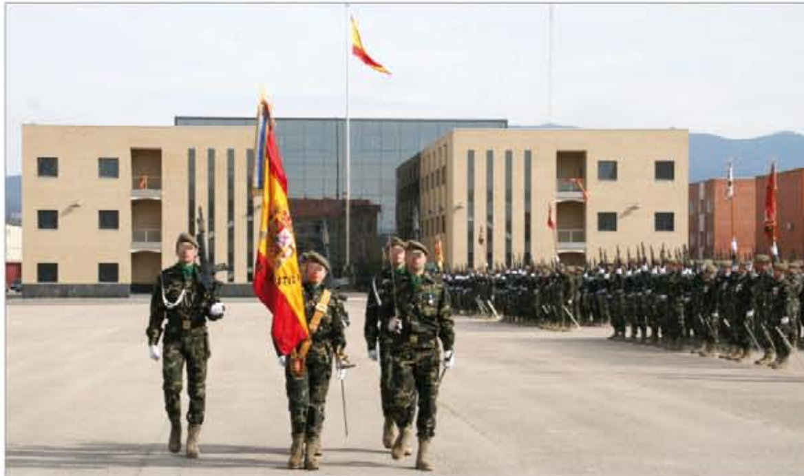
El acuartelamiento "Barón de Warsage" acogió una parada militar en honor de San Juan Bosco

Otro de los muchos actos realizados en toda España tuvo como protagonista a la Unidad Logística (ULOG) nº 24, que homenajeó a San Juan Bosco en el acuartela-