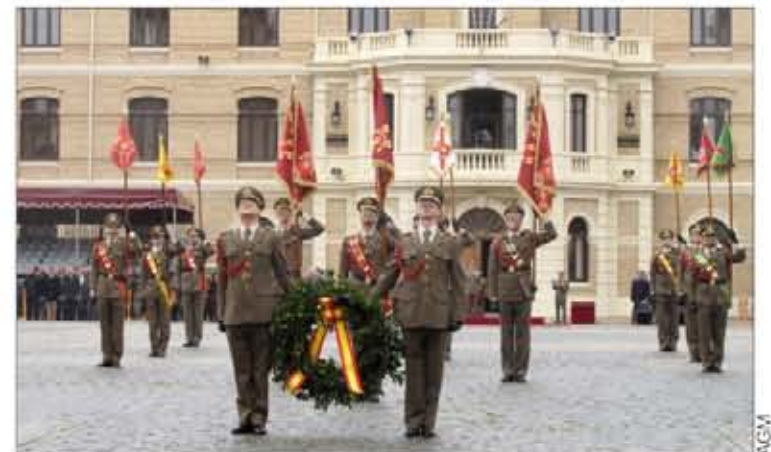
Homenaje a los fallecidos en el atentado de San Juan de los Panetes

Asimismo, conocieron las Salas de Honor de los Regimientos "La Reina" nº 2 y "Córdoba" nº 10.