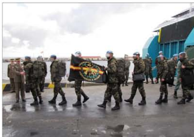
Un grupo de legionarios se despiden, antes de embarcar

Precisamente, la consolidación de la presencia de las LAF al sur del río Litani y en las proximidades de la Línea Azul —el límite establecido, por Naciones Unidas, entre el Líbano e Israel tras la guerra de 2006—, es uno de los cometidos de la FINUL, allí desplegada al amparo de la Resolución 1.701. Esto se traduce en que la asunción de responsabilidades de vigilancia