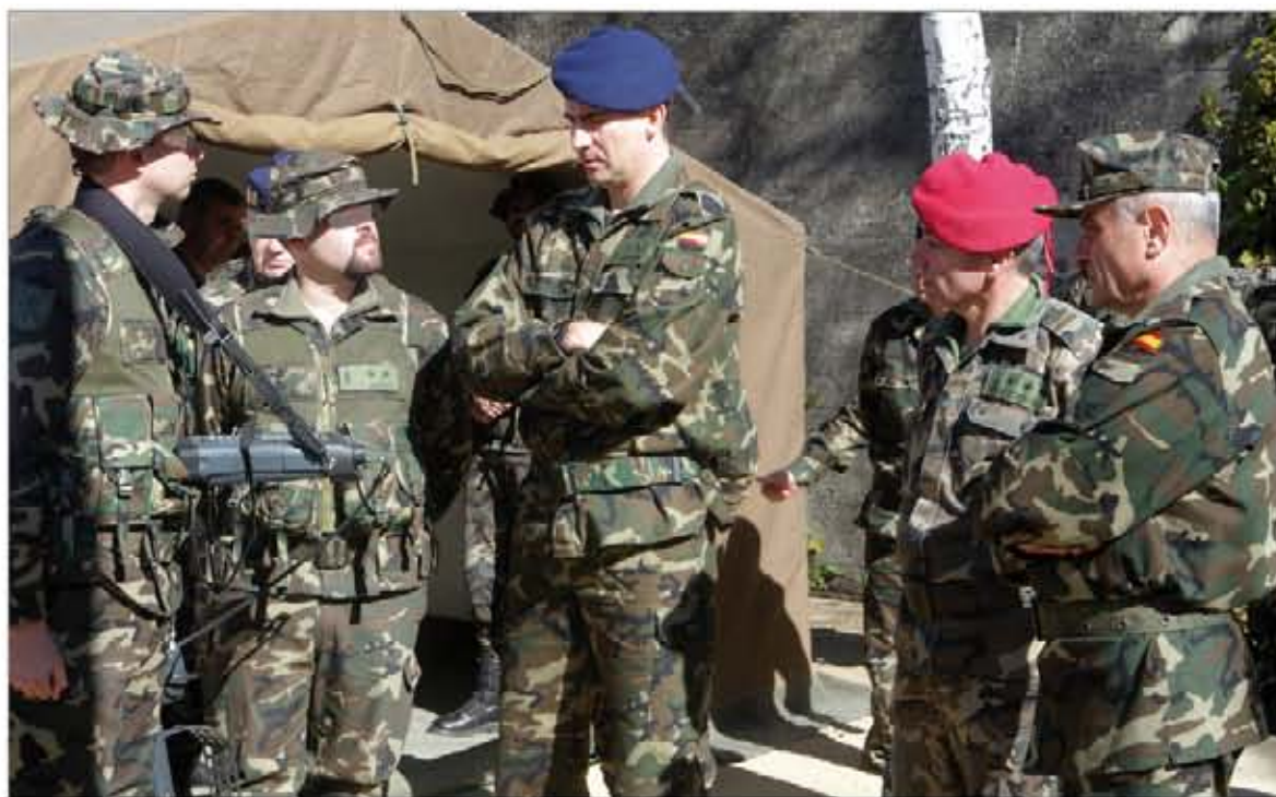
Don Felipe se interesó por los medios de Guerra Electrónica del Regimiento

A su llegada, el Príncipe fue recibido por el JEME, general de ejército Coll, y por los jefes de todas las unidades —incluidos los de la Unidad de Transmisiones del