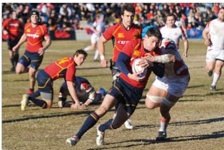
El equipo sueña con un tercer puesto en el europeo

Es difícil saberlo, pero tenemos muchas ganas y mucha ambición. Creo que un tercer puesto sería muy importante.