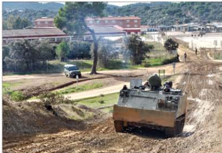
Un TOA se dirige hacia el campo de maniobras "Cerro Muriano"

Los temas tácticos incluyeron despliegues, embarques y desembarques —con una sección de Transportes Oruga Acorazados (TOA)—, prácticas con la torre del Pizarro y seguimiento de movimientos nocturnos con la cámara térmica de estos vehículos de combate, así como técnicas de ataque convencional con una sección mecanizada; todo ello en es-