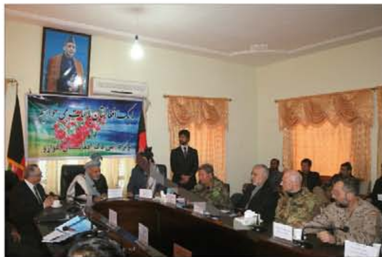
Autoridades civiles y militares se dieron cita en la ceremonia de transición celebrada en Qala-i-Naw