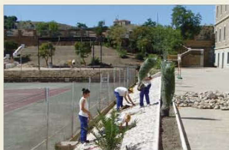
Trabajos de la escuela-taller “La Sista”, en la Academia de Infantería

Las escuelas-taller en el ámbito del Ejército de Tierra arrancaron a finales de los 90. Desde entonces, más de 1.700 desempleados civiles se han formado en distintos oficios. En las páginas centrales les contamos cómo ha funcionado esta singular simbiosis. La marcha del Programa Spike , los nuevos criterios de evaluación, la culminación del proceso de dotación de las unidades con la ametralladora MG-4E y el inicio de las titulaciones técnicas en las Academias son otros temas de “el Ejército informa”. Págs. 7-10