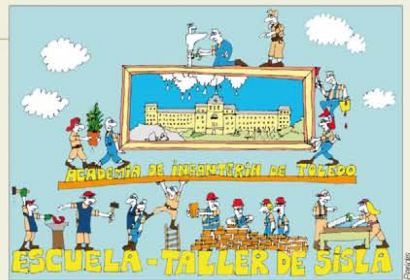
Viñeta sobre las escuelas-taller del calendario del Ejército

En el planteamiento inicial de Peridis , las escuelas-taller en el Ejército se concebían para los jóvenes que realizaban el servicio militar obligatorio, con el fin de facilitar su posterior inserción en el mercado laboral. Sin embargo, por difi-