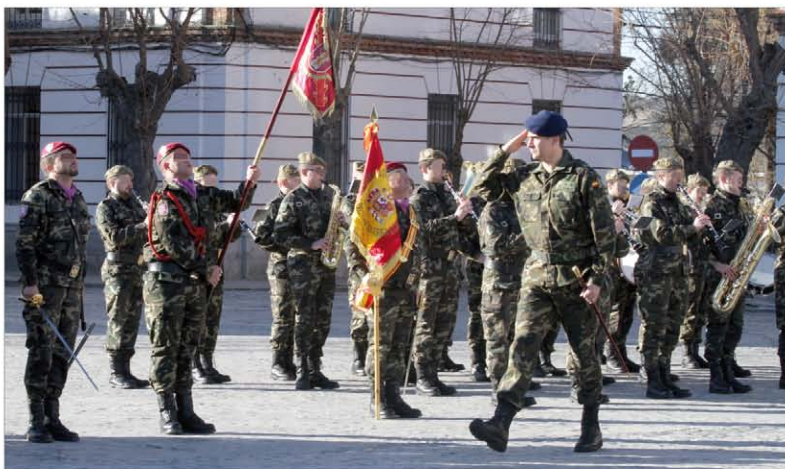
El Príncipe pasó revista a la formación, integrada por personal de todas las unidades que comparten sede en este acuartelamiento

El Príncipe de Asturias recorrió, el 13 de febrero, varios de los talleres que componen el Parque y Centro de Mantenimiento de Material de Transmisiones (PCMMT) y el de Sistemas Hardware y