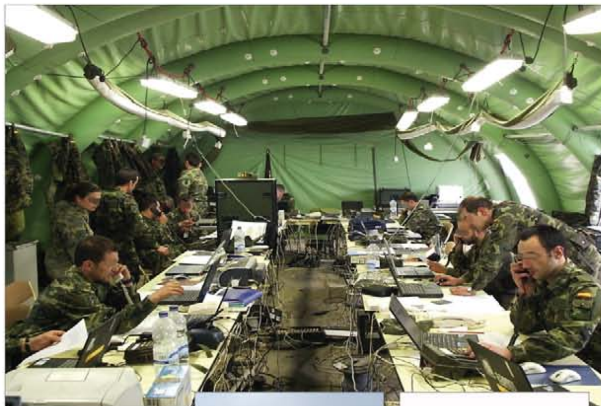
Despliegue de un Centro de Control y Coordinación CIS (arriba). Medios de transmisiones como la estación Extremadura y una antena satélite

El "corazón" de estas estructuras es el Centro de Control y Coordinación de los CIS. Es el elemento principal y esencial de supervisión, gestión y control de los sistemas desplegados en una operación, desde donde se dirige la maniobra táctica y técnica en tiempo real. Pa-