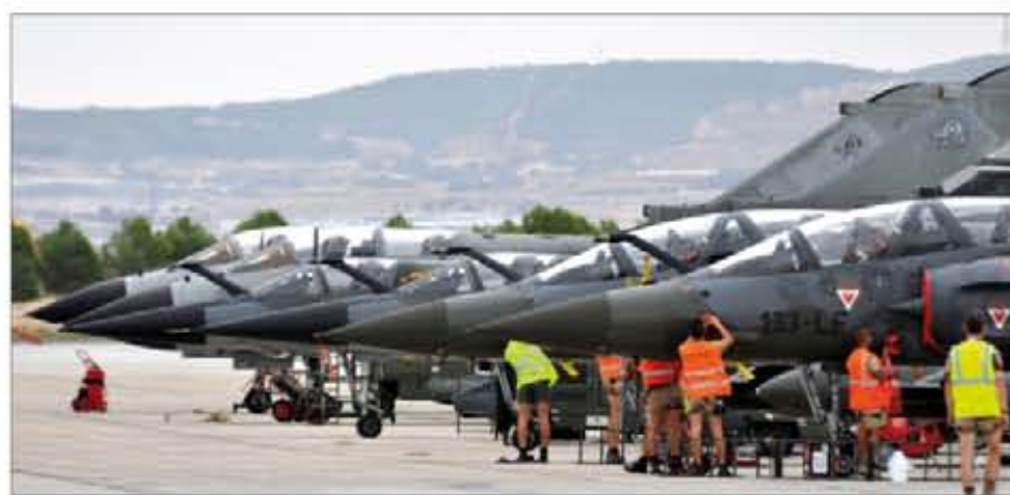
Cazas de combate poniéndose a punto para comenzar el ataque