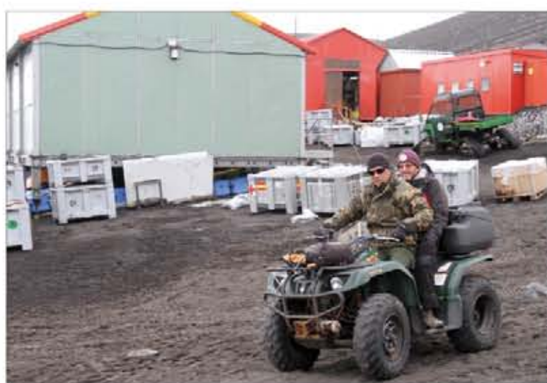
En la radio han explicado cómo es el día a día en la base

A lo largo de sus intervenciones, en las que han participado tanto militares como científicos, se han abordado los objetivos de la misión, las principales investigaciones que se llevan a cabo, cómo es el día a día en Isla Decepción y el reto logístico que supone, así como la evolución de la campaña desde su puesta en marcha hasta la actualidad, etc. De