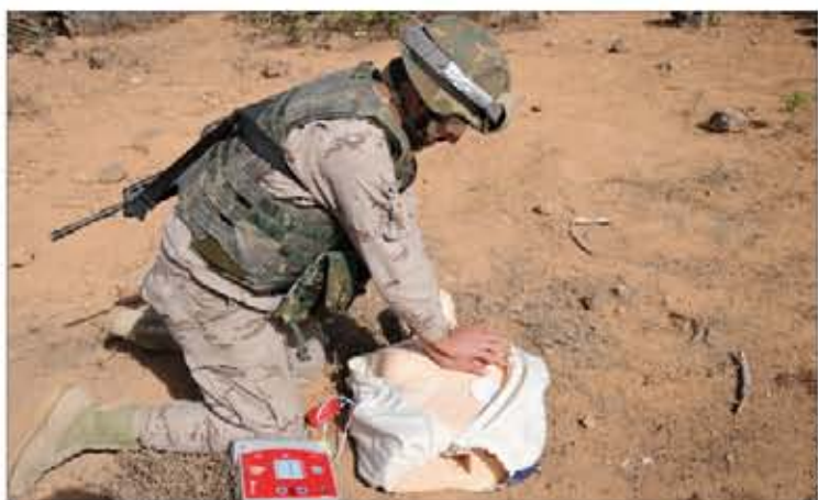
Se practicó la técnica del masaje cardíaco