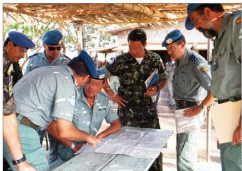
El general Suanzes (sentado) durante una reunión en El Salvador

En un primer momento, la ONUSAL estuvo formada únicamente por una División de Derechos Humanos, pero la firma de los Acuerdos de Chapultepec trajo consigo, a principios de 1992, el establecimiento de una División