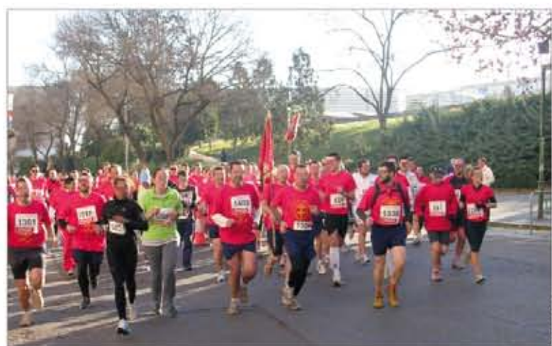
Casi 700 militares participaron en la carrera

La programación del plan se ha hecho para los próximos 5 meses, porque todos son conscientes de que un cambio de actitud no se logra de un día para otro, pero también se muestran optimistas sobre los resultados, incluidos los profesores de la Escuela, para quienes la experiencia es nueva y les ofrece la oportunidad de comprobar la efectividad de sus técnicas.