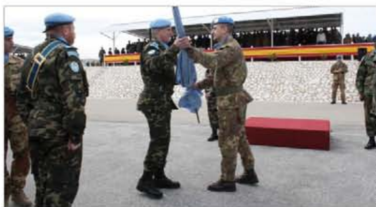
El general Herrero recibe la Bandera de Naciones Unidas

El primer contingente formado sobre la base de unidades de la Comandancia General de Ceuta ha tomado el relevo en la misión de Naciones Unidas en el Líbano. El acto de traspaso de autoridad tuvo lugar, el 12 de febrero, en la base “Miguel de Cervantes” de Marjayoun. Pág. 11