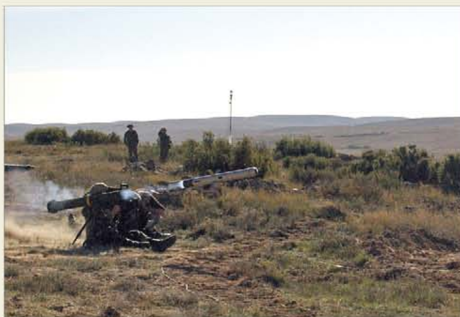
Lanzamiento de un misil Spike, en 2009, en el CENAD "San Gregorio" (Zaragoza)

adquirido tres tipos de simuladores distintos para entrenar a los operadores del sistema: uno mecánico (MT), que sirve para practicar la manipulación del misil; otro de campo (ODT), que permite el entrenamiento de todas las acciones, excepto el disparo, en condiciones reales; y otro de sala (IDT), el más complejo, que permite adiestrarse en todas las etapas del lanzamiento, mediante imágenes en modo diurno e IR, en diferentes escenarios.