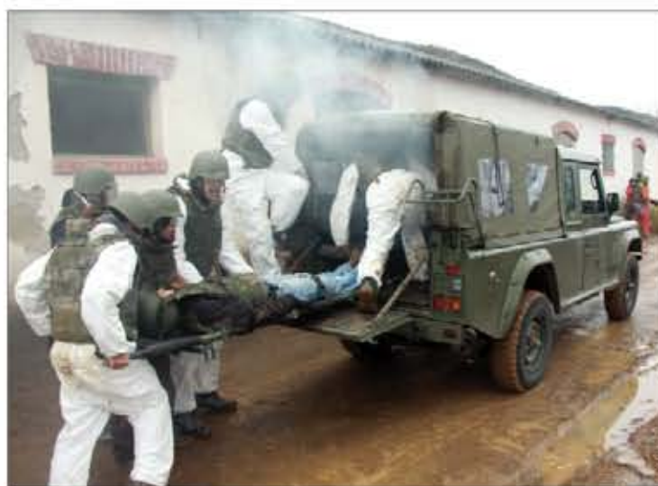
Evacuación de un herido durante el simulacro