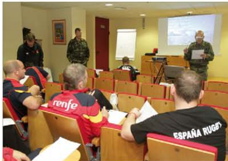
Evaluación de resultados tras una de las dinámicas de grupo

Precisamente fue con el cuerpo técnico con quien los profesores militares comenzaron a traba-