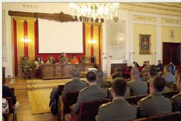
Acto de inauguración, en la Academia de Artillería