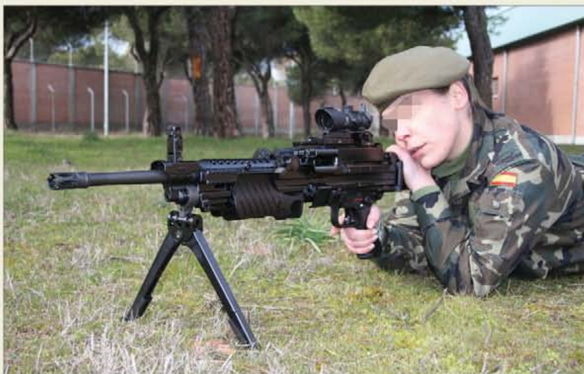
Las primeras unidades de la MG-4E comenzaron a distribuirse a las unidades en 2008

La llegada de la MG-4E desplazará a la Ameli —de la que se