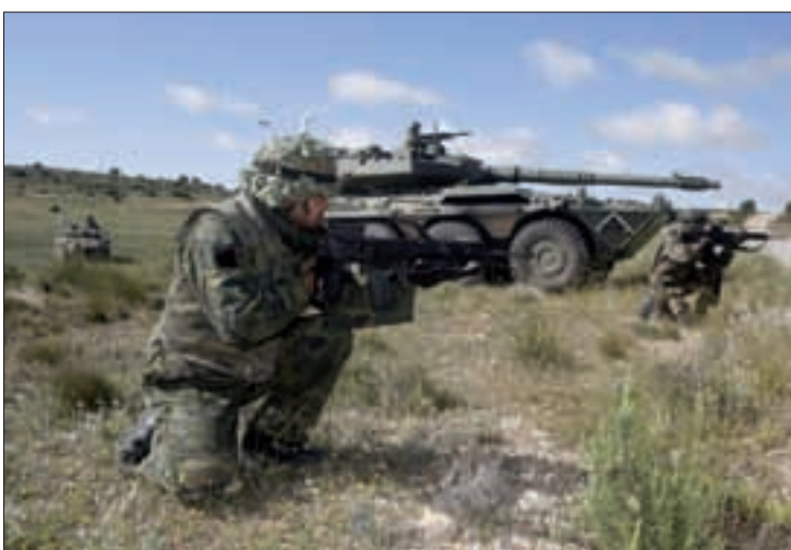
La simulación recreó situaciones con un alto nivel de tensión