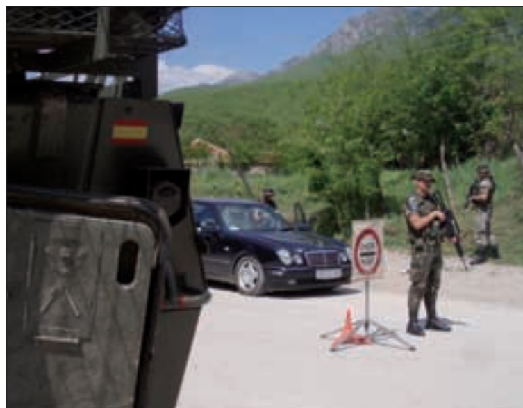
Los puntos de control o check point son muy frecuentes en las carreteras