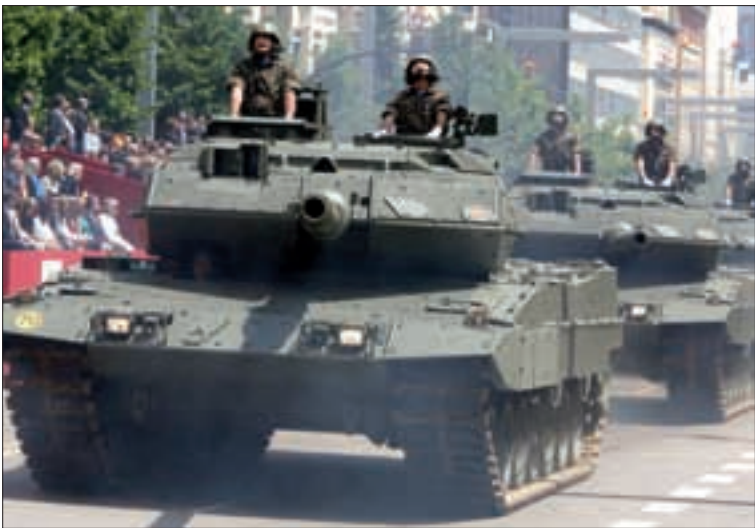
Una sección de carros de combate Leopardo abrió el desfile terrestre

conciertos; exhibiciones de distintas unidades; una Jura de Bandera para civiles frente a la Basílica del Pilar, en la que participaron más de 200 personas; una carrera popular, que servirá para financiar un proyecto de cooperación en Afganistán; una conferencia del Jefe de Estado Mayor de la Defensa, general de ejército Sanz Roldán; una retreta militar por las calles de la ciudad, concebida como un homenaje a los héroes de los sitios (1808-1809); y una jornada de puertas abiertas en la Base Aérea de Zaragoza.