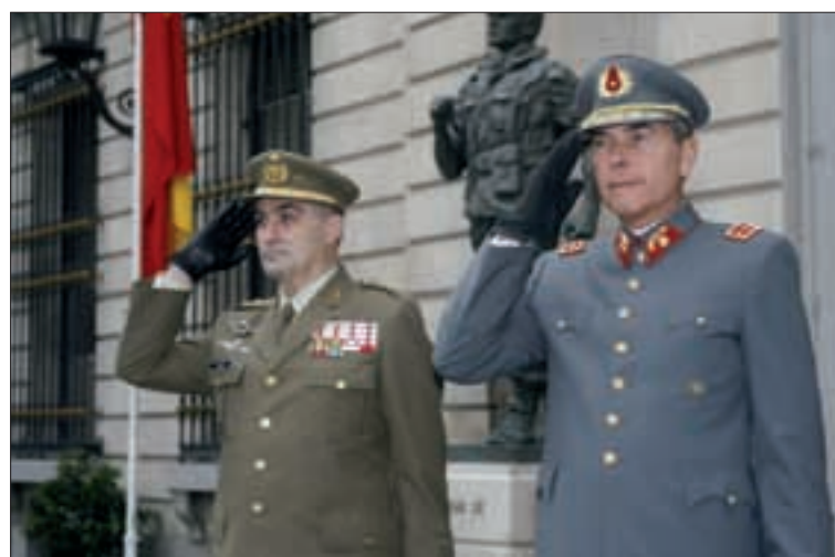
El general de ejército chileno en el Palacio de Buenavista, en Madrid