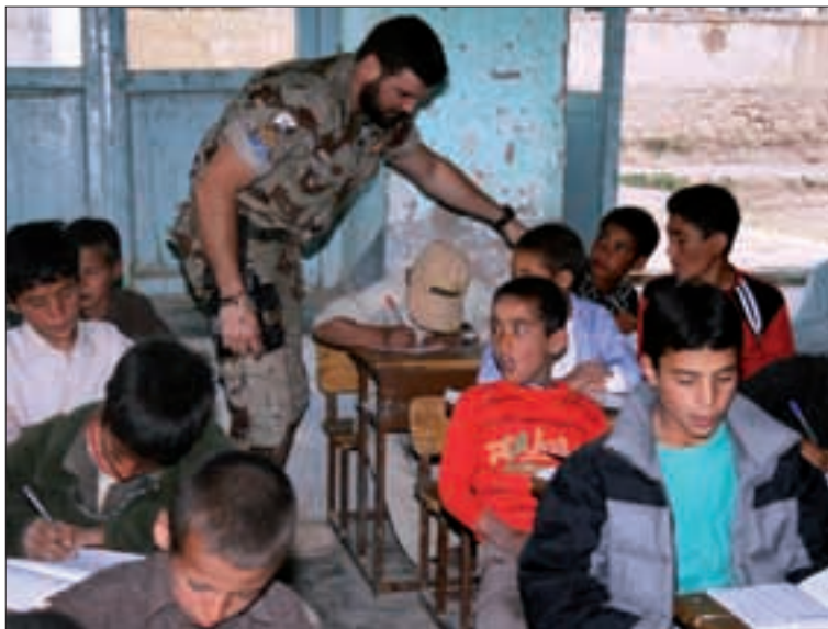
Los militares llevan a cabo labores de CIMIC, como el programa Cervantes (izquierda); y operativas, como la destrucción de munición realizada recientemente

El Grupo de Equipo de Desactivación de Explosivos ha eliminado los explosivos de la zona donde se ubicará el futuro cuartel del Ejército Nacional Afgano