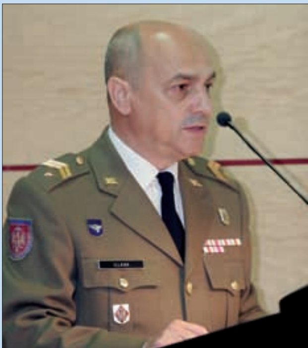
Illana se comprometió a canalizar «las inquietudes de los suboficiales»