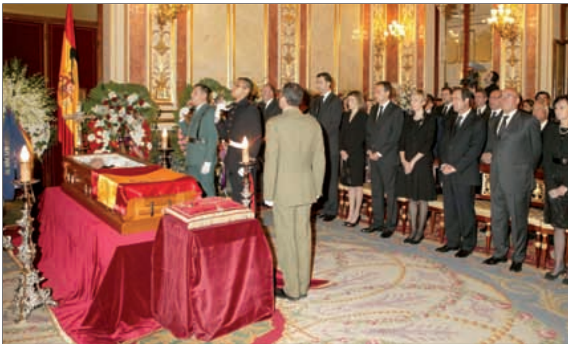
Sus Majestades los Reyes, los Príncipes y las máximas autoridades del Estado, frente al féretro del ex presidente

El piquete, cuyos miembros portaban armamento, estaba compuesto por diez soldados bajo el mando de un suboficial. La capilla ardiente se cerró a las nueve de la