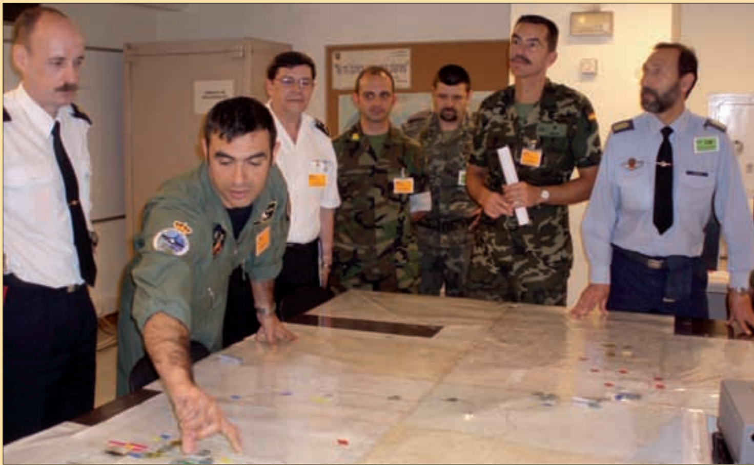
En el ejercicio "San Benito" de la Fuerza Conjunta de Reacción Rápida participaron militares de los Ejércitos de Tierra y Aire, y de la Armada

Las páginas centrales de la sección "el Ejército informa" se dedican, este número, a la Fuerza Conjunta de Reacción Rápida (FCRR), diseñada para actuar, con carácter inmediato, tanto en misiones internacionales como dentro de España. Dependiente del Mando de Ope-