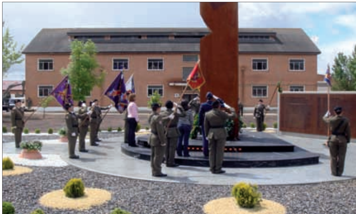
En la base del Monolito, 62 LED recuerdan a los fallecidos en el accidente

Se ha erigido un Monolito en la base "Cid Campeador"