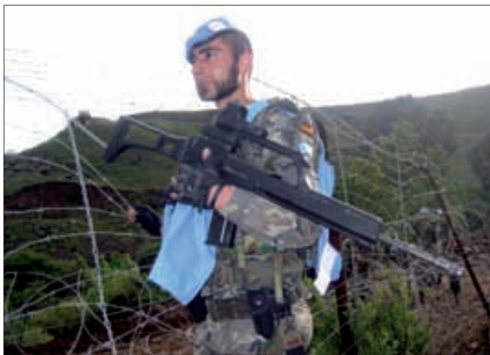
Los legionarios vigilan la frontera entre el Líbano e Israel

Miembros del Grupo Táctico "Colón", pertenecientes en su mayoría a la 6ª Compañía de la VIII Bandera de la Legión, vigilan la frontera día y noche, desde posiciones fijas, para evitar cualquier intento de sobrepasar la valla, reforzada recientemente con una nueva alambrada y focos de iluminación colocados por Zapado-