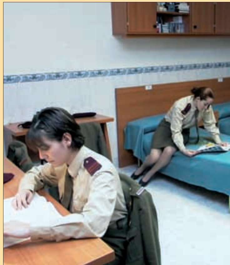
Los alojamientos, vestuarios y otras instalaciones se mejorarán

En el apoyo a las operaciones , en cuanto a las infraestructuras, es