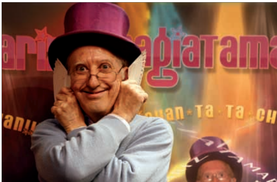
Para Juan Tamariz los espectadores son "espectadores" porque participan de forma activa en el espectáculo

De Física y Química en la magia que yo hago no hay casi nada, pero la química con el público la considero esencial. Si no amo a los espectadores y no noto que ellos me aman a mí, ¿para qué estamos aquí? Para estar yo y que mi ego se engorde, ¡anda ya! O para que me paguen luego lo que sea. ¡Si yo ya tengo dos vaqueros y no necesito más! No se trata de eso; a mí me impor-