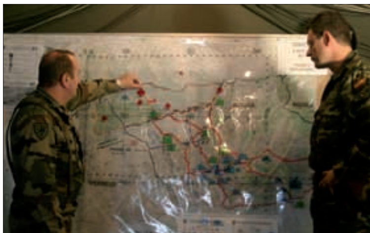
Los españoles intercambian capacidades con militares de otros países

Además, aquéllos que tengan un perfil inferior al 3.3.3.3 pueden asistir a un curso de inglés que se imparte en una academia civil local y está subvencionado con fondos nacionales. Los concurrentes pueden obtener, después, dicho perfil con la superación de los correspondientes exámenes ante un tribunal de idiomas que se convoca dos veces al año.