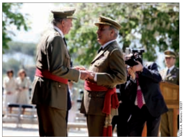
Don Juan Carlos entregó al premiado el sable de honor reglamentario de 1862

En Madrid, la Primera Subinspección General del Ejército organizó un desfile militar frente a la Real Casa de Correos, sede de la Presidencia de la Comunidad de Madrid. De hecho, fue la responsable del Ejecutivo autonómico, Esperanza Aguirre, quien presidió