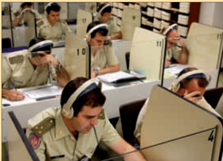
Las unidades disponen de créditos para contratar clases de idiomas

Finalmente, y aprovechando las capacidades de la EGE, se han duplicado para este año los cursos en el extranjero, a distancia e intensivos.