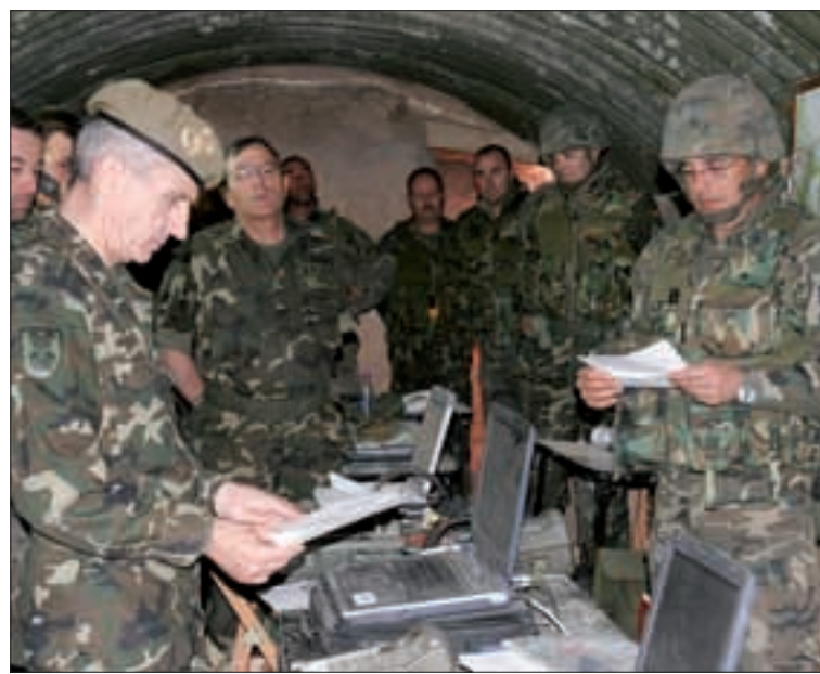
El general Díaz de Villegas visita el Puesto de Mando subterráneo

Entre los objetivos de las maniobras desarrolladas en el CENAD "San Gregorio", además de la instrucción de las unidades desple-