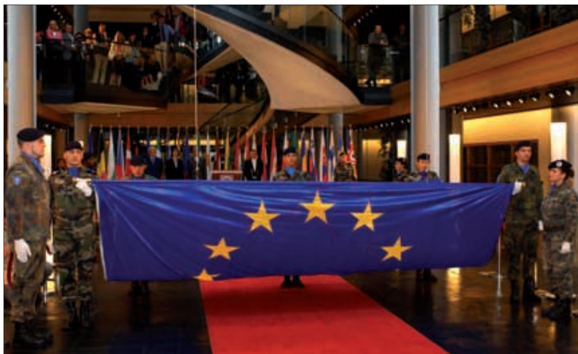
El trabajo en un ambiente multinacional es uno de los atractivos de los destinos en Estrasburgo