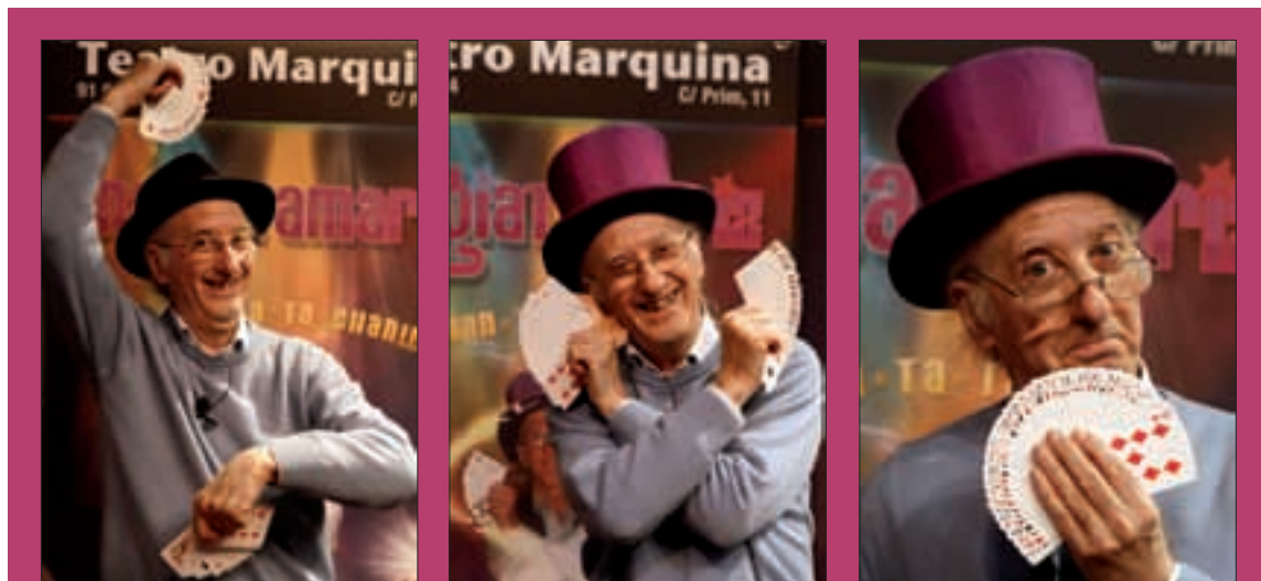
«No creo en los premios. ¡Los que me han dado han sido porque yo regalaba buenos jamones al jurado!», asegura

Obviamente un artista que sólo supiera la técnica y el oficio de su arte creo que no serviría para nada. Creo que lo importante es llenarte por dentro, enriquecerte, para poder transmitir una visión del mundo, mejor o peor, que haga crecer a otros. Toda la parte que es sentimiento, poesía, sensibilidad, sueño, capacidad, psicología... Porque en la magia es muy importante la psicología. Por ejemplo, saber que las personas que van con el vestido que tú llevas siempre eligen el as de diamantes. Entonces ya no tienes dudas. Pones esa carta, luego preguntas... ¡y, por supuesto, sale el as de diamantes!