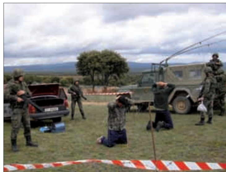
Entre otros cometidos, se practicó el establecimiento de check-points

Tras el homenaje a los que dieron su vida por España, guiones y banderines escoltaron hasta el Monolito tres coronas funerarias —ofrecidas por los Ejércitos de Tierra y Aire, los Cuerpos Comunes de las Fuerzas Armadas y la Guardia Civil— que fueron depositadas al pie del monumento por familiares de tres de los fallecidos.