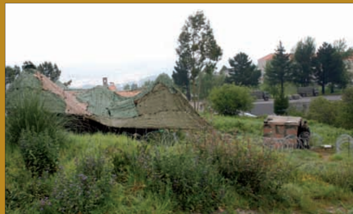
El Puesto de Mando de la Agrupación Táctica de fuerzas terrestres desplegó en Pontevedra

Pero además, los integrantes de la Agrupación Táctica se instruyeron en el planeamiento y conducción de una operación de repliegue de un contingente nacional en una operación de mantenimiento de la paz; practicaron el proceso de activación del puesto de mando de la Agrupación; elaboraron y difundieron órdenes de