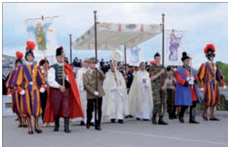
Uno de los momentos más significativos fue la adoración eucarística, el día 23

El grupo español comenzó la peregrinación en Zaragoza, con una misa en la Basílica del Pilar, donde ofreció un manto a la Virgen, y desde allí viajó a Lourdes. El día 23 los peregrinos participaron en el desfile internacional de apertura, la adoración eucarística, la bendición de los enfermos, la procesión mariana y la vigilia de oración, entre otras actividades. El día 24 se inauguró en el centro de Lourdes la Ciudad de los Artífices de la Paz, un espacio en el que, durante varias horas, hubo conferencias, exposiciones, talleres, conciertos y, por supuesto, tiempo para la oración. Todo ello, en torno al tema común de esta peregrinación: la