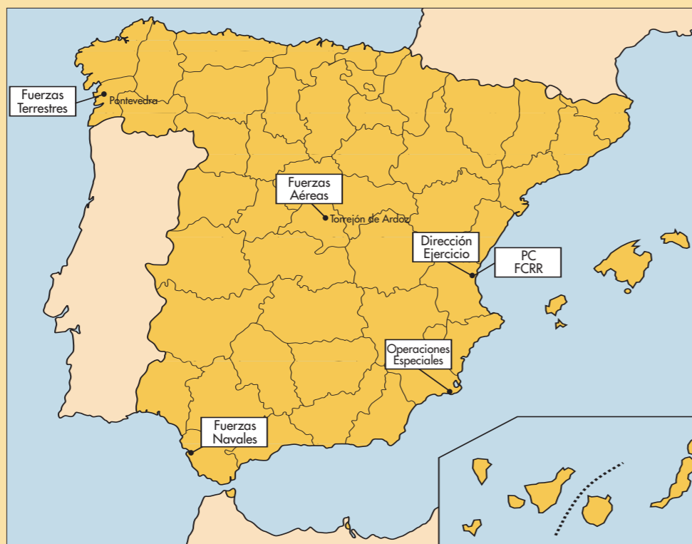
Los puestos de mando de las unidades subordinadas desplegaron en distintos puntos de la Península

La FCRR, según explica el comandante Ramos, del Centro de Planeamiento Operativo Específico Nacional (CEPOEN), está compuesta por unidades terrestres, aéreas, navales, de operaciones especiales, logísticas, de helicópteros, de artillería antiaérea... «Es un paquete de fuerzas —aclara— que permite, en función de la misión a desarrollar, configurar una organización operativa adaptada a dicha misión». Y esa organización operativa constituiría la Fuerza Operativa Conjunta (FOC), que no es ni más ni menos que la parte de la FCRR que es proyectada. «La Fuerza Conjun-