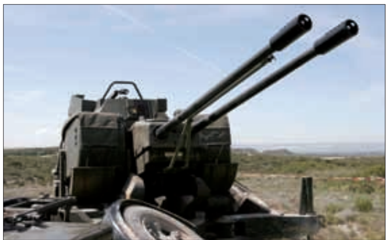
El Oerlikon 35/90 forma parte de la dotación antiaérea de la Comandancia

Tras finalizar el ejercicio "Arruit", permanecieron en el CENAD una bandera de Infantería ligero-protegida del Tercio "Gran Capitán", una compañía de Zapadores con una unidad de apoyo, una sección de carros de combate, y una unidad de Defensa Antiaérea, para incorporarse a las maniobras "Cierzo", conducidas por la Academia General Militar de Zaragoza. Durante la estancia de estas unidades en la provincia aragonesa, se trasladó a la plaza melillense personal del Regimiento de Infantería Ligera "Príncipe" nº 3, con sede en Siero (Asturias), que desarrolló su programa de instrucción en la ciudad autónoma.