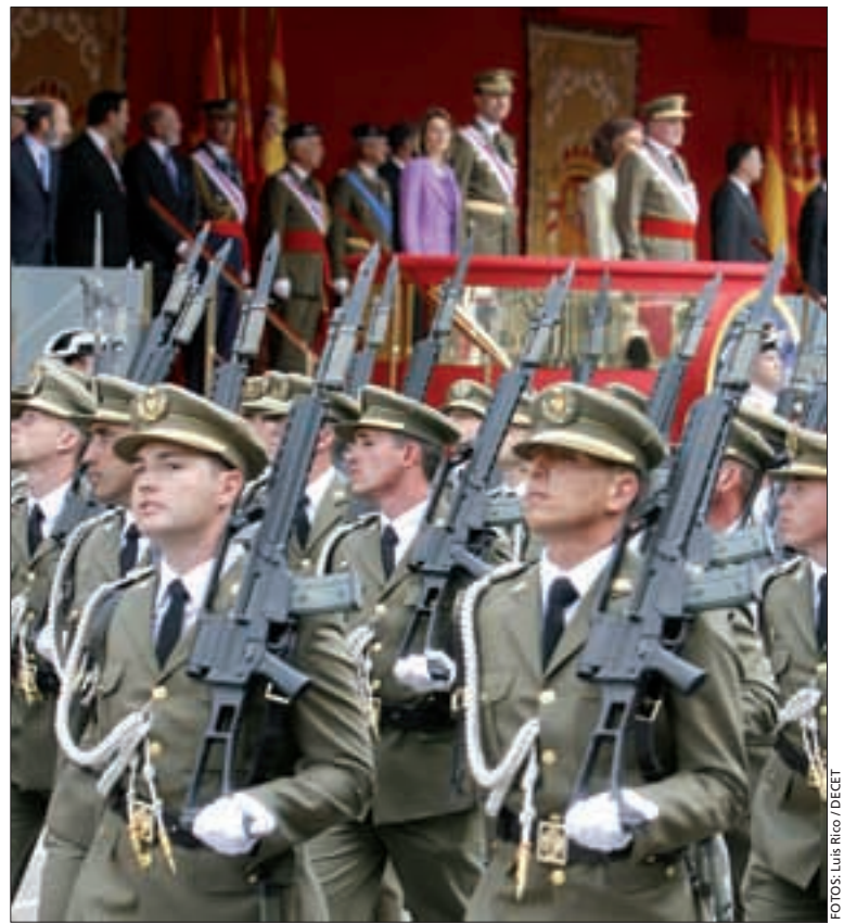
Desfilaron alumnos de la Academia de Logística

A pie desfiló un batallón compuesto por componentes de la Aca-