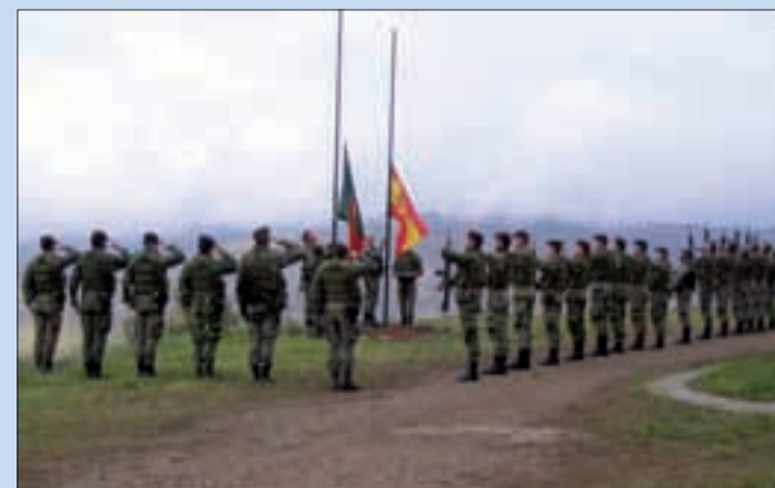
La fase LIVEX del ejercicio se realizó en el norte de Portugal

tar, dependen cuatro LOT españoles y otros cuatro franceses. «Este Centro —explica— es como un puesto de mando de coordinación desde donde se controlan el trabajo de los diferentes equipos. Las tareas que ellos realizan se elevan al Cuartel General de la Fuerza Europea, en Sarajevo, donde se encargan de analizarlos». La Fuerza Europea desplegada en el país balcánico continuará bajo el mando del general español Martín Villalain hasta finales de año.