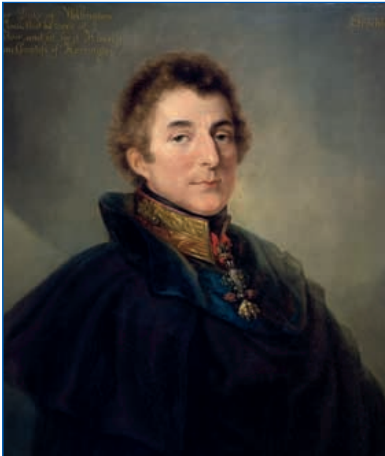
Las victorias de Arthur Wellesley en las guerras napoleónicas le convirtieron en uno de los héroes más aclamados de la Historia del Reino Unido.

Reunidas de nuevo las tropas españolas y británicas, Wellesley diseñó un plan para enfrentarse al enemigo. Los aliados se dispusieron de tal forma que los franceses no pudieran rodearlos ni por el sur (lo impedía el Tajo) ni por el norte (lo impedía el cerro Medellín). Además, en el centro del despliegue construyeron una fortificación de campaña, aprovechando la presencia de unos edificios cercanos.