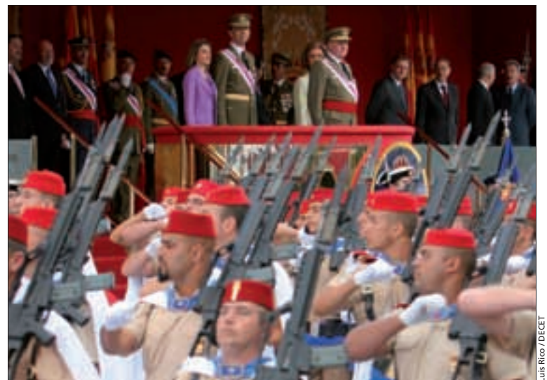
LUIS RICO / DECEIT

Dos siglos después del inicio del primer sitio de Zaragoza por las tropas francesas, la ciudad ha sido el escenario elegido para la celebración del Día de las Fuerzas Armadas. En el desfile militar, al que asistieron Sus Majestades los Reyes y Sus Altezas Reales los Príncipes de Asturias, participaron cerca de 1.700 militares. En él pudo verse, además, una muestra de los más avanzados sistemas de armas con que están dotadas las Fuerzas Armadas españolas. Aparte del acto central, se realizaron muchas otras actividades, como una exposición temática, una Jura de Bandera de personal civil, una carrera popular y una retreta por las calles de Zaragoza. Pág. 3