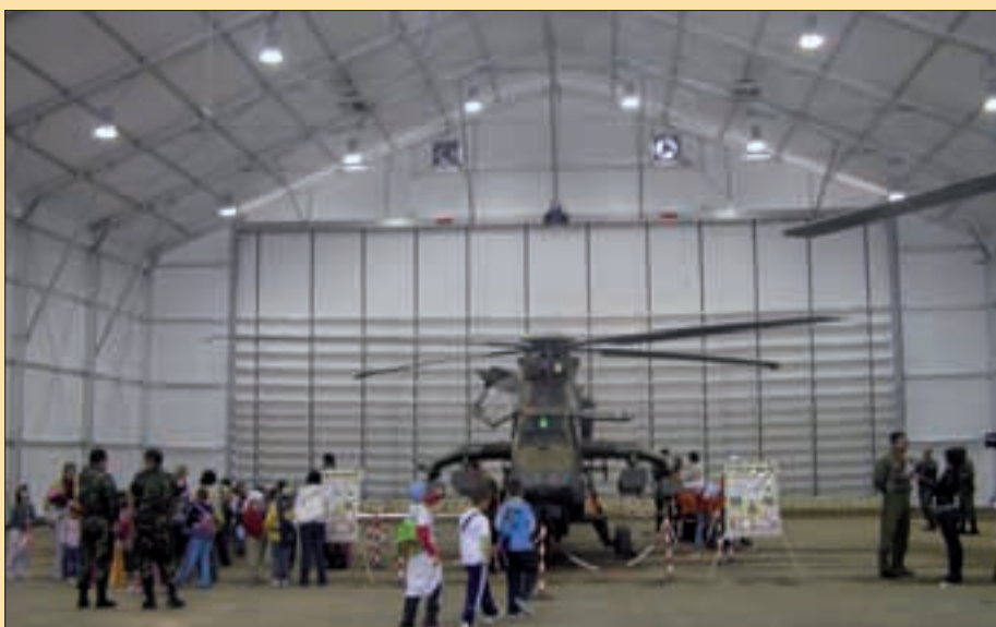
El hangar, durante una jornada de puertas abiertas

hangar —cuya estructura es de aluminio— se almacenan en diez contenedores aerotransportables. La parte exterior está confeccionada con una tela resistente, de color