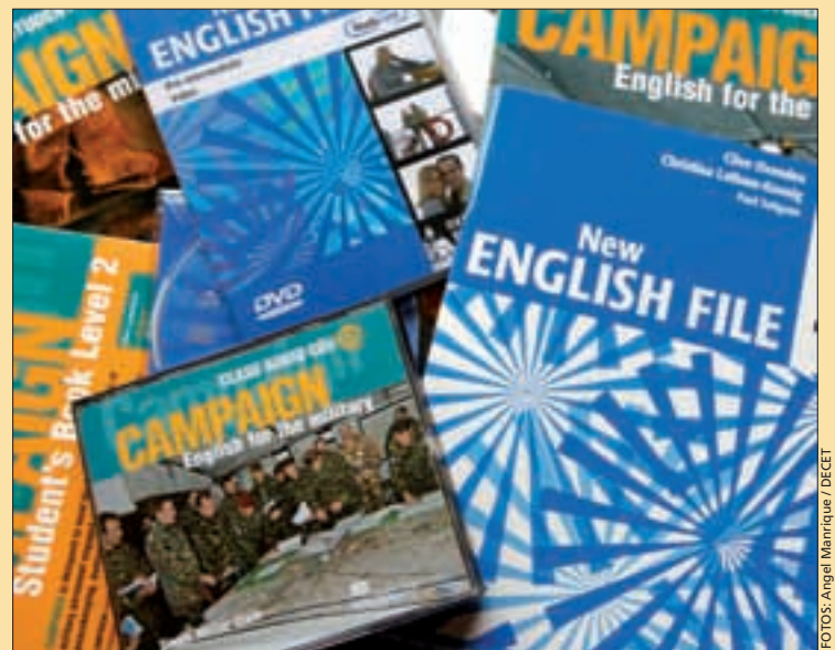
La Escuela de Guerra ha diseñado un sistema único de metodología

Por su parte, la Escuela de Guerra (EGE), a través de su Departamento de Idiomas, ha diseñado un sistema único de metodología, de modo que los contenidos asimilados en los Centros de Enseñanza de Formación no se repitan posteriormente en los cursos de idiomas que pueda seguir el militar de carrera dentro de la enseñanza de perfeccionamiento. El módulo principal elegido es el "New English File", utilizado por la mayoría de las Escuelas Oficiales de Idiomas. De esta manera, se facilitará el estudio del personal militar en estos centros.