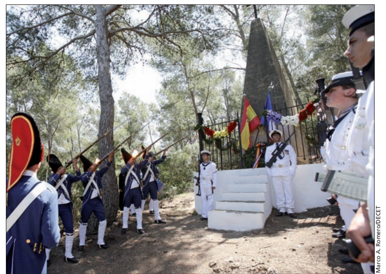
Durante el acto de homenaje a los fallecidos se realizó una salva de fusilería

«Por la amistad francoespañola»; con estas palabras, el comandante general de Baleares realizó un último brindis como homenaje a los soldados que perecieron en la isla. «No creo que para un soldado haya mayor tragedia que morir y ser enterrado en una tierra que no es la suya, sobre todo cuando hablamos de soldados que murieron haciendo lo que era su deber: cumplir las órdenes que les habían dado», relató el