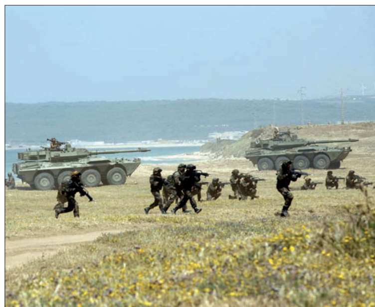
Varios vehículos Centauro protegió el desembarco de la Infantería de Marina

empleos más elevados en cada escala. Además, las páginas de "el Ejército informa" recogen las normas de utilización del Lotus Notes; la consulta de las nóminas electrónicas a través del Portal Personal; cómo el Mando de Adiestramiento y Doctrina afronta los retos futuros; la clasificación, los usuarios y precios de residencias militares; y, por último, la importancia del inglés en el curso de Capacitación Para el Ascenso a Comandante de las Escalas de Oficiales del Ejército de Tierra. Pág. 7 a 10