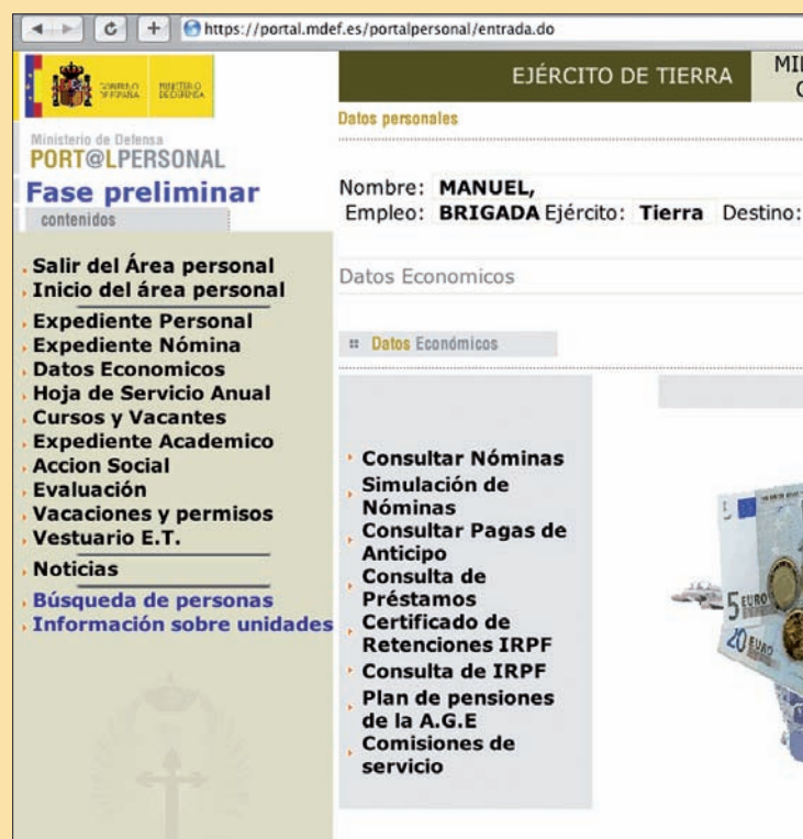
Dentro del Portal Personal se puede ver e imprimir la nómina

■ Con esta medida se ahorran costes en la impresión de 80.000 nóminas en el Ejército