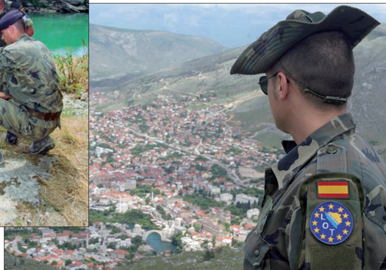
Tres imágenes representativas de la misión: los primeros blindados de Naciones Unidas comenzando su despliegue (foto superior); los ingenieros construyendo la pasarela que suplió al Stari Most de Mostar (izquierda); y los Equipos de Observación y Enlace que ahora están desplegados en la región