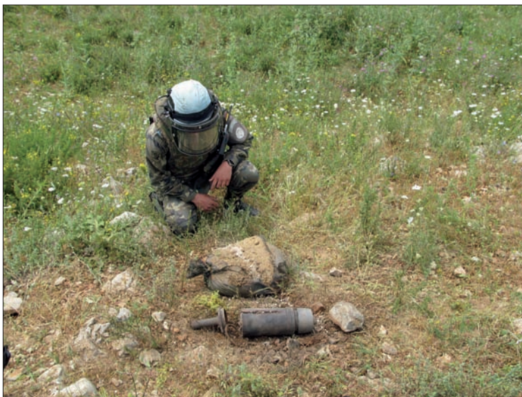
El último artefacto desactivado por los españoles ha sido un proyectil de 120 mm

En el mismo momento en que la Unidad de Ingenieros (UING) española recibe un aviso de que se ha encontrado un artefacto explosivo, se pone en marcha un proceso de preparación paciente y minucioso que implica a diversos operativos. En primer lugar se acordona la zona donde se ha descubierto el artefacto y se cortan las carreteras o vías de paso. Al mismo tiempo, los servicios sanitarios diseñan un plan de evacuación por si fuera necesario. Tras dar seguridad al área, se estudia el proyectil y las posibles consecuencias de su desactivación. Finalmente, uno de los dos componentes del