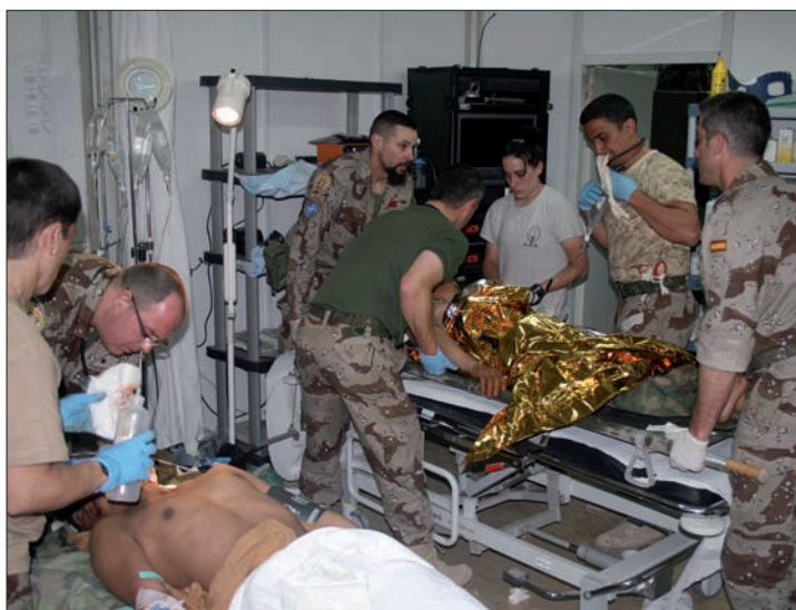
Los militares españoles atendieron a los heridos en el PRT

Días después, concretamente el 19, los militares del PRT espa-