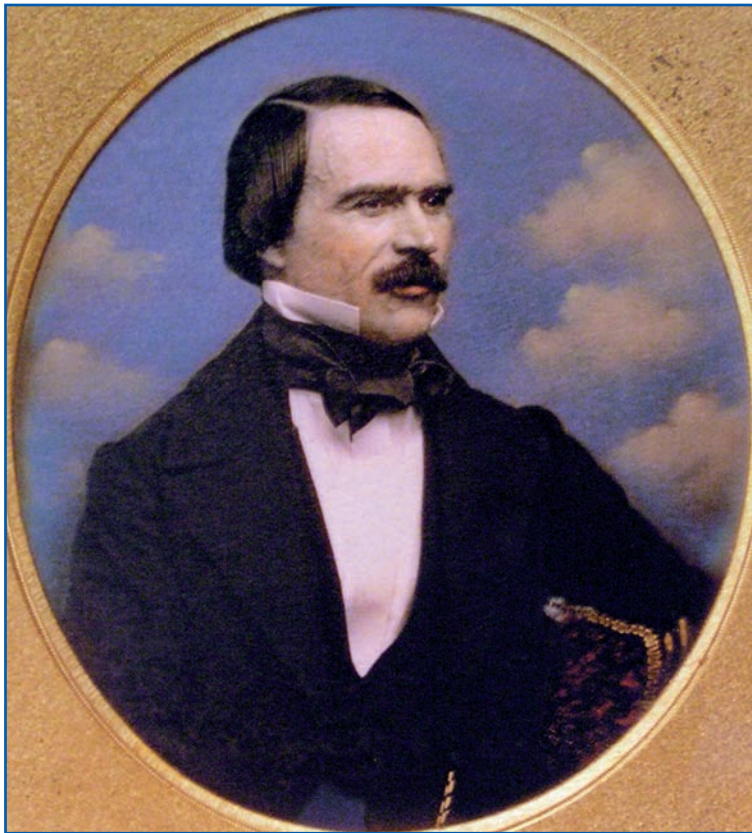
Ramón Cabrera, apodado El Tigre del Maestrazgo por su crueldad en la Primera Guerra Carlista, tuvo también un papel destacado en la segunda contienda

Pronto comenzaron a aparecer en el campo partidas de bandoleros —muchas de ellas, compuestas por antiguos combatientes carlistas—, que se dedicaban al pillaje. Aprovechando la situación, en septiem-