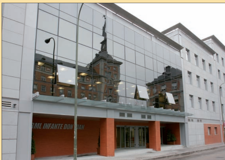
La residencia "Infante Don Juan" ofrece alojamiento en el centro de Madrid

La clasificación, los usuarios y los precios de todos estos centros estaban recogidos en la Orden Ministerial 346/1998. Sin embargo, la adaptación de la normativa existente a la Ley de la Carrera Militar y la revisión de los precios de las distintas residencias según su finalidad han hecho necesario el desarrollo de la Orden Ministerial 13/2009 (que aparece en el BOD nº 61, de 30 de marzo).