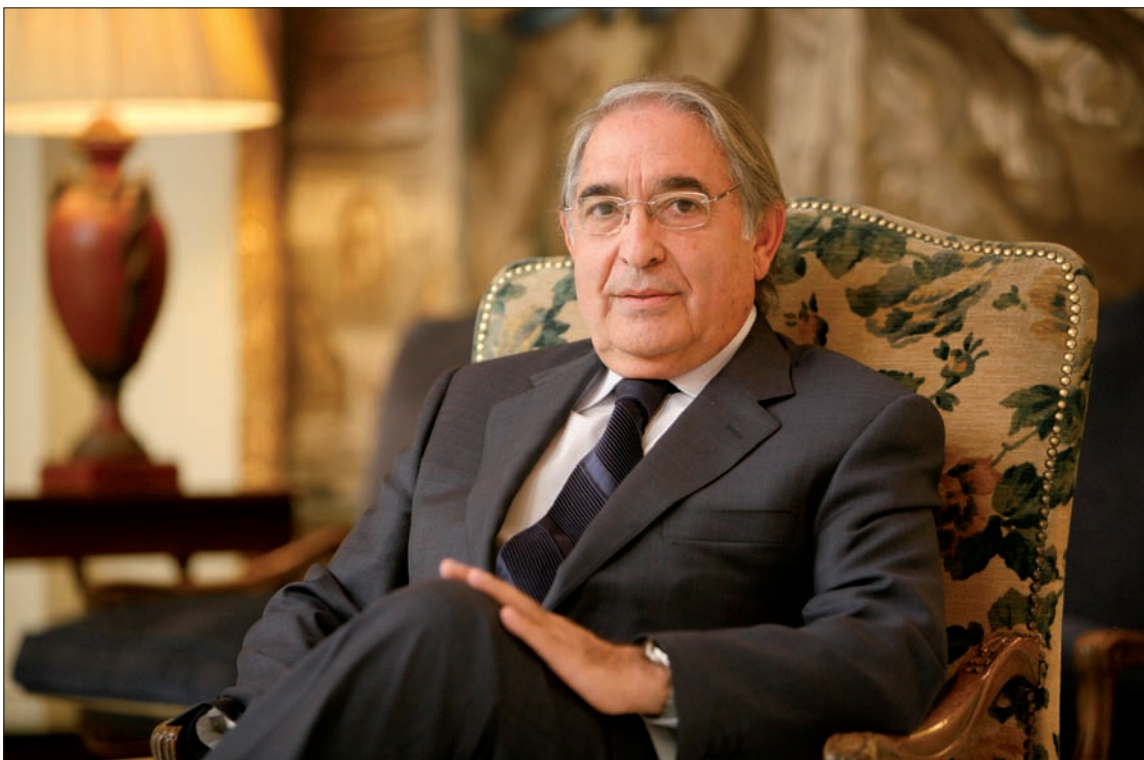
«En MRW empezamos con los envíos gratis para los soldados y ahora tenemos 13 proyectos en total»

Afortunadamente, ahora el Ejército tiene muy buena imagen y su trabajo es imprescindible. Puedo hablar en primera persona, ya una de mis experiencias con el Ejército actual fue durante un crucero a Dubrovnic. Allí nos vinieron a recoger militares que nos llevaron hasta la base. Fue en 1994, cuando no existían los móviles, y MRW patrocinaba la segunda conexión telefónica entre los militares y sus familias en España.