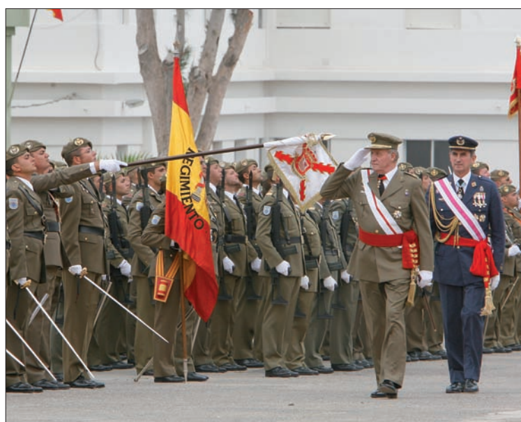
Un Batallón del "Soria" nº 9 formó ante Su Majestad el Rey

Se cerraba así una serie de actos y actividades socio-culturales en los que se contó con la participación y el apoyo incondicional de la población local. Destacaron, por ejemplo, el izado de Bandera en la sede de la Delegación Insular, un cine-fórum en el que se proyectaron y analizaron tres películas ambientadas en la época de los Tercios de Flandes y un concierto ofrecido conjuntamente por las Músicas de la Subinspección de Canarias y el Grupo de Cuartel General del Mando Aéreo de Canarias. Pág. 3