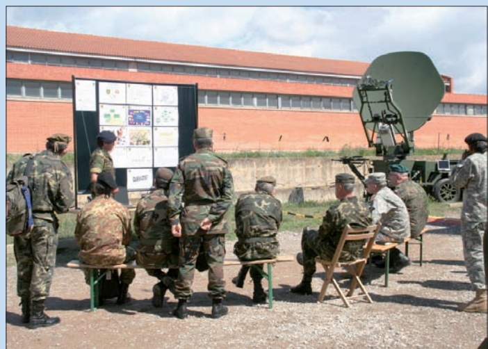
Militares de diferentes países durante el ejercicio “Steadfast Cathode”

Con esta actividad, España renueva su compromiso con las medidas de transparencia en el ámbito militar, elementos clave de la confianza y seguridad en el continente europeo.