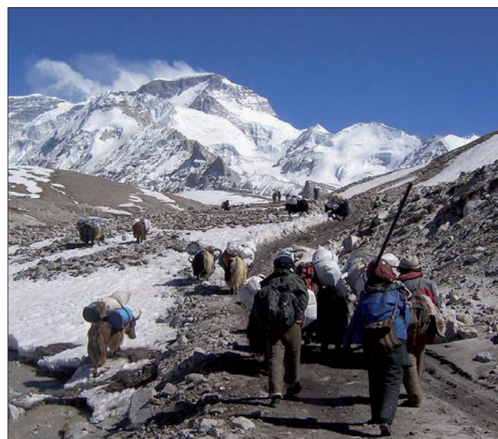
En el campo 1 han pasado el periodo de aclimatación

Además, el Grupo Táctico continúa garantizando la calma en la zona con patrullas diarias —más de 1.400 en el primer mes— y 12 puestos de observación fijos.