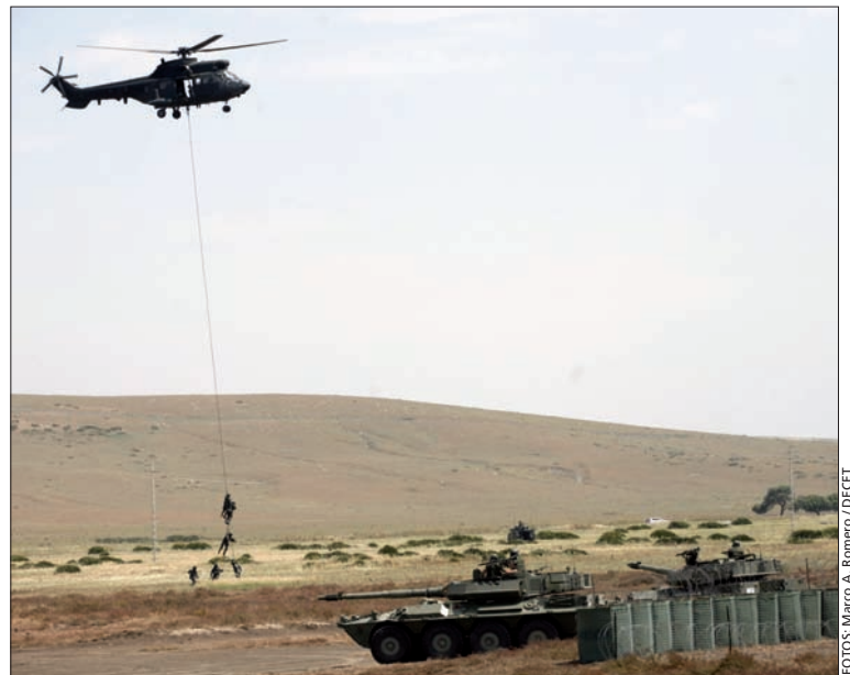
Don Felipe pudo conocer de primera mano el funcionamiento del Centro de Control de Evacuación (arriba) y presenciar la extracción del equipo de Operaciones Especiales del Ejército de Tierra por medio de un Cougar (abajo)