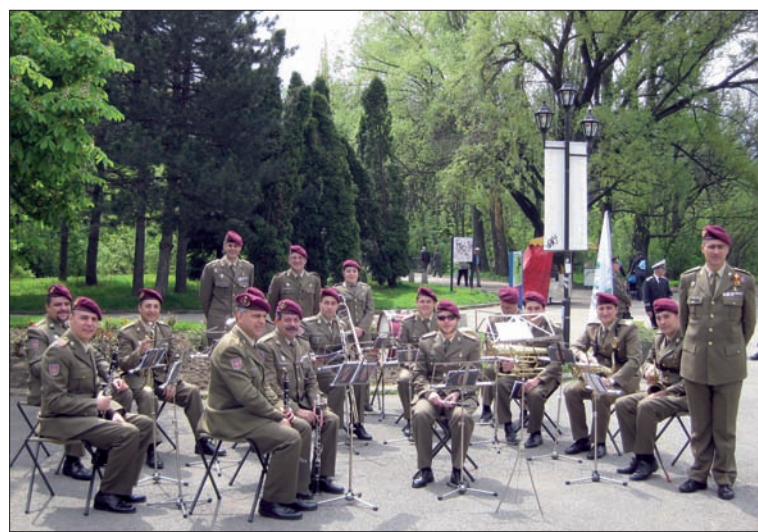
Los componentes del "Inmemorial", momentos antes de comenzar el acto