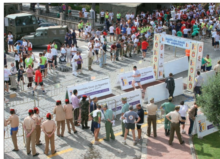
En esta edición han participado más de un millar de militares

Es importante señalar que en esta edición se ha producido una novedad con respecto a años anteriores, ya que se ha modificado la composición de las patrullas. Hasta ahora eran doce los patrulleros que conformaban cada una de las patrullas; sin embargo, a partir de esta edición su número se ha reducido a ocho militares.