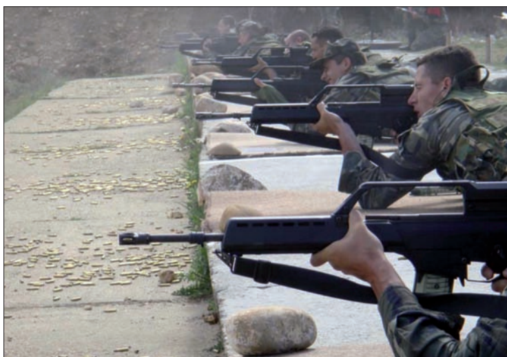
La COMGEMEL consiguió un total de 345 impactos

La competición —en la que participaron nueve patrullas— consta de dos partes. La primera consiste en realizar una carrera de 10 kilómetros, con el equipo completo, en la que toda la patrulla (compuesta por un oficial, un suboficial y seis militares de tropa) debe permanecer unida. La media de tiempo invertido es de 60 minutos, por lo que las patrullas que lo hacen en menos tiempo reciben una bonificación, mientras que las que lo superan son penalizadas.