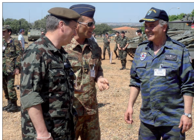
Los delegados de la OSCE se interesaron por el material expuesto