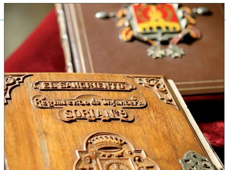
El historial del RIL "Soria" está repleto de hazañas y actuaciones heroicas

En 1996 se traslada a Fuerteventura, donde retoma su labor de servicio a España en el exterior con la aportación de personal a las misiones desarrolladas en Bosnia-Herzegovina, Kosovo y Afganistán.