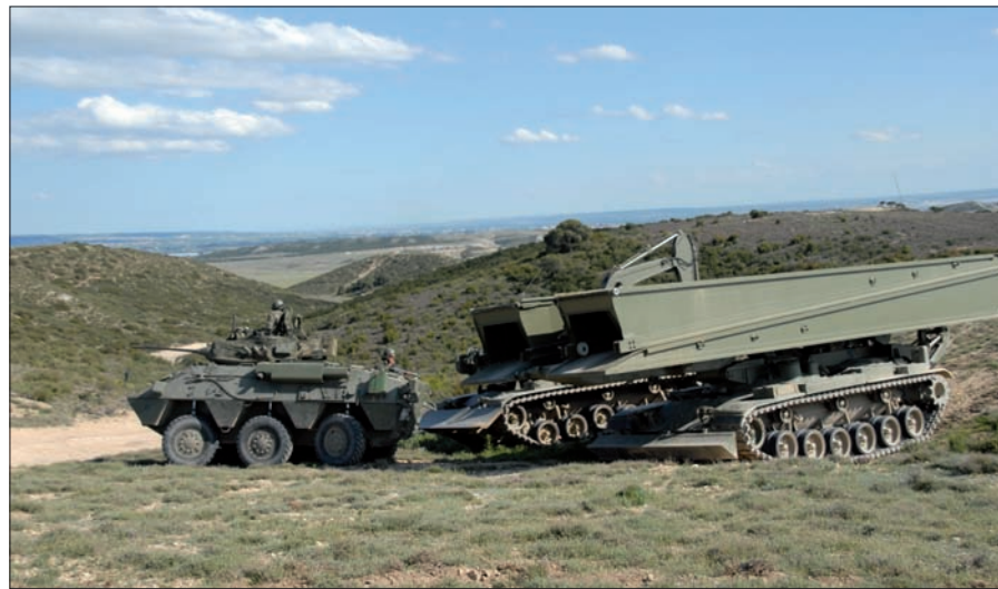
La Legión contó con el apoyo de unidades del MING, entre otras