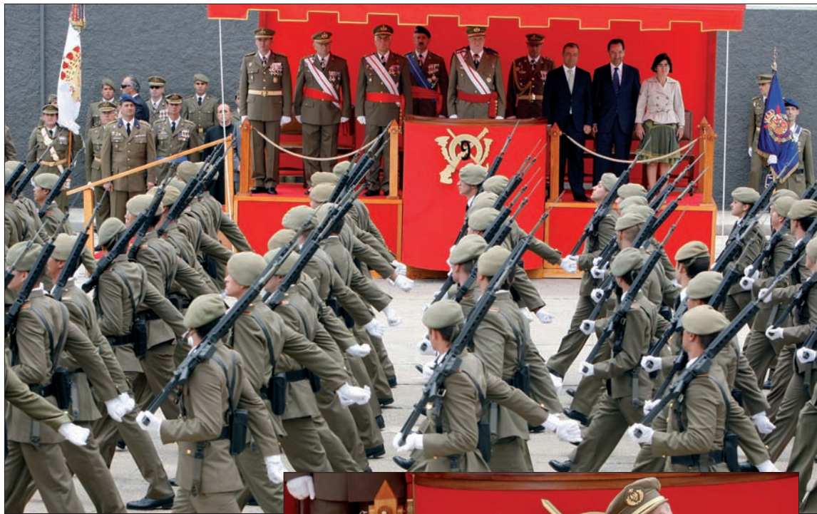
Las unidades participantes desfilaron ante la mirada del Rey, que minutos antes había impuesto la corbata de la Medalla del Ejército a la Bandera del Regimiento

El momento más significativo del acto fue la entrega de la Medalla del Ejército a la unidad, en consideración del brillante historial acumulado a lo largo de los quinientos años de existencia, donde se pone de manifiesto la continuada labor de defensa de los intereses nacionales y del alto espíritu de servicio de quienes sirvieron en el Regimiento. Su Majestad el Rey manifestó el honor que suponía para él imponer la corbata a la Bandera de la unidad.