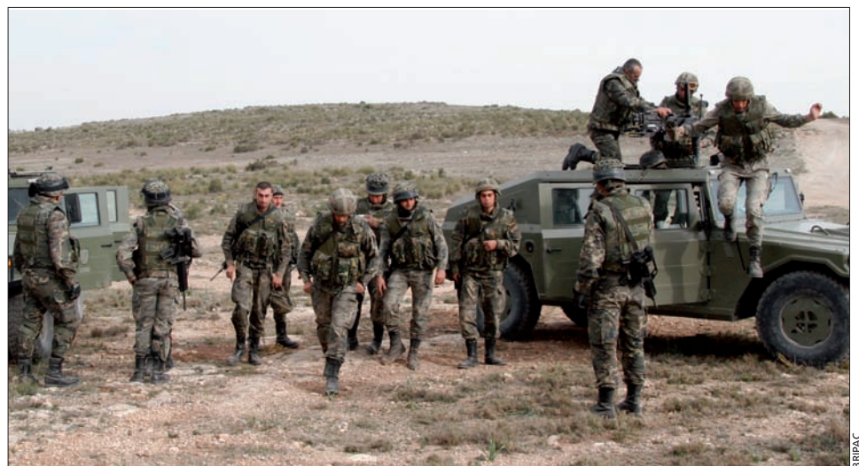
En el ejercicio se pudieron comprobar las capacidades de planeamiento y operatividad de la Bandera

destacamento de enlace y observadores avanzados—, un pelotón Mistral , una sección de Zapadores, una sección de defensa contra carro y un pelotón REMBASS de obtención de información. Además, se llevó a cabo un tema táctico en el que se pusieron en práctica actuaciones que han sido y serán de plena aplicación en las misiones en el exterior, como la apertura de rutas y su posterior seguridad, la organización de patrullas, la activación de una base operativa avanzada y el desarrollo de procedimientos de reacción ofensiva contra fuerzas hostiles localizadas. Para aumentar la credibilidad de algunas de las acciones planteadas, la propia Bandera generó una fuerza de oposición.