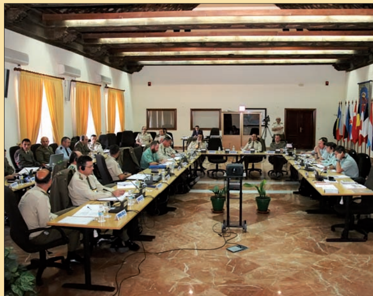
El MADOC organiza seminarios y simposios a nivel nacional y multinacional

En cuanto a los materiales , se han realizado trabajos fundamentalmente en dos campos: la detección de carencias y la participación en el proceso PAPS (siglas en inglés de Sistema de Programación de Armamento en Fase). Además, hay que destacar el empleo del denominado Foro de Materiales, que permite el intercambio de conocimientos mediante una herramienta