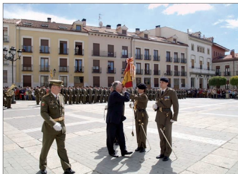
Los palentinos vivieron por primera vez una Jura de Bandera de personal civil

En Teruel juraron Bandera, el 23 de mayo, 85 civiles. Posteriormente, la Música de la Academia General Militar ofreció un concierto público en la plaza del Torico.