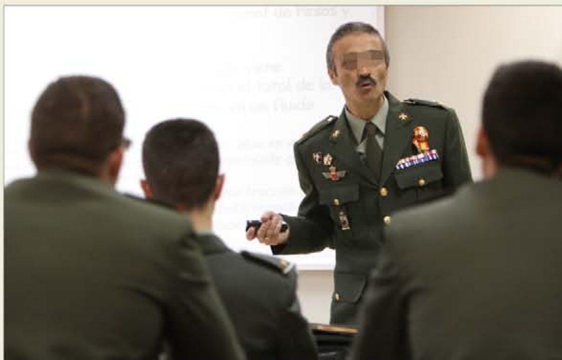
En el Cuerpo Militar de Sanidad se podrá ingresar sin titulación previa

En la fase de oposición se realizan una serie de pruebas de conocimientos generales y específicos, y también de lengua inglesa, unas pruebas físicas y un recono-