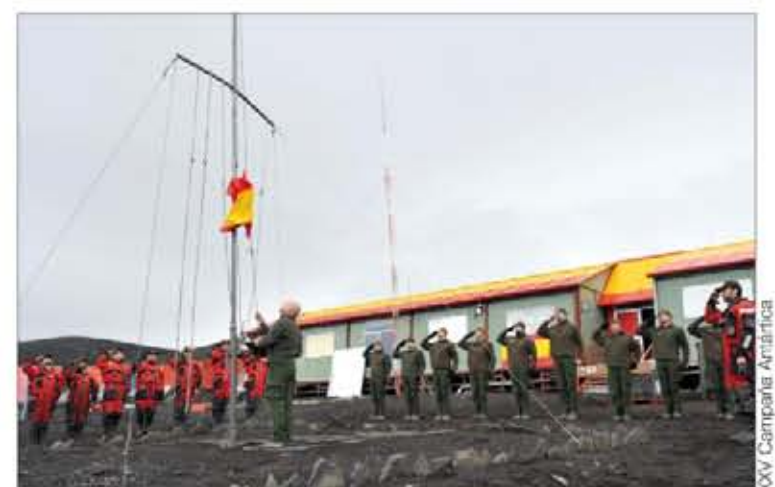
Último arriado de Bandera en Isla Decepción

En ese tiempo han ido completando su despliegue y asumiendo los cometidos habituales: patrullas a lo largo de la Línea Azul, puestos de observación, y apoyo y asistencia a las Fuerzas Armadas Libanesas, entre otras.