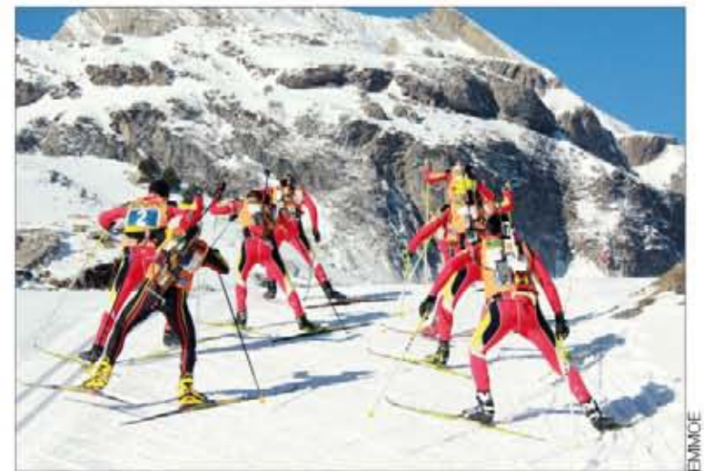
La prueba de Patrullas se disputó el 9 de marzo en Candanchú

Los gastos de la prueba han sido sufragados con las inscripciones de los participantes. Estas permitirán financiar, además, proyectos humanitarios en el Líbano.