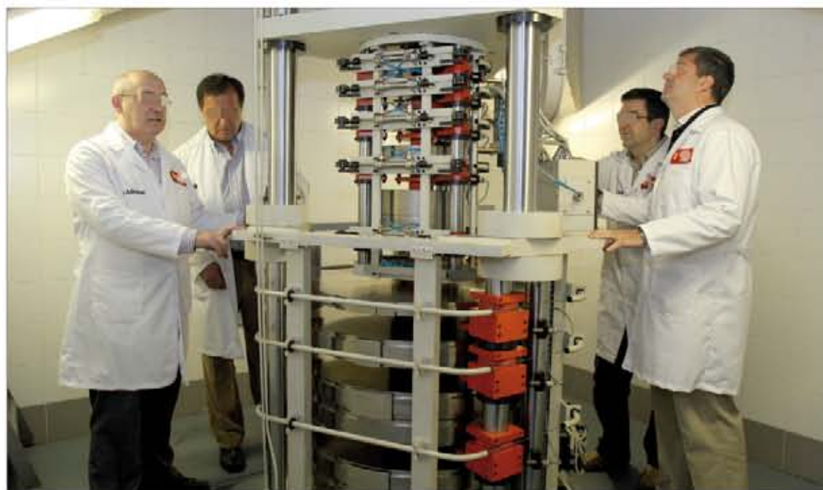
Máquina de carga directa para la calibración de células de carga (superior) e interior de la Jaula de Faraday para mediciones TEMPEST (derecha).