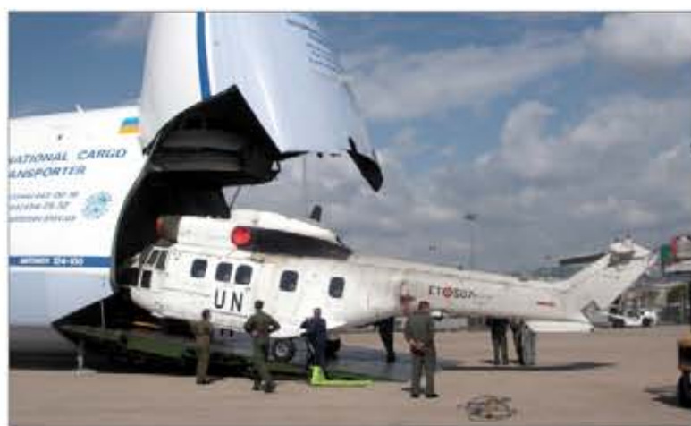
Los helicópteros españoles desplegados en Líbano han vuelto a casa

La andadura de los helicópteros españoles en el Líbano comenzó en julio del año 2007, cuando llegó la primera unidad, compuesta por personal del Batallón de Helicópteros de Maniobra (BHELMA) IV y dos helicópteros Superpuma . En estos casi cinco años, han pasado componentes de los BHELMA III y VI, de los Batallones de Helicópteros de Ataque I y de Emergencias II, del Batallón de Transmisiones y del Grupo Logístico de las Fuerzas Aeromóviles del Ejército de Tierra (FAMET); además, del Parque y Centro de Mantenimiento de Helicópteros, y del Centro de Enseñanza de las FAMET.