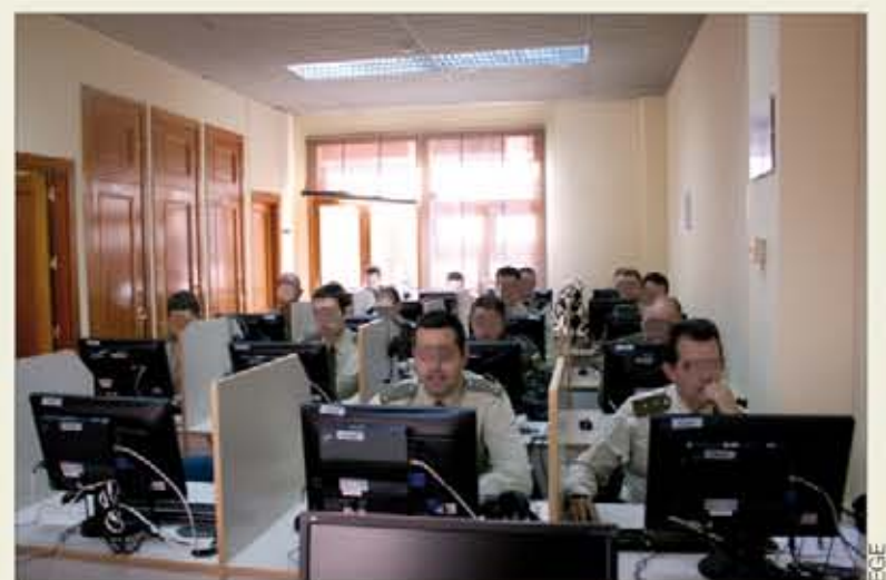
Clase de laboratorio de un curso intensivo, nivel funcional, en la EGE