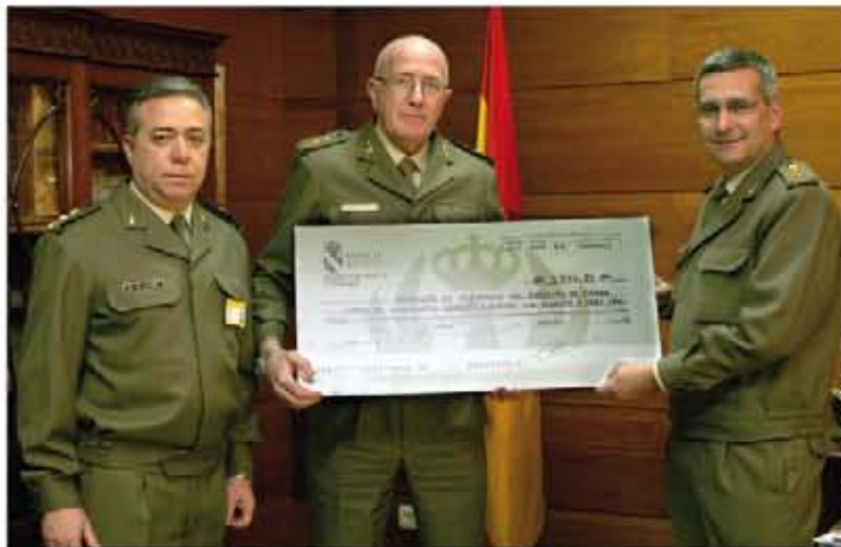
Momento de la entrega del cheque simbólico al Patronato