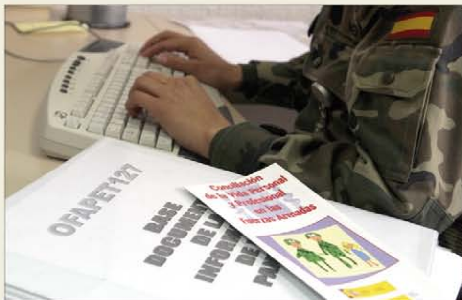
Las Unidades de Servicios son de los destinos más solicitados por este personal

En el caso de que la limitación sea consecuencia de acto de servicio, pero no conste expresamente en la resolución, antes de solicitar la habilitación de una vacante se deberá solicitar la modificación para que se incluya este extremo. La vacante no será publicada previamente, y se