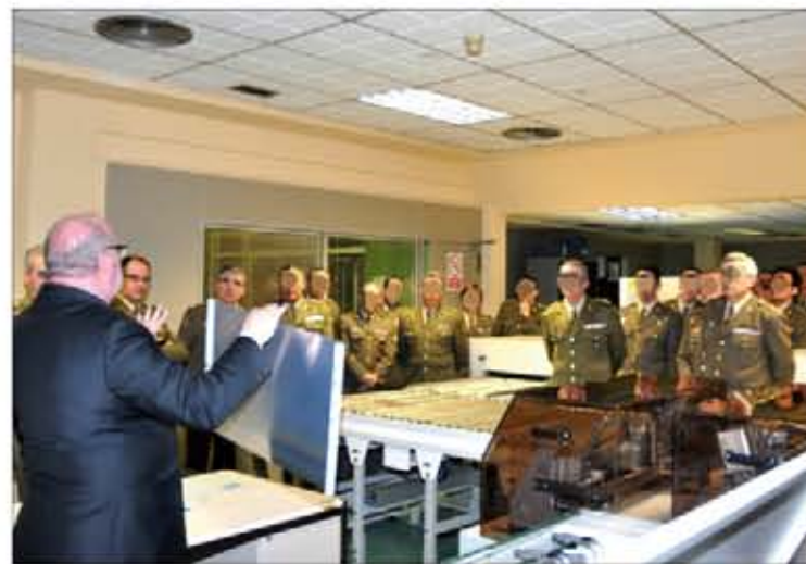
Los participantes en la reunión visitaron el periódico Ideal

El 9 de marzo, el JEMAD realizó una visita al Regimiento de Guerra Electrónica nº 32 —encuadrado en la Jefatura de los Sistemas de Información, Telecomunicaciones y Asistencia Técnica—, en la localidad hispalense de Dos Hermanas. A continuación, se trasladó al Cuartel General de la Fuerza Terrestre, en Sevilla, para conocer el funcionamiento de esta organización, de la que dependen la mayoría de unidades de combate y apoyo al combate del Ejército (⇒ intranet 09/03/2012).