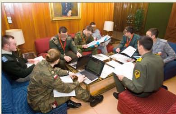
Alumnos de la AGM trabajan con estudiantes de ejércitos extranjeros

El Programa EMILYO ofrece a los oficiales la posibilidad de seguir una parte de su formación en otro Estado miembro de esta iniciativa europea. Mientras se avanza lentamente hacia los intercambios de larga duración, los países ofertan actividades de más corta duración —en inglés, para cadetes