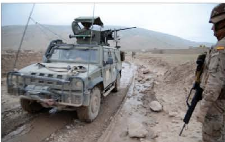
El legionario participaba en un dispositivo de seguridad

entregar más de 560 sistemas y unos dos centenares de direcciones de tiro. También se abordan los cambios en el sistema de enseñanza de los militares de Cuerpos Comunes y las modificaciones en el Reglamento de Destinos que incrementan los derechos del personal declarado apto para el servicio pero con limitaciones, dándoles ventajas de elección. Págs. 7-10