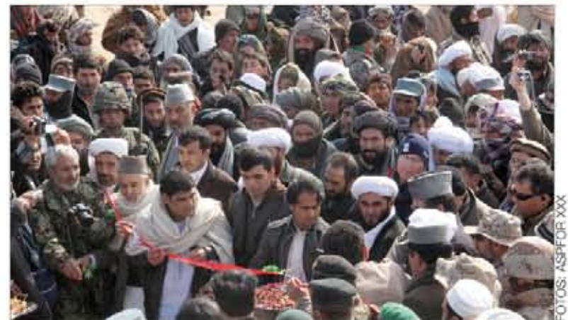
Corte de la cinta de las obras del último tramo de la Ring Road

Por otra parte, la localidad de Muqur también ha sido testigo del inicio de las obras que culminarán el cierre de la Ring Road , la ca-