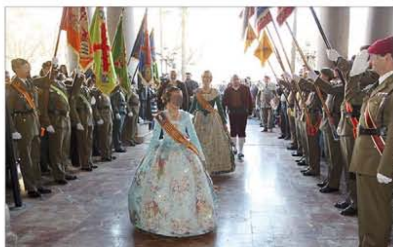
Recepción de las falleras mayores a su llegada al acuartelamiento

La delegación alemana ha demostrado su hegemonía en todas las pruebas disputadas (⇒ intranet 12/03/2012).