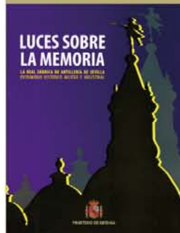
J. SOBRINO SIMAL (coord.), Lucas sobre la memoria , Ministerio de Defensa, Madrid, 2011, 239 pág.