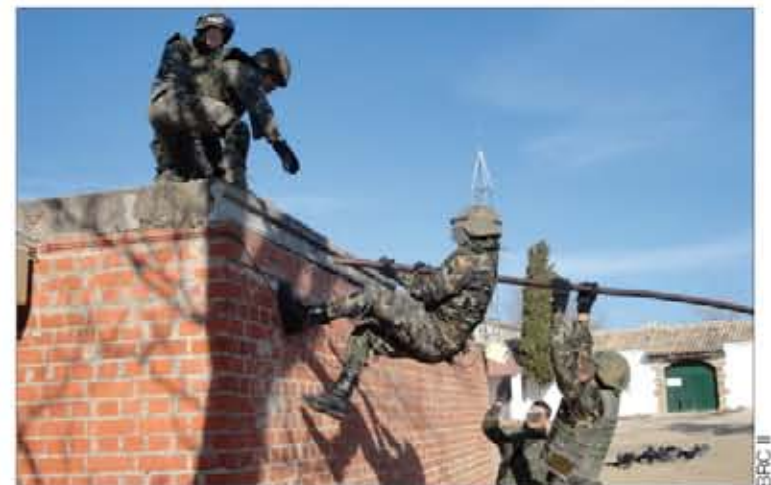
Hubo también prácticas en la pista de combate y en la de silencio

La misión del OMLT de Cuartel General es la de instruir al Cuartel General de la 3ª Brigada del 207º Cuerpo de Ejército del Ejército Nacional Afgano que opera en la provincia de Badghis y actuar como enlace entre la Fuerza Internacional de Asistencia a la Seguridad en Afganistán y el mencionado Cuartel General.