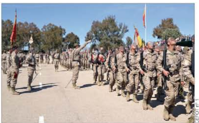
Un total de 473 nuevos soldados juraron Bandera en Cáceres

Al día siguiente, el CEFOT nº 1, ubicado en el acuartelamiento