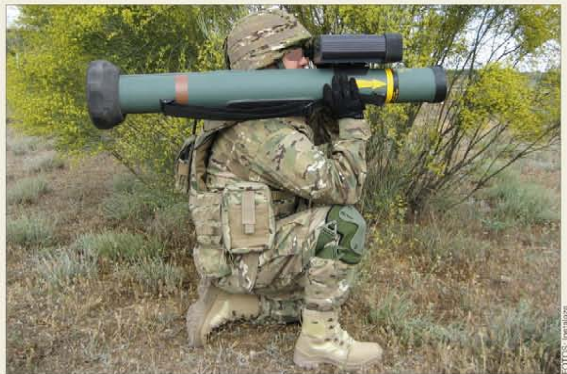
Posición de disparo: el arma al hombro y observando por la dirección de tiro

El Alcotán-100 es un arma ligera, que se coloca sobre el hombro para disparar, y que tiene un alcance superior a 500 metros. Cubre el rango intermedio entre el lanzagranadas C-90 y el misil Spike , y sus características le permiten batir una amplia variedad de blancos, como los actuales carros de combate dotados con los blindajes más modernos. Tiene un bajo retroceso y su firma visual y acústica es mínima.