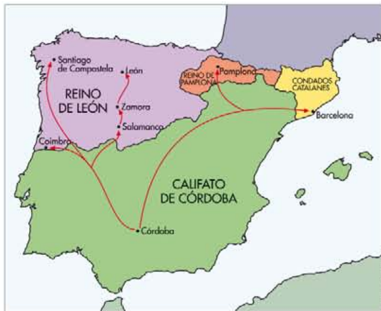
Algunas de las principales rutas seguidas por Almanzor

Cuando murió el califa Alhakén II, Almanzor tomó partido en defensa de su heredero, Hisham II (que tan solo tenía 11 años), y en contra del tío de este, a quien asesinó. Posteriormente, salvó al califa de una conspiración que per-