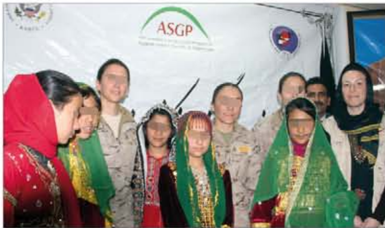
Entrega de premios a alumnas del colegio construido por España

Además, el 8 de marzo, con ocasión del Día de la Mujer, tuvieron lugar una serie de actos en las dependencias de la Gobernación, antigua sede del PRT español. En ellos participó una amplia representación de asociaciones de mujeres de la provincia y del contingente español. Las militares españolas repartieron premios entre las alumnas más destacadas del colegio construido por nuestro país, con la ayuda de la Agencia Española de Cooperación Internacional para el Desarrollo (AECID). También se premió a las primeras mujeres policía, que han sido instruidas por militares españolas, y a un coro de niñas afganas.