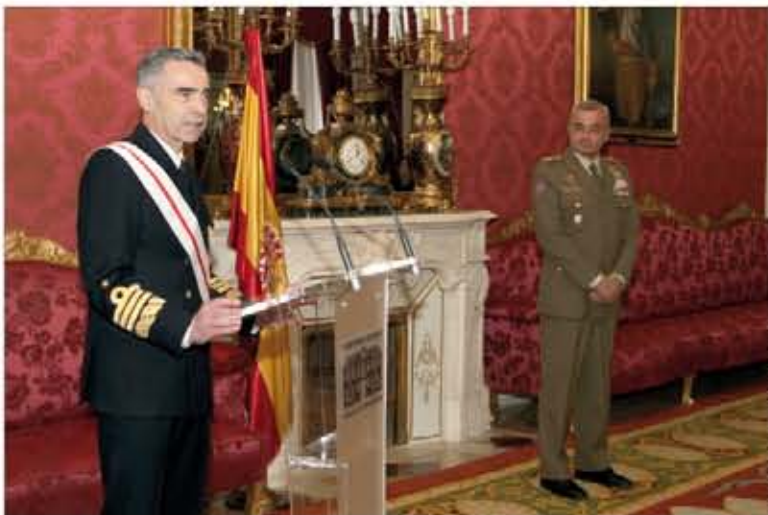
El almirante general dirigió unas palabras tras recibir la Gran Cruz