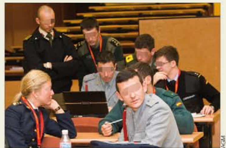
Cadetes de varios ejércitos en la Academia General Militar