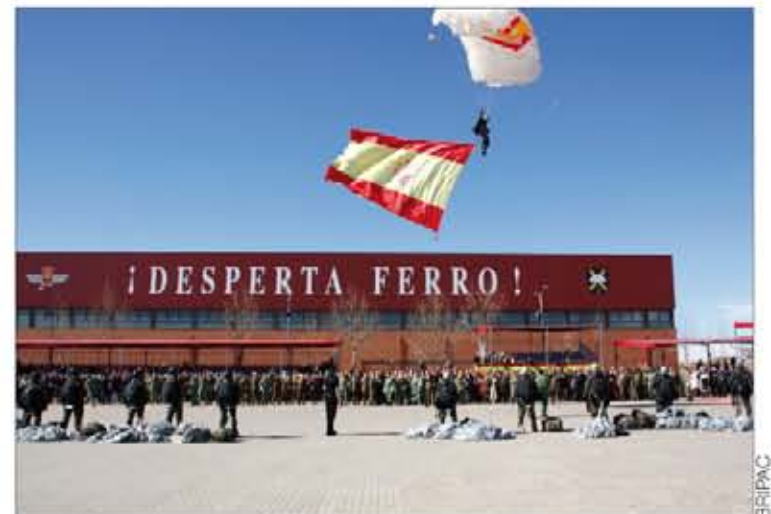
El último paracaidista del lanzamiento con la Bandera de España

La AALOG nº 11 subastó el año pasado 276 armas. Del dinero obtenido, 4.894,83 euros fueron donados por los propietarios a esta asociación benéfica particular sin ánimo de lucro, que se mantiene gracias a las aportaciones de sus 93.000 socios (militares) y de donativos privados. Los miembros del Ejército contribuyen con un 1% de su sueldo base a atender las necesidades de unos 1.500 huérfanos de militares.