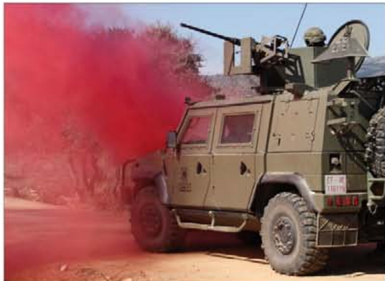
Incidente con un IED simulado con humo rojo

El objetivo de las diferentes actividades programadas fue incrementar la cohesión interna, y perfeccionar los aspectos de instrucción y adiestramiento necesarios para superar la evaluación final (a cargo de Fuerzas Ligeras); de este modo obtienen la certificación