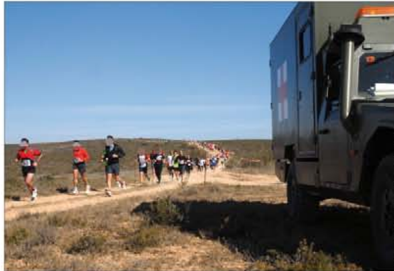
Parte de la carrera discurrió por el campo de maniobras "San Gregorio"

La prueba —celebrada el 11 de marzo en Zaragoza— también fue un éxito de participación, ya que un total de 1.500 corredores se dieron cita en la línea de salida. Todos ellos disfrutaron de los 18,54 kilómetros del recorrido, con un desnivel acumulado de 600 metros, que transcurrieron, en su mayoría, por terrenos del Centro de Adiestramiento "San Gregorio".