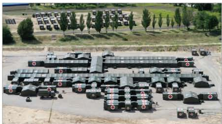
Imagen del despliegue de presentación del HOC

Tras el juicio crítico comenzará el repliegue, en el que se invertirá algo más de un mes, hasta finales de julio. Paralelamente, se abrirá una fase de análisis e informes para reflejar todas las vicisitudes y hacer una evaluación a fondo de los resultados.