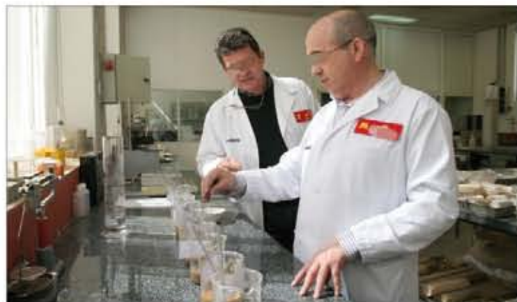
Laboratorio de la Sección de Mecánica de Suelos

El laboratorio también hace hincapié en sus relaciones institucionales, por lo que es miembro de varias asociaciones (entre ellas, la Unión Internacional de Física Pura y Aplicada) y miembro de diversas comisiones técnicas, como la Comisión Permanente de Materiales de Construcción, que integran distintos ministerios. El LIE no solo se esfuerza por mantenerse en la punta de lanza de la tecnología, sino que también se proyecta hacia el futuro y se relaciona con su entorno. Ha pasado más de un siglo y no ha parado de reinventarse.