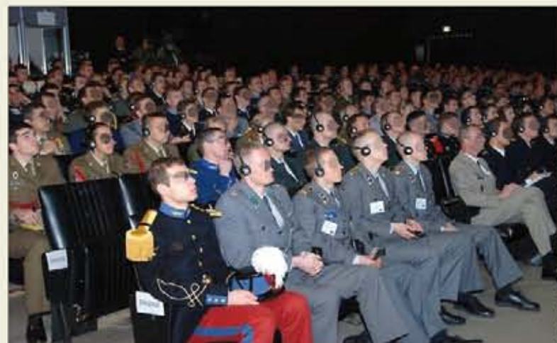
Cadetes españoles y franceses usando la traducción simultánea

Además, este sitio garantiza la pertinencia de sus contenidos, ya que se actualizan dos o tres veces a la semana. Este esfuerzo tiene su recompensa: 45.000 visitas durante el último año.