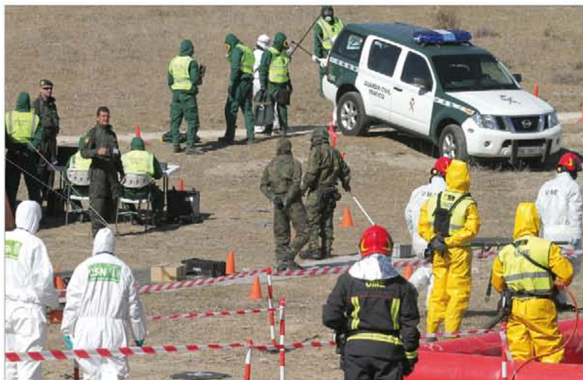
Dos millares de civiles y militares se dieron cita para realizar este ejercicio

Destacada presencia del Ejército en el “Cogolludo”