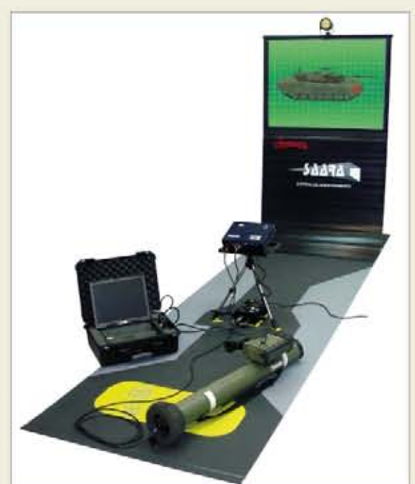
El simulador SAARA es totalmente portátil

El TR-ALC presenta la misma forma externa, dimensiones y peso que una munición de guerra, y se maneja de igual manera. La munición que utiliza este entrenador es un cartucho de diseño específico, denominado CAR. TR-ALC, formado por una bala trazadora y una carga de rebufo. Dadas las características de la bala trazadora, tanto el instructor como el tirador pueden seguir la traza hasta el blanco, lo que permite una inmediata evaluación del disparo. La carga de rebufo simula el efecto a retaguardia de la munición real.