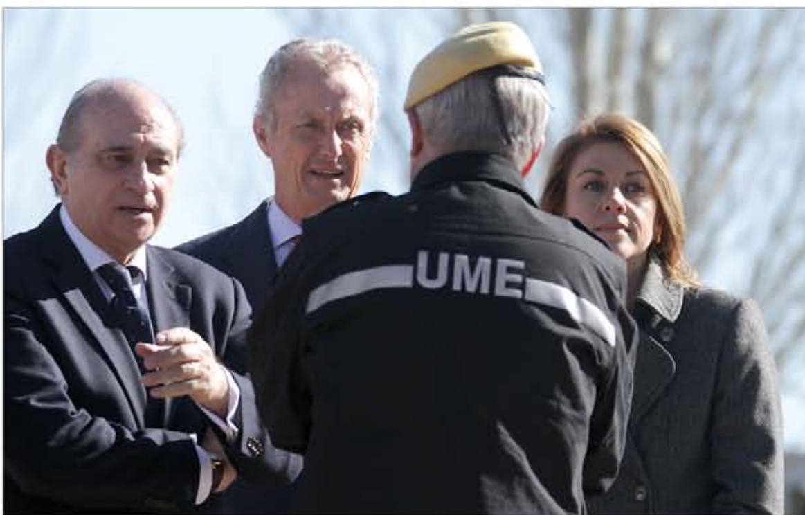
La presidenta manchega, y los ministros de Interior y Defensa presenciaron diversas incidencias

El ejercicio tipo gamma "Cogolludo", que se ha ejecutado del 5 al 7 de marzo en Guadalajara, ha marcado un hito histórico al ser el primero que se realiza en España sobre el supuesto de una situación de emergencia del máximo nivel (nivel 3), y el Ejército de Tierra ha