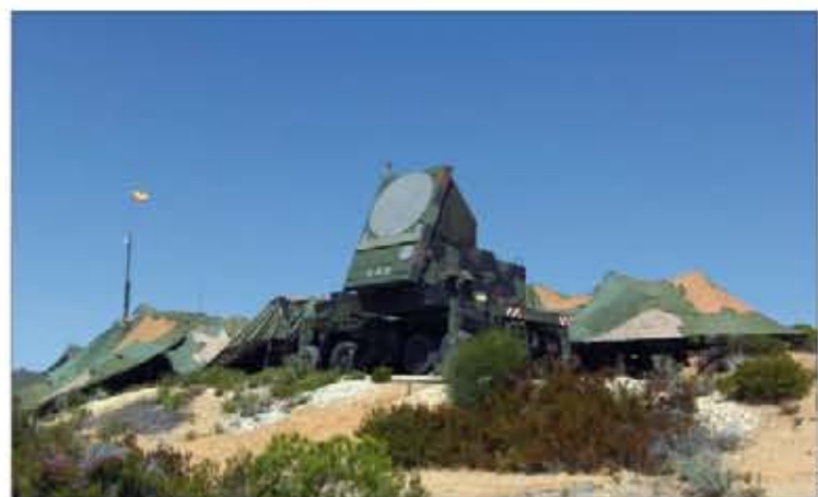
Las señales de EW inciden sobre los radares que usan los artilleros