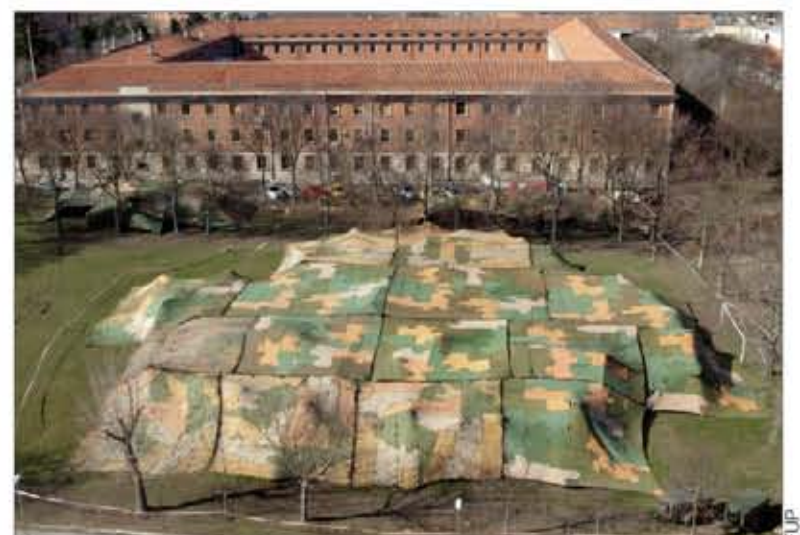
Despliegue del CGFUP durante el ejercicio

herramienta de colaboración sobre soporte web, desarrollada por la G6, Sección CIS (Sistemas de Información y Telecomunicaciones) del CGFUP, que permite la incorporación de la información de los diferentes apartados de la orden de operaciones de forma simultánea y controlada.