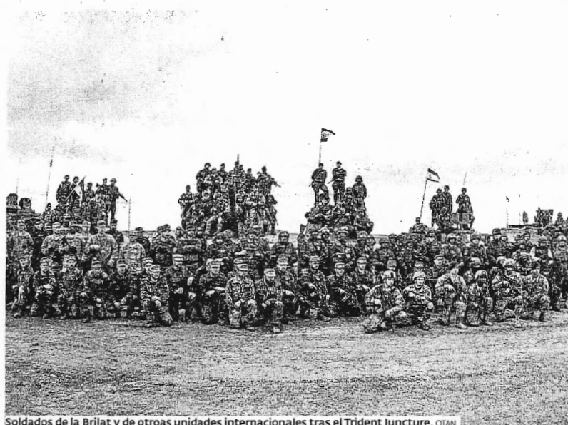
Soldados de la Brilat y de otras unidades internacionales tras el Trident Juncture.

El titular de Defensa confió en que la cumbre de la Otan que se celebrará en Varsovia en julio de 2016 «sirva para acordar definitivamente la presencia permanente de tropas de la Alianza y también para fortalecer la base de armamento pesado».