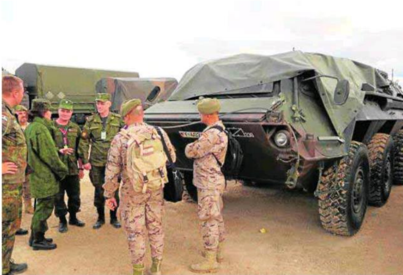
Equipo de inspectores con personal de unidades alemanas en el 'TRJE 15'.