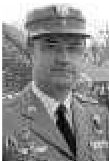
General Jefe de la Legión de Viator

La base Álvarez Sotomayor de Viator ha acogido durante unos días las maniobras de componente marítimo de la OTAN. La base ha respondido con un notable alto al despliegue de marines británicos y americanos.