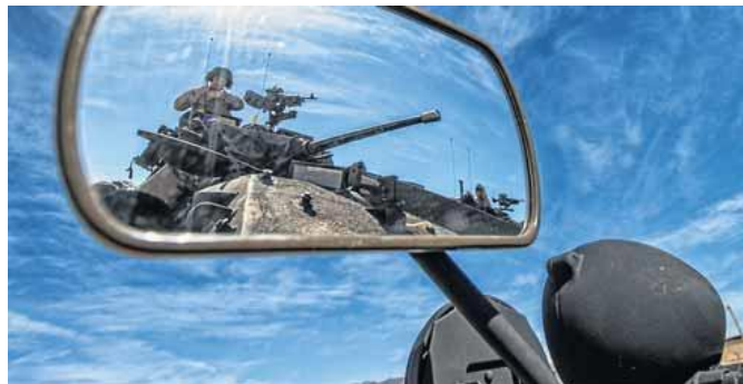
MARINES en un carro de combate en Almería durante las Trident Juncture.

España dará así continuidad a su participación en misiones de la OTAN (véase el despliegue en Afganistán recién concluido) y aportará, al menos, 4.000 militares a esta fuerza de reacción, capaz de desplegarse en un corto periodo de tiempo. Se-