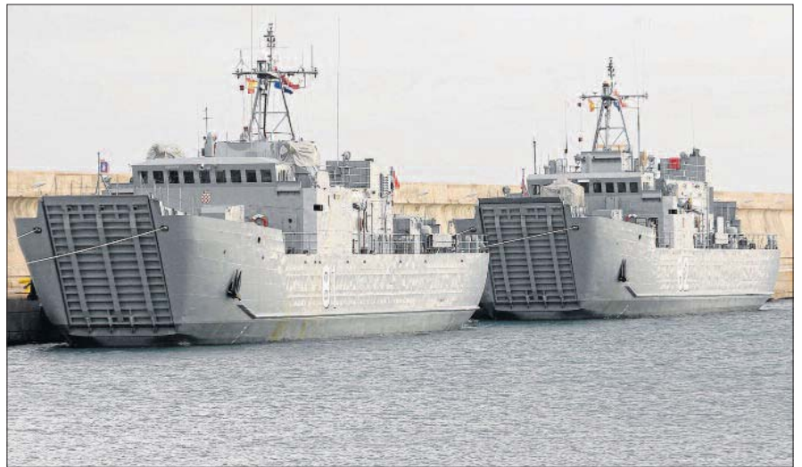
Barcos croatas atracados ayer en Sagunt.

Estos no son los únicos movimientos militares previstos próximamente en Sagunt. Después de