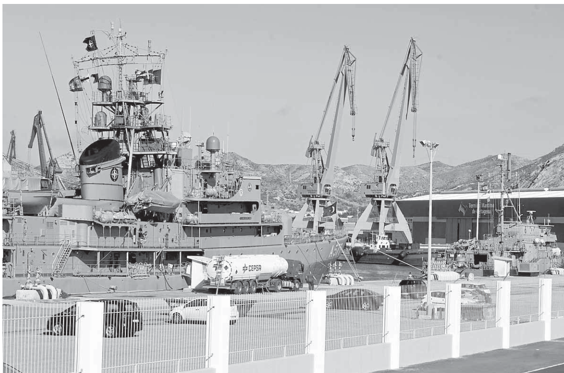
Los buques turcos y alemán, atracados en el muelle de La Curra, ayer a mediodía.