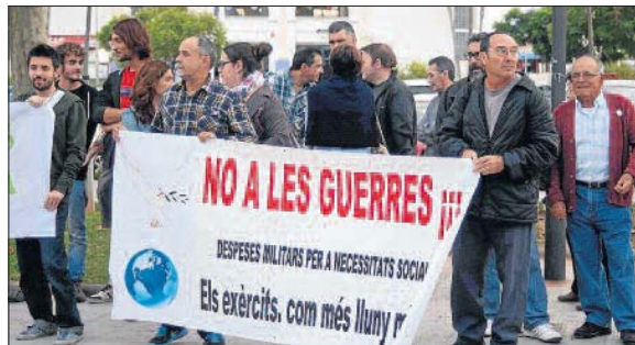
Una veintena de personas acudió a la concentración.

las maniobras de la OTAN que comenzarán el día 24 en otras comunidades autónomas y se prolongarán hasta el 6 de noviembre, se espera que el puerto saguntino vuelva a recibir los tráfico de varios ejércitos extranjeros, durante el repliegue a sus países, si bien desde Defensa matizaban que no hay nada confirmado.