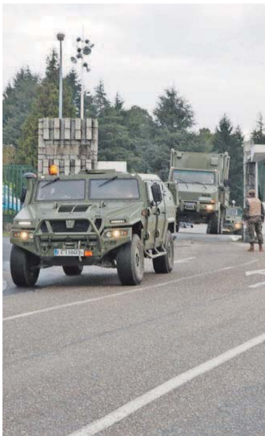
Los convoyes de la Brilat partieron ayer escalonadamente.

El esfuerzo que este operativo ha supuesto para la Brilat se refleja en el hecho de que se haya tenido que acudir a empresas privadas de transporte para trasladar aquellos vehículos y maquinaria que, por sus características, sería imposible que cubrieran por sus propios medios los más de ochocientos kilómetros —más de novecientos si se opta por la autovía A-8, la que discurre por la cornisa