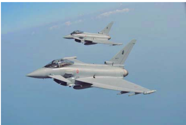
Dos Eurofighter italianos

Este ejercicio ha despertado una gran expectación tras la reciente escalada de tensión entre Rusia y la OTAN por la incursión de aviones de combate rusos en el espacio aéreo de Turquía (miembro de la Alianza Atlántica).