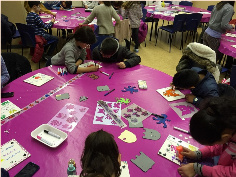
Talleres de actividades en el Aula Didáctica del museo.

El Museo del Ejército os ofrece la oportunidad de conocer una parte de su colección con esta visita-taller. Primero, durante la visita, descubriremos las piezas más antiguas del Museo, aquellas pertenecientes a los primeros pobladores de la Península Ibérica, desde las primitivas armas prehistóricas, pasando por las legiones romanas y pobladores visigodos. Os aseguramos que nos "meteremos en su piel" para conocerlos. También veremos cómo cada uno de estos pueblos y culturas han dejado su huella en nuestro edificio, adaptándolo a su gusto y necesidades. Para ello conoceremos mejor los restos arqueológicos del Alcázar, viendo cómo ha evolucionado desde fortificación a Museo. Posteriormente, en el taller, os enseñaremos cómo y con qué materiales trabaja un arqueólogo. Crearemos nuestra propia excavación, descubriréis vosotros mismos todo tipo de objetos que nos podemos encontrar excavando y veremos qué información nos dan de la antigüedad. Por último, realizaremos nuestra propia estratigrafía del pasado para llevárnosla a casa.