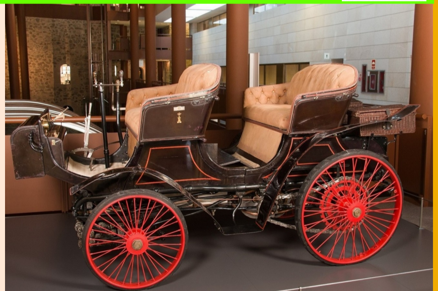
Arriba: vehículo modelo Peugeot Phaeton del año 1898.

Modo de inscripción: en las taquillas del Museo, el mismo día de la actividad. // El número de plazas vendrá determinado por la normativa sanitaria vigente // La entrada al Museo y sus actividades es gratuita, temporalmente.