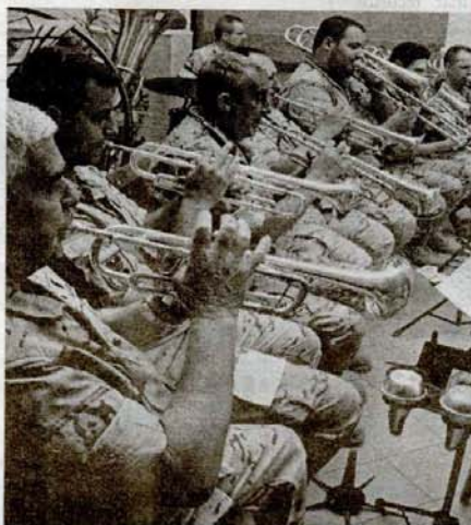
Trompetistas de la Banda