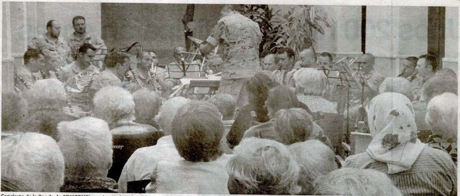
Concierto de la Banda de COMGEMEL en el patio interior del Centro Asistencial