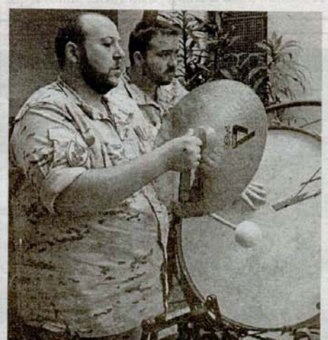
Dos de los músicos durante la actuación