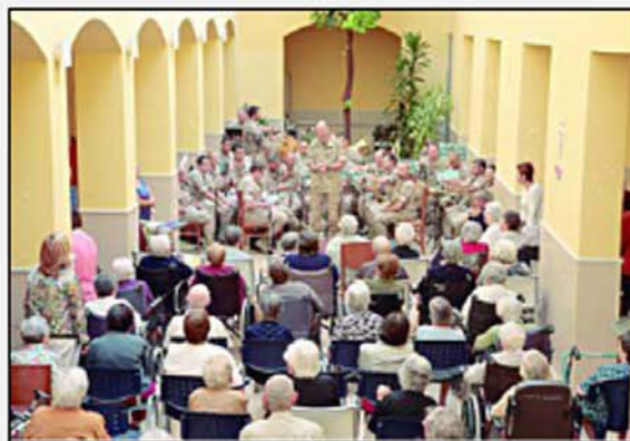
La actuación tuvo como marco el patio del Centro Asistencial

Pérez, de un generoso repertorio de piezas entre las que se encontraban los pasodobles "Suspiros de España", "Los Nardos", "Cielo Andaluz", "Certamen Levantino", "La Orgía Dorada" o "Las Corsarias", pero en la que tampoco fallaron las consabidas marchas militares con son los casos de "Comandante Albillios" o "Coronel Bogey" o la popular zarzuela "La leyenda del beso".