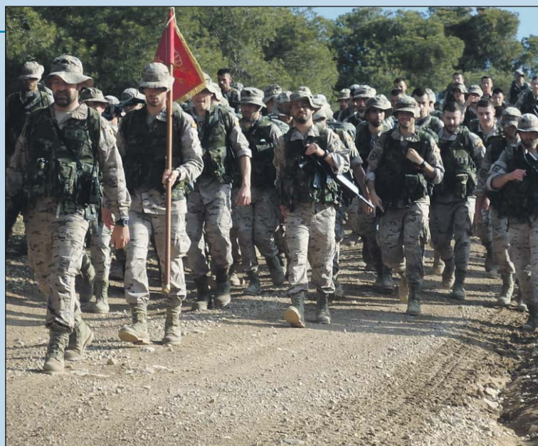
Los cadetes demostraron una buena preparación física.

El recorrido se llevó a cabo sin modificaciones con respecto al plan establecido. El Batallón al completo cubrió los 10 kilómetros de la prueba, entre cánticos y pequeñas