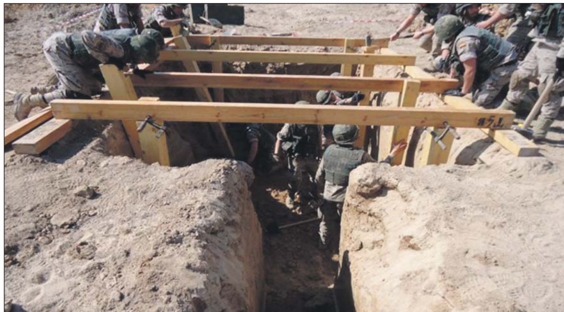
Armas y Cuerpos

Los alfereces cadetes afrontaron durante sus prácticas en las unidades de zapadores numerosos cometidos de apoyo a la movilidad.