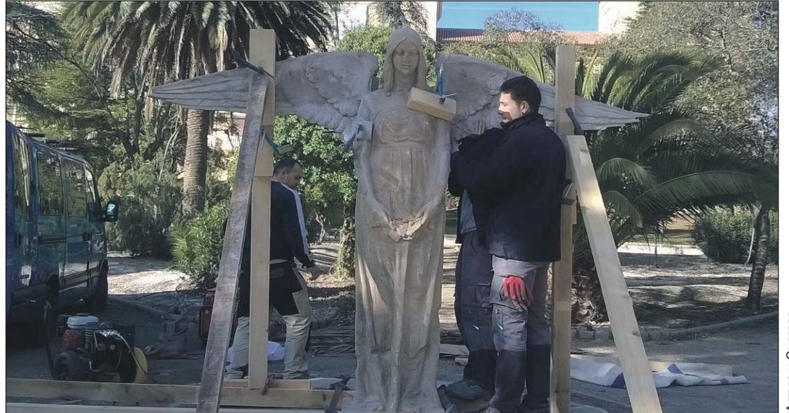
Armas y Cuerpos

Sobre estas líneas, varios alumnos poniendo un suelo. A la derecha, un momento de la restauración del ángel custodio del Cuartel General Luque.