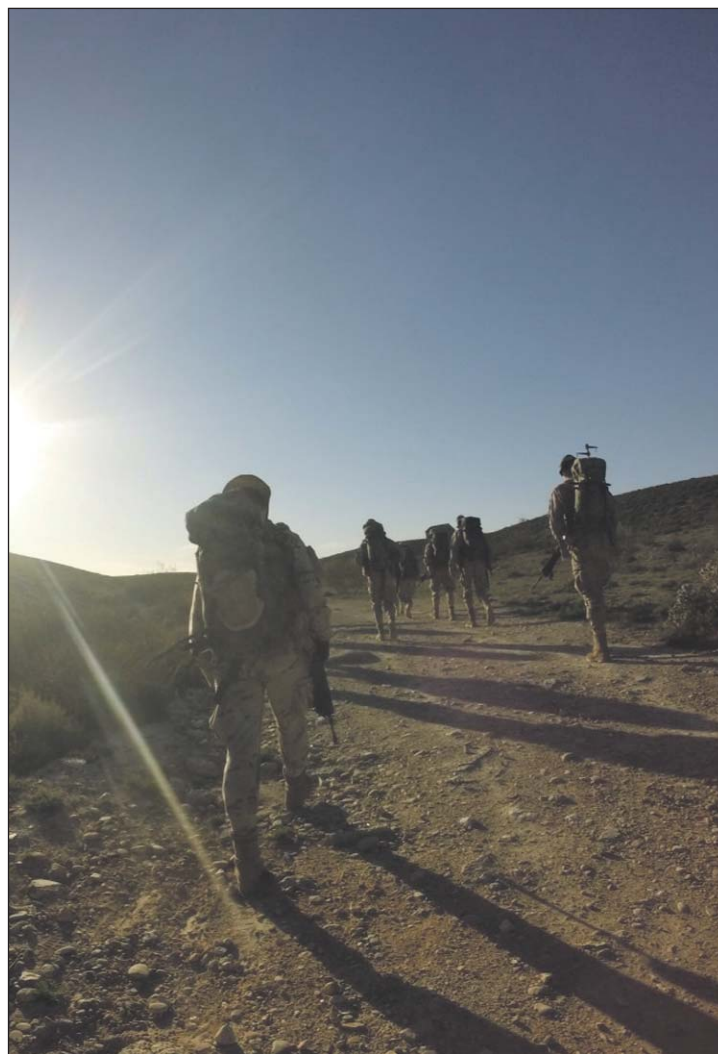
Armas y Cuerpos

Hemos avanzado en formación del combatiente, asimilando lo que es una escuadra y su funcionamiento, practicando a mandarla con las instrucciones