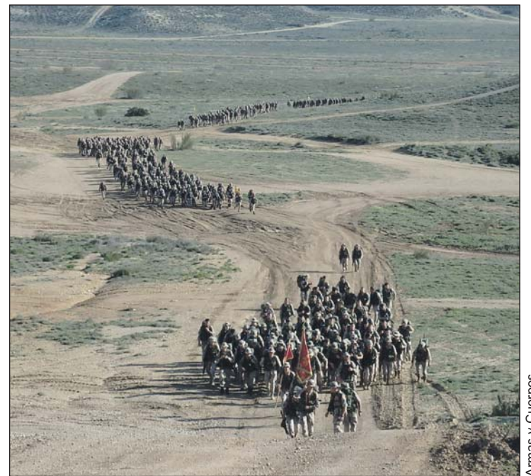
Armas y Cuerpos

Otro de los aspectos más valorados ha sido la posibilidad de tener a su alcance medios con los que normalmente no se trabaja en la Academia General Militar.