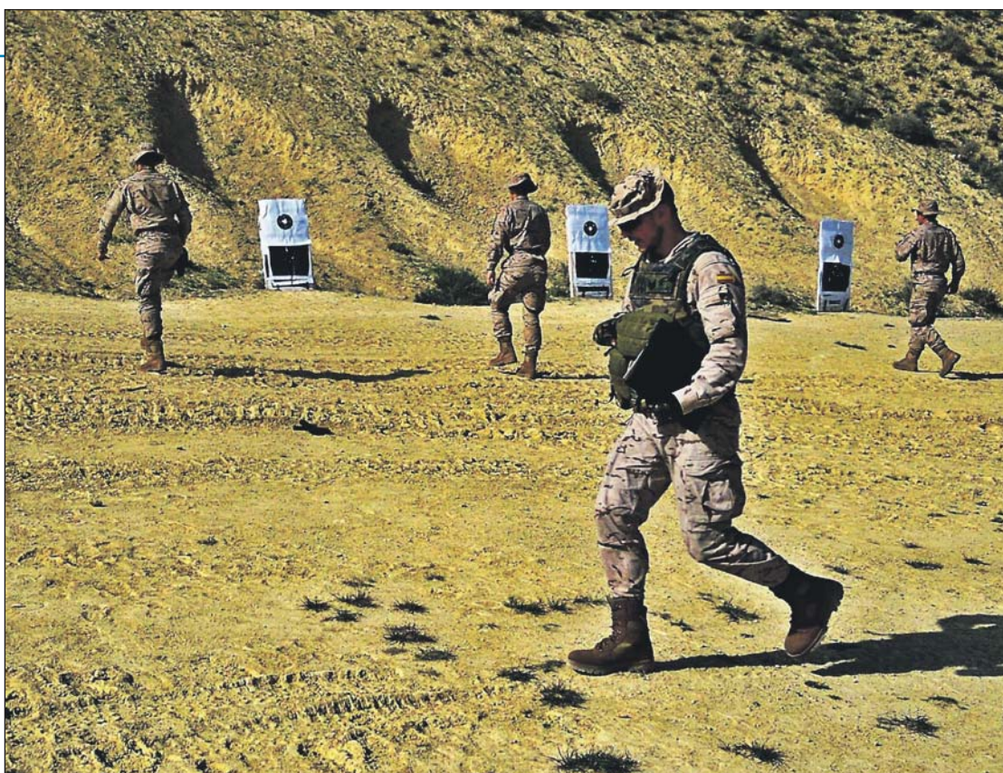
Un momento de las prácticas realizadas en el campo de tiro.

Es ahora el momento a partir del cual el alumno de tercer curso comienza a experimentar la dificultad que entraña la enseñanza. Para poder enseñar una habilidad, procedimiento o conocimiento, es requisito indispensable que el instructor posea un entendimiento notable del mismo. Pero, el hecho de estar en posesión de saber y