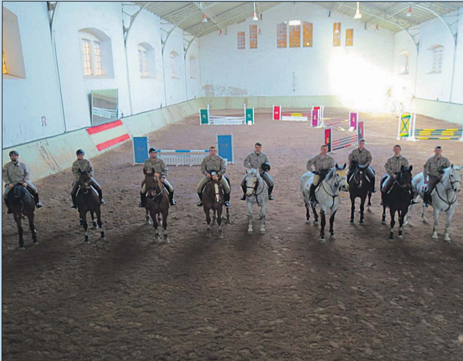
Armas y Cuerpos