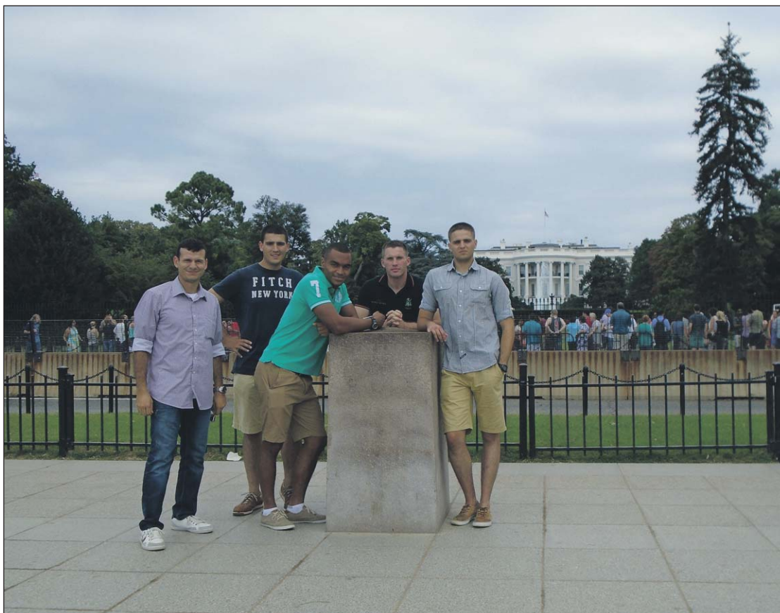
Los alféreces animan a sus compañeros a vivir experiencias como esta u otras parecidas.

En ese sentido, prosiguen, para aclarar un poco más estas diferencias, “hay que decir que la idea que nosotros tenemos en España de un oficial es muy distinta a la de ellos. Ellos cuentan con una cadena de suboficiales que no es como la nuestra. Aquí un suboficial manda hasta el pelotón y después ya a nivel brigada o subteniente tienen otros cometidos. Allí, para cualquier tipo de Unidad a partir de sección, compañía, batallón, brigada, división... Incluso el Ejército entero tienen un suboficial que asiste de manera más directa al mando. Es decir que un oficial allí está más para ejercer el liderazgo que lo que son los temas tácticos”.