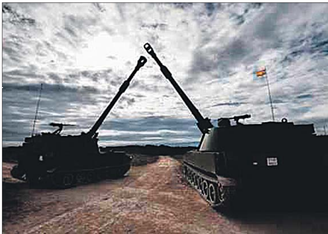
Armas y Cuerpos

En este periodo, los Mandos del Batallón aprovechamos para revisar nuestras normas, procedimientos, etc, así como para hacer algo de instrucción, como marchas y tiro. También continuamos preparando las actividades que nos esperan a la vuelta de esas prácticas. Pero no nos olvidamos de los Cadetes. La continua comunicación con ellos y con sus tutores académicos y militares podría ser suficiente, pero es con el contacto directo como mejor se observan tanto los aciertos en los procedimientos utilizados, como los fallos o problemas que se puedan encontrar los Cadetes en estos días en los que prestan servicio