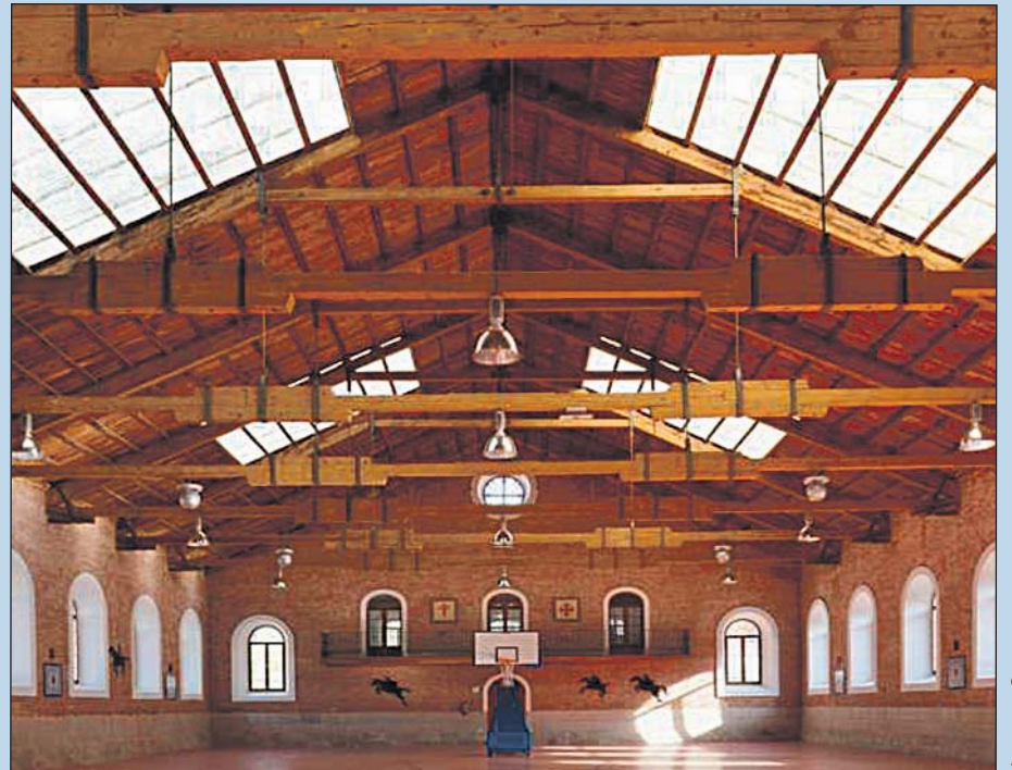
Armas y Cuerpos

Sobre estas líneas, cadetes en la última competición de saltos en nuestro picadero. A la derecha, picadero de la Academia de Caballería.