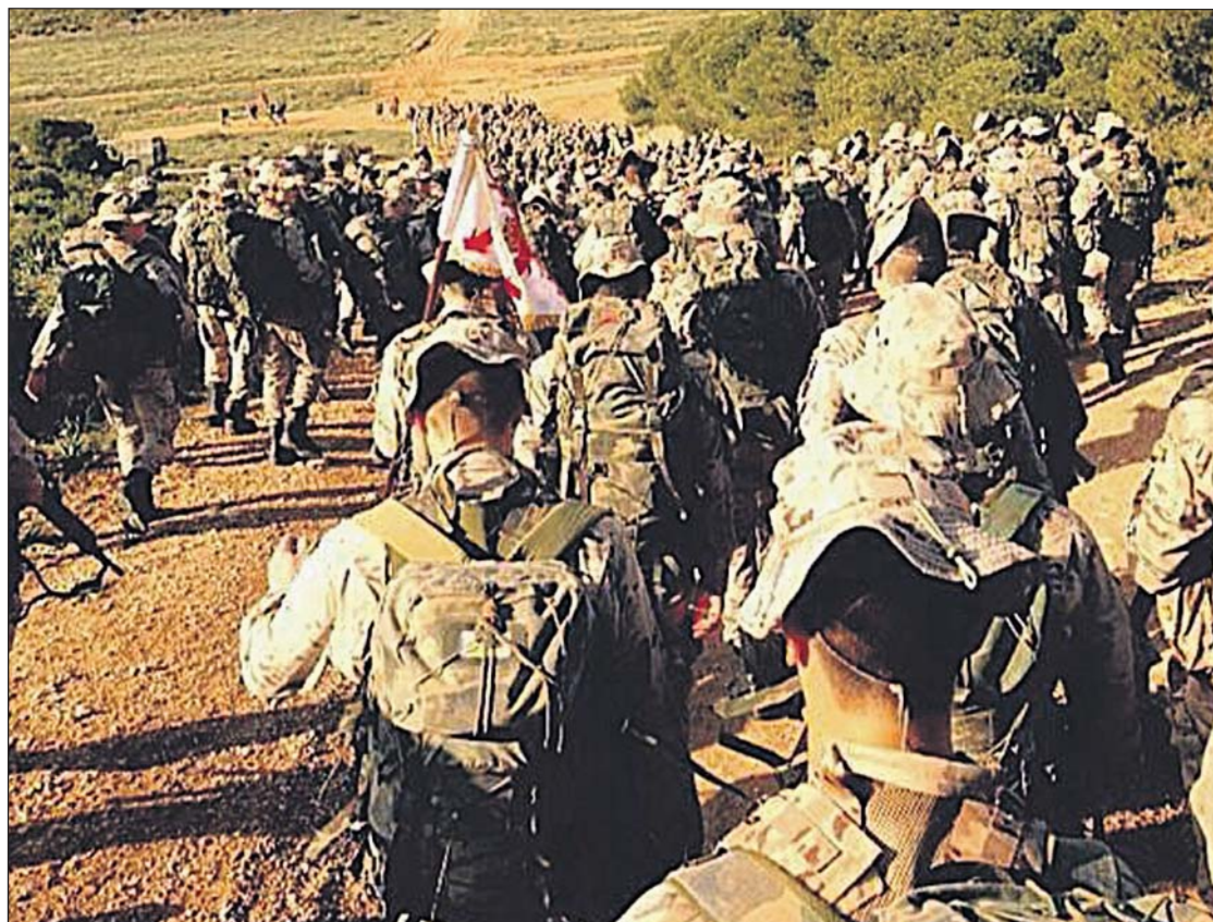
Un momento de la Prueba de Unidad realizada por todos los integrantes del II Batallón.

Al finalizar, aunque cansados, nos sentimos satisfechos. Porque el sufrimiento, en grupo, es mucho más llevadero. Donde el que más hasta el que menos tienen que acabarla, y acabarla juntos, porque no es una prueba individual, sino de grupo.