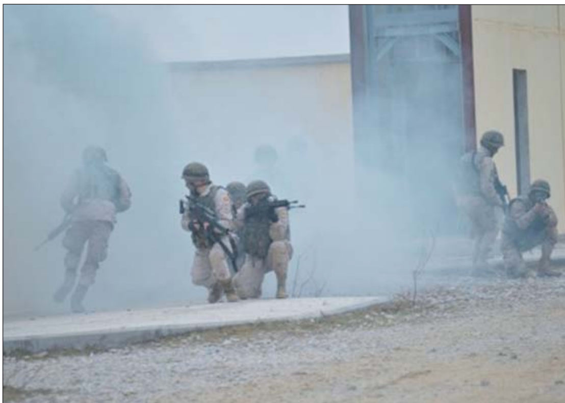
Durante las maniobras han mandado varios temas en maniobras o líneas de tiro.

Al estar repartidos por toda la geografía española, cada alférez tiene una historia y una experiencia personal de sus prácticas distinta al resto, incluso entre compañeros que han ido a la misma Unidad: los hay que han mandado varios temas en maniobras, líneas de tiro, sesiones de formación física, los que han impartido teóricas, incluso los que han participado en procesiones de Semana Santa al coincidir este periodo