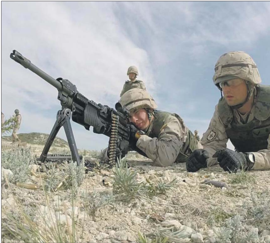
Los cadetes han practicado el tiro con armamento que no habían utilizado hasta ahora.

No todos los cadetes pudieron practicar el tiro con el lanzagranadas C90, pero los afortunados disfrutaron y vivieron de cerca una experiencia difícil de olvidar. Aunque ya se había entrenado con el TR90, el tiro con el C90 aportar sensaciones mucho más reales