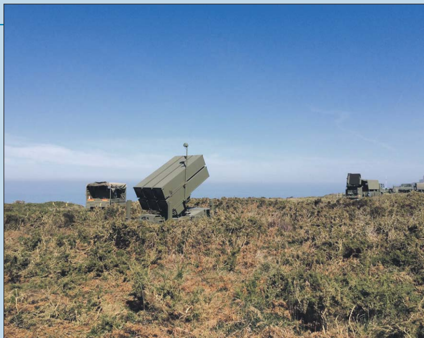
Armas y Cuerpos

Otro aspecto digno de mención es el trato constante con suboficiales y tropa, poco conocido como consecuencia de tratar mayormente con compañeros y superiores durante nuestra formación. En ese sentido, considero estas prácticas como una oportunidad inmejorable