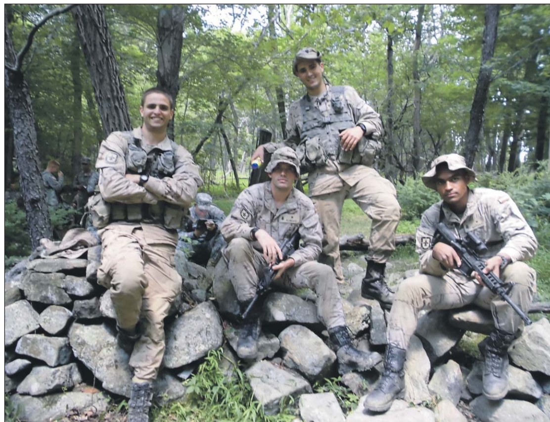
Los alféreces cadetes españoles han participado en todo tipo de actividades en West-Point.

Por su parte, el CAC. Jorge Ciprés añade que "allí cada compañía tiene un comandante o capitán y luego un suboficial y esos son los jefes de compañía y en verdad ellos no interfieren para nada en el funcionamiento de la compañía pues dejan hacer a los cadetes".