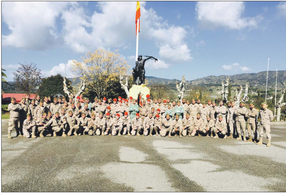
Los alféreces cadetes han podido disfrutar del mando de unidades tipo Sección.

Durante este periodo hemos podido conocer todas las unida-