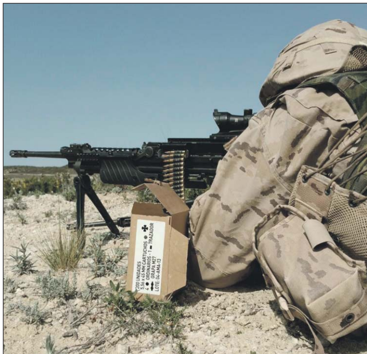
Armas y Cuerpos