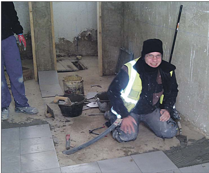
Armas y Cuerpos