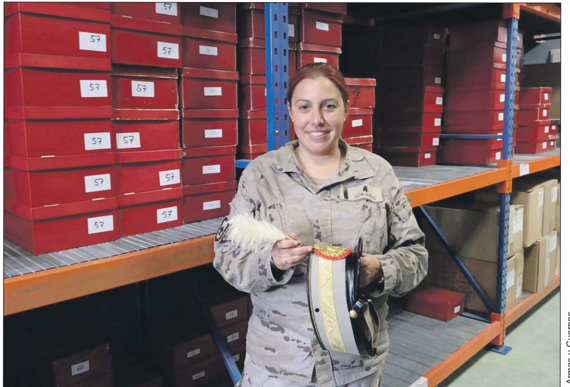
Armas y Cuerpos

A lo largo de estos años ha participado en distintas misio-