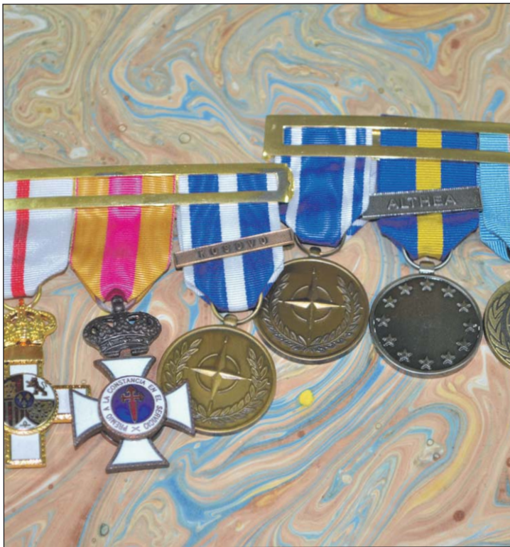
Armas y Cuerpos

La soldado recuerda el aprendizaje en las zonas de conflicto porque “al vivir muy de cerca la realidad de un país en guerra valoras mucho más lo que tienes en tu vida diaria”