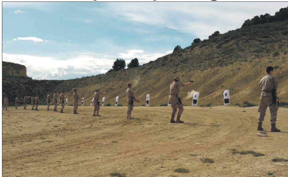
Armas y Cuerpos

Durante estas maniobras los cadetes han realizado prácticas de tiro con fusil, ametralladora ligera, pistola y lanzagranadas.