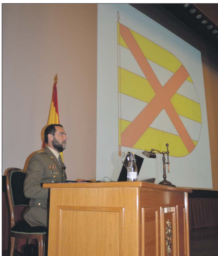
El ponente hizo un repaso de la evolución de las banderas.