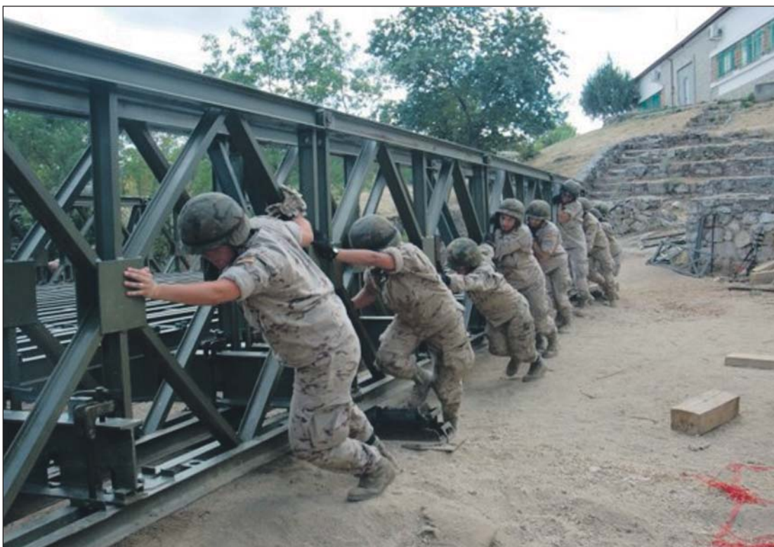
Armas y Cuerpos