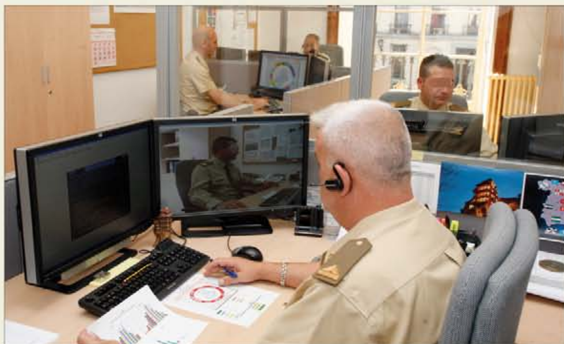
Los orientadores son personal especializado en gestión de recursos humanos y técnicas de comunicación

La Sección de Orientación avanza a paso de gigante en su campaña de difusión