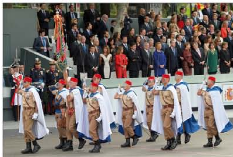
Grupo de Regulares de Ceuta nº 54, procedente de Ceuta

to por personal de la BRIPAC (Escuadra de Gastadores, Música, Mando y Plana Mayor de Mando y una compañía de la Bandera "Roger de Flor", 1 de Paracaidistas), el Regimiento de Infantería "Inmemorial del Rey" nº 1 (una compañía) y la Jefatura de Tropas de Montaña (Compañía de Esquiadores-Escaladores del Regimiento de Cazadores de Montaña "Galicia" nº 64).