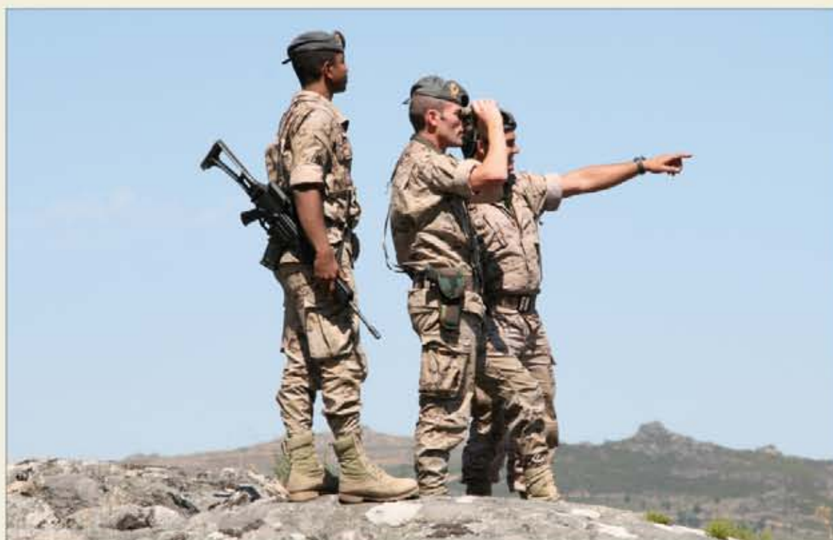
Cada patrulla estaba compuesta por tres personas: un jefe de patrulla, un conductor y un observador

La labor de vigilancia del personal implicado en la operación