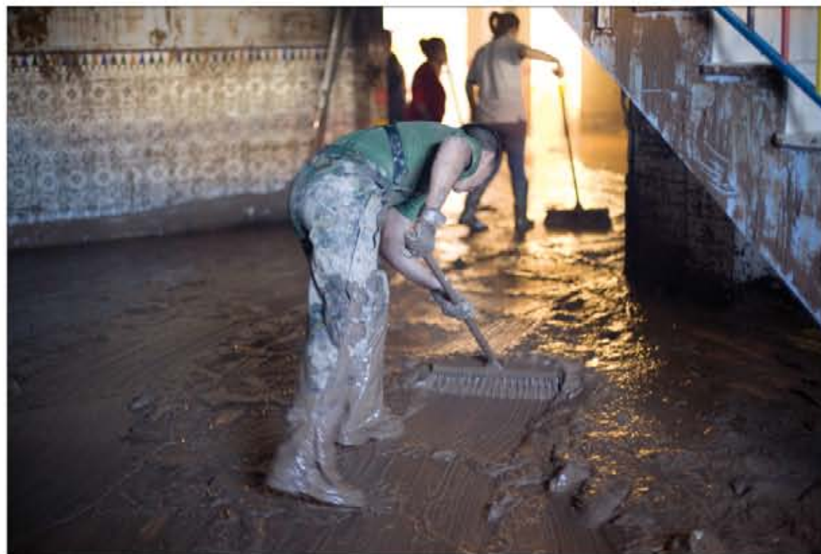
El trabajo de la Legión se desarrolló tanto en el interior de viviendas (arriba) como en el exterior, mano a mano con los vecinos (izquierda). Doña Sofía felicita a la Legión durante su visita a Vera (abajo).

«Estos chicos echan las dos manos y el corazón», le dijo un vecino a otro