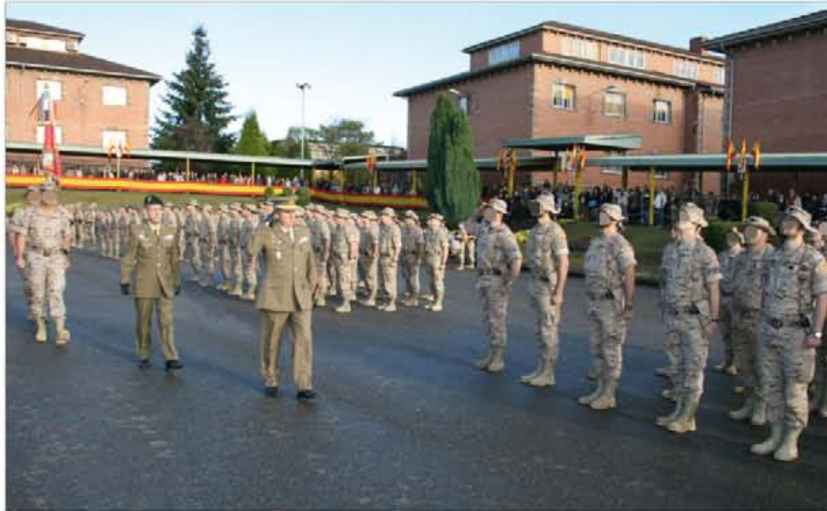
El teniente general Medina presidió la despedida del próximo contingente que desplegará en Afganistán

sofisticados y punteros con los que cuenta el Ejército.