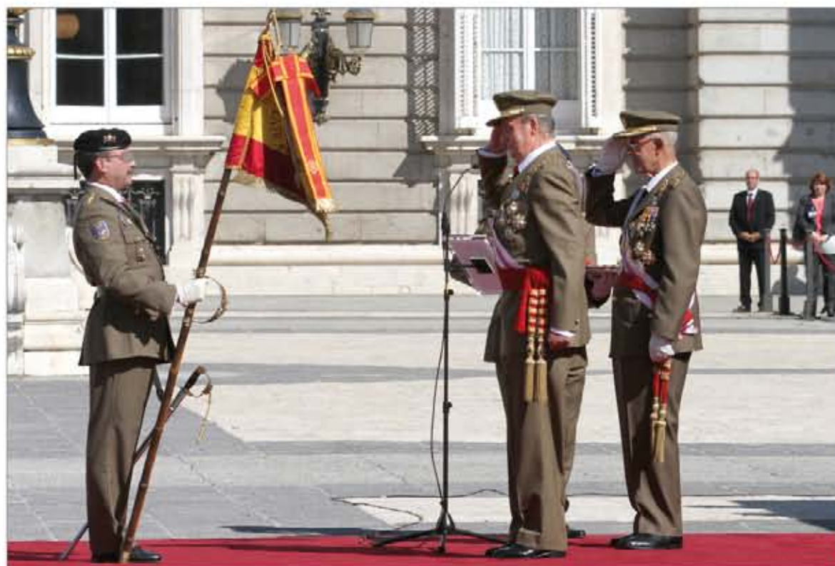
El Rey saluda al Estandarte del RCAC nº 10 tras imponerle la corbata de la Laureada Colectiva

El Estandarte del RCAC nº 10 estuvo acompañado por las 24 Banderas o Estandartes que tienen concedido el uso de, al menos, una corbata de la Laureada Colectiva o de la Medalla Militar Colectiva, en representación de las unidades que pertenecen a la Real y Militar Orden de San Fernando.