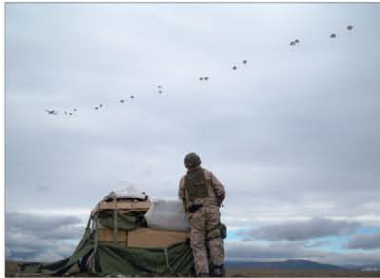
Lanzamiento de cargas en el transcurso del ejercicio

Además, durante la realización del ejercicio se puso a prueba la capacidad operativa de la Sección de Lanzamiento de Cargas, que ha vuelto a la BRIPAC, tras una últi-