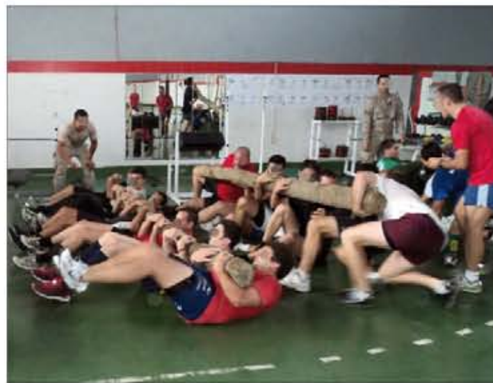
Jugadores del Batcho Independiente entrenando con troncos