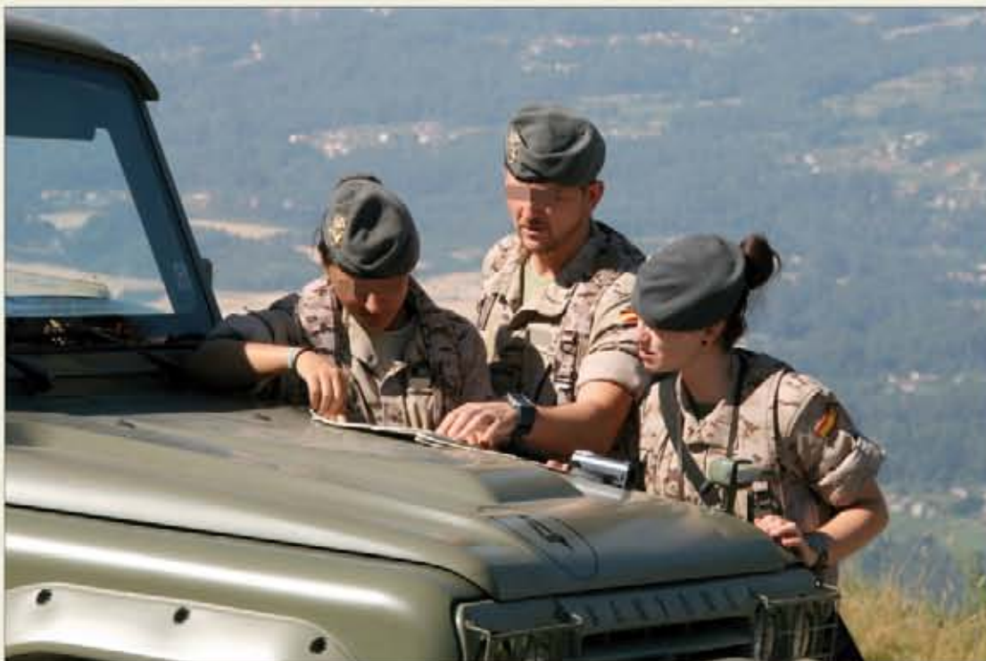
Las patrullas de la BRILAT han vigilado varios distritos forestales de Orense y Pontevedra

Las páginas centrales de este número están dedicadas al trabajo de prevención de incendios forestales llevado a cabo por la Brigada de Infantería Ligera "Galicia" VII en el marco de la operación "Centinela Gallego", que finalizó el 2 de octubre.