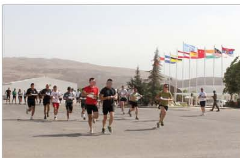
Salida de la prueba de orientación por binomios