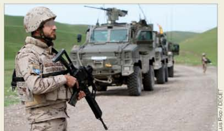
La OTAN está en pleno debate del futuro de la misión en Afganistán

De la cumbre de Lisboa, en la cual se definieron las tendencias de la Alianza como proveedor de seguridad para afrontar las nuevas amenazas mediante la expansión del área geográfica, la incor-