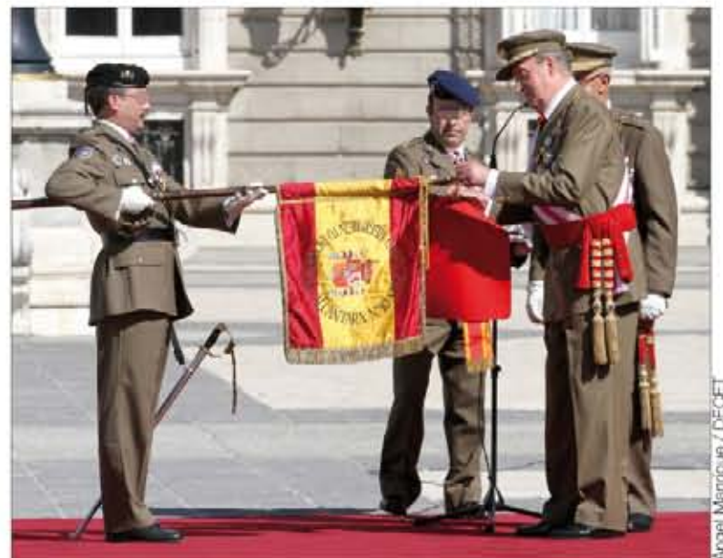
Don Juan Carlos impuso la corbata al Estandarte de la unidad

Su Majestad el Rey impuso la corbata de la Cruz Laureada de San Fernando, en su categoría de Laureada Colectiva, al Estandarte del Regimiento de Caballería Acorazado (RCAC) "Alcántara" nº 10, en un solemne acto celebrado el 1 de octubre en la plaza de la Armería del Palacio Real de Madrid.