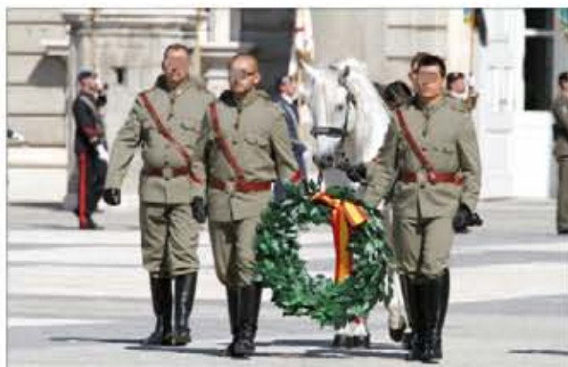
Acto de homenaje a los que dieron su vida por España