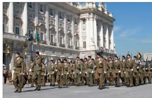
El RCAC nº 10 desfiló por el exterior del Palacio Real