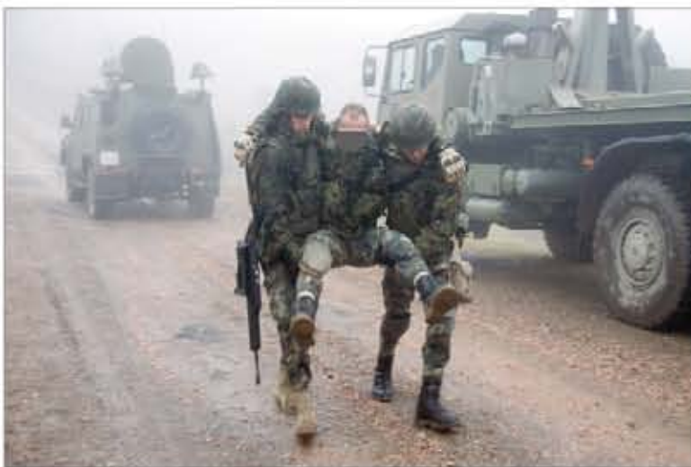
Una patrulla española se encuentra con una manifestación (arriba); evacuación de la víctima de un IED (izquierda).

mientos estipulados, y tengan muy claro lo que pueden y no pueden hacer», añade.