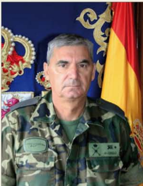
El general Alonso es el jefe de la BRILAT desde 2009

Una mayor sensibilidad en la lucha contra los incendios. Realmente, llegas a contagiarte e, incluso, preocuparte por los incendios hasta el extremo de involucrarte al máximo, como si fuera una verdadera operación militar, yendo incluso más allá de lo estrictamente necesario. Por tanto, se precisa motivación y, lo que es más importante, ser capaz de trasla-