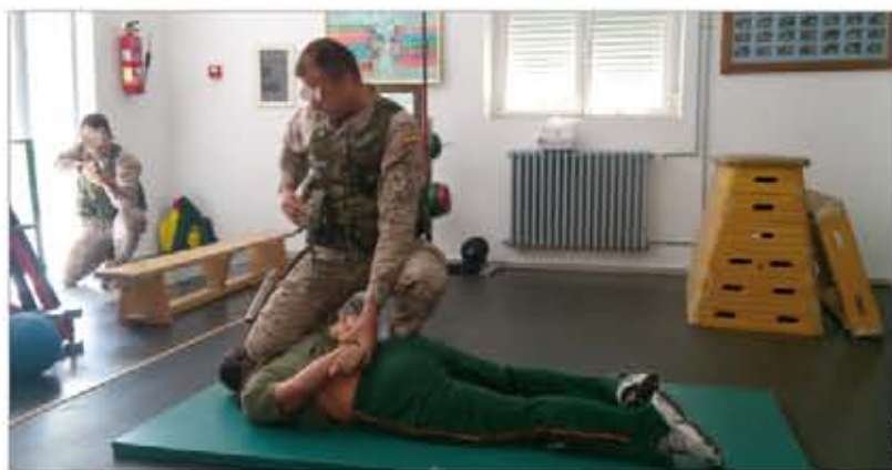
Practicando técnicas de reducción e inmovilización de detenidos

Con este acto se cerraba un extenso programa que ha incluido, entre otros, un ciclo de conferencias, un maratón de mountain bike , una exposición, un acto solemne de arriado de Bandera y un concierto (⇒ intranet 11/10/2012 ).