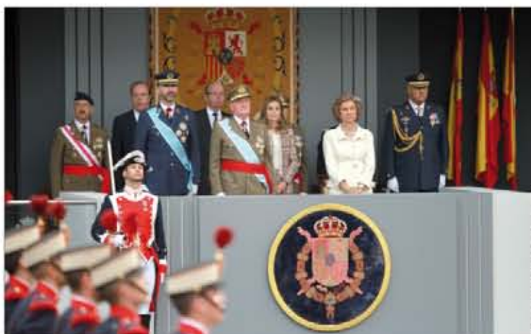
Los Reyes y los Príncipes presenciaron los actos desde la tribuna