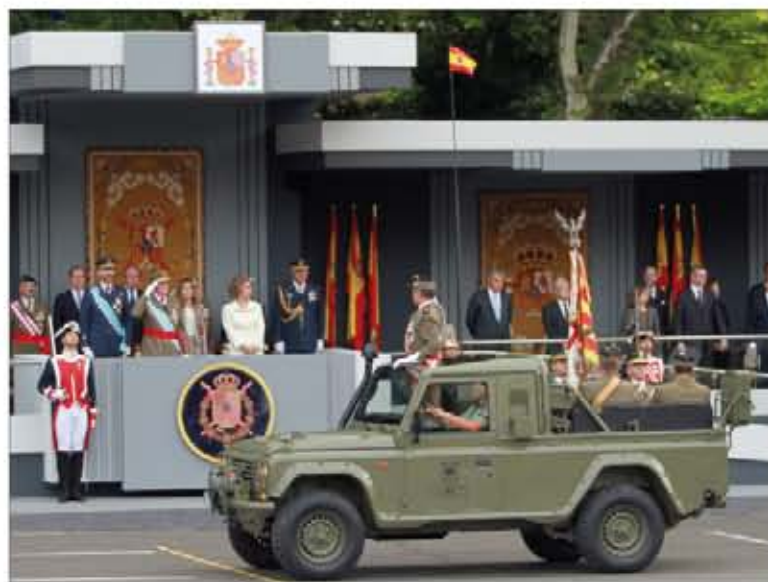
El jefe de la BRIPAC, a bordo de un vehículo todoterreno Anibal

En la segunda agrupación a pie desfiló un batallón compues-