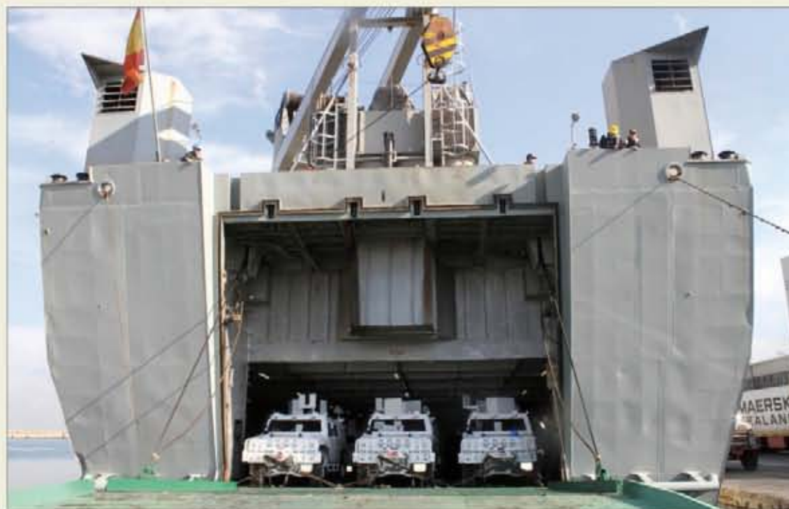
Los vehículos Lince fueron transportados en el buque El Camino Español

Los Lince se incorporan a la misión de Naciones Unidas en sustitución de la mayor parte de los Blindado Medio Ruedas