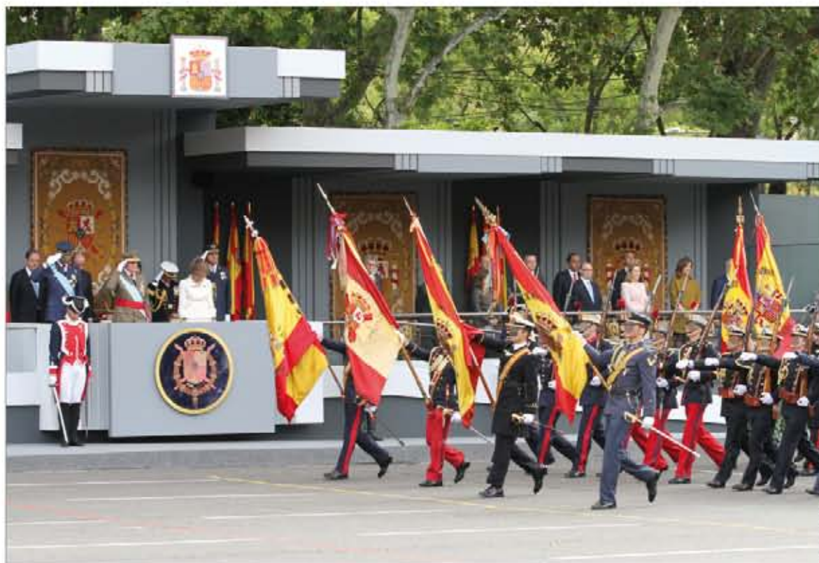
Banderas y Estandartes a su paso por la tribuna, en la plaza de Cánovas del Castillo