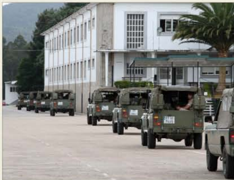
Salida de patrullas de la BRILAT en vehículos todoterreno

Somos ya una estampa habitual en todas las campañas y la valoración es cada año mejor. Los ayuntamientos y, sobre todo, los campesinos se vuelcan con nuestras patrullas, apoyándolas y colaborando con ellas en todo momento.