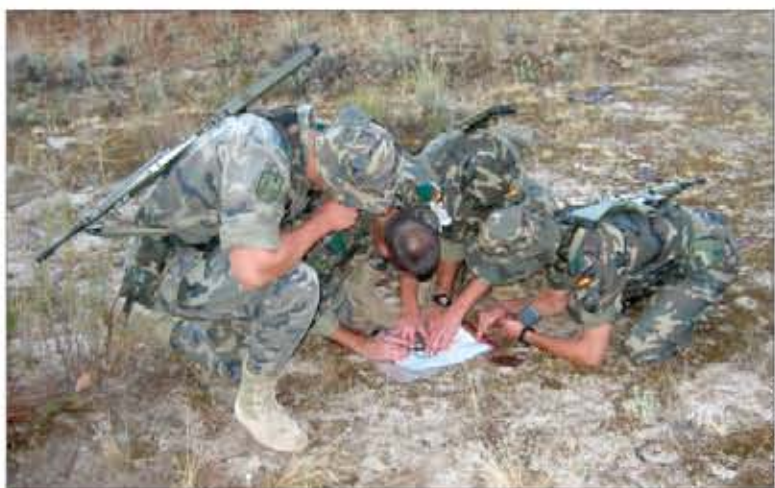
Una de las patrullas del Ejército, en la prueba de orientación