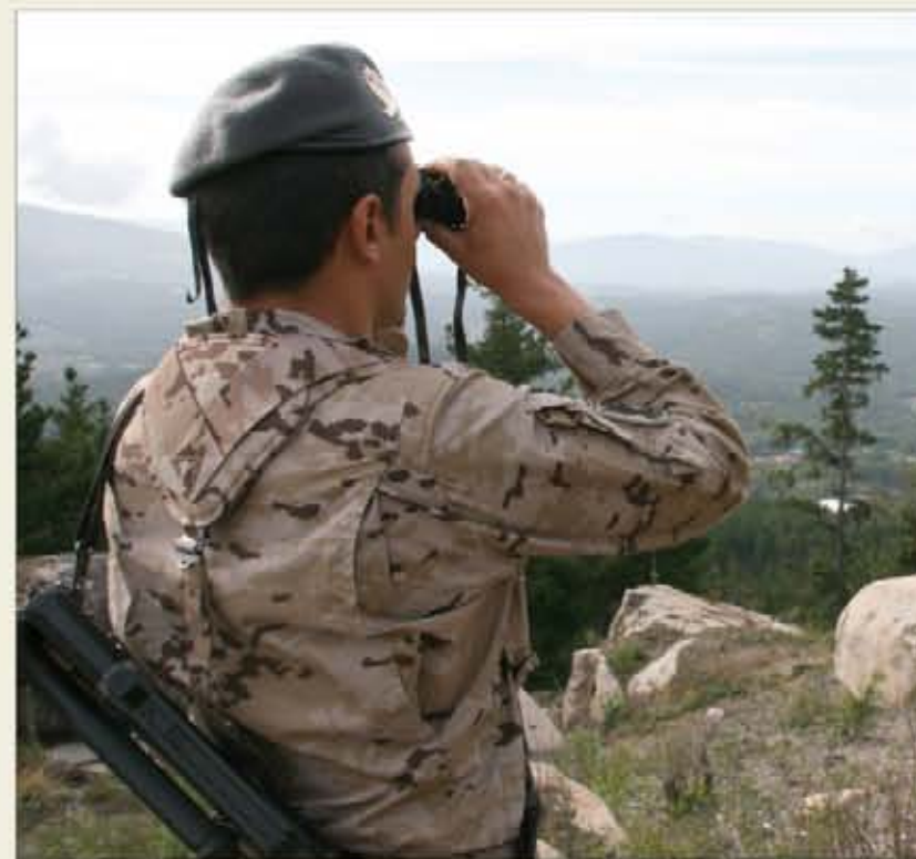
La labor de vigilancia se ha realizado en seis distritos forestales distintos

Las cifras hablan por sí solas. La operación se ha desarrollado entre el 1 de agosto y el 2 de octubre, y en ella han participado un total de 756 militares. Las patrullas han utilizado 180 vehículos todoterreno, que en conjunto han recorrido 401.502 kilómetros. Gracias a este impresionante despliegue, se ha conseguido alertar de 85 incendios, 16 conatos de incendio y 39 quemadas de rastrojos. Además, se