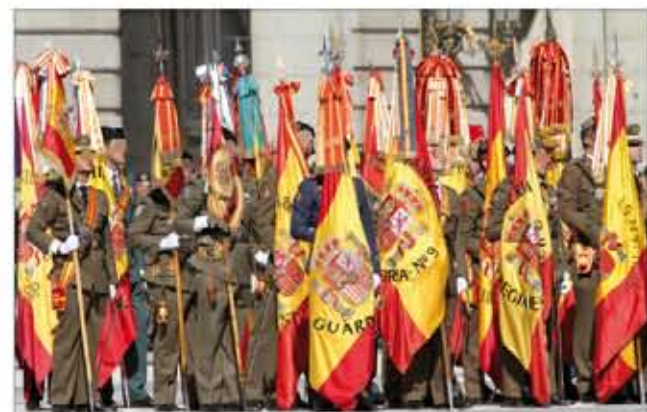
Banderas y Estandartes presentes en la ceremonia

Cientos de voces entonaron entonces el Himno del Arma, antes de que la fuerza se dislocara para el desfile por la calle Bailén, en el que también participó la Batería Hipomóvil de la Guardia Real. Con este desfile se puso fin a una jornada que quedará grabada para siempre en el historial del RCAC nº 10.