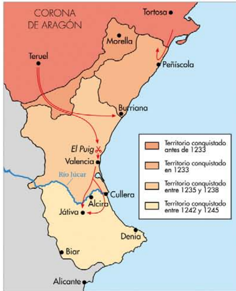
Conquista de Valencia durante el reinado de Jaime I de Aragón

Jaime I se puso de nuevo al frente de su ejército en 1233, cuando partió de Teruel para adentrarse en territorio enemigo y conquistar Burriana, lo que consiguió tras varios meses de asedio. Después