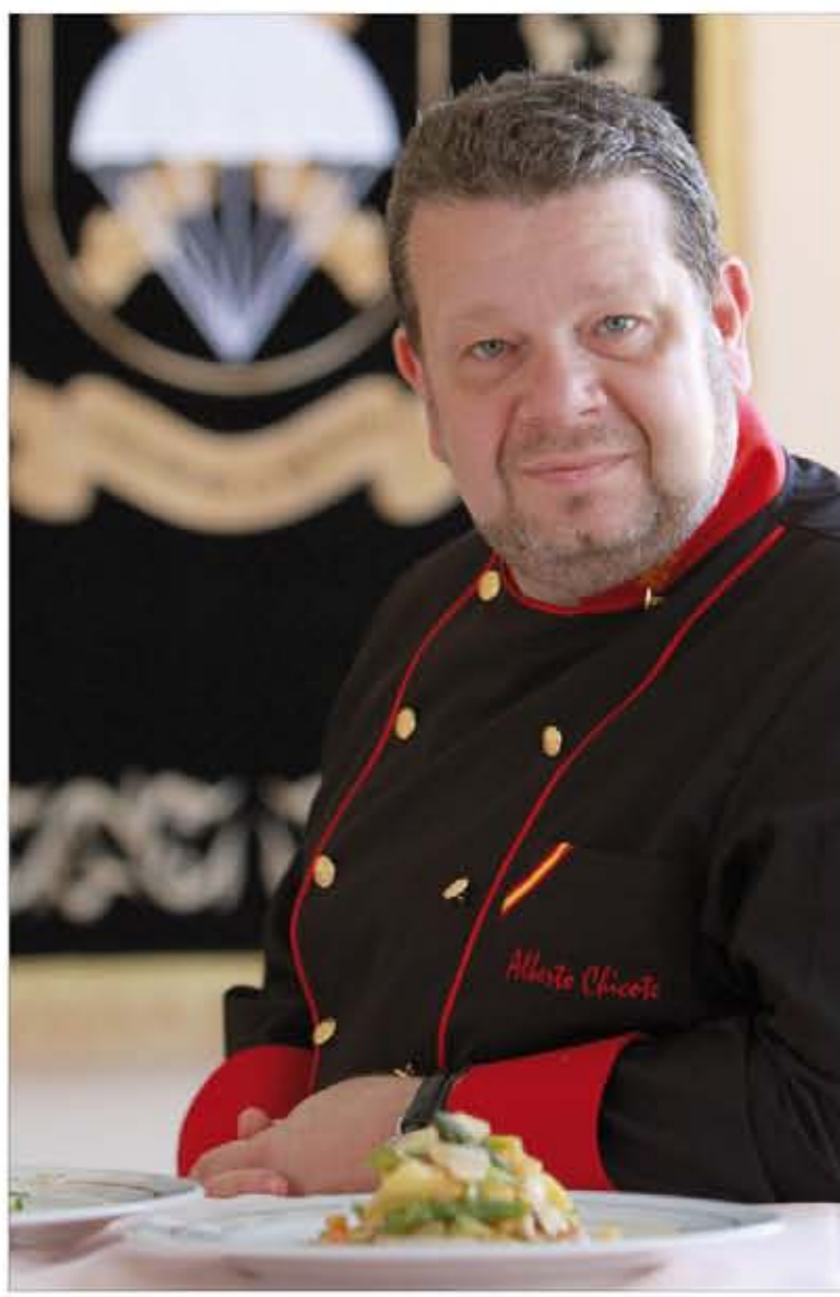
Alberto Chicote, en la sede de la Brigada Paracaidista

En primer lugar, la profesión de cocinero se ha engalanado, porque hemos pasado de ser unos "grasas" a estar considerados como en el resto de Europa. Además, ha aparecido la figura del cocinero creador, es decir, el cocinero que hace algo de un modo propio. Todos los restaurantes buenos del mundo ofrecían antes la gran cocina clásica centroeuropea, pero en un momento dado los cocineros de cada país empezaron a plasmar su identidad sobre ese recetario clásico, haciendo cosas por su cuenta. Esto nos llega a nosotros a partir de los años setenta,