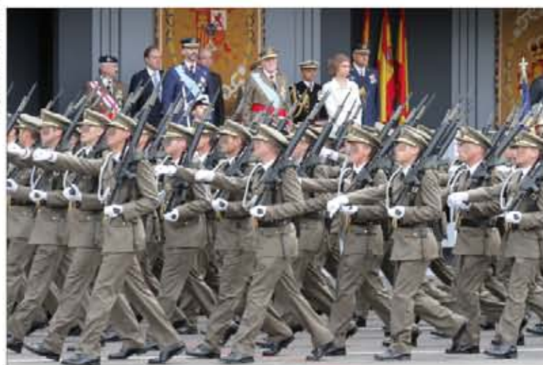
Alumnos de la Academia General Básica de Suboficiales