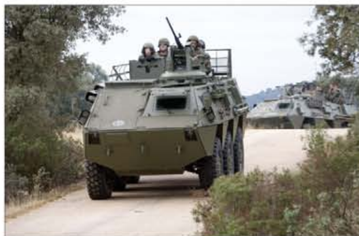
Será la tercera vez que la BRIMZ X despliegue en el Líbano

La base "Cerro Muriano", sede de la Brigada de Infantería Mecanizada "Guzmán el Bueno" X, fue testigo del último ejercicio de certificación que ha tenido que superar el XVIII contingente antes de desplegar en el Líbano en el mes de noviembre. Con ellos viajará un grupo de militares serbios, y allí estrenarán los Lince . Pág. 11