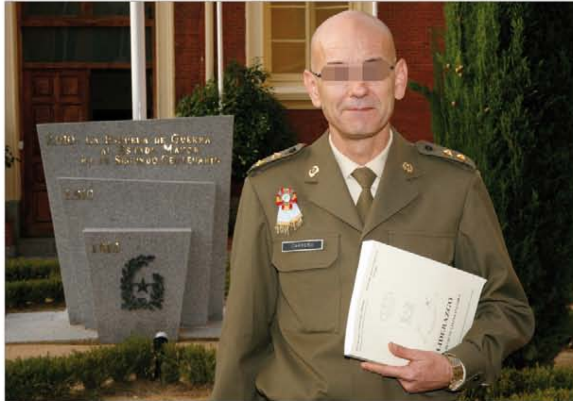
El teniente coronel Carreño es profesor de Liderazgo en la EGE desde hace ocho años

La falta actual de liderazgo o de líderes en las organizaciones y, en definitiva, en la sociedad, se debe, en opinión del teniente coronel, a que se ha postergado la formación