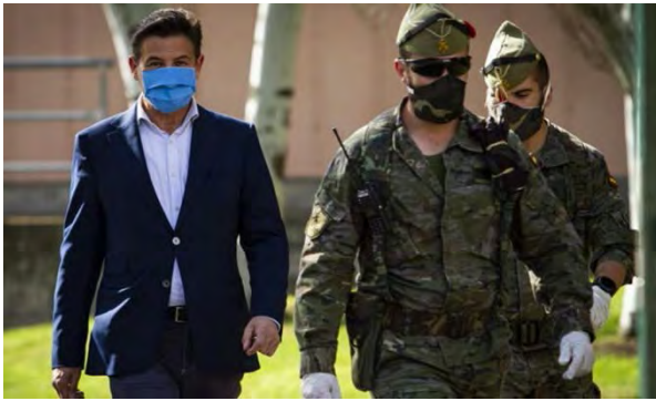
Con el alcalde de Granada

El 18 de marzo salió del Acto. Montejaque la primera patrulla del Grupo de Caballería de La Legión (GCLACLEG) con la misión de realizar reconocimientos sobre el área de Antequera y el diseño de un plan de aislamiento de la localidad de Ronda. Días posteriores vinieron más misiones de reconocimiento, presencia y desinfección.