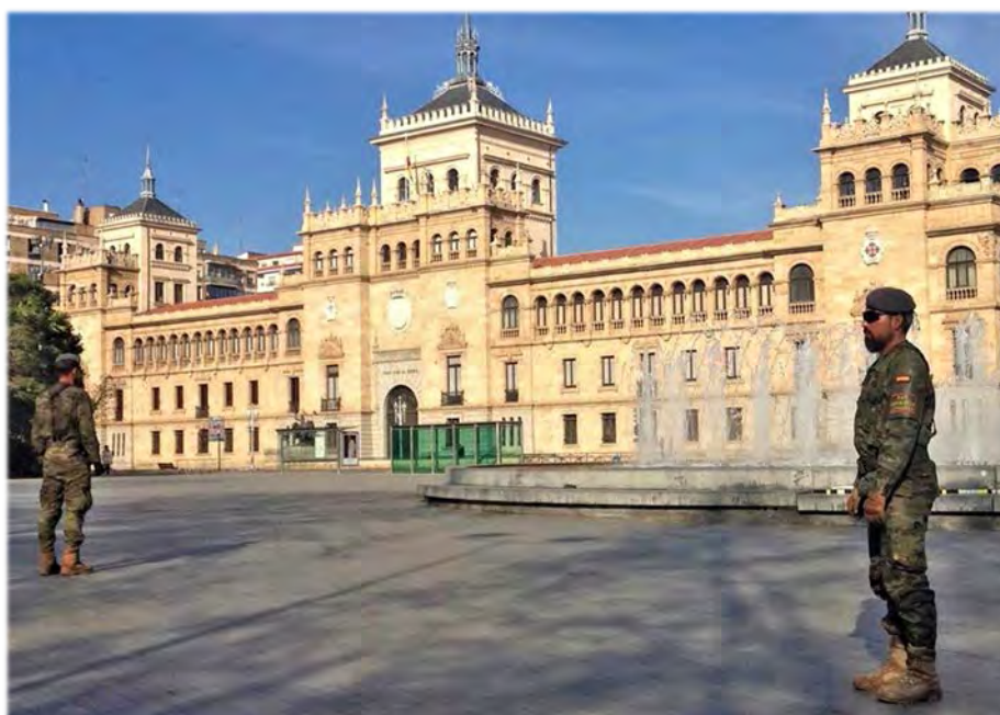
Academia de Caballería 22 de junio de 2020