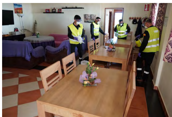
Desinfección de una residencia de ancianos

Darles ánimos, confianza y asesoramiento sobre como sectorizar y organizar la residencia, colocando barreras sanitarias y realizando desinfecciones de manera rutinaria, así como instruirles en el adecuado uso de los diferentes EPIs, racionalizando el empleo de estos, evitando la sobreprotección, han sido parte de las tareas realizadas. De este modo, las residencias, en todo momento, han sentido que podían contar con el apoyo de la Unidad.