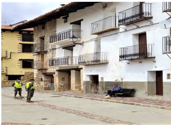
Vecino de Valdelineares (Teruel).

9 de abril del presente año, un día más de confinamiento, pero no para los Húsares del Primero que, como otros compañeros de armas, continuamos la lucha contra este virus que mantiene en vilo a nuestra España.