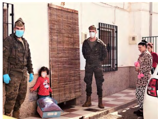
Reparto de material escolar en Moraleda de Zafayona

De la multitud de patrullas realizadas quedan recuerdos que serán inolvidables, como los aplausos recibidos por el personal del centro de inmigrantes de Málaga, después de haber desinfectado sus instalaciones. O bien, las caras de los niños de la localidad de Moraleda de Zafayona (Granada) cuando los legionarios les entregaban el material escolar. O también en el pueblo de Fuente de Piedra (Málaga), donde no existe agua potable y se abastece con un camión, y que durante un reparto, una de las patrullas del Grupo colaboró con Protección Civil para el suministro.