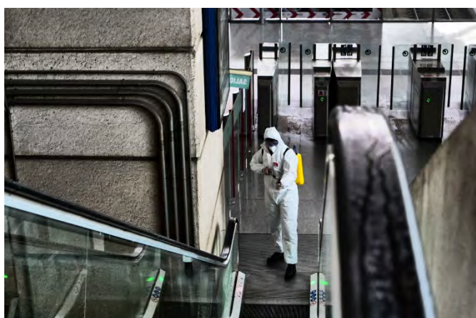
Desinfección del metro de Madrid

El día 16 se incrementa la participación en misiones a dos S/GT y, junto con acciones de presencia, se lleva a cabo la desinfección de distintas estaciones del Metro de Madrid, sucediéndose desde este día este tipo de misiones en lugares de gran afluencia de público (estaciones, aeropuertos, etc), hospitales, residencias de ancianos y dependencias oficiales.