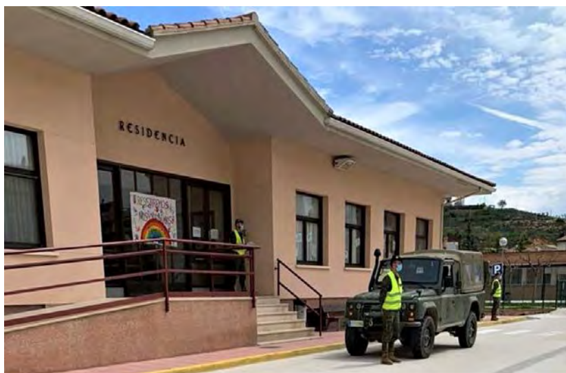
Residencia de mayores de Valderrobres (Teruel).

ancianos de la residencia estaban contagiados y la mitad de los trabajadores presentaban síntomas. Aunque algunos de los afectados habían sido trasladados al Hospital Comarcal de Alcañiz para recibir tratamiento, muchos otros continuaban confinados en la misma.