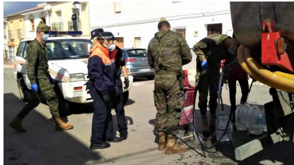
Suministro de agua en Fuente de Piedra

la imagen institucional del Ejército de Tierra... Y el alma es inmortal.