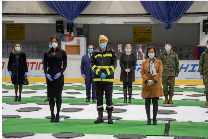
Acto de clausura del Depósito Intermedio del Palacio de Hielo

Liderado por GIETMA, se asume el apoyo a los servicios sanitarios de la Comunidad de Madrid en el transporte de personal enfermo entre hospitales y hoteles medicalizados, los cuales se llevan a cabo con autobuses de origen civil, que se acondicionan para tal fin. En este cometido se recibió el refuerzo de elementos de la Guardia Real.