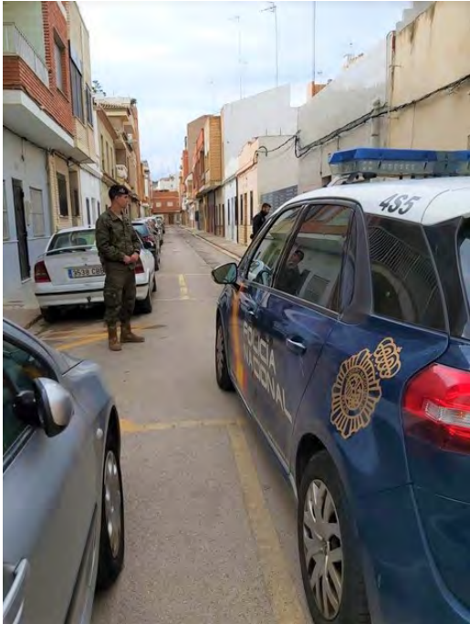
Momento de la llegada de las dos patrullas al domicilio del sospechoso

incumpliendo con la orden de alejamiento. Después de varios minutos intentando calmarlas y explicándoles que no les iba a pasar nada, nos dispusimos sin dudar a acompañarlas hasta la comisaría de la Policía Nacional. Ambas mujeres tenían miedo a encontrarse con el ex-marido de camino a la comisaría, por lo que nos agradecieron enormemente que las acompañásemos.