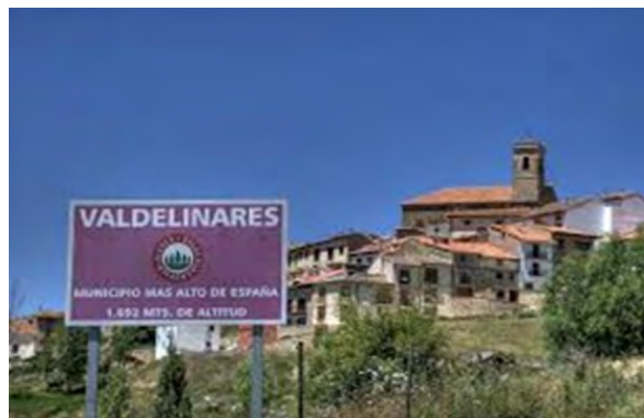
Vista de Valdelineares (Teruel).

–Pues bien, aquí echando la mañana, que a ver si se va el virus este que se han inventado y puedo ir a dar mi paseo a las pistas -las de esquí, que se encuentran a unos 7 km del pueblo-, hoy solo he ido calle arriba a echar de comer a los gatos.