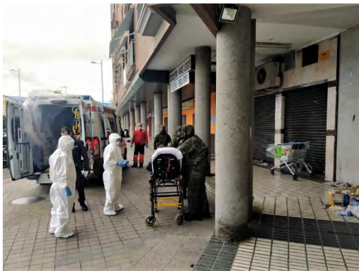
Ayuda a personas sin techo

A lo largo de estos meses muchas han sido las muestras de cariño y afecto expresadas por la población en agradecimiento por el grado de profesionalidad y trabajo realizado por los legionarios del Grupo. Los legionarios, en compensación, se han llevado el merecido