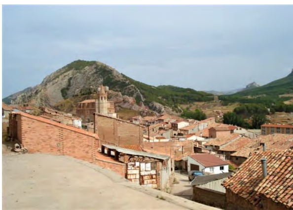
Vista de Montalbán (Teruel).

Nos relató que vivía sola, en esa casa antigua, y que no había podido ver a su familia desde el principio del confinamiento. Continuó hablando con nosotros durante unos minutos de diversos temas hasta que, despidiéndonos de ella, continuamos con nuestra misión.