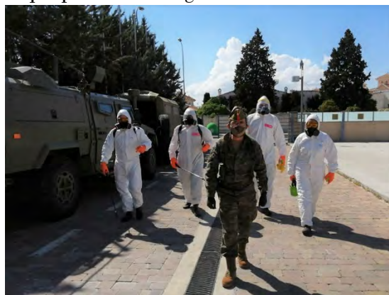
Equipo de desinfección

En España, los primeros casos de infección se dieron a finales de febrero y principios de marzo, pero el número de contagios y muertes empezó a elevarse en demasía una vez entrado marzo. El gobierno de España se vio obligado a tomar una serie de medidas excepcionales similares a las que se tomaron en China en el origen de la pandemia y a las que Italia, semanas antes, había tomado. De entre todas las medidas, destacó el confinamiento de la población en sus hogares. Estas medidas no siempre eran respetadas por la población, bien por desconocimiento o bien porque volitivamente se desoían. Las Fuerzas y Cuerpos de Seguridad del Estado (FCSE) comenzaron a actuar dando a conocer las medidas de contención, intentando que la población adquiriera conciencia social y en casos justificados sancionando al personal que pusiera en riesgo al resto.