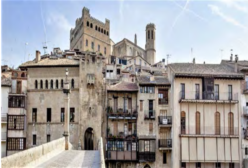
Entrada a Valderrobres (Teruel) con el Castillo al fondo.

lucha contra el COVID-19. Como reza el lema del Segundo Escuadrón de Húsares «La palabra mueve, el ejemplo ARRASTRA».