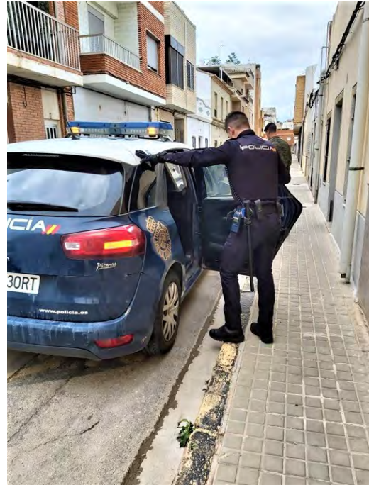
El agente del CNP introduce al detenido en el vehículo policial mientras la patrulla del Regimiento «Lusitania» 8 da seguridad

experiencia tanto para mí como para los soldados que me acompañaban. Ya en el domicilio del ex-marido, la detención fue rápida, sin embargo, se produjo un pequeño altercado con el padre del detenido, al que los policías advirtieron que debía parar o procederían a su detención, tras lo cual el hombre acabó tranquilizándose y entrando de nuevo en su domicilio.