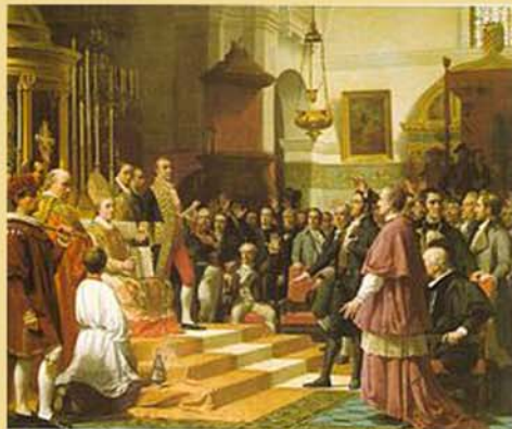
Juramento de las Cortes de Cádiz