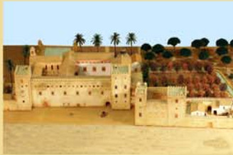
Maqueta del Palacio Real de Valencia

El Liberalismo inicia en España su andadura, y con él acabaría el Antiguo Régimen. En ese contexto histórico complejo, se fraguó la primera Constitución Española de corte liberal, sancionada por las Cortes de Cádiz en 1812, y conocida popularmente como “La Pepa” por ser el 19 de mayo el día de su aprobación.