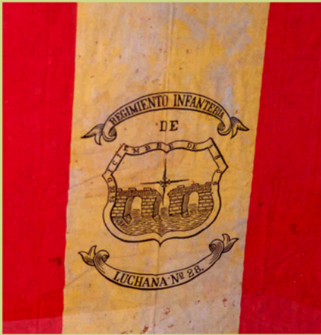
Bandera de Mochila Regimiento de Infantería Luchana nº 28