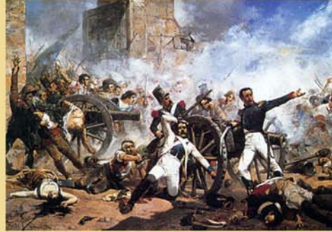
Defensa del Parque de Artillería de Monteleón. Joaquin Sorolla

La ocupación de la Península Ibérica por los Ejércitos de Napoleón daría lugar a la Guerra de la Independencia de 1808 a 1814. España fue el escenario de la primera derrota del ejército imperial francés.