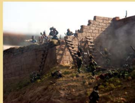
Maqueta del Castillo de Sagunto 1811

El regreso del rey Fernando VII terminó, después de disolver las Cortes, con el retorno del absolutismo.