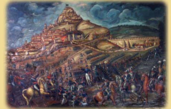
Sitio de Morella.

La derogación de la Ley Sálica por Fernando VII mediante la Pragmática Sanción, que permitía reinar a Isabel, unido al descontento por la grave situación social y económica llevaría, a lo largo del siglo, a tres guerras civiles entre españoles, las Guerras Carlistas: 1ª Guerra Carlista (1833-1839), 2ª Guerra Carlista (1845-1849) y 3ª Guerra Carlista (1872-1874). El Norte de España, aunque en la primera guerra también se extendería al centro y sur de la península, fue el escenario principal de las contiendas. Zumalacárregui, Maroto, Cabrera por parte carlista y Espartero, del lado isabelino, fueron generales destacados en estas guerras.