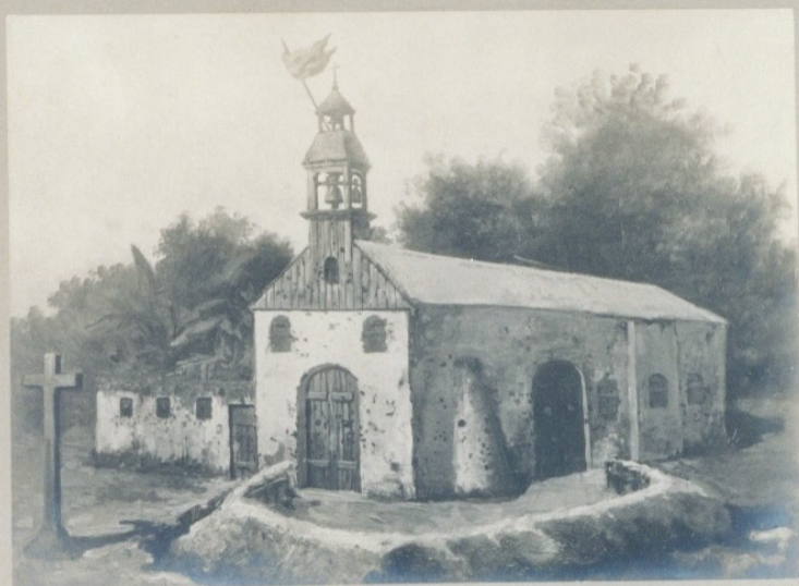
Iglesia de Baler (Filipinas) donde el destacamento sitiado estuvo defendiéndose desde el 30 de junio de 1898 al 2 de junio de 1899

Museo Histórico Militar Antonio Martín 1-3-1940