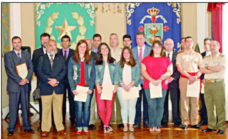
El general de la Peña con los equipos ganadores de los Premios Regionales

El primer Premio Regional y Nacional correspondiente al Nivel B, a la obra titulada "La influencia del