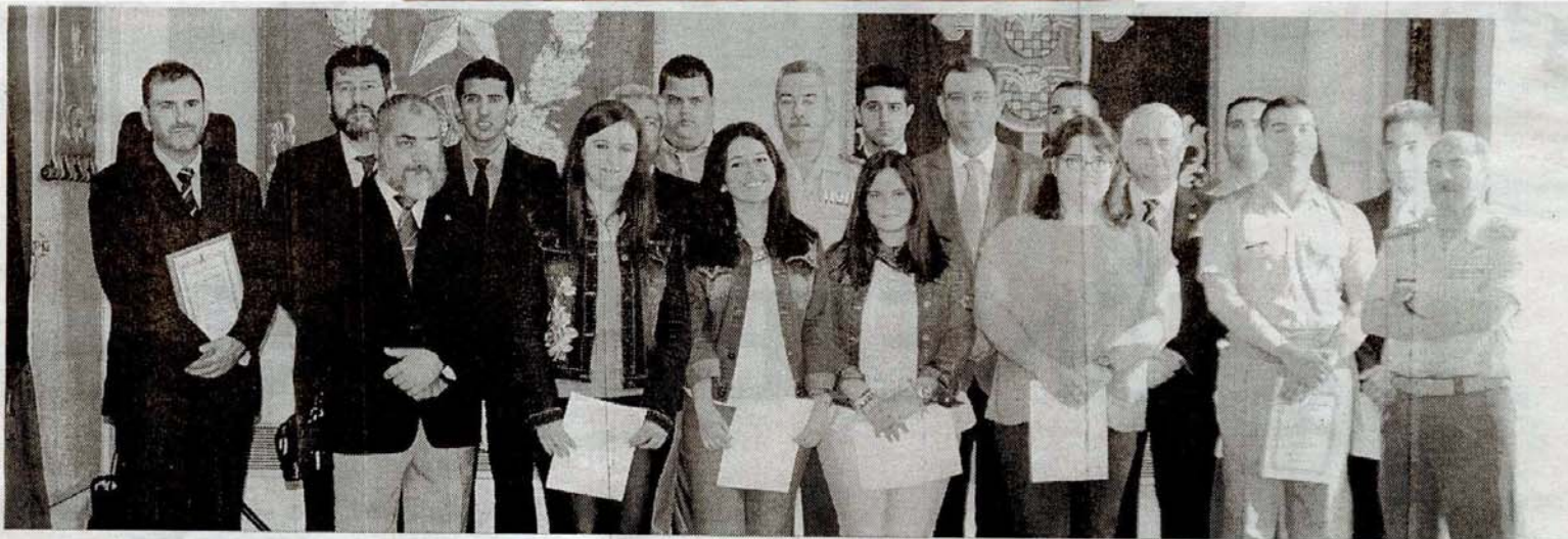
Los ganadores de los Premios Ejército 2013 en la fase regional y nacional posaron en la tradicional foto de familia con el comandante general, Álvaro de la Peña.