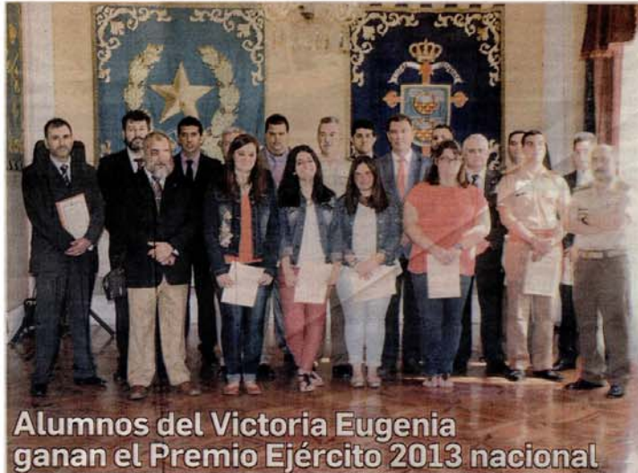
Alumnos del Victoria Eugenia ganan el Premio Ejército 2013 nacional