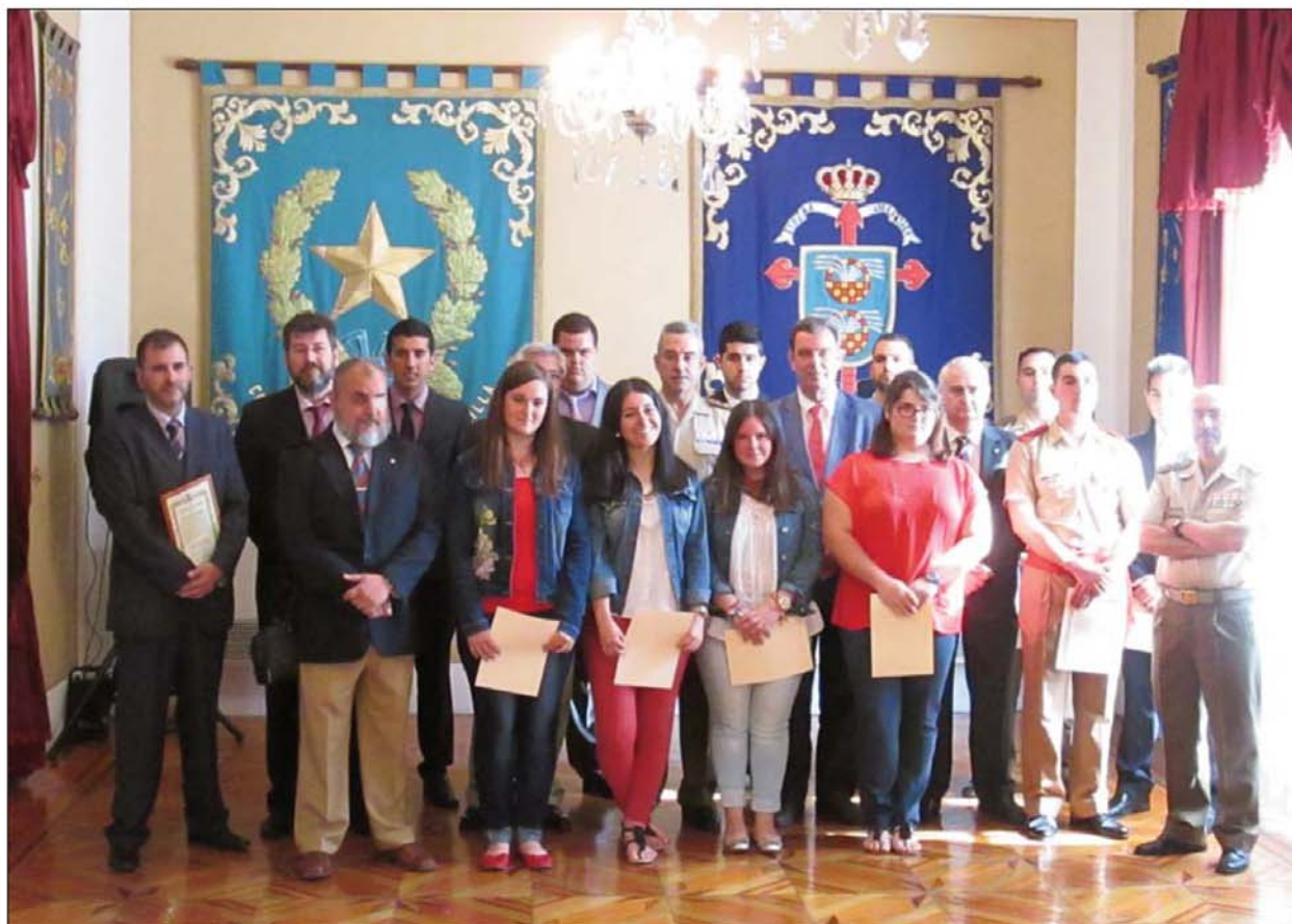
Imagen de los ganadores en las dos categorías con las autoridades