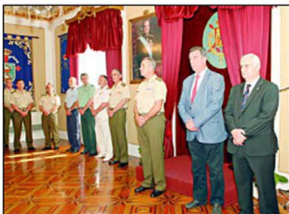
Autoridades militares y docentes entregaron los Premios Ejército