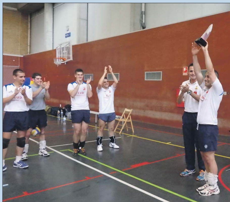
El equipo de Voleibol masculino fue uno de los que se alzó con el triunfo.

Simultáneamente al partido de rugby masculino se disputó la final de Voleibol masculino en el pabellón del polideportivo del mismo Campus. El partido comenzó a las 17.00 horas y se prolongó bastante en el tiempo debido a que cada uno de los sets disputados fueron luchados por ambos equipos punto a punto. Sin embargo, nuestro equipo destacó sobresalientemente sobre su oponente, no dejándole ganar ni un solo set y alzándose con una victoria de 60 puntos fruto de los 3 sets ganados, frente a los 34 puntos de su rival.