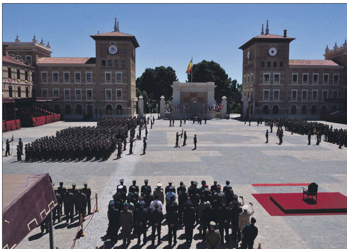
El Patio de Armas acogió uno de los actos centrales del encuentro en la Academia.

Oficiales, profesores y académicos de 31 países participaron activamente en las sesiones internacionales bajo el título