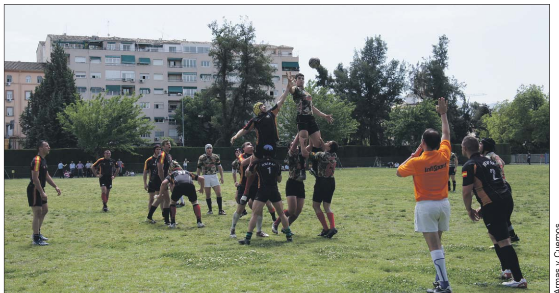
Un momento de la final disputada en Granada que ganó el equipo de la AGM.

Con la lección aprendida, el equipo mantuvo el control del partido en la primera parte. En la segunda parte, la Brigada Paracaidista empujó con fuerza, pero sin lograr alcanzar la zona de marca debido a una gran presión defensiva y a un gran dominio de las fases estáticas. Aprovechando algunos despistes del rival, el 'Armas' anotó los puntos suficientes para alzarse con la victoria por 18 a 3.