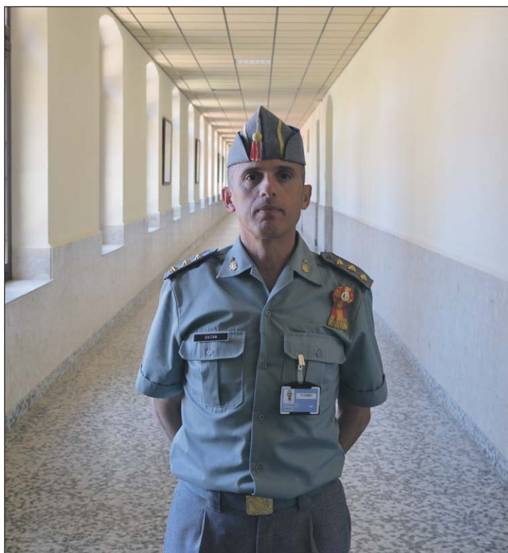
En sus destinos ha tenido una visión muy amplia del Ejército.

Yo diría que muchos porque en la AGM formamos oficiales y los formamos a través de tres ámbitos: conocimientos, habilidades y valores. Lo que tienen en común, sobre todo, son los valores en los que formamos a nuestros cadetes porque van a ser los oficiales del futuro y la función que tienen que desarrollar como mandos a lo largo de su carrera militar se tiene que cimentar sobre unos valores sólidos. Eso es lo que tratamos