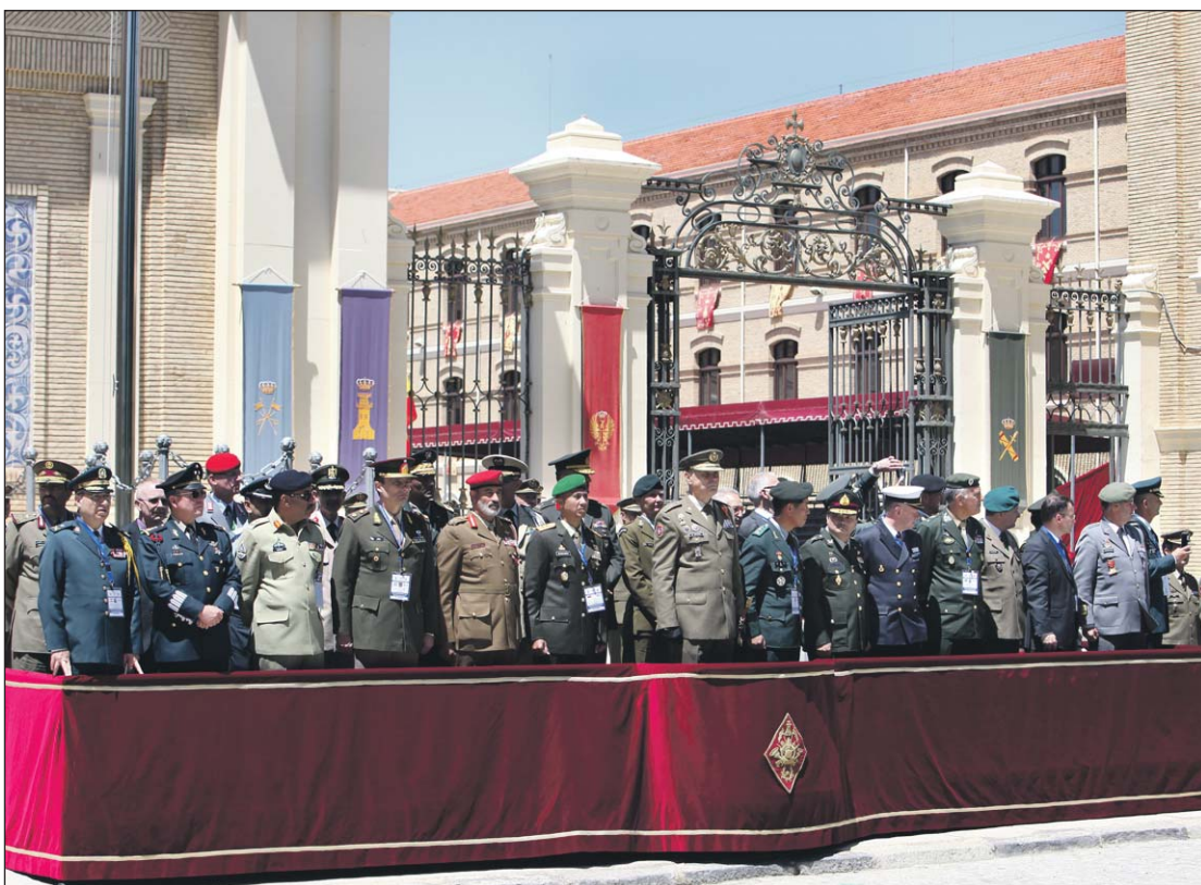
Los delegados de los 31 países, durante el desfile de las Compañías en la Academia.

La Academia General Militar acogió del 20 al 22 de mayo el 4º Simposio Internacional para el Desarrollo de las Academias Militares ISoDoMA. Oficiales, profesores y académicos de 31 países participaron activamente en las sesiones internacionales bajo el título "Educación Integral para que los Oficiales afronten los Nuevos Retos de Seguridad".