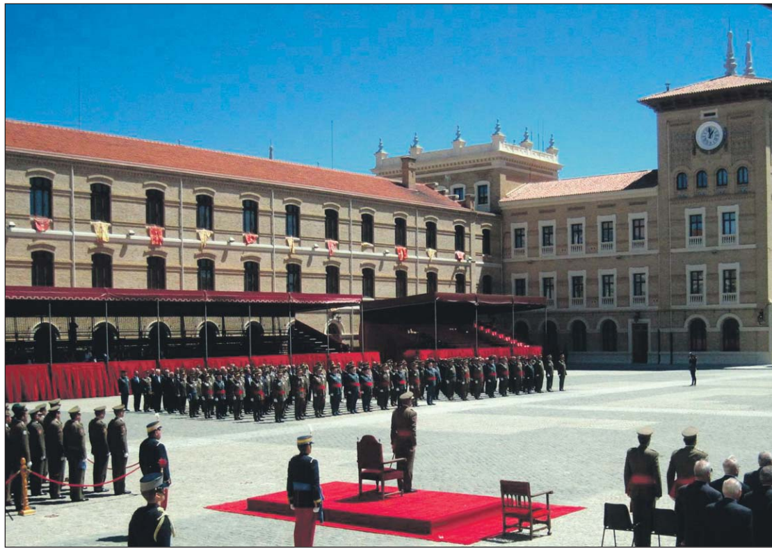
Los componentes de la XXXIV Promoción volvieron a besar de nuevo la Bandera en la AGM.

El momento más emocionante llegó, sin duda, cuando los componentes de la XXXIV Promoción besaron de nuevo la Bandera y se produjo la alocución de su abanderado en la que recordó los hitos más importan-