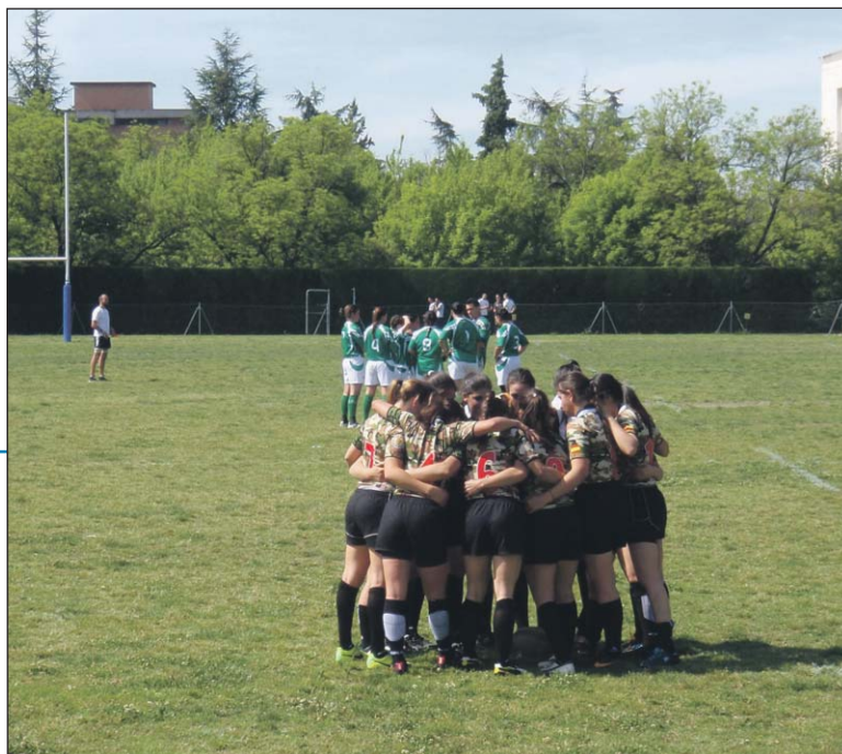
El espíritu de equipo de las jugadoras ha sido decisivo.

El segundo y último día, de nuevo, nos enfrentábamos a Montaña en primer lugar, consiguiendo una nueva victoria, que nos daba energía para justo al final de este encuentro, comenzar una nueva lucha contra BRIPAC.