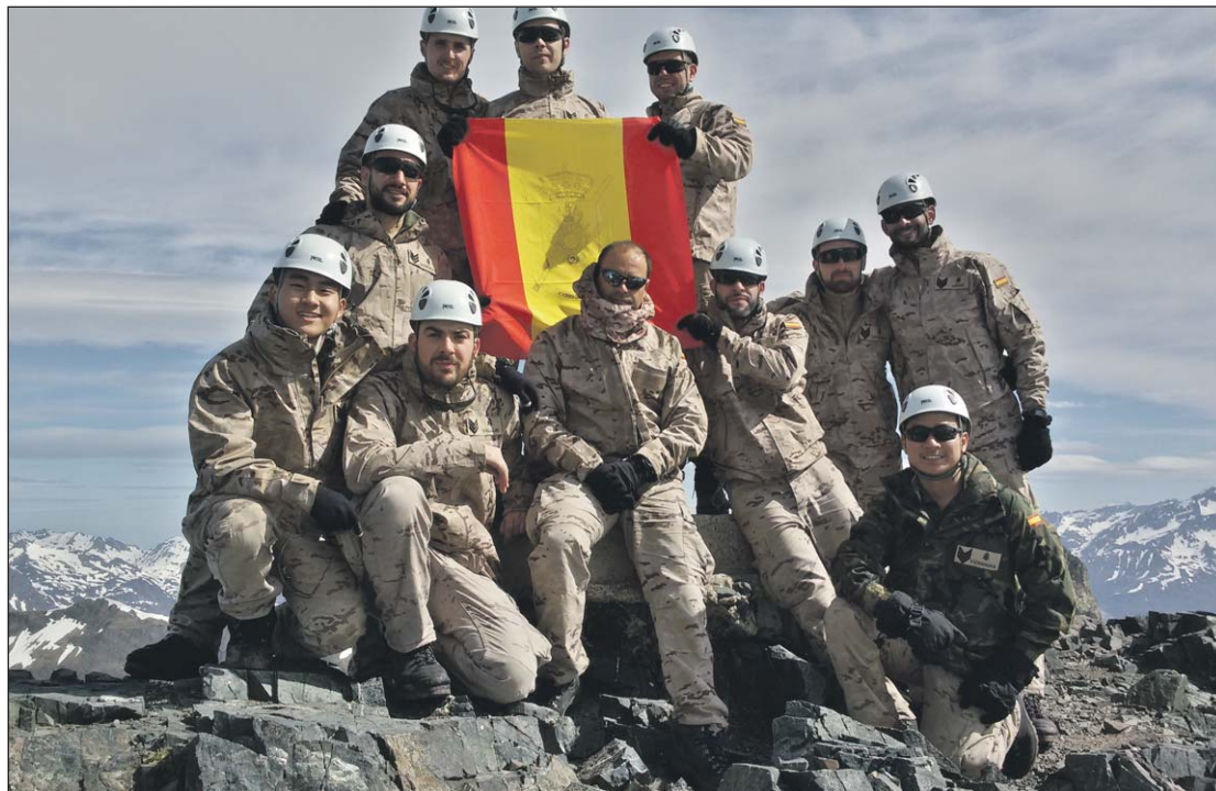
Los cadetes se instruyeron en diferentes técnicas de montaña.

La semana comenzó con instrucción teórica sobre diversos temas que serían de ayuda para las siguientes actividades. Posteriormente, se llevaron a cabo ejercicios de tiro, siendo los propios Cadetes los que mandaban en las líneas de tiro. Ésta era la primera oportunidad de mandar una línea para aquellos alumnos que provenían de tropa. Entrada la noche, se realizaron varios ejercicios de tiro con medios de visión nocturna y elementos de puntería exteriores (AN/PVS-14 y visor holográfico EOTECH). Estos ejercicios nos ayudaron a determinar las posibles combinaciones y configuraciones de estos elementos para optimizar los resultados en tiro de combate nocturno.