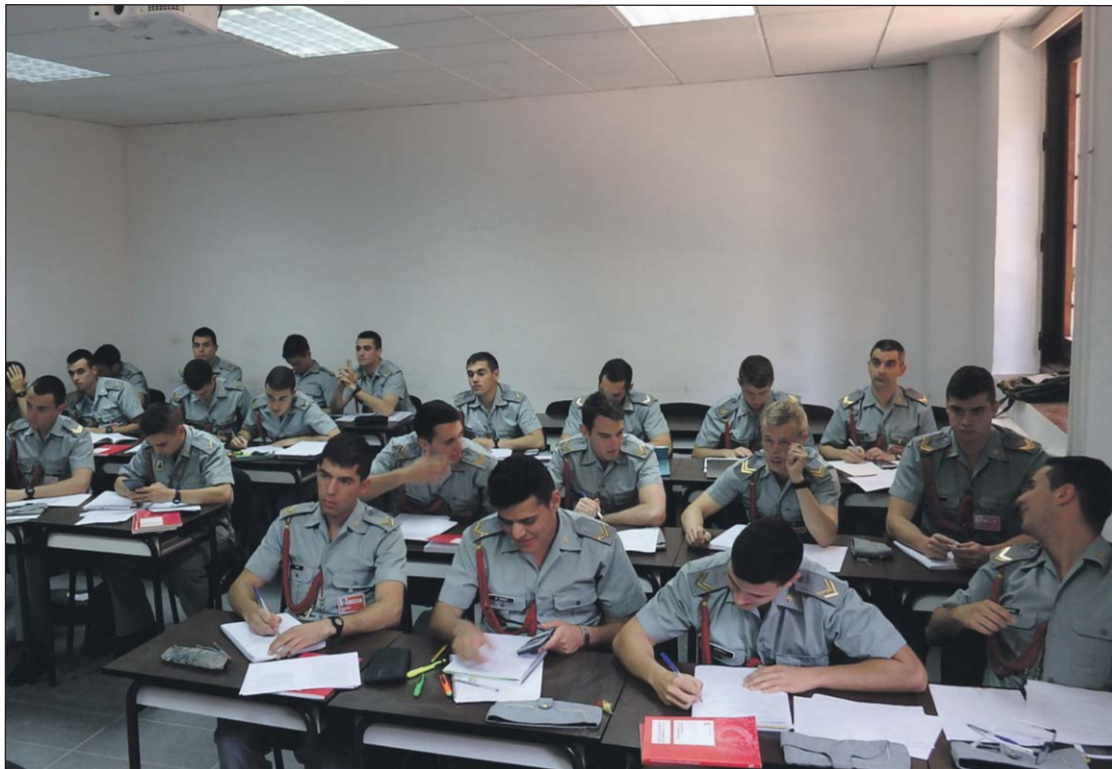
Los cadetes de Segundo, en una de las clases del último tramo del curso.