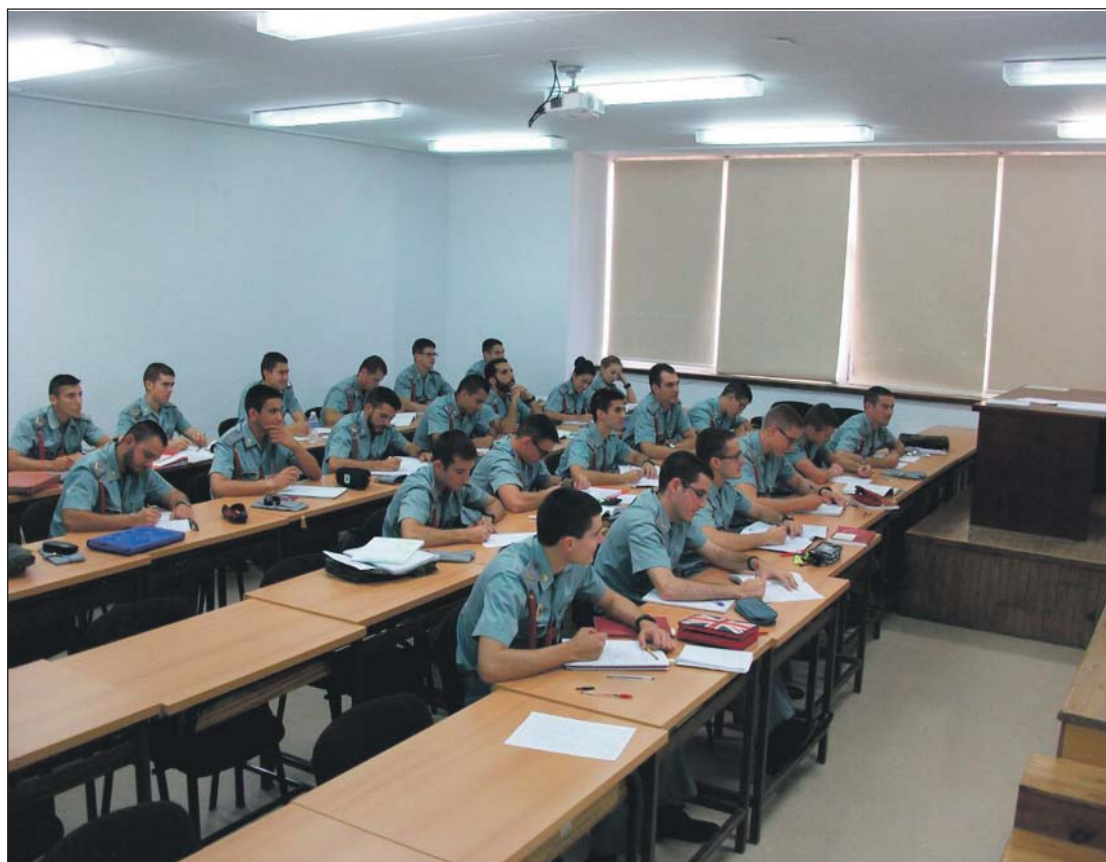
Los cadetes de Primero, en una de sus últimas clases, antes de enfrentarse a los exámenes finales del mes de junio.

Todo el sacrificio que está haciendo tiene muy claro que