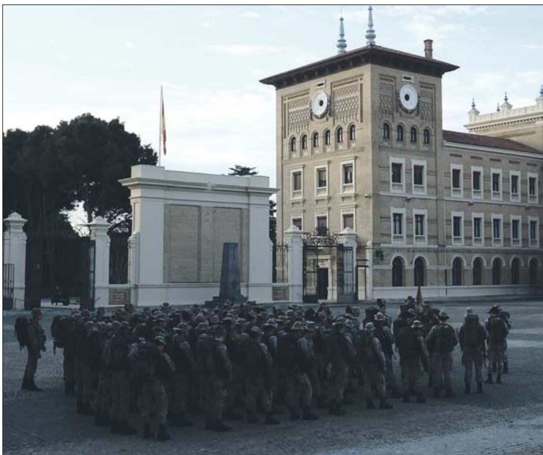
En el Patio de Armas, preparados para el simulacro de Generala.

En este caso, se activó el Plan de Impermeabilización. Los integrantes del Primer Batallón tenían como cometido principal la defensa del perímetro interior del recinto de la Academia. Segundo curso, perteneciente al Segundo Batallón, tenía como cometido principal la defensa