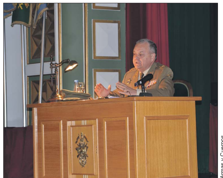
El General Ezquerro repasó la evolución del servicio militar.