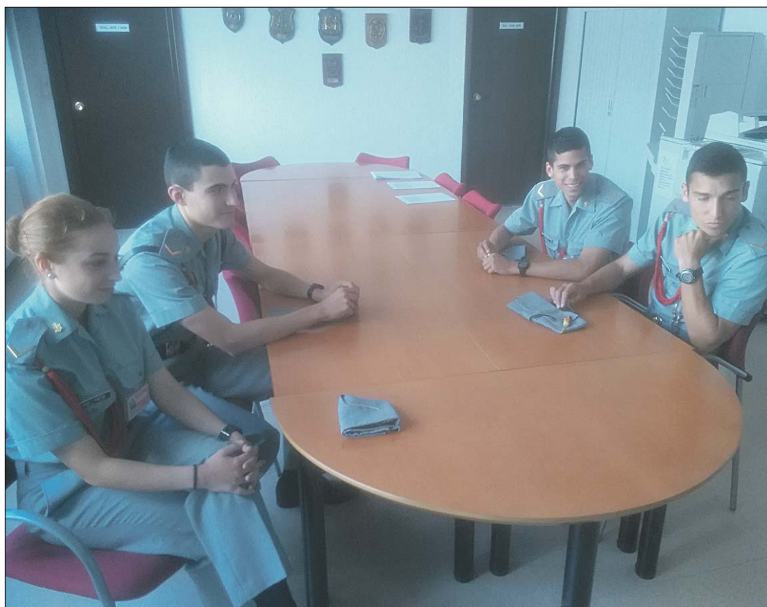
Los cadetes de Primero, durante la charla en la sala de juntas del I Batallón donde han hecho balance sobre la evolución del curso.

Eso sí, en la parte militar se ha tenido que adaptar como el