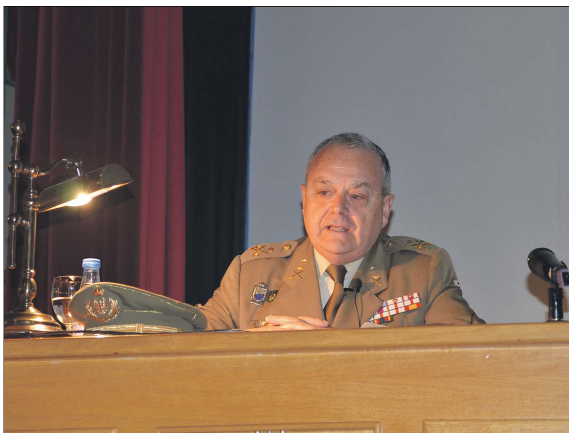
El General de División Alfredo Ezquerro, durante su intervención en la Cátedra Cervantes.

España inició su periodo de esplendor con los Reyes Católicos y de ahí se generó en la población española un afán de gloria, de salir de esa especie de miseria cultural y económica en la que vivía mucha gente en sus pueblos. Se huía de eso y de la presión eclesial y nobiliaria que sentían en sus casas. Fue ese afán de gloria el que les llevó a abandonar esa vida oscura y tratar de conseguir la gloria. Los Tercios se pasearon por toda Europa. Fueron ejemplo del que