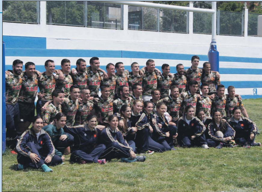
Los integrantes de los equipos masculino y femenino, celebrando la victoria.

Tras el sorteo inicial, al equipo masculino de la Academia le tocó enfrentarse en eliminatoria de ida y vuelta a la Guardia Real. Ya en el primer partido nos dimos cuenta de que nos enfrentábamos a un equipo con muchas ganas de hacer un buen torneo, hecho que se demostró durante el segundo tiempo, cuando por una serie de fallos en defensa el equipo no pudo salir de la zona de 22 metros, llegando a los minutos finales con un apretado resultado de 15-12. Pero el "Armas" mostró que con posesión de balón sería más difícil de ganar, logrando el último ensayo en las últimas jugadas del partido (20-12). En el partido de vuelta, sin embargo, el equipo pudo demostrar la potencia que lleva desarrollando en los últimos años, con un grandísimo trabajo de los delanteros en todas las fases, y con una línea de tres cuartos muy segura en el juego abierto a la mano, y muy disciplinada en defensa. Con un resultado final de 49-0, nos metíamos en la tan deseada final, que disputaríamos el domingo 3 contra la Brigada Paracaidista.