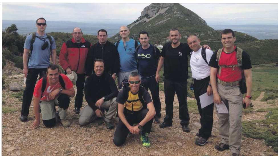
Los mandos del II Batallón hicieron cumbre en varias montañas de la sierra de Guara.

El pasado día 5 de mayo los mandos del II Batallón de Cadetes se encaminaron a la bien conocida sierra de Guara, donde hicieron cumbre en Peña y Vértice Gratal, en Pico Mediodía y en Pico de la Calma. Afortunadamente, el tiempo fue magnífico, lo que, añadido a la camaradería y compañerismo propios del II Batallón, hizo que fuera un día para recordar. Esta marcha sirvió tanto para practicar en media montaña