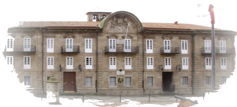
Fuerza Logística Operativa Oficina de Comunicación Pública

Esta figura se concede a aquellas personas o instituciones distinguidas con el título honorífico de Furriel de Honor de la FLO