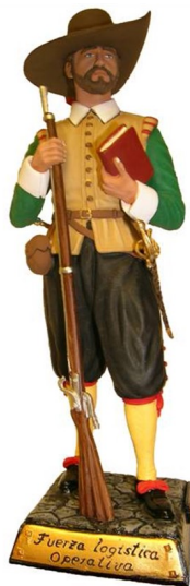
Furriel de los Tercios de Flandes (Siglo XVII)

La misión del Cabo Furriel consistía en auxiliar al Sargento Mayor en la organización de los alojamientos de tercio.