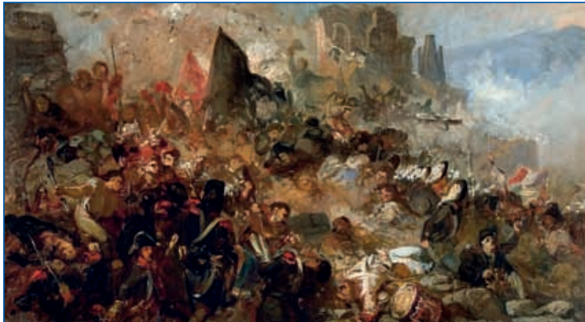
El sitio de Gerona (boceto), pintado por Ramón Martí Alsina hacia 1865, refleja la violencia del combate contra el invasor y la voluntad de resistencia demostrada hasta el final por los hombres del general Álvarez de Castro

Antes de intentar un nuevo asalto al castillo, Verdier llevó a cabo un sistemático bombardeo de sus