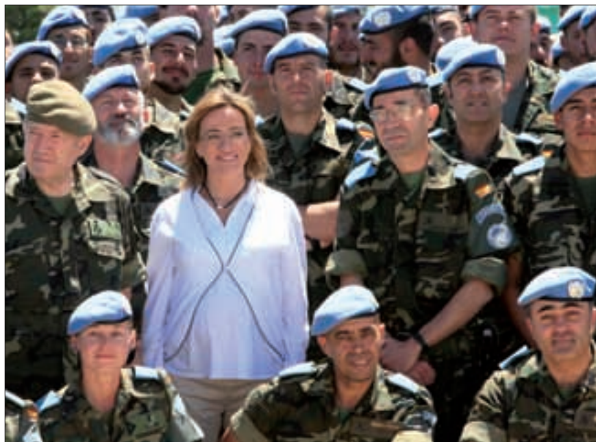
La ministra posó con los militares españoles desplegados en el Líbano. Los Zapadores han impermeabilizado con una alambrada una zona de la Línea Azul

El Grupo Táctico y la Unidad de Reconocimiento realizan diariamente patrullas de vigilancia en el área de responsabilidad de la BMN-E.