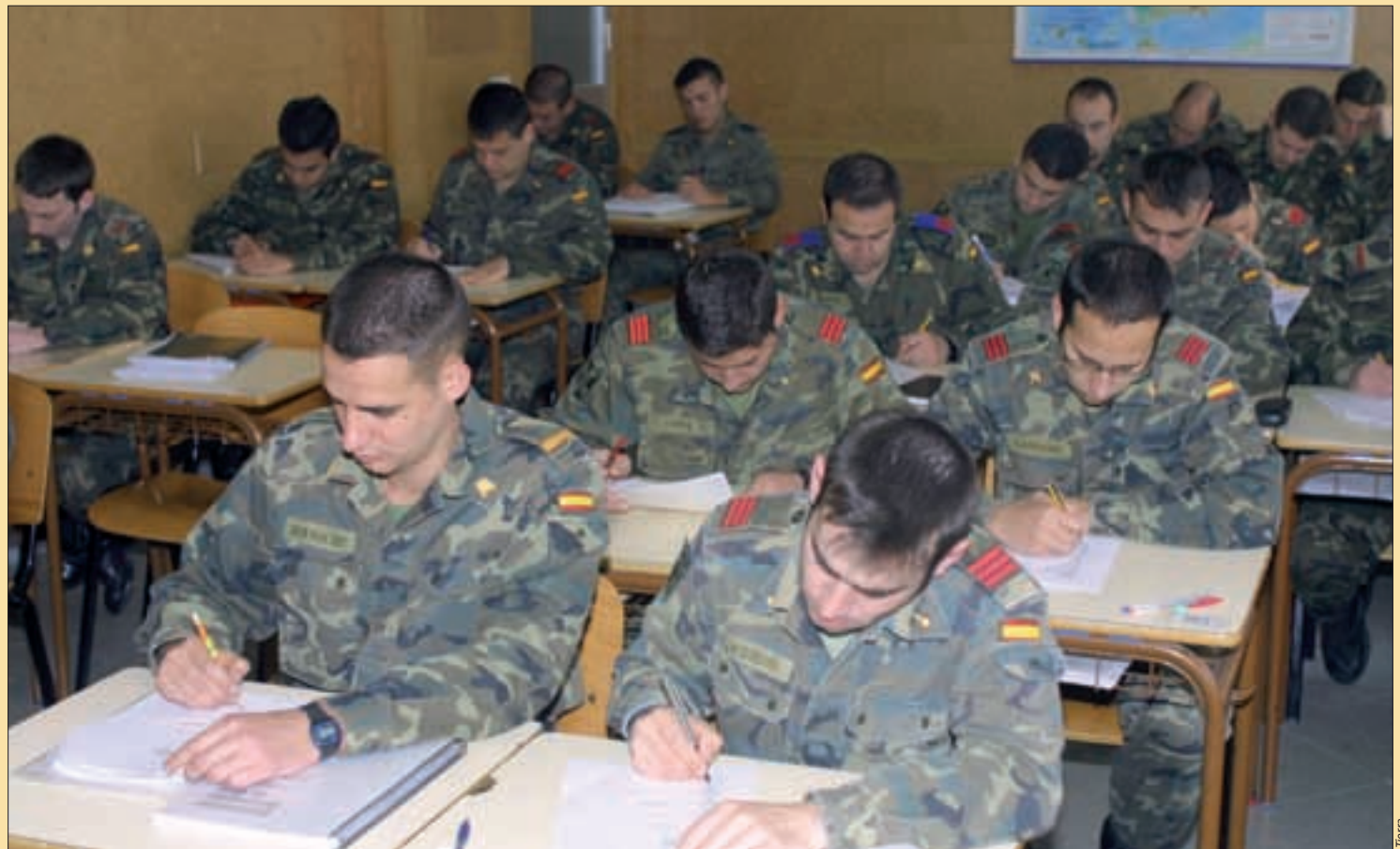
La promoción profesional adquiere una gran importancia para los militares profesionales de tropa durante su estancia en las FAS

Las Fuerzas Armadas tienen que afrontar un periodo de transformaciones. Este año ha comenzado con los cambios que supone llevar a cabo la Ley de la Carrera Militar. Dentro de este trabajo, una parte muy importante tiene que ver con la promoción profesional de los milita-