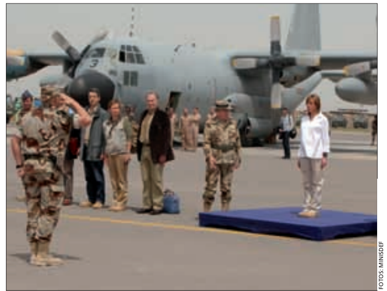
Carme Chacón en su primer viaje a una misión como titular de Defensa

La ASPFOR XIX —compuesta sobre la base de la Brigada de Infantería Ligera “Rey Alfonso XIII” II de la Legión— concluyó el relevo el 15 de marzo. El contingente español, encuadrado en el Mando Re-