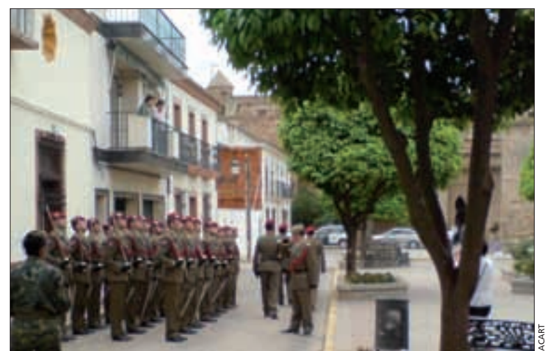
Miembros de la Academia de Artillería forman en la población de Niebla

El ejercicio ha permitido validar los procedimientos y sistemas internos del HQ en un ambiente conjunto, en el que los mandos principales han estado representados por células de respuesta. El hecho de que estos mandos pertenezcan a la estructura de Mandos de la OTAN ha supuesto un verdadero esfuerzo para un HQ que no pertenece a la misma.