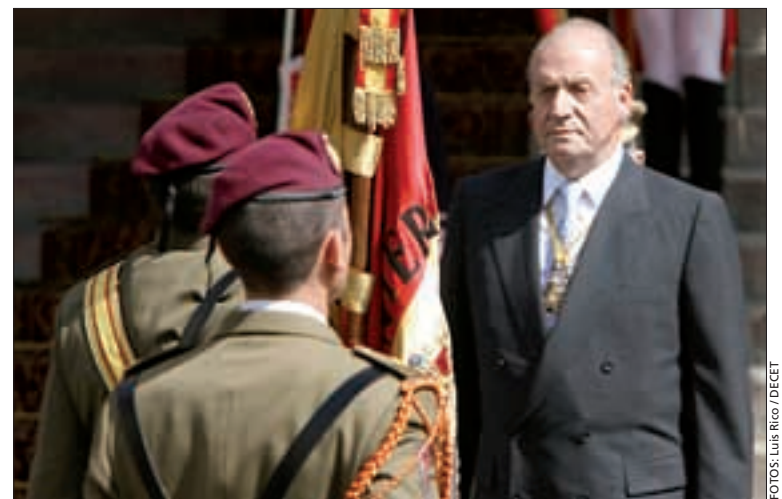
Foto superior: El batallón de honores desfilando por la Carrera de San Jerónimo. Inferior: Su Majestad el Rey, ante la Bandera de España.