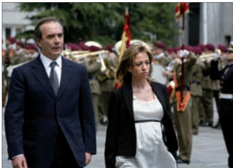
La nueva ministra pasó revista a la formación acompañada de su antecesor

«Capitán, mande firmes», ha sido la frase más resaltada por los medios de comunicación de las pronunciadas por la nueva ministra de Defensa, Carme Chacón, el día 14 de abril, cuando tomó posesión de su cargo en la sede del Departamento dirigido, hasta ese momento, por José Antonio Alonso. Y el capitán Ortega, perteneciente al Regimiento de Infantería “Inmemorial del Rey” nº 1, ordenó que la compañía mixta que rindió honores adoptase la posición de firmes. El 25 de abril la ministra de Defensa presidió su primer Consejo Superior del Ejército —órgano asesor y consultivo del JEME— en el Palacio de Buenavista, sede del Cuartel General. Págs. 2 y 3