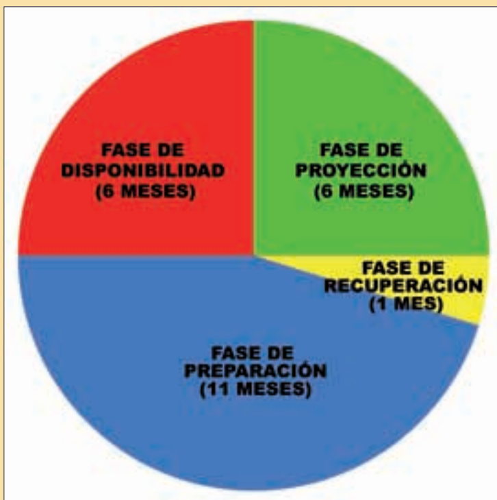
Habrán dos unidades en cada fase pero en la de preparación serán cuatro

En el ámbito de las unidades de maniobra, las que irán rotando en este nuevo ciclo operativo (cu-