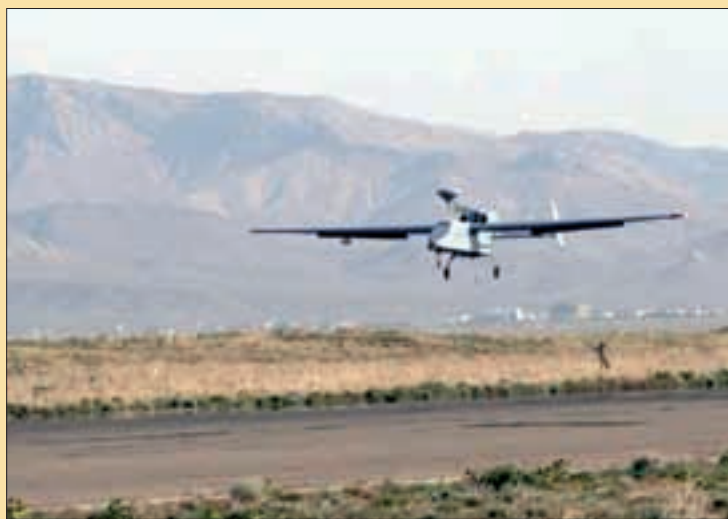
El UAV llevó a cabo su primer vuelo en Herat, el 15 de abril

Tras despegar, con un viento de 10 kilómetros por hora, el UAV ascendió algo más de 1.000 metros sobre el terreno para realizar una espera controlada mientras emitía las primeras imágenes de la base de Herat a la estación de control en tierra. Una vez completado el perfil de maniobras previsto, el UAV descendió con una senda estable para terminar su primer vuelo