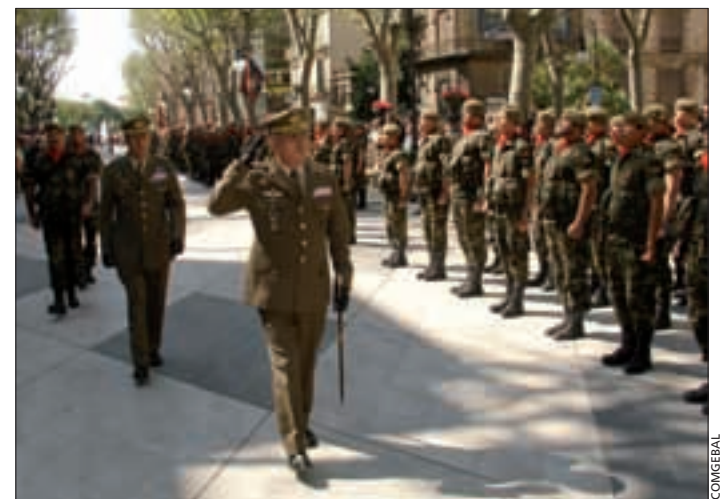
El teniente general Sañudo pasó revista a la Fuerza Española en Kosovo XX

Agoncillo (La Rioja), ha aportado los cuatro pilotos y tres mecánicos que, junto con dos facultativos y dos ATS de diferentes unidades de Sanidad, conforman la Unidad de Helicópteros de Evacuación Médica que ha desplegado en el país balcánico. Esta unidad, bajo el mando del capitán Rocha, está destacada en la capital, Sarajevo, donde forma parte del elemento de apoyo al jefe de la EUFOR. La proyección a zona de la Unidad de Helicópteros se efectuó el día 21 de abril.