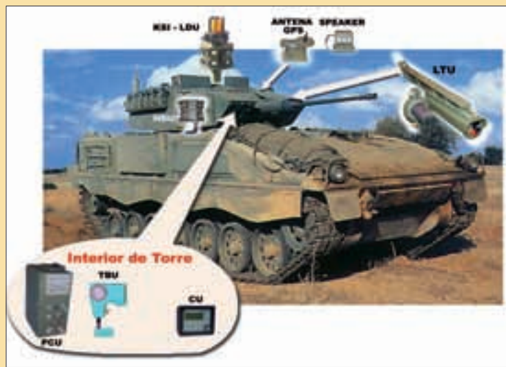
El equipo del simulador va montado sobre el vehículo

El montaje de los equipos recibidos tendrá lugar tras la realización de un curso de montaje específico para el simulador.