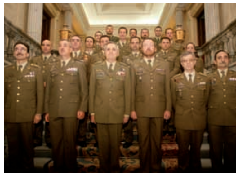
Los miembros de la Campaña Antártica posan con el 2º JEME y mandos del EME

La Campaña 07/08 se ha llevado a cabo en el marco del Año Polar Internacional, un programa que se ha desarrollado en 1882/83,