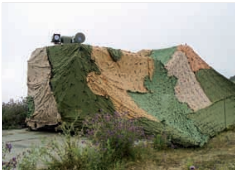
Puesto de Observación del Grupo de Localización e Información de la UDACTA

Con el fin de adecuarse a las nuevas exigencias, y cumplir las misiones asignadas por el Jefe de Estado Mayor del Ejército —entre ellas, la plena disponibilidad durante el primer semestre de 2008 de una unidad de Artillería de Costa— el MACTA ha desarrollado por primera vez un ejercicio fuera del entorno del estrecho. Encuadrados en lo que se denomina Unidad de De-