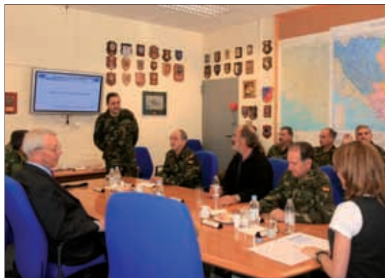
La ministra asistió a una exposición impartida por el general Martín Villalaín

Al día siguiente tuvo lugar un acto militar en la base “Camp Butmir”, donde reside la mayor parte del contingente español. Posteriormente, en el comedor de la base, Carme Chacón compartió un desayuno con el contingente; en su alocución transmitió el saludo de Su Majestad el Rey y el presidente del Gobierno.