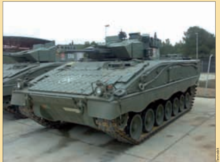
El vehículo de combate Pizarro es de diseño español

El simulador permite el tiro desde el vehículo, parado o en movimiento, sobre blancos fijos y mó-