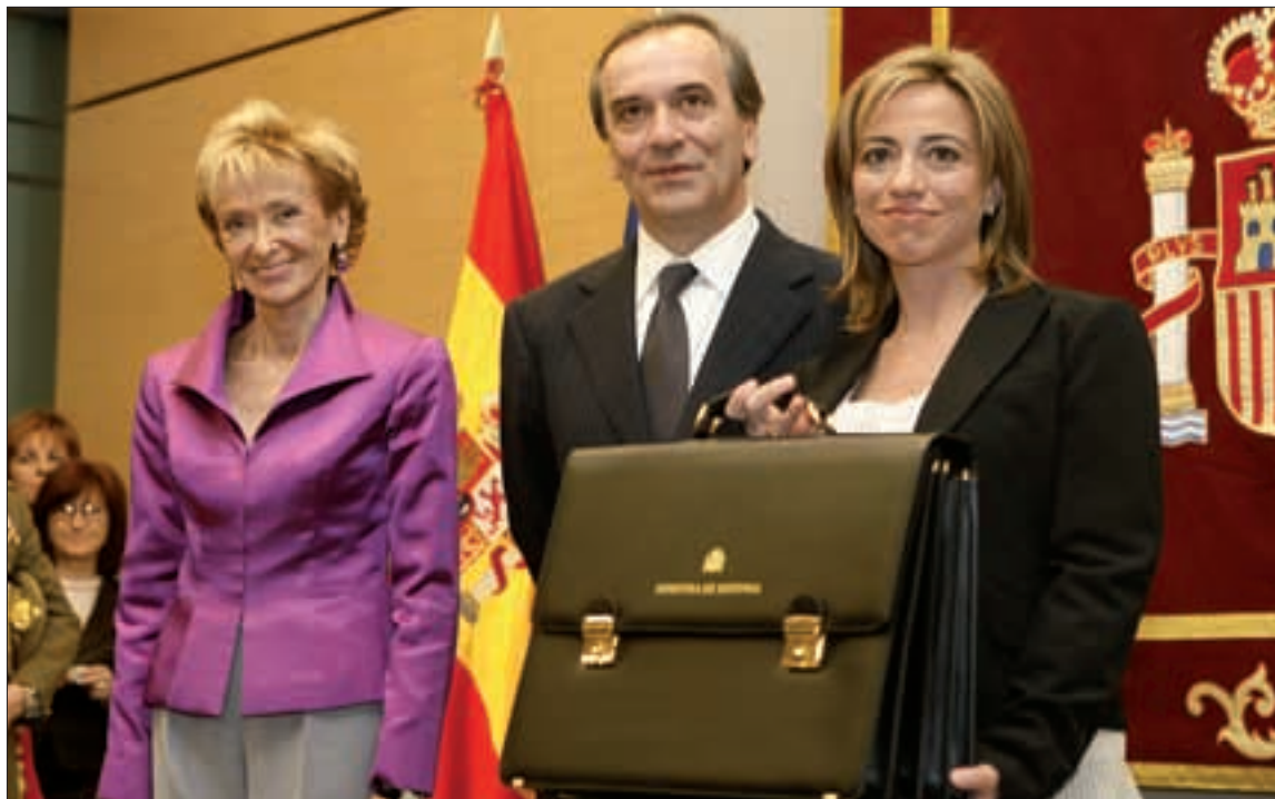
La ministra entrante, Carme Chacón, junto a su antecesor y la vicepresidenta primera del Gobierno

El 14 de abril relevó a su antecesor, José Antonio Alonso