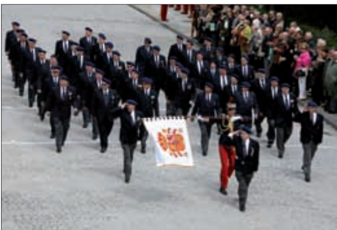
Los veteranos desfilaron en la Academia General Militar