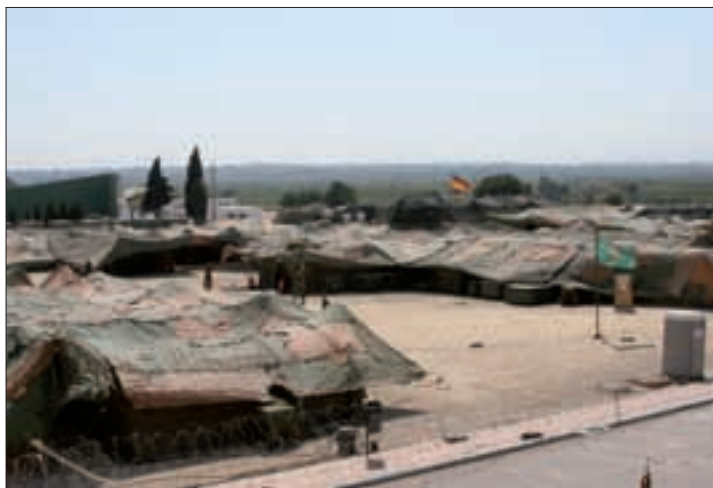
Un puesto de mando de un batallón NBQR alemán desplegó en Bétera

El control del ejercicio se llevó a cabo, principalmente, desde el Centro de Adiestramiento Conjunto, con sede en Ulsnes (Noruega); también tenía destacamentos en Alemania y Bétera. En este Centro