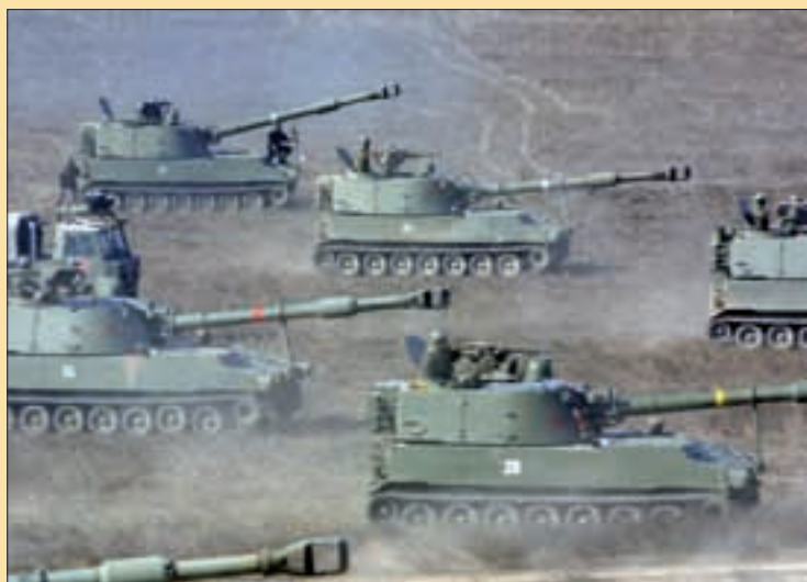
El nuevo concepto operativo se extiende a todas las unidades

Nacimiento y desarrollo del Plan A mediados del año 2005, a medida que avanzaba el planeamiento del modelo Ejército de Tierra XXI, el Estado Mayor del Ejército identificó la necesidad de desarrollar un nuevo concepto operativo para garantizar la disponibilidad de las unidades del Ejército de Tierra que el JEMAD pudiera requerir. Teniendo en cuenta que uno de los