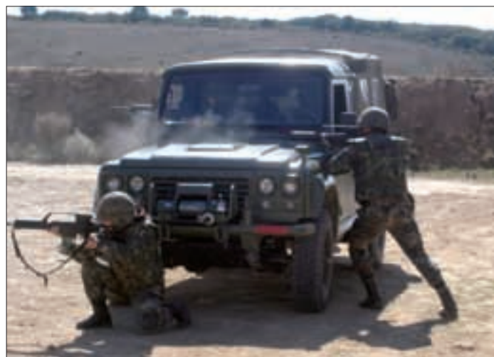
Miembros del GL durante el ejercicio de tiro

En este primer ejercicio conjunto de las unidades expedicionarias del MACTA, se ha comprobado la viabilidad de la UDACTA a la hora de desplegar en cualquier escenario que se le ordene con su personal y material.