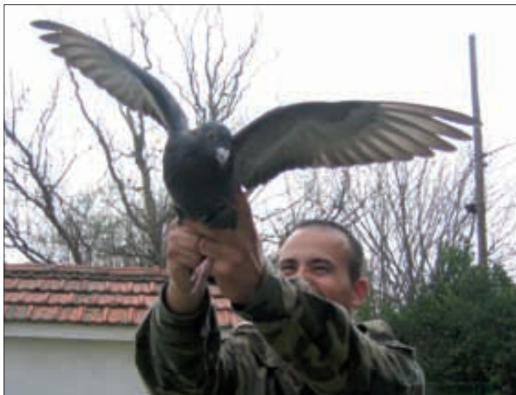
En el año 1879 se estableció el primer palomar militar en Guadalajara

El 28 de marzo, por tanto, finalizó un capítulo importante de la historia