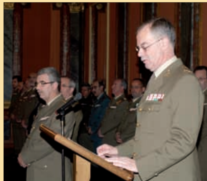
El general Guinea, en su despedida de la Cuarta Subinspección General

A lo largo de su carrera militar, el general Guinea ha estado muy vinculado a unidades operativas, principalmente la Brigada Paracaidista. Además, cuenta con una amplia experiencia internacional, ya que realizó el Curso de Estado Mayor del Colegio de Defensa de la OTAN, en Roma, y ha ocupado varios destinos en Estados Unidos, concretamente en Washington, Nueva York y Virginia.