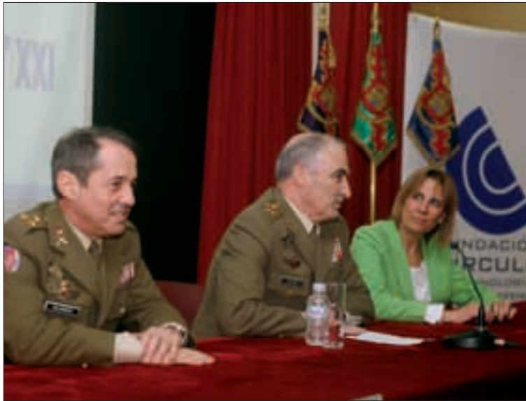
El Jefe de Estado Mayor del Ejército clausuró la jornada sobre prospectivas CIS en el Cuartel General del Ejército, a la que asistieron 200 civiles y militares

Expertos civiles y militares se reúnen en el Cuartel General del Ejército