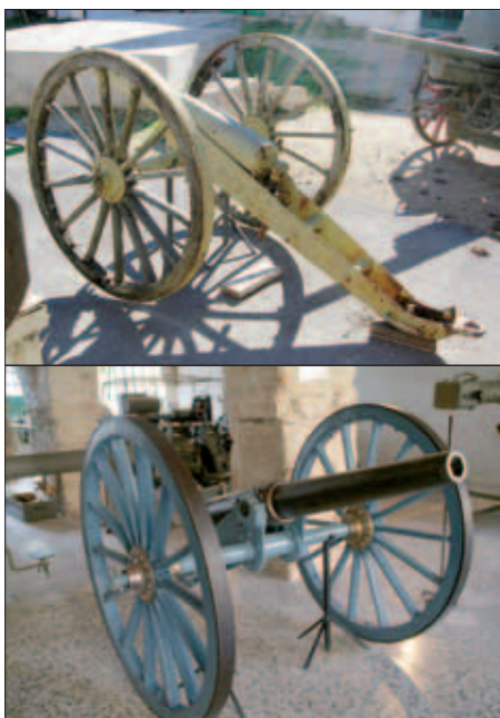
Este cañón Whitworth, calibre 75 mm de ánima hexagonal, es un modelo de 1873 empleado por la Artillería carlista, que adquirió unas 70 piezas de este sistema.