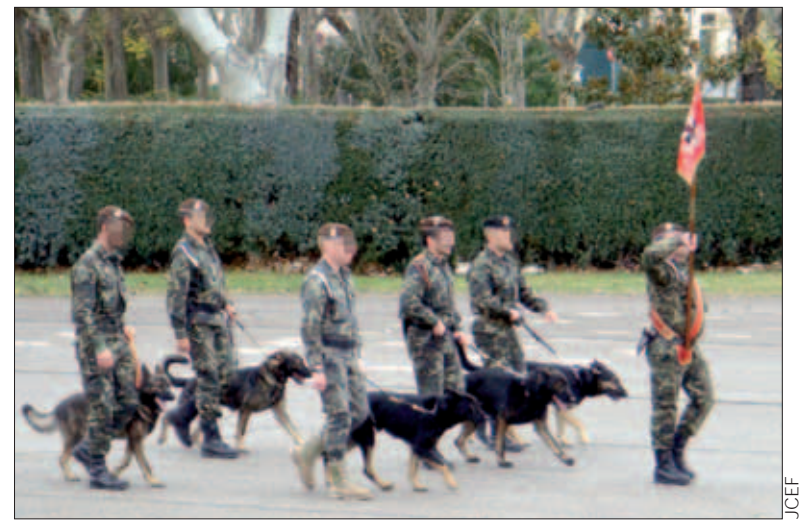
Integrantes del equipo del Ejército en el campeonato

Para ampliar esta información, vea Internet (24/11/2010).