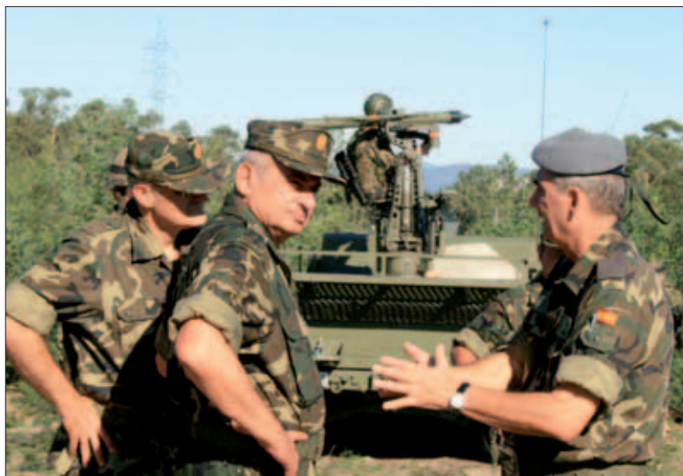
El JEME compartió una jornada con los componentes de la BRILAT

El JEME destacó el excelente nivel de preparación de la Brigada, demostrado en numerosas ocasiones, como en la operación "Centinela Gallego" de apoyo a las autoridades civiles en Galicia y, especialmente, en el exterior, con su participación en las misiones de Afganistán, el Líbano y