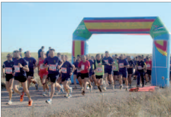
Imagen de los corredores en la salida