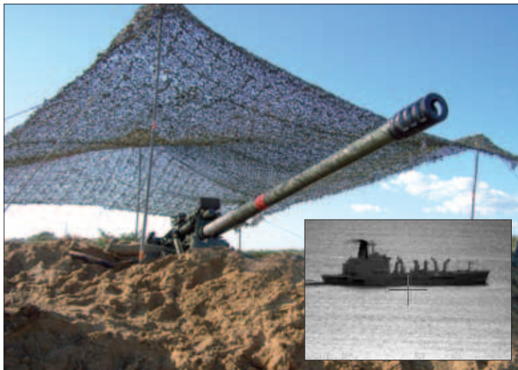
La Artillería apunta a los barcos que son catalogados como hostiles

Varias unidades del Ejército de Tierra han tomado parte en el ejercicio FLOTEX, que se desarrolló del 9 al 18 de noviembre en el mar de Alborán y aguas del golfo de Cádiz. Se trata de un ejercicio en el que la Armada moviliza varias fragatas y buques, que actúan en un escenario ficticio de crisis diseñado para la ocasión, y en el que sincroniza las necesidades de adiestramiento de todos los mandos de la Flota en operaciones de seguridad marítima, operaciones anfibia y guerra asimétrica.