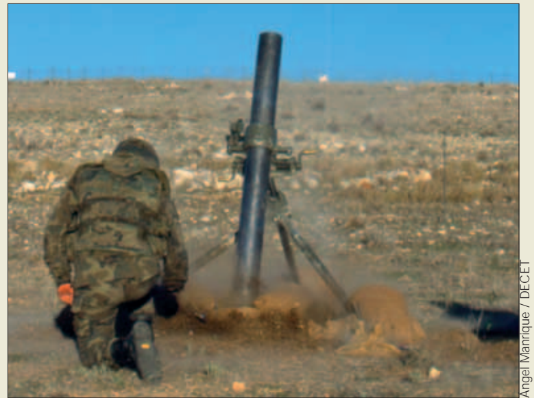
El mortero está inmerso en un proceso de modernización

Con esto se conseguirá ganar en rapidez y se marcará un hito, puesto que será la primera vez que la Infantería cuente con un sistema de estas características. Esto será posible gracias a un módulo específico para morteros integrado en el sistema TALOS, que se configurará como Sistema Unificado de Mando y Control