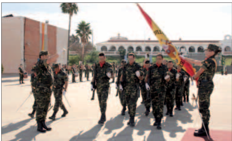
El acto se celebró en el acuartelamiento "Camposoto"