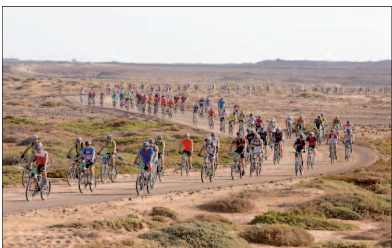
Columna de ciclistas durante el transcurso de la prueba

Para ello, los nuevos jueces árbitros han tenido que superar un curso y un examen final. El curso se inició en septiembre, con una fase de correspondencia, y ha finalizado, en las instalaciones de la Escuela Central de Educación Física, en Toledo, los días 9, 10 y 11 de noviembre con la fase presencial y la prueba evaluatoria final. Éste se ha desarrollado bajo la dirección de la Presidencia del Comité Nacional de Jueces Árbitros de la Federación Española de Tiro. La titulación obtenida habilita a estos militares como jueces árbitro de competiciones nacionales de tiro tanto militares como civiles.