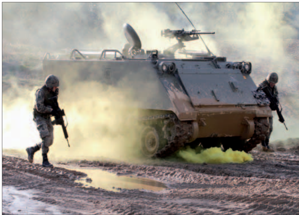
La explosión de un IED se simuló con el lanzamiento de un bote de humo

Durante el mismo, tuvieron que hacer frente a diferentes incidencias que se les fueron presentando. Una de ellas consistió en la activación de un artefacto explosivo improvisado al paso de una patrulla, con resultado de un fallecido y tres heridos. El personal del vehículo afectado tuvo que reaccionar como lo