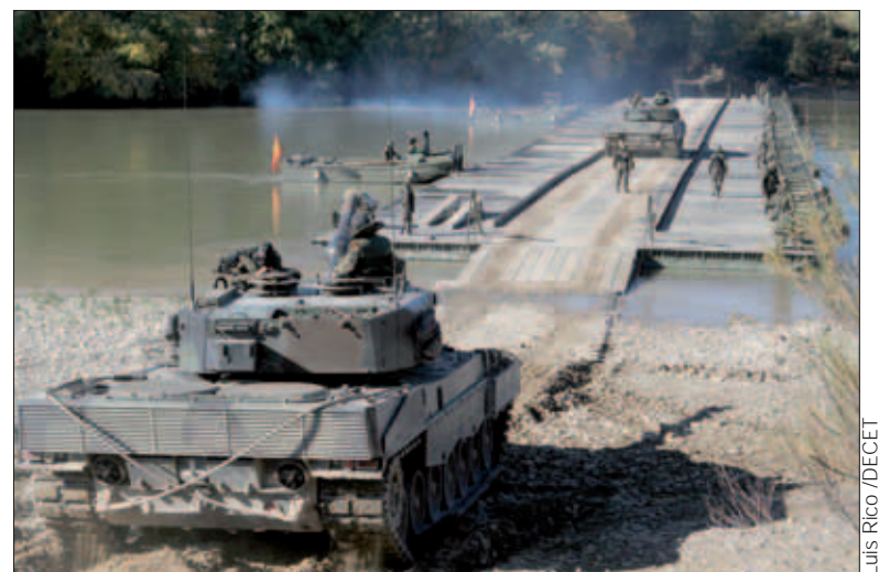
Los Leopard 2A4, durante el paso del río Ebro

en el Centro de Adiestramiento "San Gregorio". El Grupo Táctico requirió para su avance salvar dos vaguadas, y lo hizo mediante el puente de vanguardia Dornier. Las actividades de la Brigada se completaron con un ejercicio gamma, del 18 al 20 de noviembre. Para más información, puede consultarse intranet (23/11/2010).