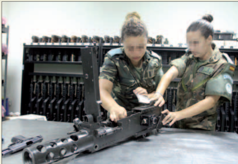
Las ULOG realizan las tareas de mantenimiento del material en zona

la responsabilidad de coordinar la generación de las formaciones logísticas expedicionarias, independientemente de la unidad base de la que procedan.