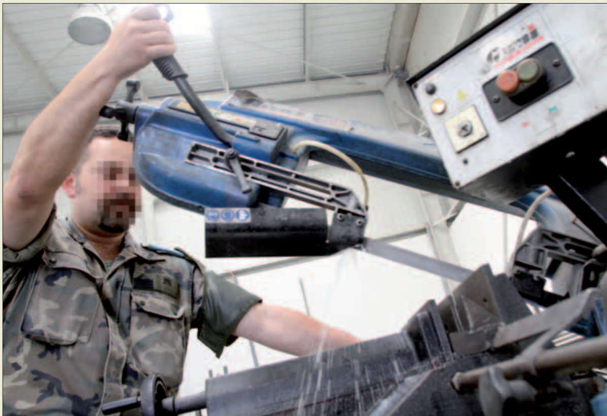
La logística expedicionaria garantiza que el personal desplegado en misiones disponga de todo lo necesario

Hasta ahora, las Agrupaciones de Apoyo Logístico (AALOG) han cumplido este doble cometido a la perfección, ya que además de ocuparse del apoyo logístico a las unidades ubicadas en sus áreas de responsabilidad territorial, han si-