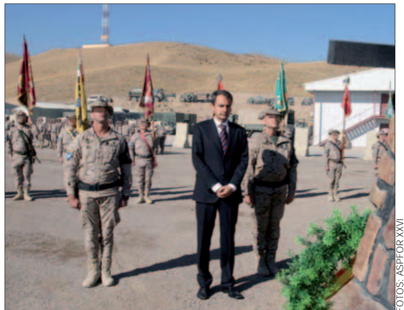
Zapatero rindió homenaje a los que dieron su vida por España

Por otro lado, un grupo de militares del Equipo de Reconstrucción Provincial (PRT) español en Badghis se desplazó el 1 de noviembre a la localidad de Gulchin, para apoyar al gobernador en su intento de transmitir a las autoridades locales la necesidad de garantizar la seguridad para mejorar el desarrollo.