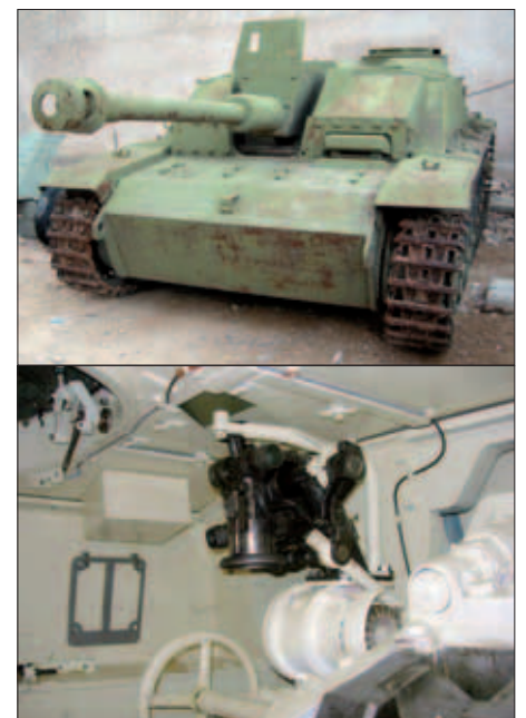
Este carro alemán StuG III se encontraba muy deteriorado, sobre todo en el interior, pero con dedicación, la cámara de combate ha quedado como nueva.