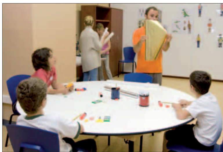
Los más pequeños aprenden jugando en el Museo del Ejército

Posteriormente, se realizó un acto de homenaje a los que dieron su vida por España, en el que los padres de uno de los aspirantes a militar profesional de tropa depositaron la corona de laurel a los pies del monumento.