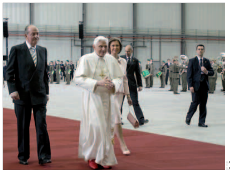
Los Reyes acompañaron al Pontífice en el acto de despedida

Al día siguiente, Benedicto XVI celebró una segunda misa, en este caso en el templo expiatorio de la Sagrada Familia, en Barcelona, que él mismo elevó a la categoría de basílica menor. Por la tarde, tras visitar la Obra Benéfico-Social del Niño Dios, en la capital catalana, el Pontífice se dirigió al aeropuerto de El Prat, donde se celebró la ceremonia de despedida.