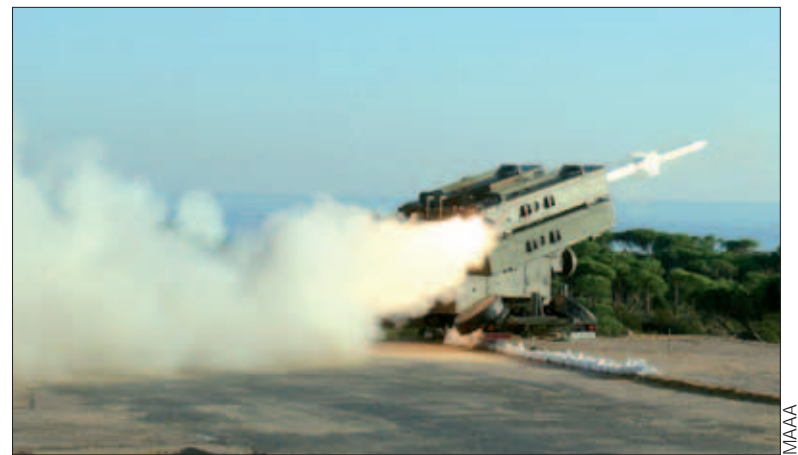
Lanzamiento de un misil Aspide durante el ejercicio "Sirio"

móviles, que enviaron imágenes en tiempo real al Centro de Operaciones y Vigilancia Marítima, ubicado en Cartagena (Murcia). Las unidades móviles de Artillería de Costa desplegaron sus obuses y practicaron los procedimientos de actuación ante ataques de cohetes, artillería y morteros a una base, que incluyeron trabajos de fortificación.