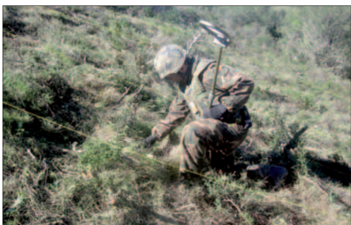
Un desactivador busca explosivos y proyectiles en la zona