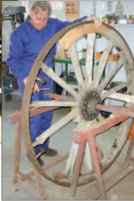
Museo Histórico Militar de Cartagena

En la actualidad sus muros acogen el Museo, que ha asumido el objetivo de dar a conocer a las nuevas generaciones los materiales y el armamento que forman parte del pasado histórico del Ejército.