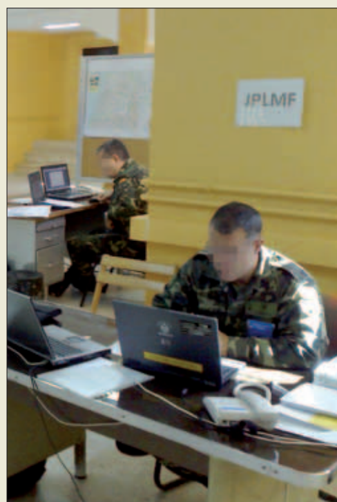
Plana Mayor de la ULOG en el ejercicio

El proceso de evaluación constó de dos partes: por un lado, el aspecto técnico, en donde se valoró el nivel de especialización en cada una de las áreas; y por otro, los procedimientos operativo-logísticos, en los que se tuvo en cuenta la relación que, a través del Mando de Apoyo Logístico, se establece con los que están en territorio nacional y con los que se mantiene un contacto diario.