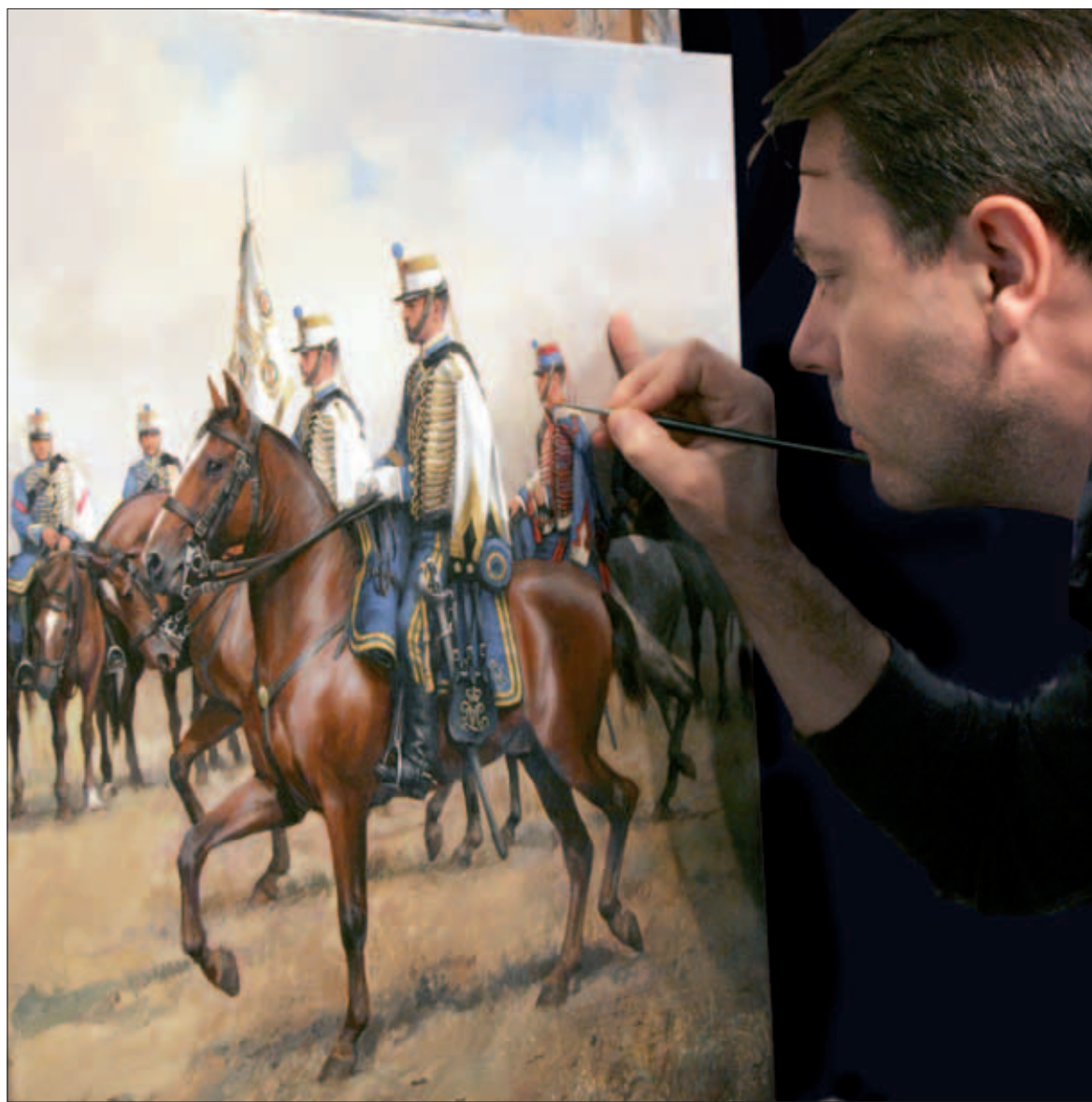
El pintor, con precisión y maestría, da los últimos retoques a una escena ecuestre

Al margen de mi trabajo, pintaba cuadros de temática militar para mí y para mi entorno. A raíz de una exposición de este material en Madrid se me abrieron las puertas a una temática que siempre me ha apasionado. Sentía atracción por las Guerras Carlistas, porque en ellas lucharon unos ejércitos desconocidos por la mayoría, pero que también forman parte de la historia militar de España.