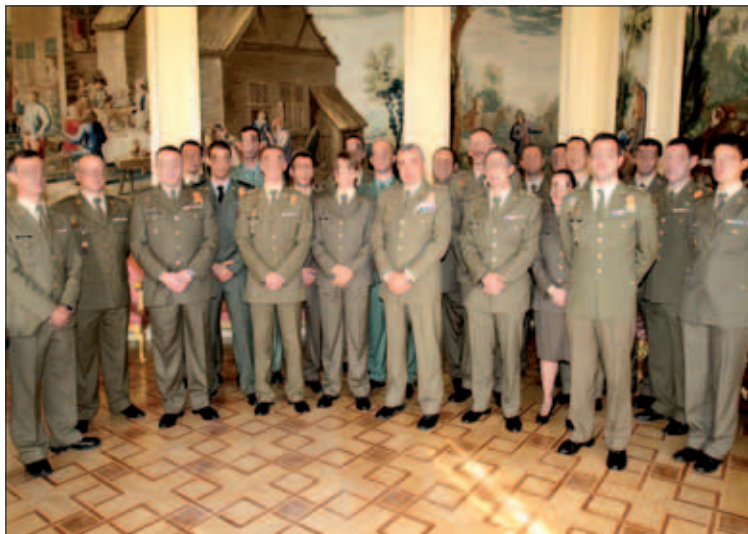
Los mejores deportistas del Ejército posan con el general Coll

En su discurso, el teniente coronel Jayme, jefe accidental de la JCEFD, apuntó que esta audiencia «supone un reconocimiento a los méritos y trayectoria deportiva de los presentes y a todo el de-