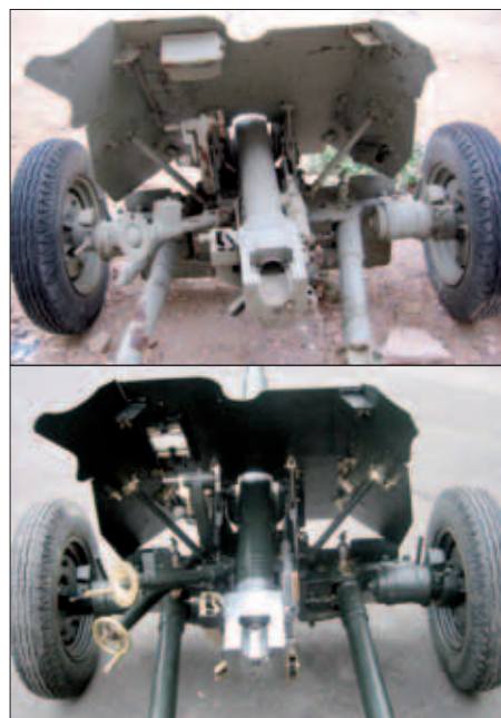
El cañón contracarro soviético, calibre 45 mm, de 1932 fue una de las armas vendidas por la URSS a la República y convertida después en reglamentaria.