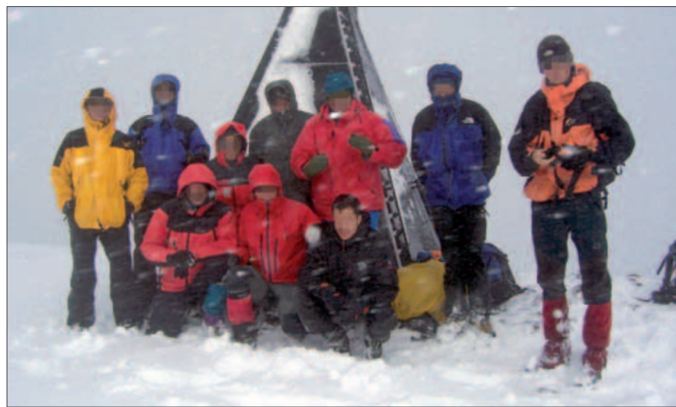
Un grupo de montañeros ascendió a la Peña Oroel para celebrar los 25 años del GMAM

Un cuarto de siglo En sus 25 años de existencia, el GMAM ha llevado la Bandera de España a algunos de los rincones más inhóspitos del planeta. Varios montes de más de 8.000 metros, como el Nanga Parbat, el Sisha Pagma, el Everest, el Gasherbrum I, el Cho-Oyu y el Gasherbrum II —todos ellos, en las cordilleras del Himalaya y el Karakórum—, han sido coronados por el Grupo entre 1987 y 2006. Además, un