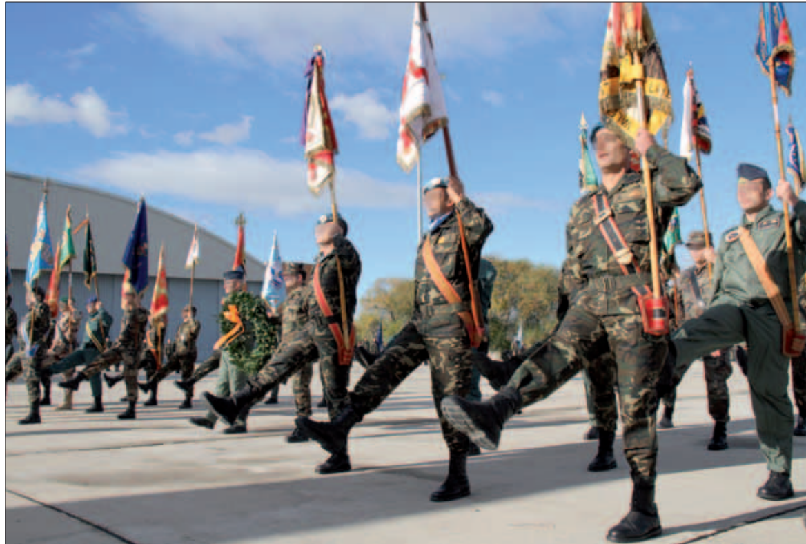
En el acto de homenaje participaron los guiones de todas las agrupaciones españolas

al director del Museo del Ejército, general Izquierdo. La ministra de Defensa, Carme Chacón, tuvo palabras de agradecimiento para los componentes de las Fuerzas Armadas españolas por la labor que han desarrollado en Bosnia-Herzegovina, prote-