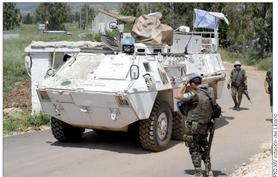
Las patrullas son diarias en zona de operaciones

Esta misión ha sido la que más reconocimientos ha propiciado. Se les ha conce-