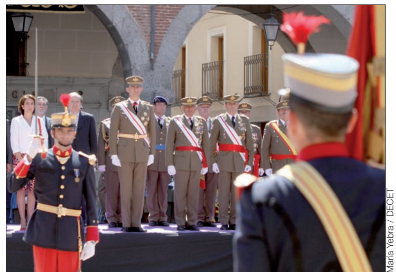
Don Felipe presidió el acto principal del centenario de Intendencia

En el caso de Ceuta, el general de ejército Coll se reunió con cerca de un centenar de antiguos regulares indígenas, venidos de Ma-