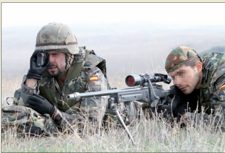
Las unidades realizan ejercicios de certificación

Los compromisos internacionales asumidos por España en materia de Defensa en el contexto de la OTAN o la Unión Europea suponen para el Ejército un esfuerzo continuo derivado de la exigencia de disponibilidad que implican. Para llegar al grado de preparación que requieren este tipo de misiones, durante los meses anteriores a su fase de stand by, las unidades asignadas