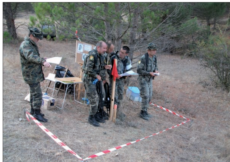
Uno de los equipos del Ejército disputando el Concurso de Patrullas

Tras el primer año de vida del Test General de la Condición Física, se hizo balance y se ajustaron puntuaciones; también se estrenó la nueva prueba de unidad, en la que el 70 por ciento de los componentes han de hacer 10 kilómetros con el equipo de combate ligero en un máximo de 90 minutos (nº 184).