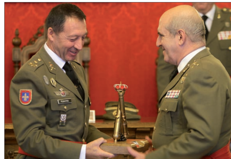
El general recibe el Premio de manos del jefe del MADOC

La labor de los militares españoles allí ha sido reconocida en el premio concedido por la Fundación Puentes del Mundo, y pudo conocerse más a fondo en la exposición temporal que el Museo del Ejército inauguró a mediados de octubre y ya ha concluido (nº 191).