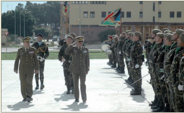
Acto de constitución de la base discontinua "Melilla"

La Fuerza Logística Operativa (FLO) es la unidad que impulsa los importantes cambios que está experimentando la Logística en el Ejército durante los últimos años.