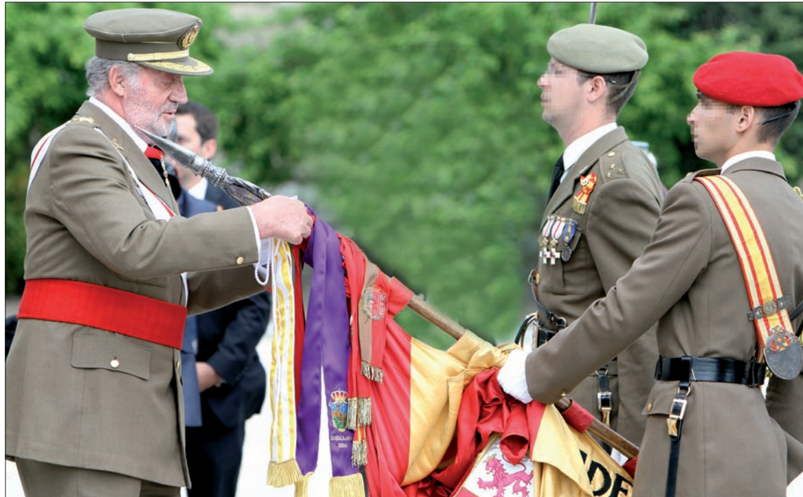
El Rey impuso la corbata de la Orden de Isabel la Católica a la Bandera de la Academia de Ingenieros

Aparte del acto central, las unidades de Ingenieros han celebrado a lo largo del año multitud de actividades en toda España, como conferencias, jornadas de puertas abiertas, conciertos de