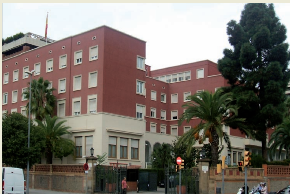
Residencia Militar Logística “Pedralbes”, en Barcelona

En cuanto a la Ley de Derechos y Deberes, la regulación del derecho de asociación, y la creación tanto del Consejo de Personal de las Fuerzas Armadas como del Observatorio de la Vida Militar son las principales novedades que introduce. En el capítulo de las Normas de Mando y Régimen Interior se tratan aspectos tales como la conciliación de la vida profesional, personal y familiar, la igualdad efectiva entre hombres y mujeres, la profesionalización o la prevención de riesgos laborales, entre