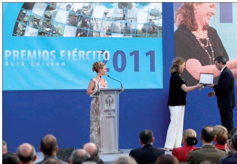
La embajadora de Bosnia-Herzegovina entregó algunos galardones

En las Comandancias Generales de Ceuta y Baleares optaron por recordar, a través de sendas