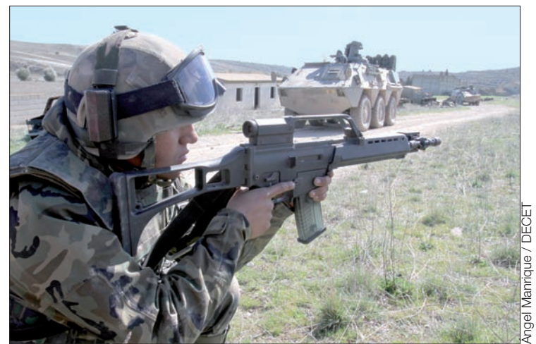
Los contingentes se adiestran con el mayor realismo posible

Para la Brigada de Infantería Acorazada "Guadarrama" XII, el de marzo fue un mes muy intenso. Primero, su Cuartel General tuvo un ejercicio de Puestos de Mando en los simuladores del CENAD y, poco después, las unidades operativas, incluidas las del Grupo Táctico Ligero