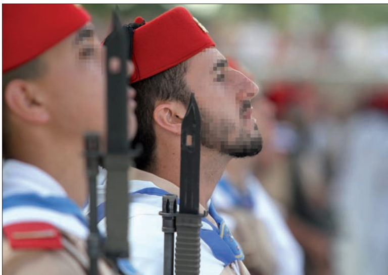
Regulares celebró su centenario en Ceuta (en la foto) y Melilla