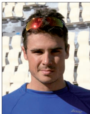
Javier Gómez Noya

«Hay que encontrar el justo equilibrio entre periodistas y militares, con sentido común y profesionalidad».