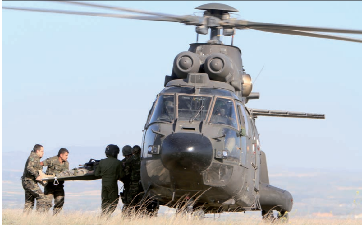
Prácticas de evacuación de heridos en helicóptero durante el "Mercurio"

Los ejercicios permiten a las unidades ponerse a punto para afrontar sus compromisos