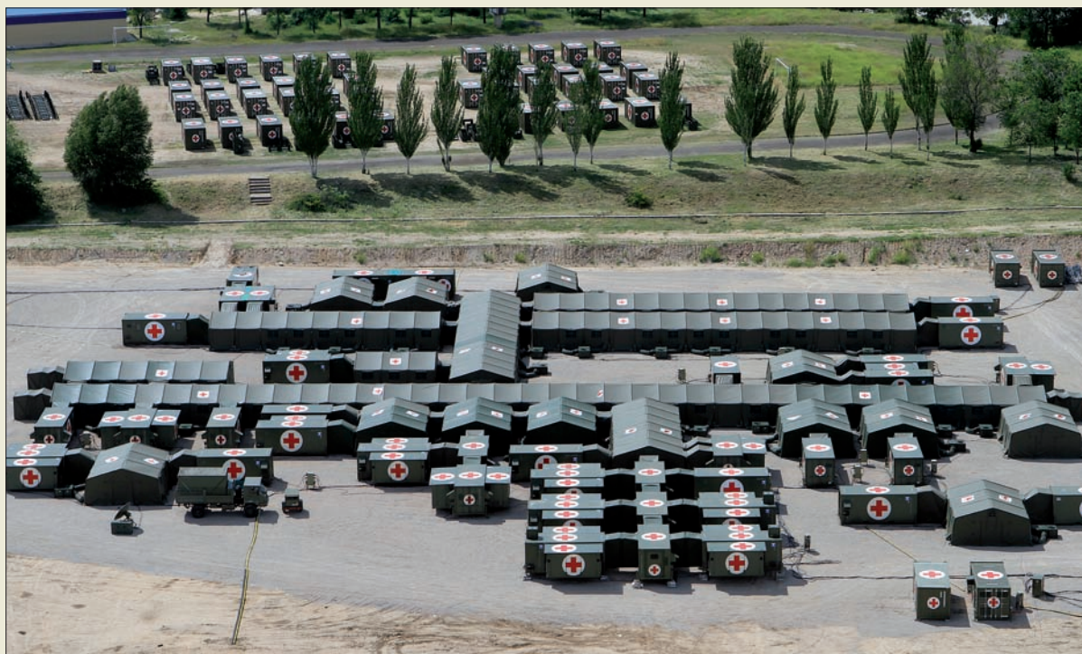
El Hospital de Campaña era un proyecto muy ambicioso que se ha hecho realidad este año

Fundamental es el papel que juegan las tres aulas de los Sistemas de Información y Telecomunicaciones (CIS) para zona de opera-