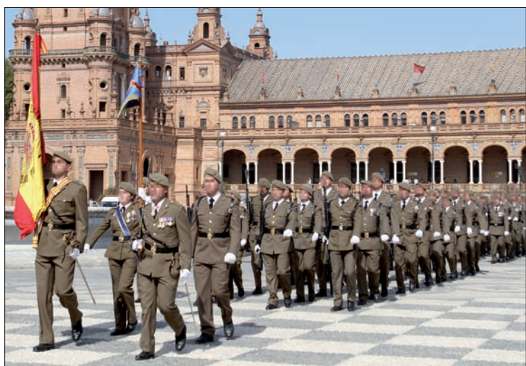
El REW nº 32 desfiló con la Bandera por la plaza de España