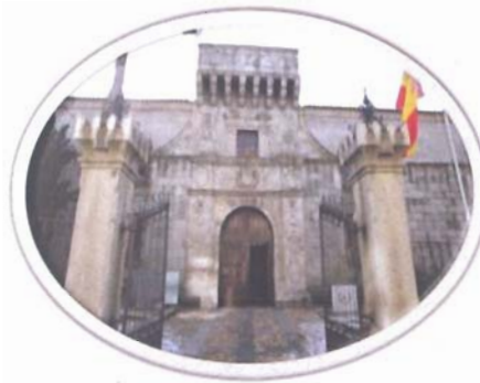
Palacio de Polentinos

Dichoso yo si un día ante mi Patria llego a demostrar que supe ser soldado español.