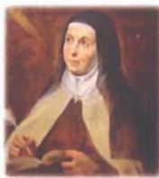
Santa Teresa de Jesús

Los cadetes del Cuerpo de Intendencia se formaban durante dos años en la Academia General Militar de Zaragoza, adquiriendo los conocimientos generales precisos y robusteciendo el espíritu de compañerismo y dignidad propios de la profesión militar. En la Academia de Intendencia, durante otros dos años más, continuaban su formación especializada y complementaria teórica y práctica del estudio de la Intendencia tanto en tiempos de paz como de guerra. En el año 1944, hizo su presentación la primera promoción de la Academia General Militar de la tercera época. Hasta entonces, se habían formado 1853 oficiales, 3687 alféreces provisionales, 94 oficiales cadetes de transformación y 10 alumnos marroquíes.