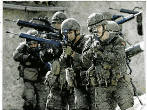
Un comando de Infantería en posición de ataque. MANU MELNIEZUK

Los responsables de la Comandancia General de Balears indicaron que la presencia de las dos unidades de Infantería de regimiento Palma 47 en el ejercicio internacional de la OTAN permitirá probar la "interoperatividad y preparación" de los militares del archipiélago. Hay que tener en cuenta que se trata de una de las maniobras de preparación más importantes que jamás se ha realizado en suelo europeo.