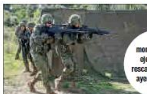
Tres momentos del ejercicio de rescate realizado ayer.

En Chinchilla, los efectivos se sumarán a tropas danesas, británicas e italianas