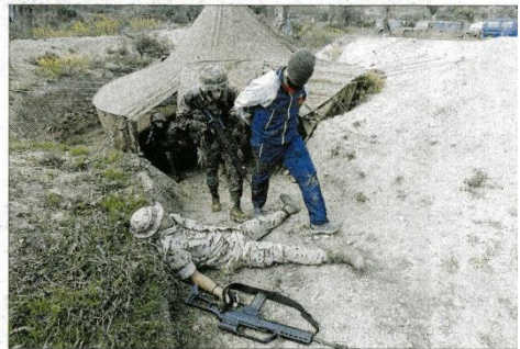
Rescate del rehén con uno de los enemigos abatido. MANU MELNIEZUK