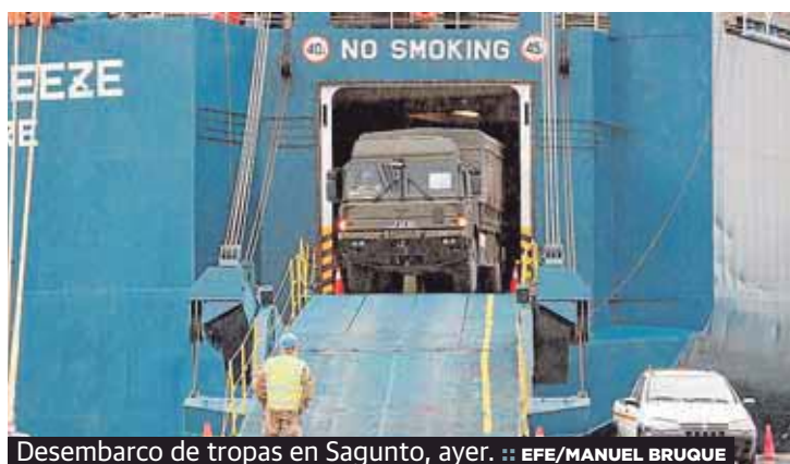
Desembarco de tropas en Sagunto, ayer.