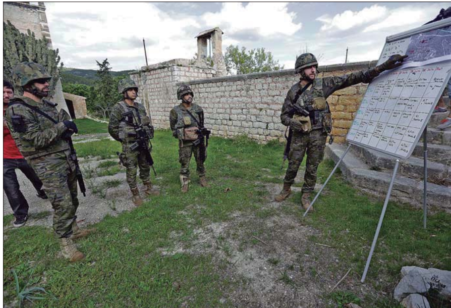
Los miembros del Palma 47 realizaron un ejercicio la semana pasada para entrenarse.

No son los únicos miembros de las Fuerzas Armadas que se desplazan esta semana desde Ba-