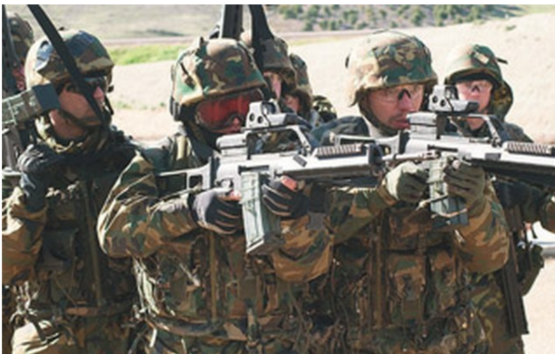
Imagen de soldados en un ejercicio de adiestramiento del Cenad Chinchilla. E. T.

En el vecino campo de maniobras estará una de las cuatro «brigadas multinacionales» en las que se estructura el ejercicio en la parte de tierra (las maniobras incluyen operaciones combinadas con mar y aire). La brigada de Chinchilla estará dirigida por Reino Unido, y bajo su mando habrá donde va a haber un millar de militares ingleses, junto a 900 de Dinamarca, 300 de Estados Unidos, y casi 900 italianos (España aporta cerca de medio millar). La Base Aérea de Los Llanos ha sido la puerta de entrada en España de parte de las tropas danesas y británicas, y de todas las fuerzas italianas, según consta en la programación del despliegue aportada por el Ministerio de Defensa.