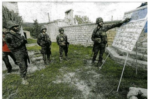
Un mando explica la táctica de la misión de asalto. MANU MELNIEZUK