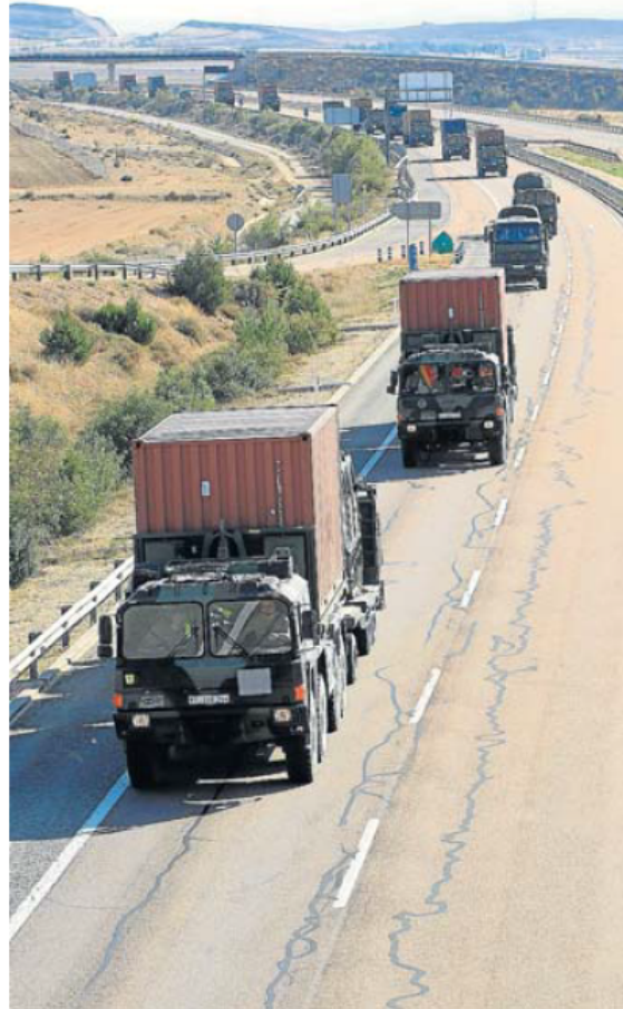
Los vehículos alemanes, ayer, por la A-23 en Teruel.

Es una operación logística difícil de repetir porque sus barcos entran por los puertos de Bilbao, Barcelona, Tarragona y Valencia; viajan por carreteras de todo el país (parte del ejercicio se celebra en Andalucía, y el campo de