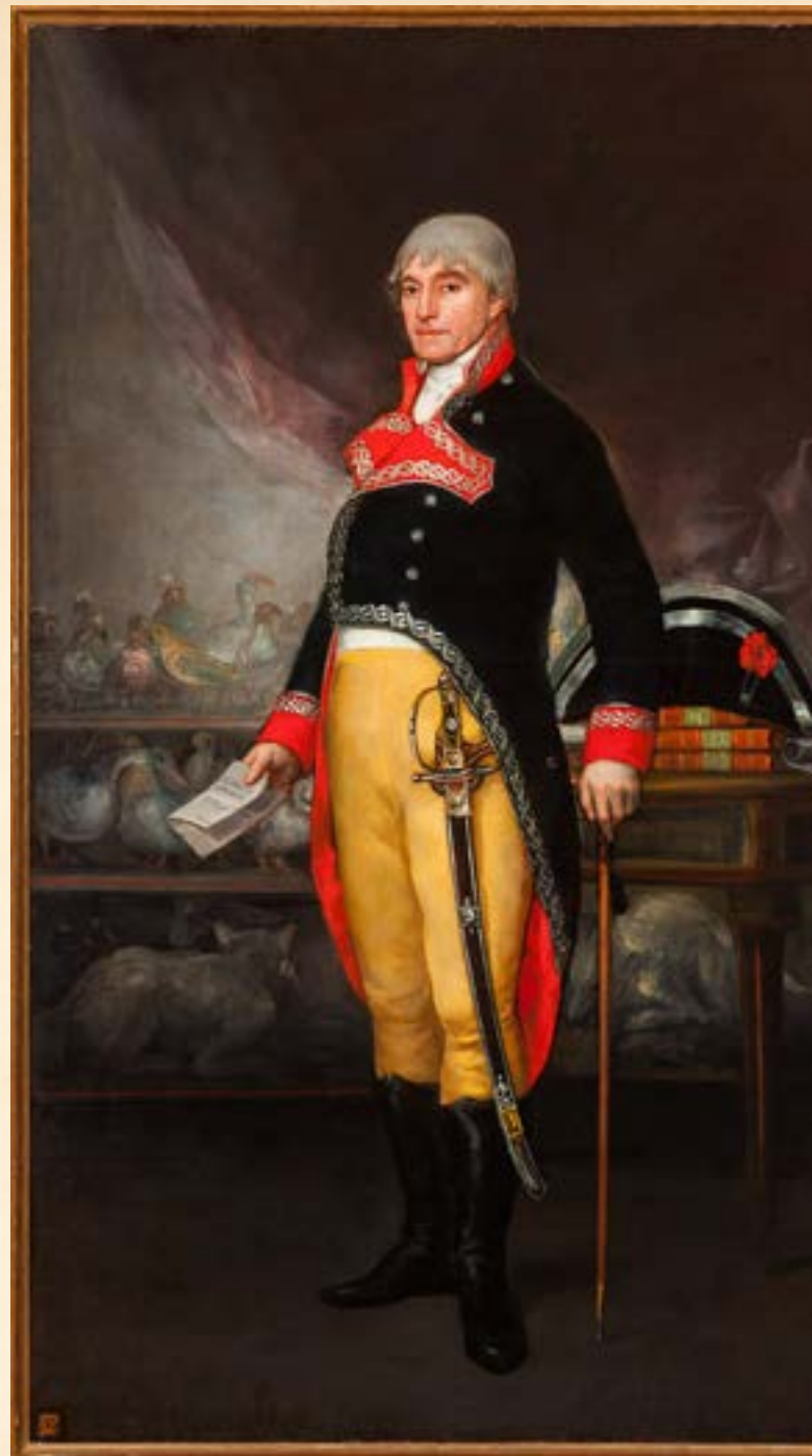
Félix de Azara, retratado por Francisco de Goya (1805)

Entre los avances que realizó, corrigió las clasificaciones de Buffon y se adelantó a las observaciones que indujeron a Darwin a elaborar sus teorías de El origen de las especies . Precisamente, constató que en la lista de Buffon faltaban algunas americanas y completó la enumeración. También aportó nuevas observaciones sobre el medio natural de los animales, así como reflexiones sobre el comportamiento de