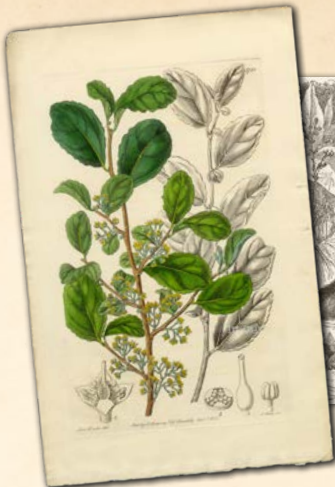
Varias especies reciben su nombre científico de Félix de Azara, como la Azara dentata (izquierda) o el Cerdocyon thous azarae (derecha)