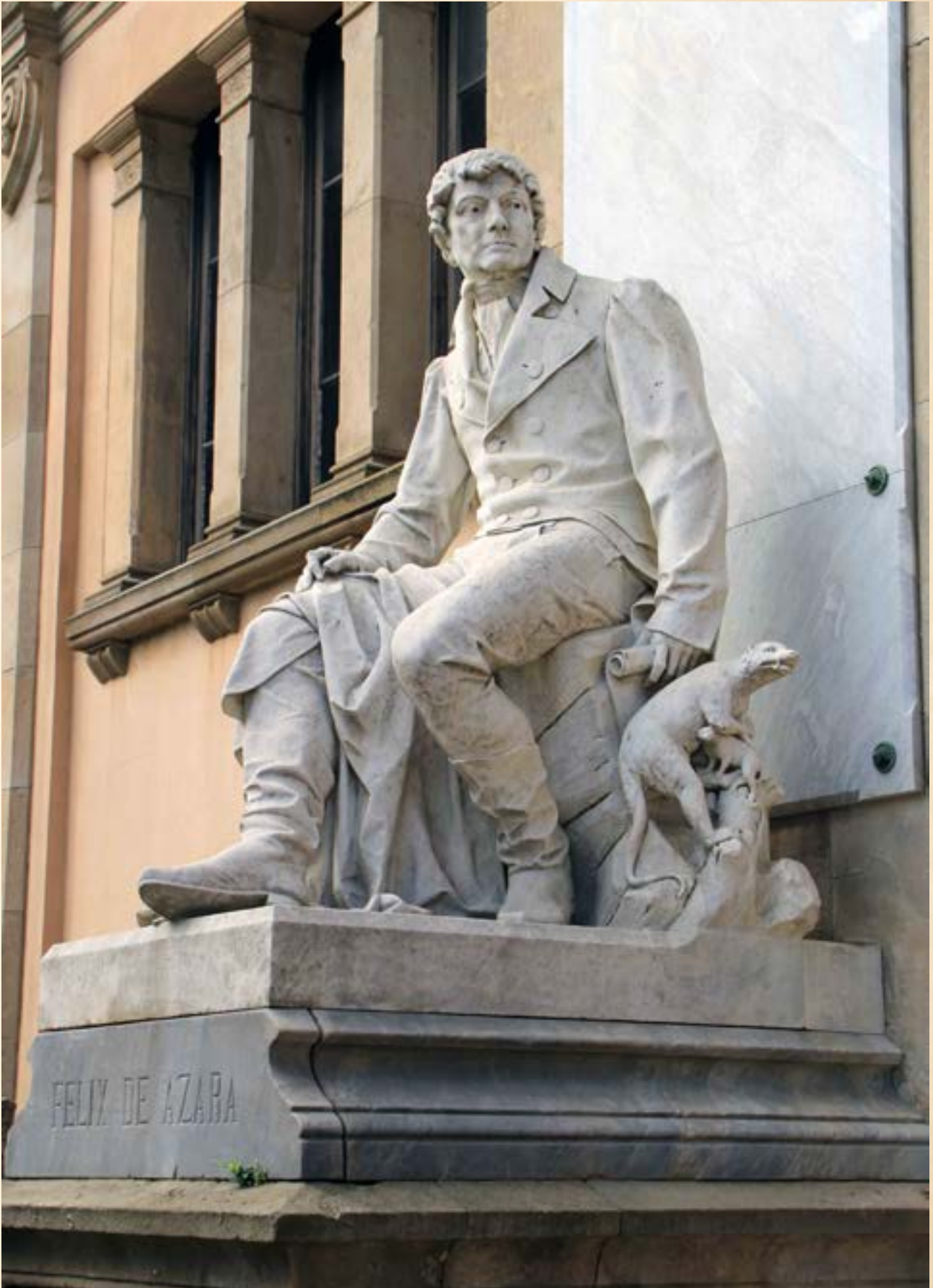
Una escultura en el Parque de la Ciudadela (Barcelona) recuerda al militar desde 1886