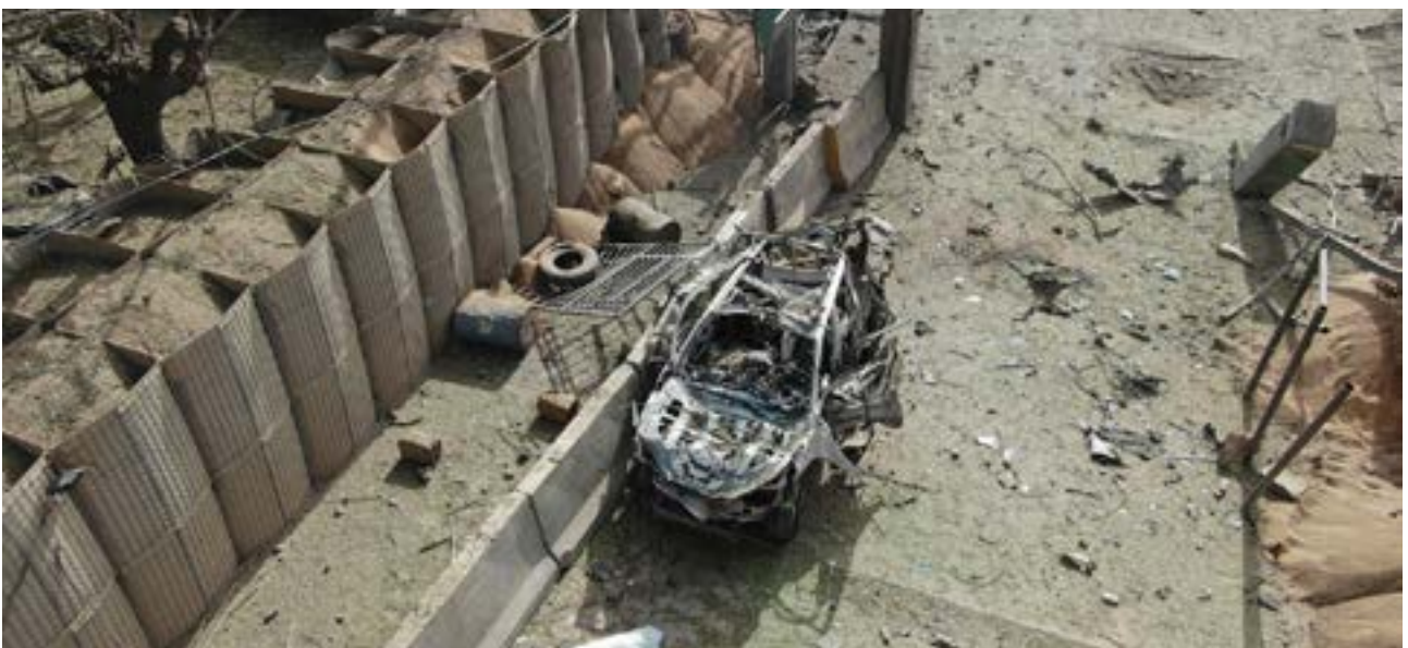
Estado en el que quedaron uno de los dos coches y la entrada del campamento tras la explosión

disparé. No podía dejarlo pasar», destaca. Entonces su compañero le avisó de que detrás venía un segundo vehículo, así que retrocedió para buscar mayor protección. Hoy es consciente de que eso le salvó la vida porque, de haberse quedado donde estaba, la explosión del segundo coche, cargado con 500 kilos de explosivo, le hubiese dado de lleno. «La metralla cayó a mi alrededor pero sin rozarme. Solo me comí la tierra que levantó la explosión», se felicita. A pesar de lo que acababa de ocurrir, el soldado permaneció en su puesto, cubierto de polvo, apuntando su arma hacia la entrada. Lo último que pensó en aquellos momentos es que su actuación y la de su compañero aquel día les iba a valer la concesión de “una roja”. Ellos solo sienten que hicieron su trabajo, como los dos suboficiales que recibieron la Cruz con distintivo azul, o los dos cuadros de mando que estaban de servicio aquel día, la de distintivo blanco.