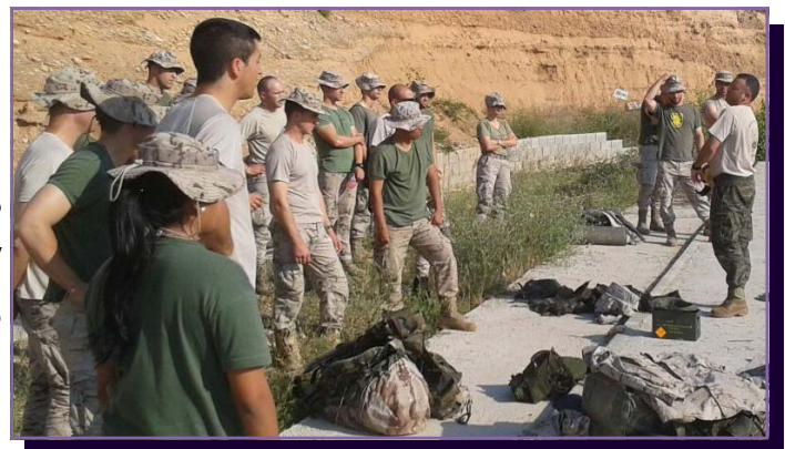
CSA,s de la patrulla 13 atendiendo a una explicación sobre homogeneización de fusil Hk

Los SA,s perfeccionan su habilidad para homogeneizar nuestro fusil HK G36E para posteriores enseñanzas a sus subordinados. Tales ejercicios se realizaron en los campos de tiro de la A.G.B.S. y estuvieron a cargo y supervisados por la ACLOG, quienes impartieron sus nociones a los futuros SA,s