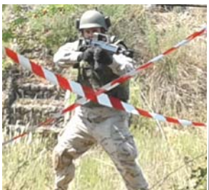
SA en plena acción de ataque en ZZUU