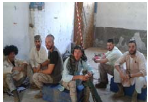
Componentes del grupo de insurgentes de ZZUU