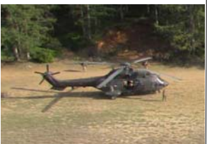
Helicóptero realiza maniobra de aterrizaje en zona balizada