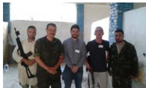
Representantes de los ayuntamientos de Talarn y Tremp posan con el Coronel y dos SA,s