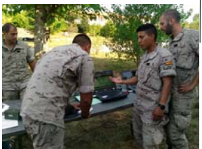
SA,s de Transmisiones enseñan a la White Cell sus equipos