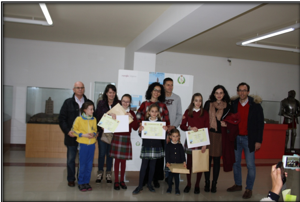
Familiares con los premiados