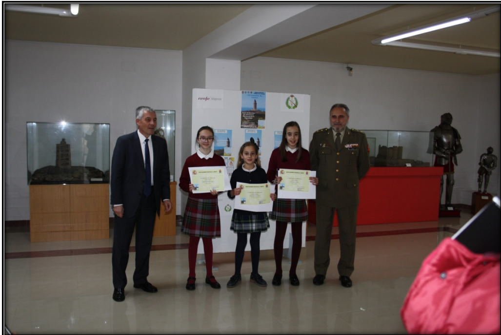
Premiados, director del Museo y Gerente de Renfe