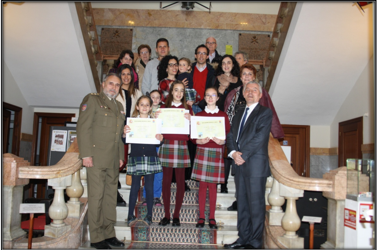
Grupo de premiados y familiares en la escalera del Museo