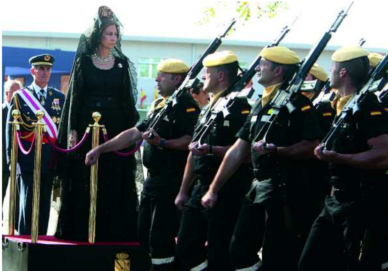
Doña Sofía amadrinó la entrega del Estandarte a la UME

A lo largo de 2009 han sido muchas las ocasiones en las que la Familia Real ha querido estar cerca del Ejército. Los ejemplos son variados y van desde el Día de las Fuerzas Armadas (que recogemos en la página 7 de este resumen) hasta ejercicios conjuntos o combinados (en la página siguiente), además de los distintos actos que aparecen a continuación.