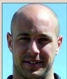
PEPE REINA JUGADOR DE LA SELECCIÓN

«¡Yo llevo el Ejército metido en la sangre! Y mi padre, además de ser piloto, también practicaba esgrima, como una disciplina más del pentatlón aeronáutico».