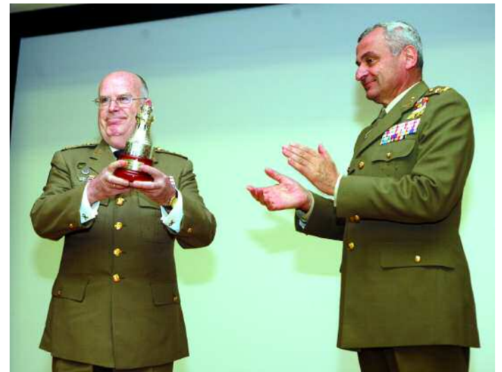
El ex JEME recibió el premio Zarco del Valle

Por supuesto, los Reyes presidieron, el 6 de enero, la celebración de la Pascua Militar en Madrid; junto a los Príncipes de Asturias recibieron a las máximas autoridades civiles y militares del Estado en la plaza de la Armería del Palacio Real. Esta festividad data de 1782 y fue instituida por Carlos III (nº 168).