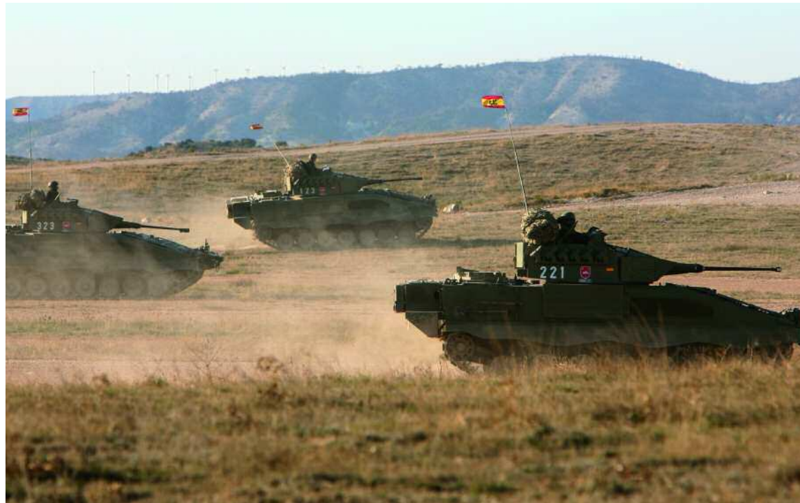
En noviembre se evaluó al Batallón "Covadonga" I/31

También durante este semestre estuvo activada la Agrupación de Apoyo Logístico nº 21 —con refuerzos de otras unidades de la Fuerza Logística Operativa— como Unidad de Apoyo Logístico de la FCRR; en