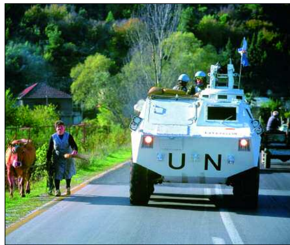
Luis Rico / DECEI

ral de la ONU, Ban Ki Moon, y la ministra de Defensa, Carme Chacón, concedida a 23 militares españoles fallecidos en operaciones bajo bandera de las Naciones Unidas; 21 de ellos eran del Ejército de Tierra y murieron