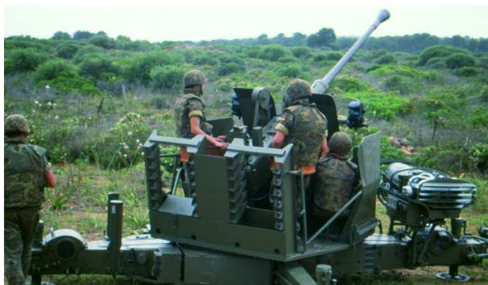
La Unidad de Artillería Antiaérea de Baleares se ha integrado en el RAAA nº 81

El Grupo "Regulares de Ceuta" nº 54 llevó a cabo en marzo el ejercicio "Kaddur I" en el campo de maniobras y tiro "Álvarez de Sotomayor" (Almería) para completar y perfeccionar su instrucción y adiestramiento en operaciones convencionales y de control de zona (nº 170).