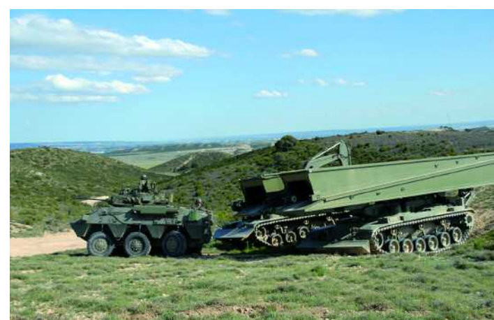
El Mando de Ingenieros se adiestró con la BRILEG

El Grupo Táctico Valenzuela, sobre la base de la VII Bandera de la Legión, se adiestró en "San Gregorio" (Zaragoza) entre abril y mayo; los 1.200 militares que componían el Grupo también procedían de la Comandancia General de Baleares, de la Brigada de Infantería Ligera "San Marcial", de los Mandos de Artillería Antiaérea e Ingenieros, así como de las Fuerzas Aero-móviles del Ejército de Tierra. En la misma fecha, pero en el campo de maniobras "Álvarez de Sotomayor", la Bandera "Ortiz de Zárate", III de Paracaidistas planeó en inglés y en tiempo real el ejercicio "Lance principal"; también hubo apoyo de Artillería y Zapadores (nº 172).