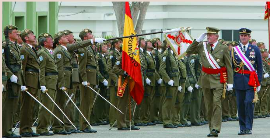
El Rey presidió el acto principal del quinto centenario del "Soria"

Tres unidades de Caballería han festejado aniversarios este año con diversas actividades: los Regimientos de Caballería Ligero Acorazado "España" nº 11, el Acorazado "Pavía" nº 4 y el Ligero Acorazado "Lusitania" nº 8. El primero celebró su 350º aniversario con un acto principal en marzo (nº 170); el segundo "sopló las 325 velas" el 12 de mayo (nº 172); y el tercero recordó su tercer centenario con una pa-