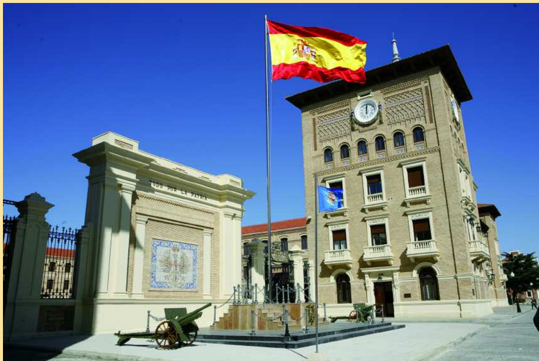
La Academia General Militar será el Centro Universitario de la Defensa del Ejército de Tierra

La Ley 39/2007, de 19 de noviembre, de la Carrera Militar ha generado, desde su publicación, una amplia normativa (reales decretos, ordenes ministeriales, instrucciones...) que desarrolla lo que se expresa en ella.