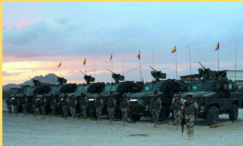
PIO QIN / DEGET

El Regimiento de Artillería de Campaña nº 63 fue el encargado de probar el Sistema Integrado de Artillería de Campaña II, la versión mejorada de los obuses de 155/52 mm. Tiene un sistema de navegación, control de fuego y puntería automática que proporciona la orientación de la pieza, y permite batir objetivos conociendo únicamente su ubicación. Su autonomía se ve incrementada por el nuevo vehículo tractor, con capacidad de remolque de 24 toneladas y posibilidad de transportar a toda la tripulación—de 6 a 8 personas— y 16 proyectiles de emergencia (nº 169). También el Regimiento mencionado fue el encargado de recibir el radar Arthur , con un alcance de hasta 40 kilómetros, y posibi-