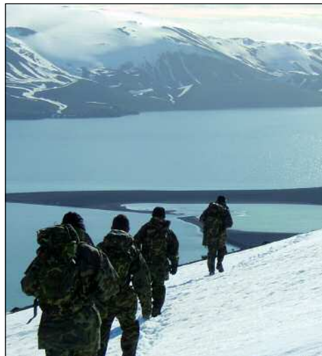
Base "Gabriel de Castilla"

A pesar de que las condiciones climatológicas de la Antártida no son favorables se amplió la capacidad de la base a 26-28 personas y se mejoraron las transmisiones (nº 172); todo ello cumpliendo unas exigentes normas me-