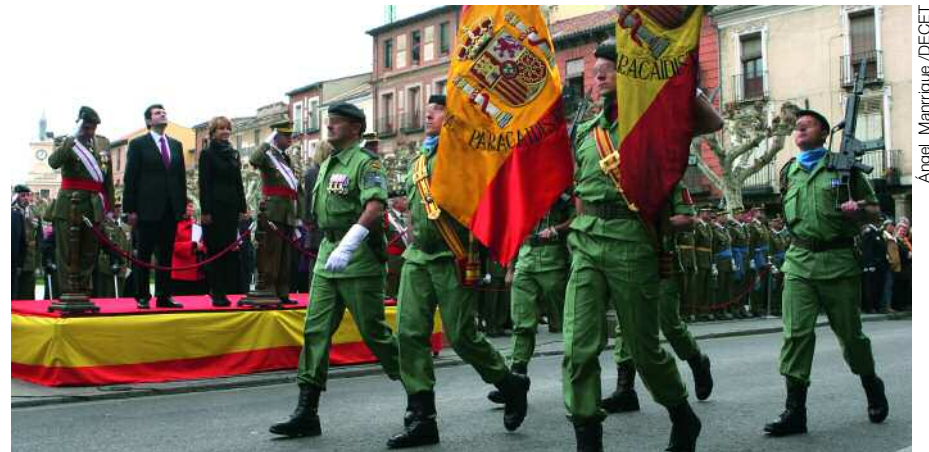
Ángel Manrique / DECET

El Ejército recibió, en junio, la medalla Defensor de Zaragoza, por los méritos contraídos, por su trayectoria ejemplar, observada en pro de los intereses morales y materiales de esta ciudad... El general Pinto, comandante militar de Zaragoza y Teruel, fue el encargado de recoger el galardón que entregó el Museo Provincial de la capital aragonesa después del acto de homenaje a los héroes de los sitios (nº 173).