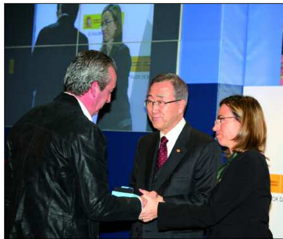
Ban Ki Moon y Carme Chacón entregan las medallas de la ONU; los primeros blindados desplegando en Bosnia

En 2009 se cumplieron dos décadas de la participación del Ejército de Tierra en misiones internacionales. El Boletín Informativo Tierra quiso sumarse a estas celebraciones colocando en su cabecera el logo-