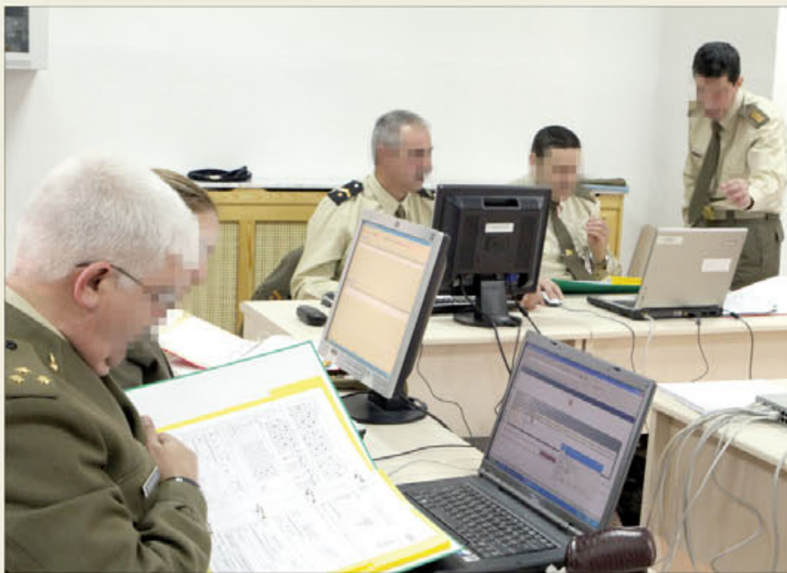
Las juntas de evaluación revisan todas las alegaciones presentadas por los interesados

Seis juntas permanentes, nombradas al efecto, son las encargadas de realizar las evalua-