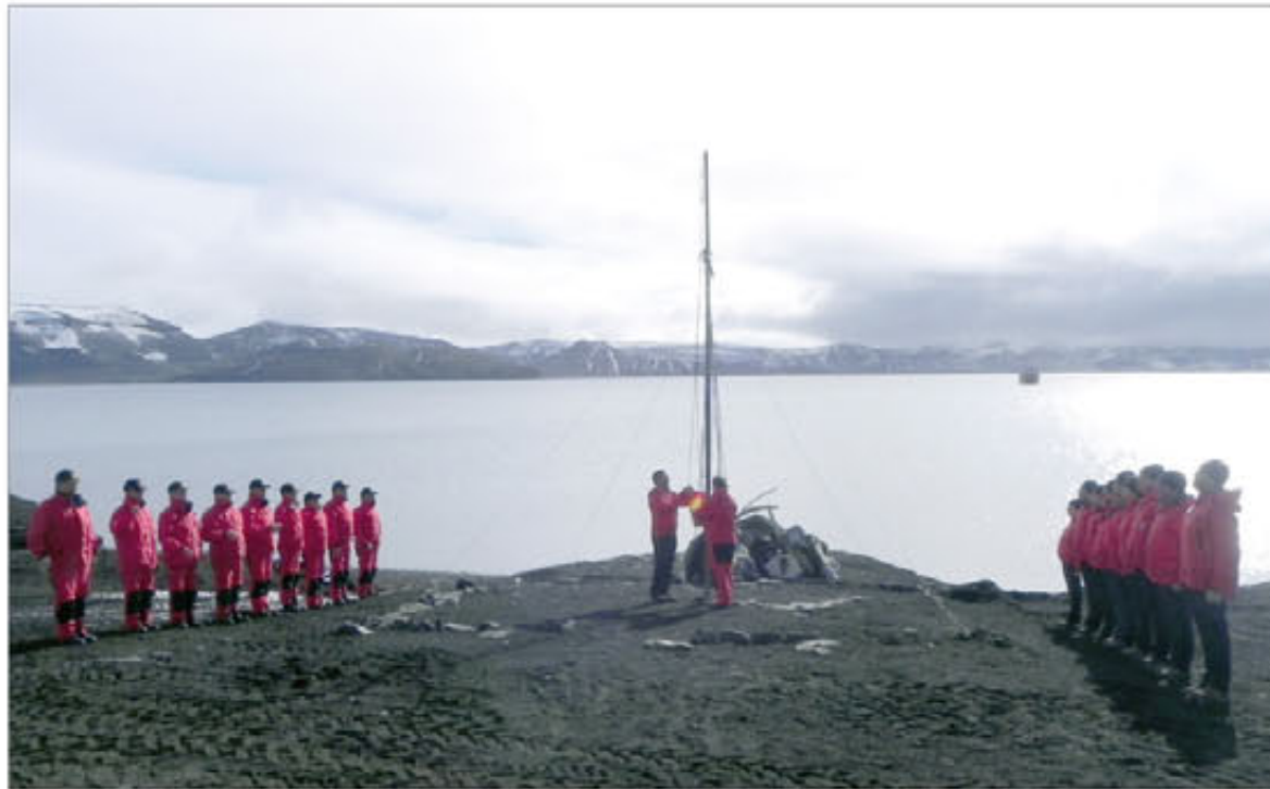
Arriado de la Bandera Nacional en la base "Gabriel de Castilla", antes de abandonar la isla

Pero el ánimo de los que se marchan no es nostálgico, vuelven a casa, junto a los suyos, con el orgullo de la misión cumplida. Durante esta campaña se han realizado grandes mejoras en la infraestructura y en la maquinaria de la base; múltiples apoyos de movimientos, tanto por mar como a pie, para la toma de muestras y datos; se han confeccionado deliciosos menús; y se ha contado con un magnífico sistema de comunicaciones que les ha facilitado enormemente el trabajo. Este sistema les ha permitido estar más cerca de sus familiares, en el plano personal, y, en el profesional, divulgar su labor a una treintena de colegios, institutos, universidades y otras instituciones. Y satisfechos como estaban con este logro, han decidido pre-