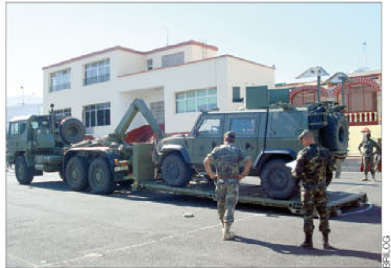
Un equipo de recuperación de vehículos en acción

Evaluación de la logística Por su parte, los evaluadores de la ULOG —compuesta por personal