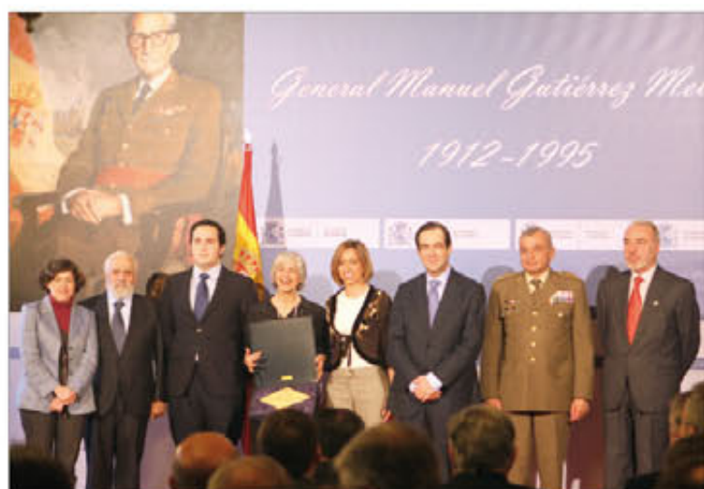
La familia recibió una placa igual a la que se colocará en su domicilio

La celebración fue un reconocimiento al papel clave que jugó el capitán general en aquellos momentos y a su trayectoria como militar y político, que fue recordada por su biógrafo oficial, el coronel Puell de la Villa. Entre sus hitos, recordó que encabezó la delegación que negoció el primer tratado de colaboración militar con Estados