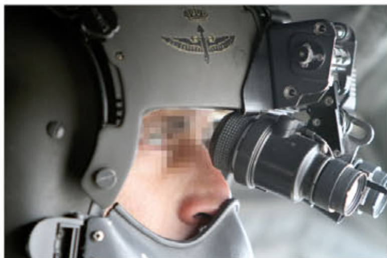
Los tiradores se mantienen alerta ante cualquier amenaza

Se trata de un trabajo en equipo donde todos cuentan, y que hace que los vínculos se estrechen, situando al BHELTRA V en el lugar que quiere ocupar: detrás de nadie —su lema—, pero sí al lado y al servicio de las unidades terrestres.