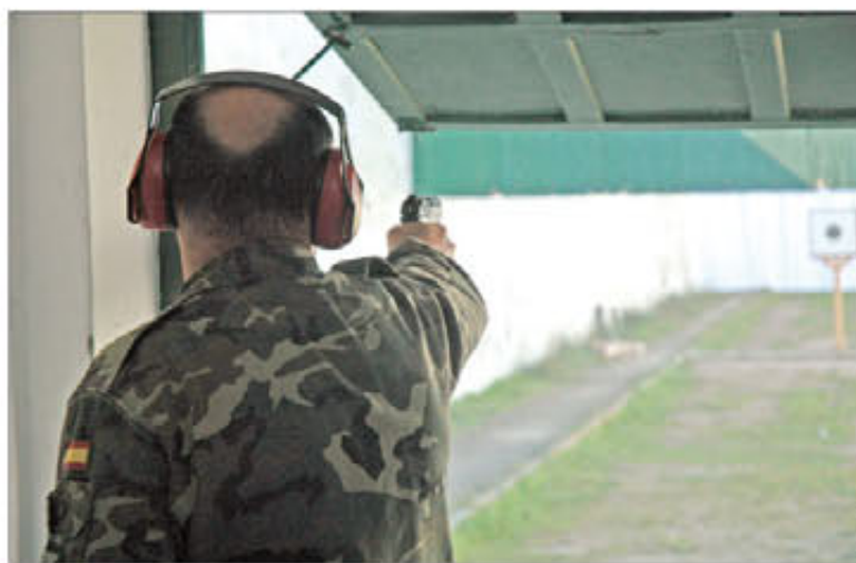
Los participantes tiraron con pistola reglamentaria de 9 mm.