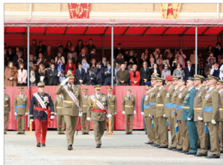
Don Felipe quiso estar junto a sus compañeros de la XLV Promoción

Una reproducción de la citada placa le fue entregada a la hija mayor del capitán general en el homenaje, que se completará a lo largo de 2012 —año del centenario de su nacimiento—, con la organización de diversas actividades para acercar esta figura a los ciudadanos (⇒ intranet 23/02/2011).