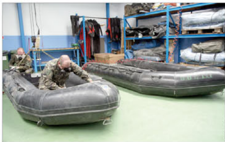
Trabajar con materiales sofisticados exige una alta especialización