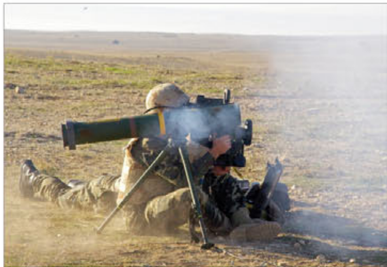
El Spike pertenece a la última generación de misiles contracarro