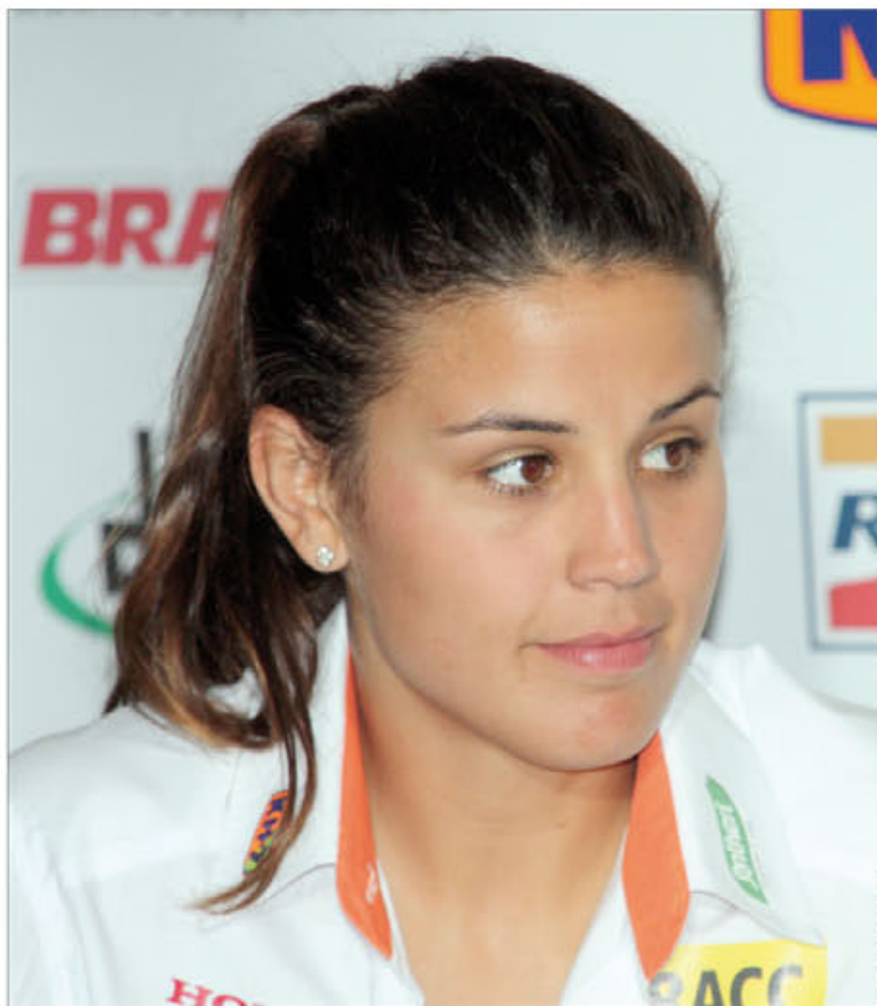
La barcelonesa Laia Sanz ha ganado el Dakar con sólo 25 años

Este rally va más allá de una carrera deportiva, te cambia en lo personal. Por las vivencias que tienes, por lo que sientes, ha sido la experiencia más bestia de mi vida, dura pero bonita. Aprendes a superar los