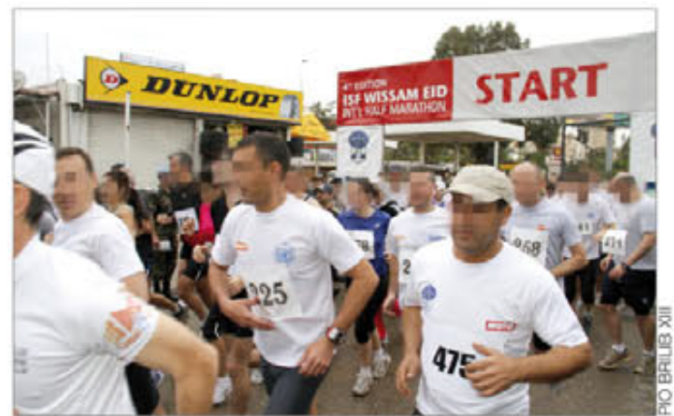
La carrera se desarrolló por las calles de la capital libanesa

B. G. / Madrid ratón Ciudad de Beirut, celebrada el 27 de febrero.