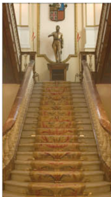
Escalera con la estatua de Palafox

La Capitanía General de Aragón fue creada por el rey Felipe V en 1711, durante la Guerra de Sucesión. Al quedar abolidos los fueros mediante los Decretos de Nueva Planta, se instituyó la figura del capitán general, que disfrutaba de amplias competencias sobre las más variadas materias,