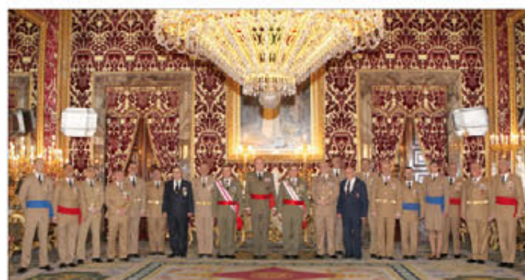
La comisión de Regulares estuvo integrada por 20 personas

tanto civiles como militares. La Capitanía General de Aragón existió durante 275 años, y su nombre y su recuerdo perviven aún hoy entre los aragoneses.