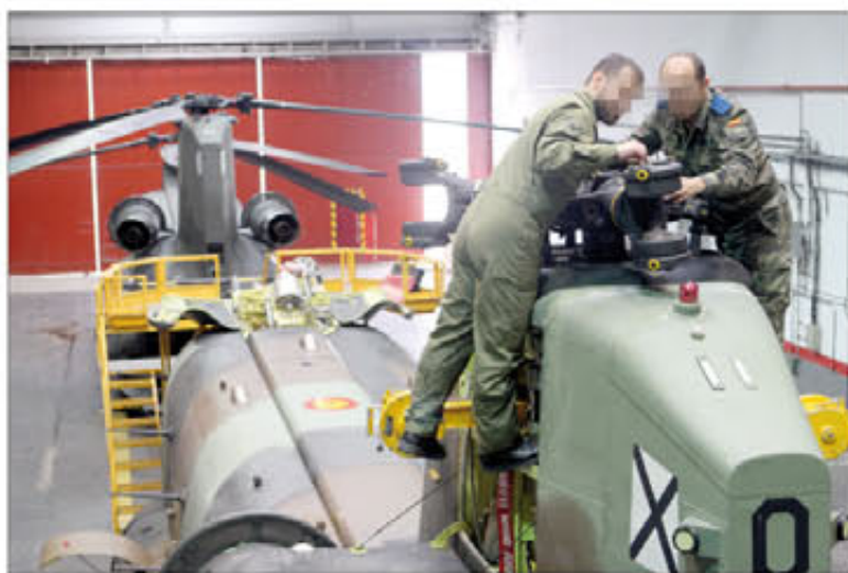
El mantenimiento exige muchas horas de dedicación

Las cargas externas son una maniobra que requiere destreza y conocimiento del procedimiento, y en la que el piloto necesita nuevamente de las indicaciones de la tripulación para elevar el aparato en el momento preciso. Asimismo, es importante que el personal de tierra sepa cómo debe actuar, porque la fuerza del aire que desaloja un helicóptero de esas proporciones