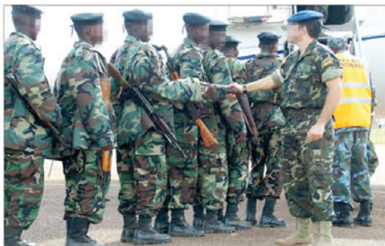
Los militares entrenados volvieron a Mogadiscio en febrero

En su discurso, el coronel señaló que la misión «favorece el enfoque global de la UE, que une la seguridad al desarrollo, al estado de derecho, al respeto por los derechos humanos, la igualdad de género y el derecho internacional humanitario». También resaltó las consecuencias del trabajo de los condecorados: «la EUTM está dando a Europa una mayor visibilidad, no sólo en Uganda, sino en todo el este de África, donde nuestros esfuerzos son bien recibidos y apreciados».