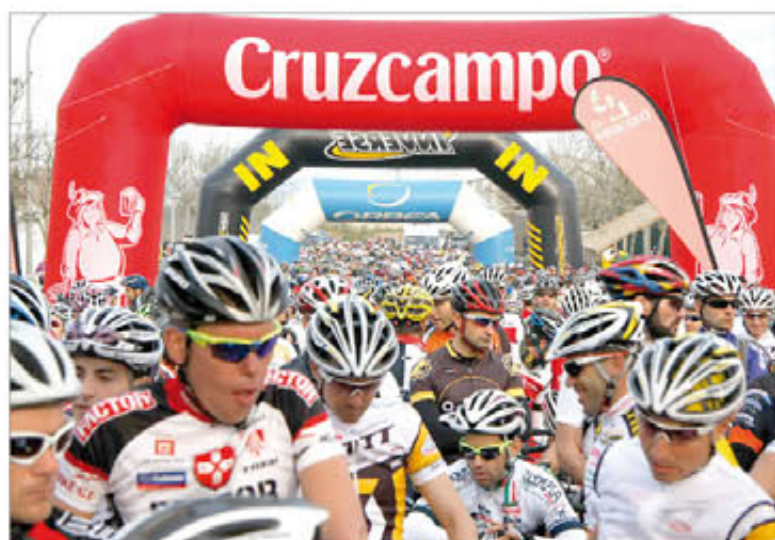
Esta prueba es la más larga y exigente de la competición

No obstante, el protagonismo de la Brigada de Infantería Mecani-