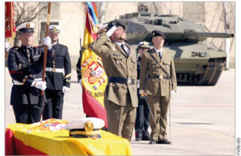
El Ejército y la Armada honraron juntos a sus compañeros