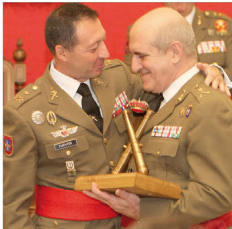
El general Rivera recibió el premio de manos del jefe del MADOC

Por su parte, el general Rivera recordó su temprana vocación militar y la transformación que el Ejército de Tierra ha experimentado en los años durante los que él ha prestado servicio en su «querida Artillería».