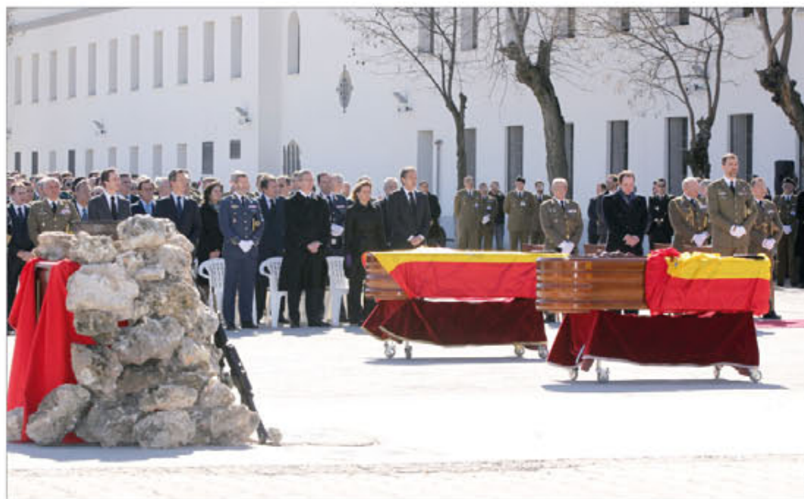
Las autoridades, encabezadas por don Felipe, acompañaron a los familiares de los cinco desactivadores

También acudieron a la base "El Goloso" el presidente del Gobierno, José Luis Rodríguez Zapatero, la ministra de Defensa, Carme Chacón, el JEMAD, general del