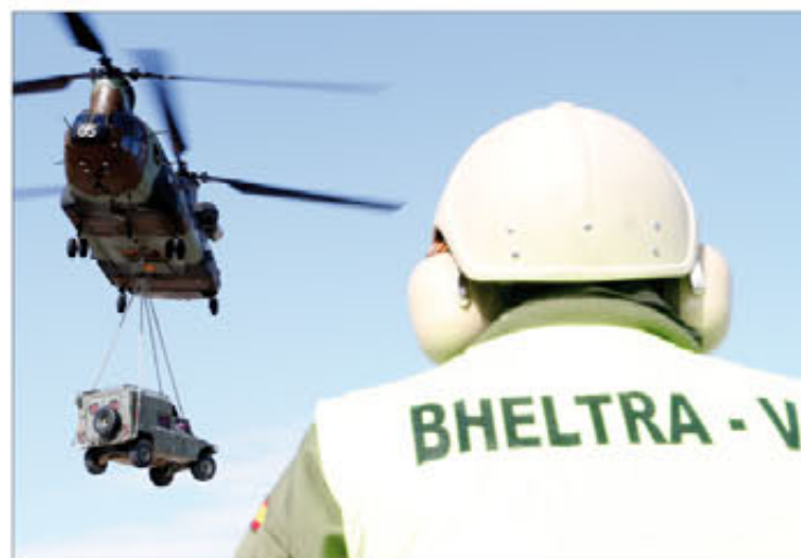
El Chinook puede transportar un vehículo en carga externa

El Batallón de Helicópteros de Transporte V, ubicado en Colmenar Viejo (Madrid), cuenta con helicópteros Chinook . Su papel en misiones, como la de Afganistán, ha ido cobrando protagonismo dado su enorme potencial para el transporte de material y tropas, que combina con unas excelentes condiciones de seguridad.