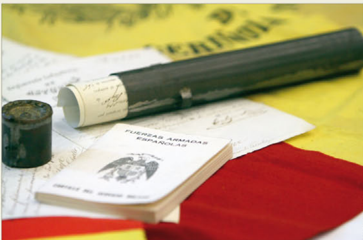
Los soldados al licenciarse recibían un documento —que se guardaba en una funda de metal— o una cartilla

Sin embargo, muchos de los elementos vinculados a este periodo de la vida de generaciones y generaciones de españoles han quedado en el imaginario colectivo, e incluso, en el lenguaje cotidiano. A quien en alguna ocasión le hayan acusado de no saber hacer la "o" con un canuto, quizá no sepa que dicha expresión hace referencia a la funda metálica de forma cilíndrica en la que se guardaba la licencia que recibían los que terminaban el servicio militar, y cuyo borde podía ser utilizado por los menos instruidos para firmar el documento. Asimismo, la costumbre de engalanar los balcones con