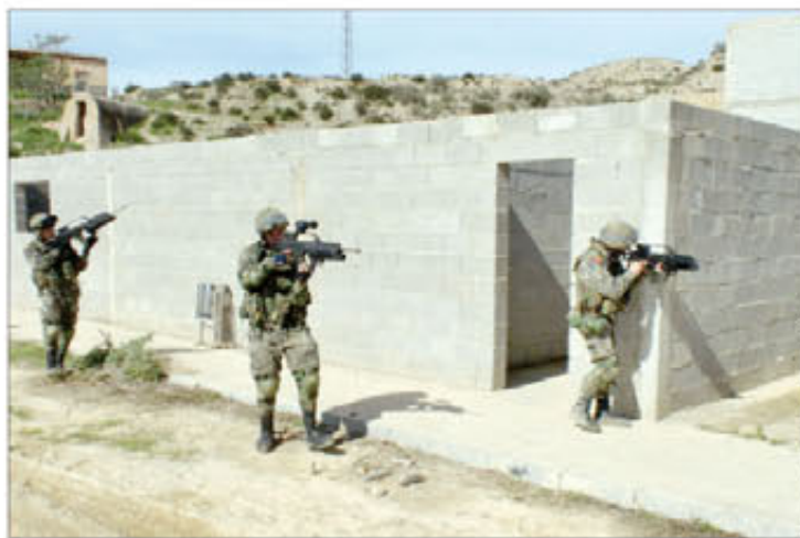
El supuesto táctico consistió en dar seguridad a una población

ficación obtenida es la PECAL 2120, requisitos exigidos por OTAN para garantizar la calidad en la producción. Lograrla les ha supuesto catalogar miles de artículos y elaborar normas técnicas y de funcionamiento. Todo el personal de este 4º Escalón ha realizado un importante esfuerzo, a lo largo de dos años, para homologar sus procedimientos de trabajo al Sistema de Gestión de Calidad.