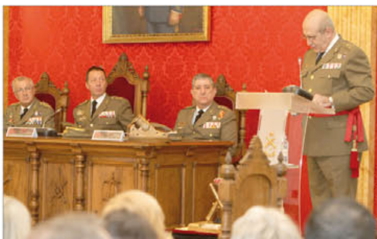
El galardonado repasó la evolución de la Artillería en los últimos años