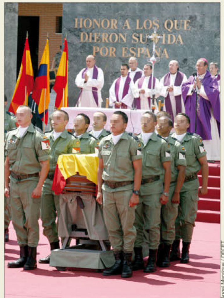
El fallecimiento en acto de servicio da derecho a pensión extraordinaria

Si el militar fallecido estuviese casado y no tuviese hijos, es la viuda la que debe hacer las gestiones y sería ella la que recibiría la pensión. En el caso de que hubiese hijos, serían éstos los beneficiarios y, por tanto, los que encabezasen la solicitud. Si no tuviese cónyuge ni hijos, la pensión podrían solicitarla los padres del fallecido. Aunque la gestión del Área de Pensiones militares puede determinar que