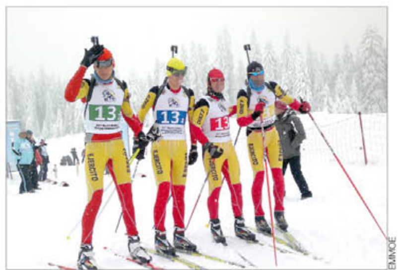
El equipo que nos representó en la prueba de Biatlón Patrullas

La odisea a la que se refiere el entrenador es el cúmulo de vicisitudes que tuvieron que soslayar hasta llegar a Sarajevo, dos días después de lo programado. Por eso, y para empezar, se perdieron la inauguración de los campeonatos. La responsable fue la niebla en el aeropuerto de Sarajevo, que impidió, por dos veces, que su avión aterrizara el día previsto y les obligó a hacer noche en Múnich. Al día siguiente, la ruta aérea fue Múnich-Zúrich, Zúrich-Zagreb, Zagreb-Sarajevo y lograron llegar al destino el día 22 por la noche. Pero su equipaje, incluidos los esquís, se despistó en alguno