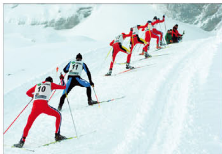
Momento de la prueba de Fondo Nórdico