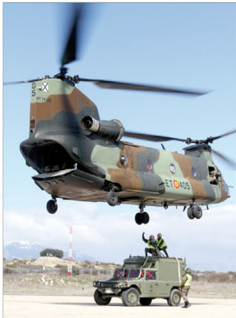
Personal de tierra a punto de enganchar una carga externa

La última rotación volvió a casa en diciembre y sus integrantes han superado las 1.500 horas de vuelo sobre el país asiático, una cifra nada desdeñable en el caso de un aparato como el Chinook , cuyo coste por hora de vuelo supera con mucho al de cualquier otro modelo de helicóptero. Los que partirán en febrero de 2012 seguirán sumando horas a esta cifra.