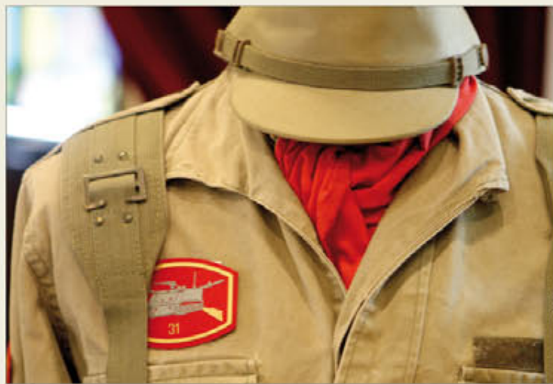
Uniforme reglamentario en 1960 del Regimiento "Asturias" nº 31

Después, ingresó en la Academia y se convirtió en militar de carrera. De eso hace ya 36 años, pero las vivencias de aquellos 22 meses le han acompañado toda la vida, como la foto de la mili que guarda en su cartera.