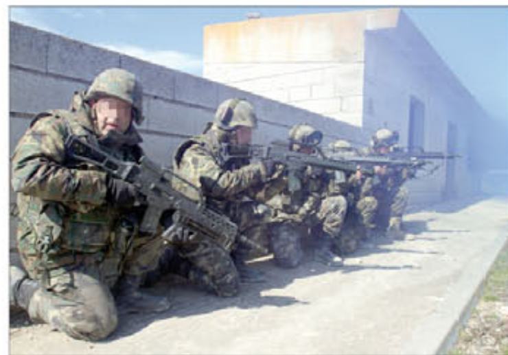
Prácticas de combate en zona urbanizada