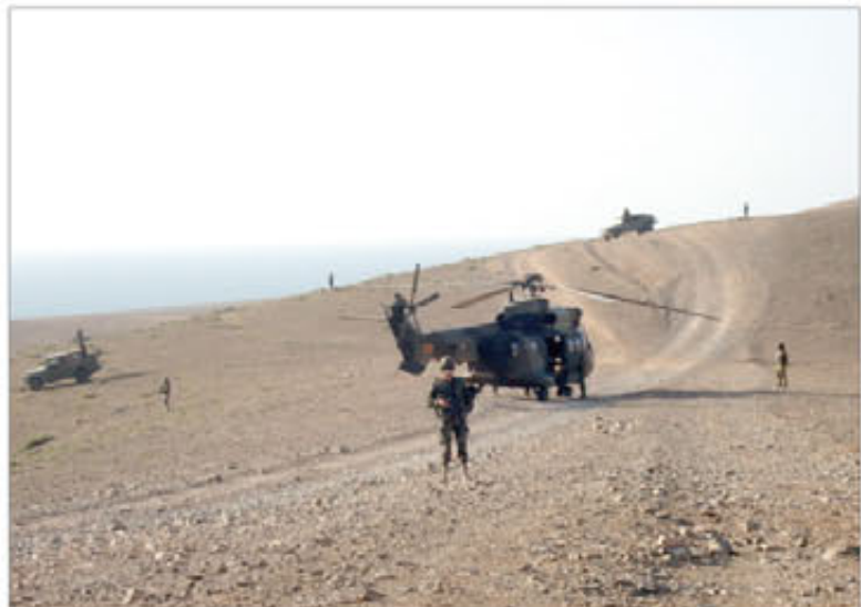
Componentes de la ASPFOR XXVIII dando seguridad a un helicóptero

de la Brigada y de la Agrupación de Apoyo Logístico nº 81— certificaron sus capacidades durante el ejercicio que se desarrolló, del 28 de febrero al 4 de marzo, a caballo entre Canarias y Zaragoza.