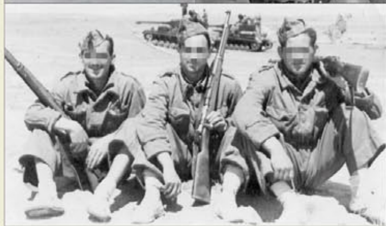
Imágenes para la historia de la milicia llenan los hogares de los españoles