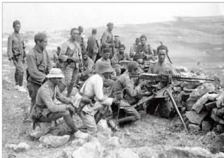
Compañía de ametralladoras cerca de Nador, en 1923

El coronel recordó el glorioso pasado de la unidad: «Todos nosotros, actuales componentes de este Grupo de Regulares, somos los afortunados custodios de este glorioso historial, que fue ganado en combate por nuestros antecesores en el puesto, soldados de Regulares que, como hoy, españoles o extranjeros, codo con codo, sirvieron juntos bajo una única Bandera, la Bandera de España».