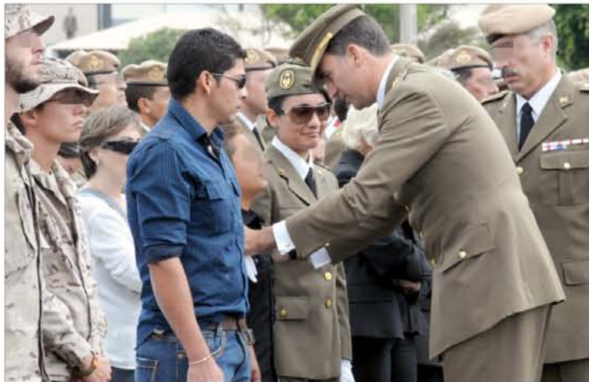
La presencia y palabras de afecto del Príncipe buscaron reconfortar a los familiares de los fallecidos

La ministra de Defensa, Carme Chacón, y el Jefe de Estado Mayor de la Defensa, general del aire Rodríguez —que viajaron a Afganistán tras el suceso para conocer los detalles de lo ocurrido y acompañar la repatriación de los cuerpos—, estuvieron entre las autoridades presentes en el patio central