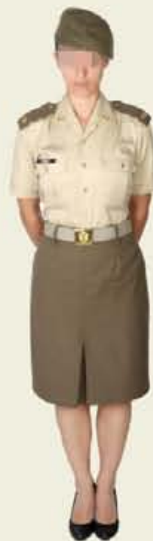
Diario y Trabajo, modalidad C