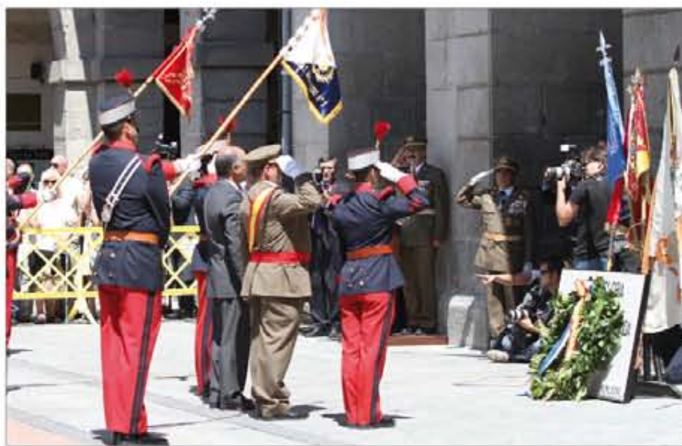
Homenaje a los que dieron su vida por España y las cuatro Enseñas que desfilaron