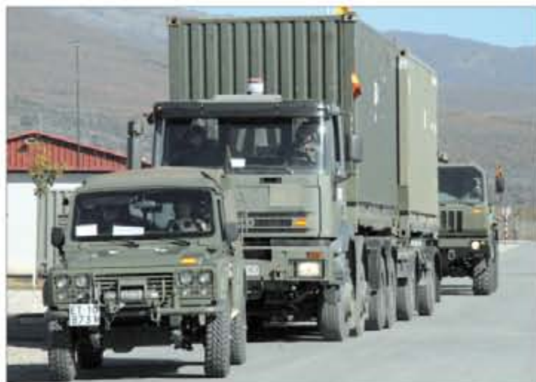
Las unidades logísticas llevarán la munición allí donde se necesite

De este modo, las unidades ya no tendrán que disponer de medios de transporte propios para este fin, sino que las unidades logísticas se encargarán de ello. Para lograr una mayor eficiencia en este sentido, en el lugar donde se realice el abastecimiento se producirá un intercambio de contenedores llenos por contenedores vacíos, o de plataformas llenas por plataformas vacías.