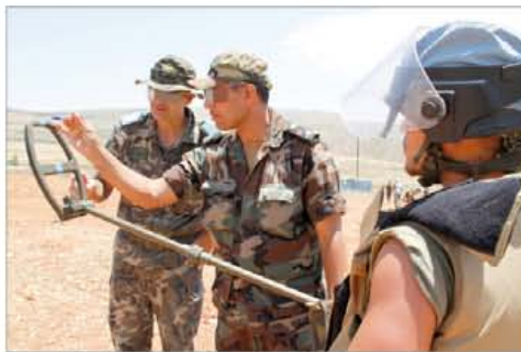
Uno de los evaluadores examina un detector de metales