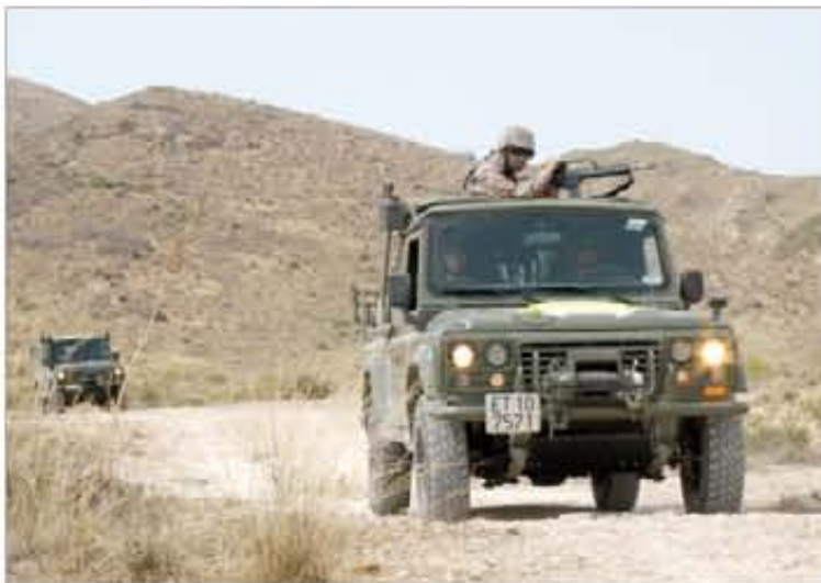
El OMLT de Grupo Logístico lo compone personal del RAAA nº 73

Para verificar que se encuentran listos para afrontar el reto, tuvieron que superar un ejercicio