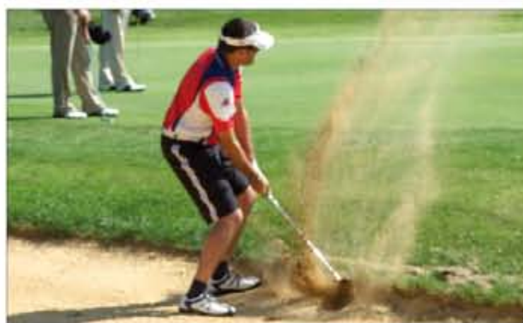
El campeonato se disputó en el campo de La Sella, en Alicante

En el campeonato tomaron parte, además del Ejército de Tierra, el Ejército del Aire, la Armada y la Guardia Civil; esta última obtuvo muy buenas clasificaciones.