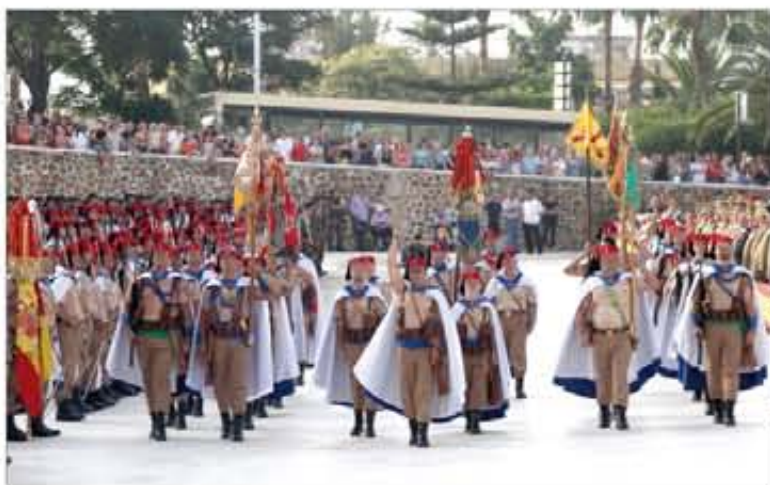
Numerosas personas asistieron al acto que se realizó en Ceuta

Hemos conocido al triatleta gallego, que nos comenta sus impresiones sobre el Campeonato de Europa de Triatlón, disputado en Pontevedra. Pág. 14