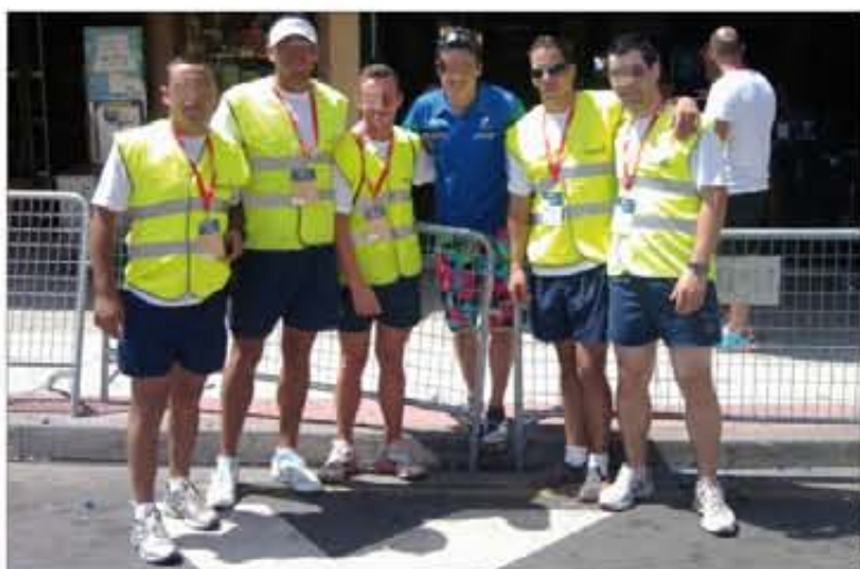
Los voluntarios ayudaron al control del tráfico rodado y peatonal

salto de exhibición en el que participaron algunos veteranos que aún mantienen la aptitud y practican en la vida civil. Una exhibición de artes marciales, una gran parrillada, los chiringuitos de unidad y actuaciones musicales completaron esta gran fiesta de "viejos amigos".