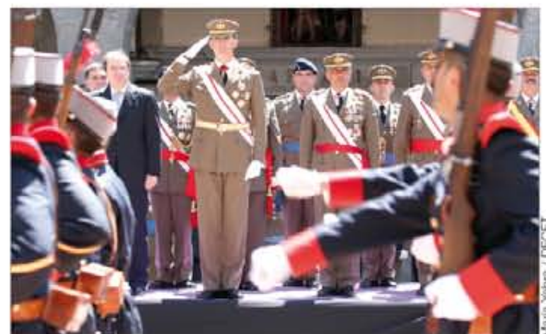
El Príncipe presidió la parada e inauguró el nuevo Museo del Cuerpo

Junto a la formación —compuesta por personal del Regimiento de Infantería "Inmemorial del Rey" nº 1—, estuvieron