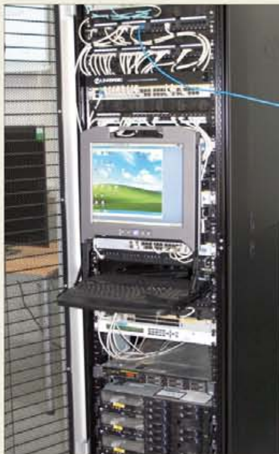
Rack de servidores en zona de operaciones

A pesar del cambio, el sistema de Mensajería Sin Clasificar del Ejército de Tierra (MESINCET), que funciona sobre Lotus, seguirá haciéndolo. Se ha diseñado una pasarela que permite el intercambio de mensajería oficial entre el Sistema de Mensajería oficial de Defensa (SIMENDEF) y MESINCET, ambos instalados sobre plataforma Lotus Notes. Durante un tiempo, esta pasarela permitirá que ambos sistemas convivan, hasta que definitivamente SIMENDEF y todas las aplicaciones instaladas en los servidores IBM-Lotus Notes migren al entorno Exchange, lo que durará unos cuatro años