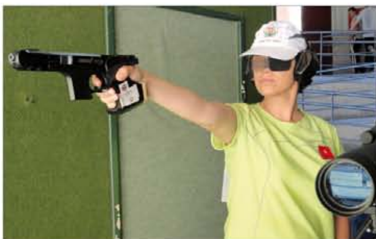
La comandante Navarro fue una de las representantes del Ejército