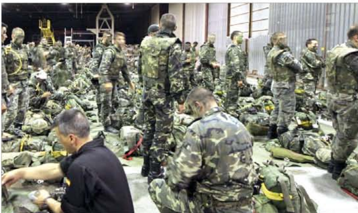
El escalón de asalto se equipa en Zaragoza para embarcar y proceder al lanzamiento

Desde la Base Aérea de la capital aragonesa partieron los aviones con el personal encargado de llevar a cabo la operación. También a este punto debían regresar con los evacuados antes de que