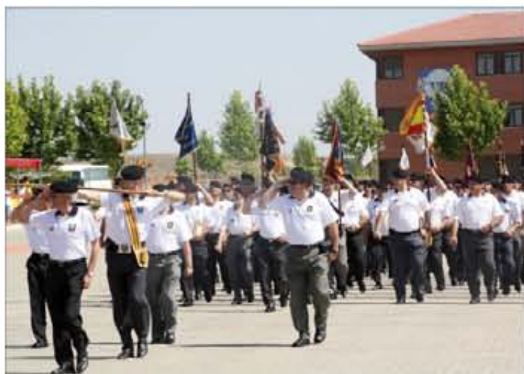
Tres compañías de veteranos formaron en el acto central

El acto central del encuentro tuvo lugar el domingo 26 de junio y estuvo presidido por el teniente general Villanueva, jefe del Mando de Apoyo Logístico del Ejército. En él formaron tres compañías de veteranos, en el centro de la formación, arropadas por las compañías paracaidistas. En este acto se entregaron diversas condecoraciones, distinciones y premios, concedidos por la BRIPAC y por la Federa-