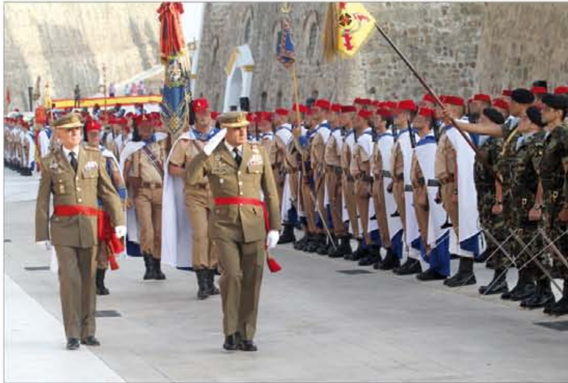
El JEME pasó revista a la formación en las Murallas Reales de Ceuta (arriba). En Melilla, el presidente autonómico impuso la Medalla de Oro de la Ciudad Autónoma a la Bandera del Grupo de Regulares nº 52 (derecha)

Este acto, presidido también por el JEME, contó con la asistencia de las principales autoridades civiles y militares de la ciudad autónoma, encabezadas por su pre-