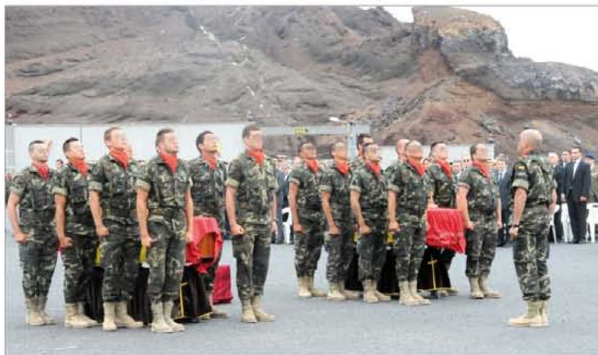
Compañeros de los fallecidos portaron los féretros con los restos mortales del sargento y la soldado