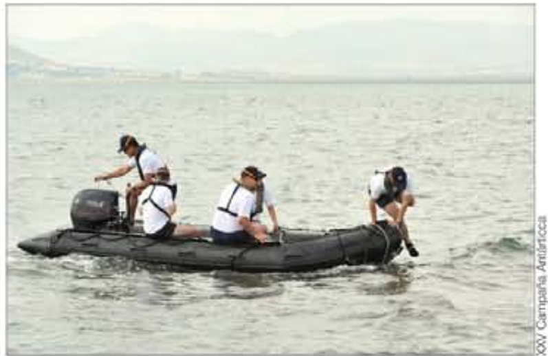
El desembarco en playa fue una de las prácticas de navegación