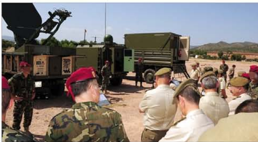
Visita de los concurrentes a una de las exposiciones realizadas durante el seminario

El seminario estuvo estructurado en una fase de conferencias divulgativas y en otra de grupos de trabajo. Dentro de las ponencias destacó la relativa a la situación actual de la enseñanza de formación y perfeccionamiento en la Especialidad Fundamental de Transmisiones, por lo crítico de un adecuado sistema de enseñanza que permita responder a los retos tecnológicos. También se habló sobre el Plan de Modernización de los Sistemas de Mando, Control y Comunicaciones (MC3), así como sobre el Sistema de Mando y Control del Ejército de Tierra (SIMACET), el Sistema de Seguimiento de Fuerzas Propias (FFT) y el BMS ( Battlefield Management System ), entre otras cuestiones de interés.