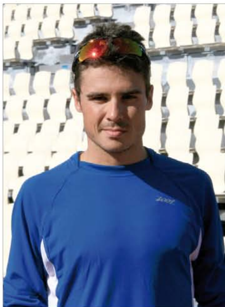
Gómez Noya fue campeón del Mundo de Triatlón en 2010

La carrera de los Juegos es una carrera diferente a todas las demás. A nivel deportivo, una vez que tomas la salida, es lo mismo de siempre: corres con la misma