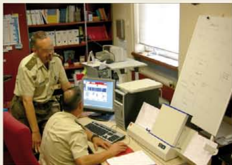
La lectora óptica informatiza las respuestas obtenidas

El Plan de Encuestas Internas del ET 2011-2014 traslada al mando las opiniones de los subordinados sobre su profesión