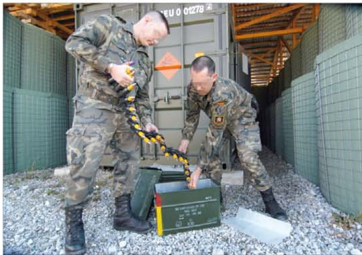
Las personas que trabajan con municiones y explosivos deben estar especialmente instruidas

Las unidades expresan al CGD sus necesidades de manera informática, a través del Sistema de Gestión Logística del Ejército (SIGLE). Mediante este sistema,