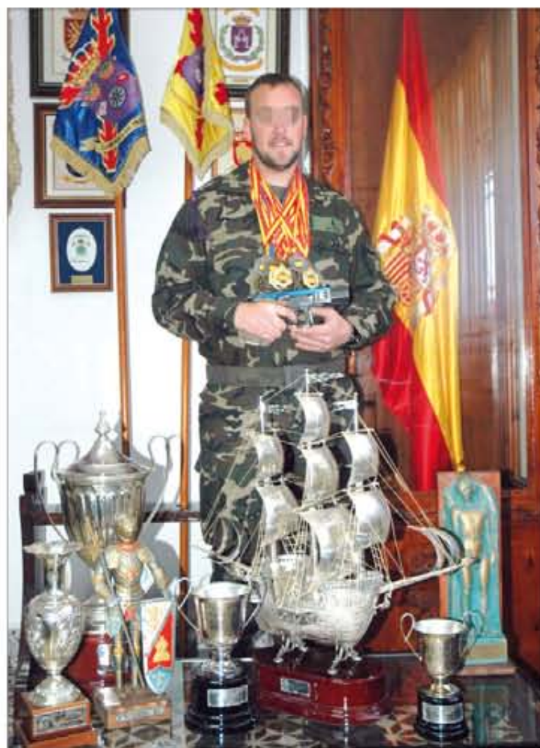
A pesar de su juventud, se ha hecho un hueco en la Selección de Tiro

En la modalidad de pistola velocidad se tira a una distancia de 25 metros. El objetivo es obtener la mayor puntuación en un determi-