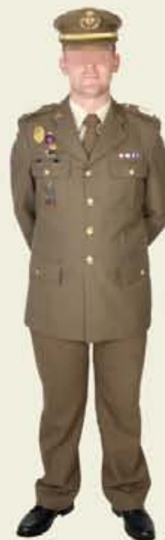
Diario, modalidades A y B