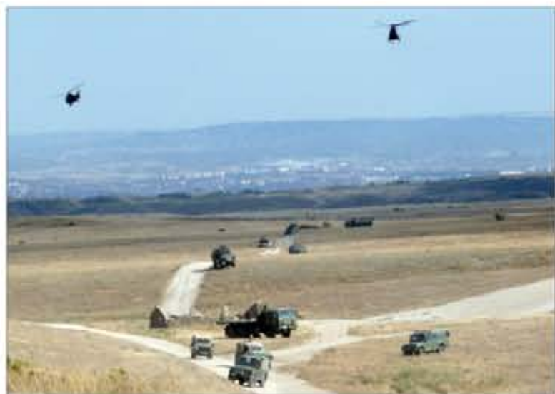
Las incidencias planteadas simulan las de zona de operaciones

La unidad de apoyo real estaba compuesta por unas 70 personas de las Agrupaciones de Apoyo Logístico (AALOG) nº 61 y nº 41, de la JTM y de la BRIL V. Ellos se encargaron de preparar más de 4.000 raciones de alimentos, de repartir más de 80.000 litros de agua, de llenar los depósitos de los vehículos con más de 95.000 litros de gasoil, de proveer de munición, del transporte y del mantenimiento de los vehículos.